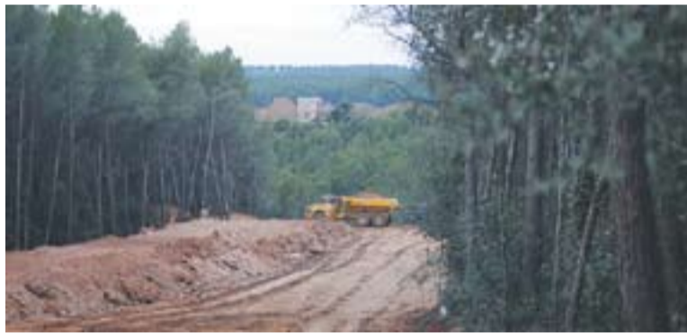
Les obres als terrenys per on passarà el gasoducte.