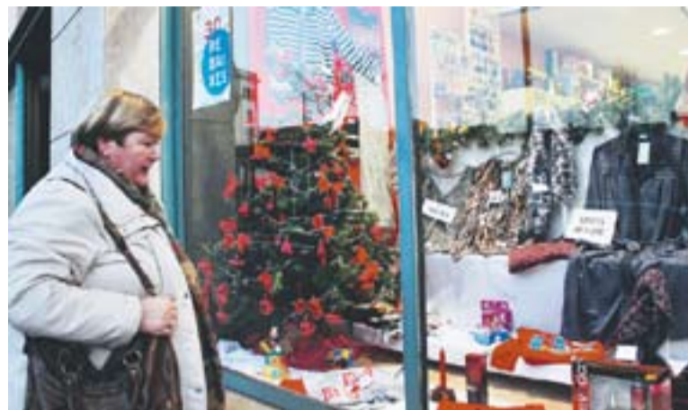
D’esquerra a dreta, la sabateria Rodana, la merceria El Botonet i la botiga de roba Moníssim.