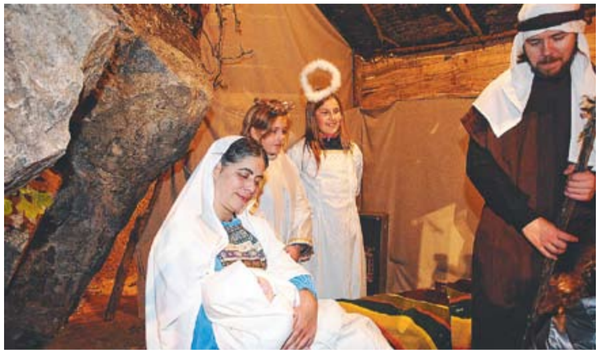
⊕ Escena del Naixement al pessebre vivent de Sant Feliu del Racó. || JOSEP GRAELLS

L'entorn és ple d'indrets idonis per convertir-se en decorats naturals per a un pessebre: el massís de la Mola i la Vall del Ripoll, el riu i els seus ponts, les masies, aquest històric poble i la seva església. Tots ells són aspectes inspiradors del pessebre. No oblidem que els seus orígens romànics daten del segle X. +