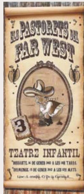
© Cartell promocional. || AAVV EL RACÓ

Una obra feta, sobretot, per a riure i passar-ho bé. Les entrades es poden adquirir a info@associacioveinselraco.cat o bé a l'Ermita, al carrer de la Carena, 6, de Sant Feliu del Racó. L'aforament és limitat. +