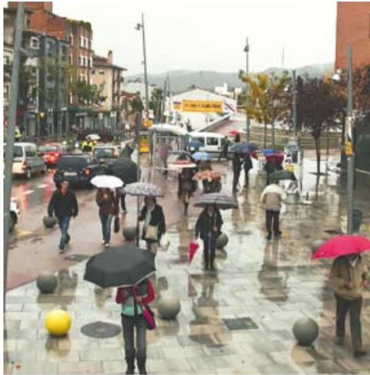
Novembre va ser un dels mesos més plujosos de l'any.

Pel que fa les precipitacions, i com en el cas de les temperatures, no s'han batut rècords però la mitjana de pluja ha estat elevada. El 2011 han caigut a Castellar del Vallès 744,8 l/m 2 . “Ha estat un any amb períodes de pluja escassa però amb episodis de pluja molt abundants” , explica Moré. El meteoròleg assegura que el clima de la zona és “molt irregular” en matèria de precipitacions però que “entra en els paràmetres habituals” . “El novembre del 2011 ha estat el novembre més plujós de les darreres dues dècades i el de-