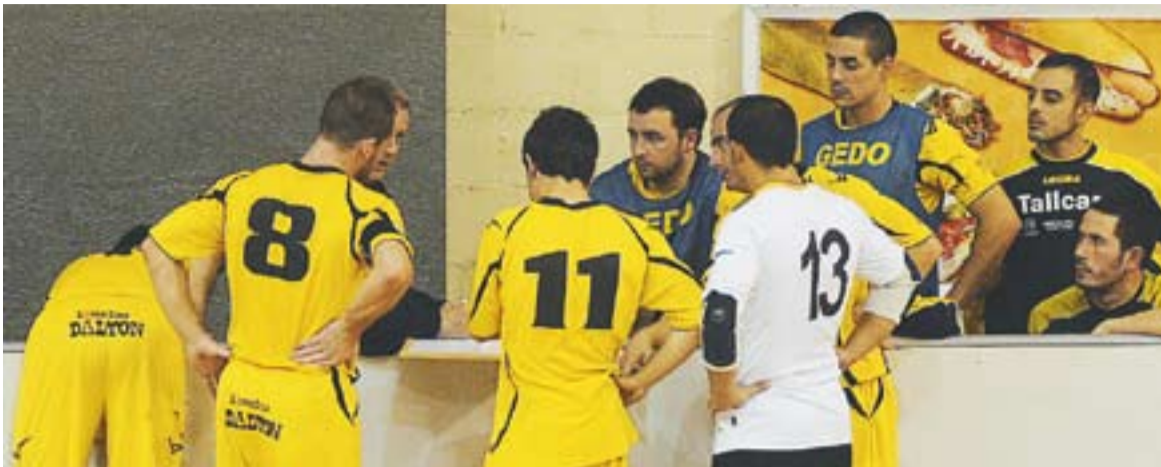
Els jugadors de l'Athlètic hauran de trobar una nova data per jugar els minuts que falten.