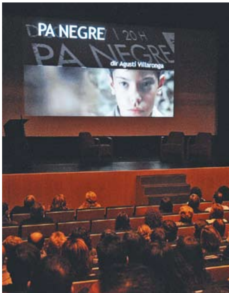
Projecció de 'Pa negre' d'Agustí Villaronga a l'Auditori Municipal.

Pel que fa a les característiques de les pel·lícules, en destaca un variat repertori de nacionalitats. Una quarta part dels títols han estat produccions catalanes, una xifra que arriba al 35% si es compten també els títols es-