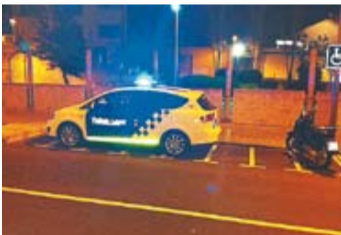
Pàrquing de motos... Autor: Marc Santandreu

Envia'ns fotos de Castellà fetes amb el mòbil: lactual@castellarvalles.cat