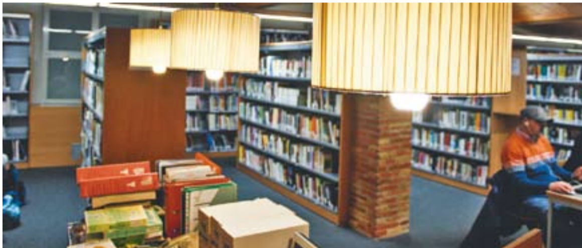
La biblioteca, dimecres passat, és un dels equipaments on s'ha estalviat en despesa elèctrica.

La reducció s'explica per la disminució del consum i la reducció de tarifes