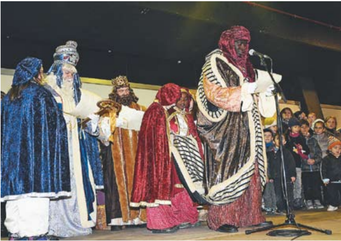
REIS | CAVALCADA