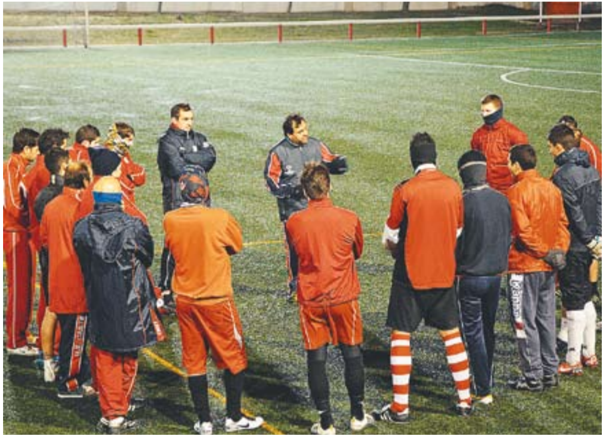
Els jugadors de la Unió Esportiva Castellar en un entrenament d'entre setmana.