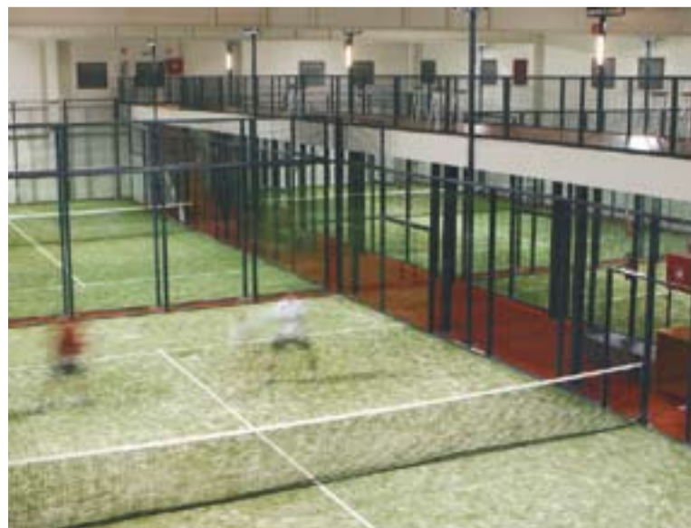
© Les instal·lacions del Matchball Pàdel al Pla de la Bruguera. || MB PÀDEL

Les instal·lacions del Matchball Pàdel estan situades al polígon del Pla de la Bruguera i disposa de quatre pistes cobertes amb serveis de cafeteria panoràmica, botiga esportiva i sala de fitness. També ofereix classes particulars de pàdel o bé en grup. †