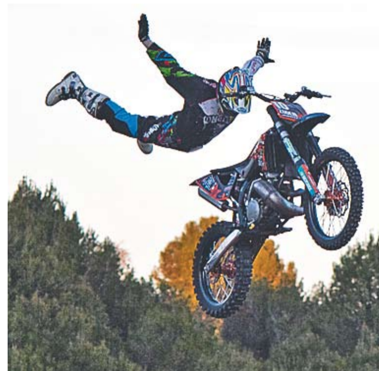
Un dels espectaculars salts que es van veure dissabte.

Als castellarencs Humet i Cots encara els resta l'última part de la seva aventura, aproximadament uns 2.000 quilòmetres, els que van des de Copiapó fins a Santiago de Xile. †