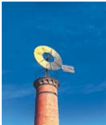
Molí Autor: Jonàs Ribó