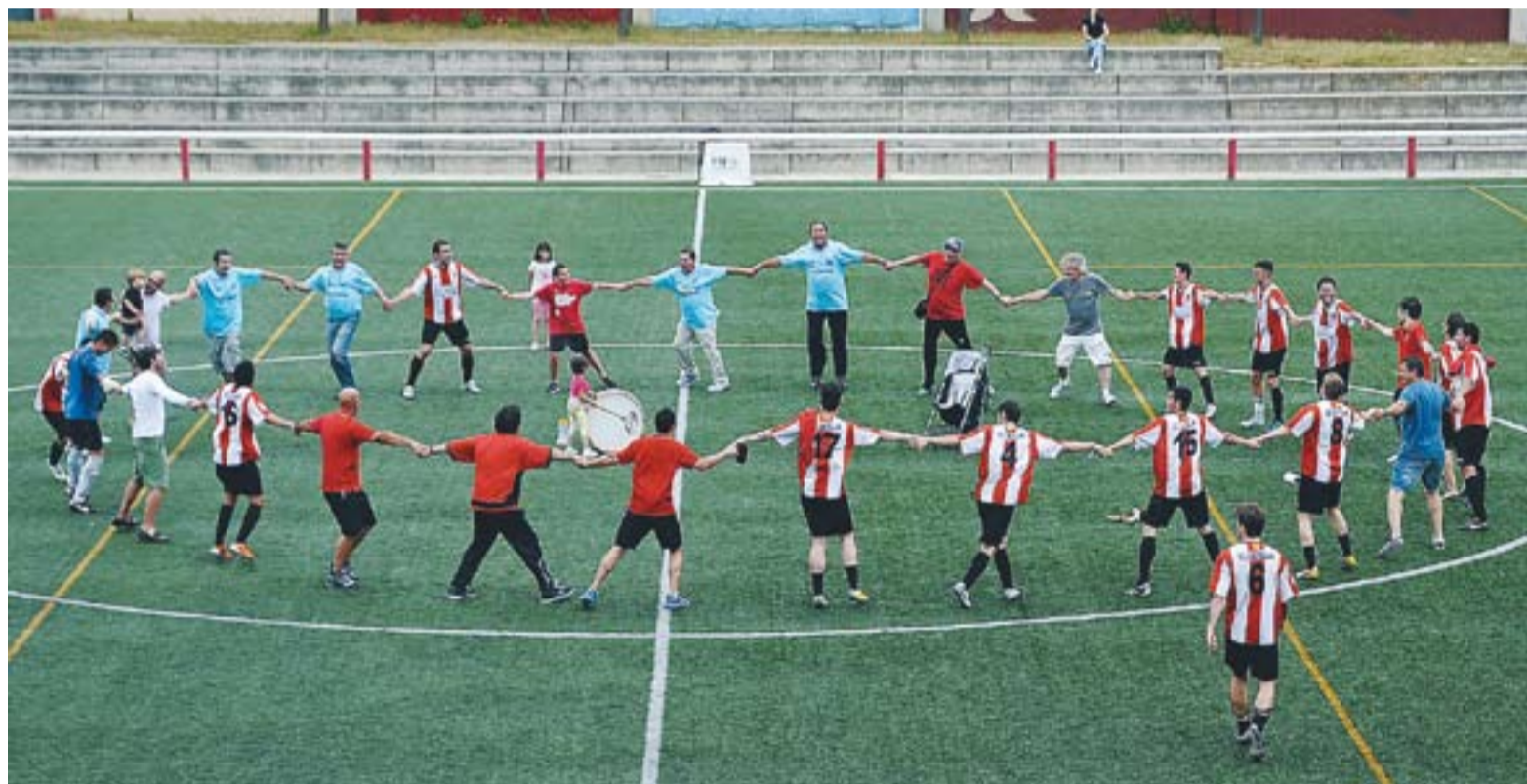
Celebració de l'equip al centre del camp de jugadors i tècnics i d'alguns aficionats després de guanyar el Puig-reig.

A la represa, el desgast físic de la primera part es va reflectir en un descens del ritme del partit. La Unió Esportiva va intentar dur el ritme del partit, però els rivals, que buscaven l'empat, van in-