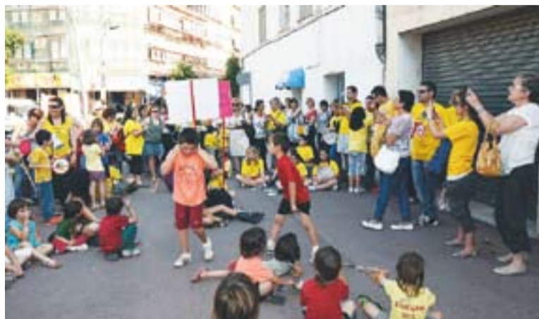
Cassolada a la plaça del Mercat dimarts passat.

Durant poc més de mitja hora, a banda de fer sonar cassolles, tambors, xiulets, i exhibir pancartes contra les retallades, s'ha llegit un manifest per reivindicar l'estat del benestar, i el dret dels ciutadans a viure, aprendre i tre-