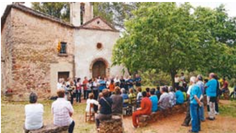
☉ Aplec del CEC a Les Arenes.

Diumenge dia 3 de juny es va celebrar el XIII Aplec del Centre Excursionista de Castellar a Les Arenes. Les activitats van començar a les 10 hores amb una missa de l'ermita. A les 13 hores es va poder gaudir d'un concert de la Coral Xiribec. Cap a les 14 h es va fer un dinar de germanor i l'entrega de plaques commemoratives als socis que ja fa 25 anys que ho són del centre. També es van entregar les medalles Memorial Simeó Caba als socis de 50 anys. També hi va haver parlaments i moments emotius com pertoca a aquests aplecs del Centre. || M. A. +