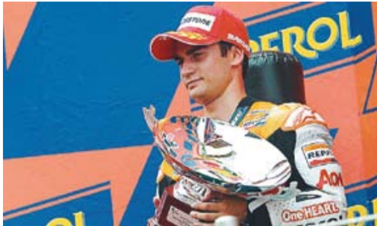
© Pedrosa, aixecant una copa al final de la cursa en què va quedar segon

Dani Pedrosa va liderar inicialment la carrera després d'una fulminant sortida des de la segona fila de la graella. Darrere del barceloní es van situar Lorenzo, el duo del Monster Yamaha Tech 3 Andrea Dovizioso i Cal Crutchlow i Ben Spies, tot i que el texà del Yamaha Factory Racing va caure a terra quan intentava assaltar el cap de carrera. Casey Stoner, que va començar des de la pole per segona vegada aquest any, va perdre una mica de terreny en aquests primers compassos i se'l va veure sense la seva força habitual. La cursa es va convertir ben aviat en un mà a mà entre els dos