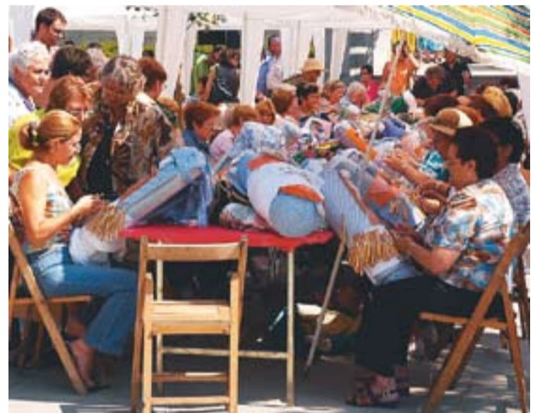
© Trobada de puntaires en una edició al carrer de Sala de Boadella. || J. GRAELLS

L'Escola Nocturna, per a celebrar els 70 anys, també té previst realitzar, a finals de setembre o principis d'octubre, una exposició a El Mirador amb els treballs que s'han anat fent a l'Escola i que servirà per a fer la presentació dels cursos de l'any vinent. A la presentació també hi haurà pica-pica per a fer més llúida la festa. +