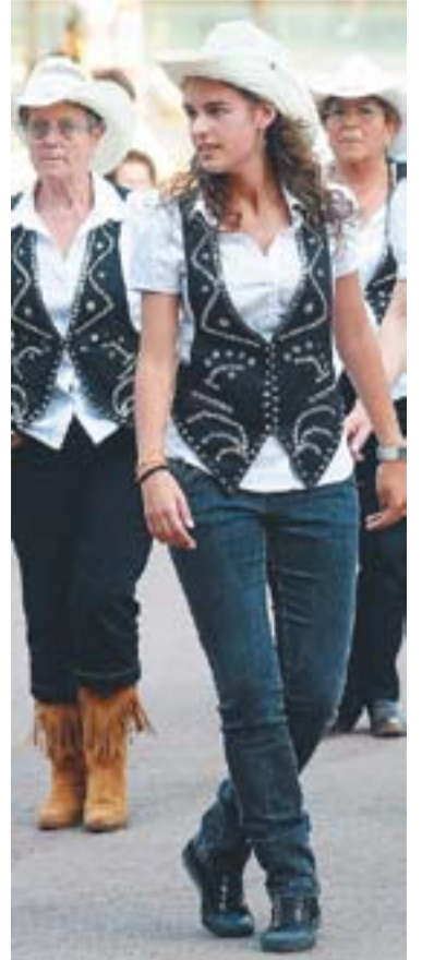
☉ Tango, flamenc, ball de bastons o country són algunes especialitats de dansa que es van poder veure a la trobada de danses, dissabte passat.