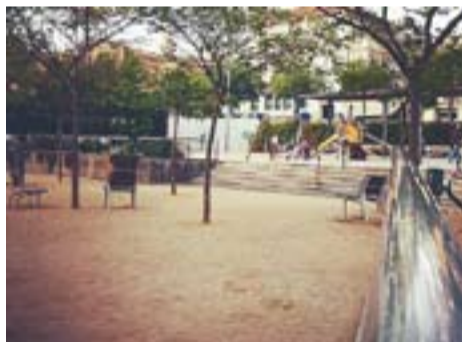
Plaça Calissó Autor: Abril López