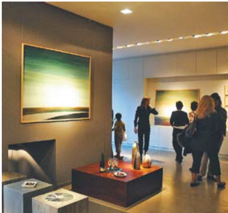
© Galeria d'art Aguilart, una de les galeries castellarenques obertes. || J. GRAELLS

A les 23 hores del mateix dissabte es realitzarà el sorteig d'un quadre d'Enric Aguilart emmarcat per Santi Art. D'altra banda, les exposicions que es podran veure durant el recorregut són les de