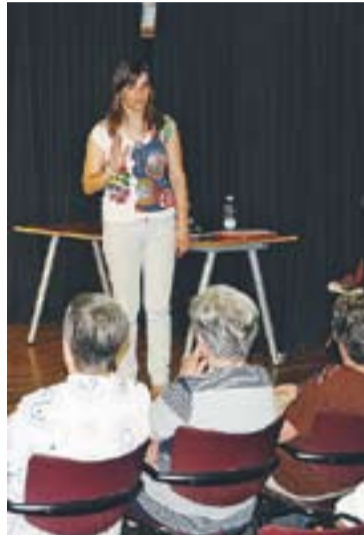
Classe d'educació vial.

van manifestar la seva curiositat per les noves normatives del codi de circulació, el carnet per punts o qüestions concretes com els carrils reversibles. El punt i final de la sessió va ser un test per revisar els conceptes explicats. "Els resultats han estat molt bons! De tant a tant a