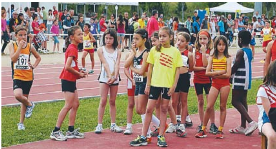
Una prova de la prèvia dels Campionats d'atletisme de Catalunya.

cipals d'atletisme de la Pedra Salvadora de Mollet va realitzar-se la jornada prèvia dels Campionats de Catalunya d'atletisme benjamí i cadet que tindran les seves finals demà a Tarragona i el proper 17 de juny a Vic respectivament. A la prèvia els atletes del CAC han intentat quedar entre els 12 o 16 milers catalans de cada prova per poder passar a la final. Fet força difícil, però així i tot una bona quantitat d'atletes del CAC s'han pogut presentar i de fet, 11 d'ells han passat la preselecció i per tant estaran a la final. Demà mateix serà el torn dels atletes benjamins. ➔