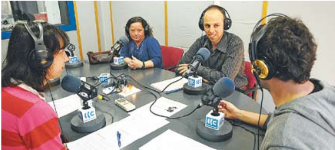
L'estudi 1 de Ràdio Castellar acollirà pràctiques del curs de Ràdio que es farà al juliol.