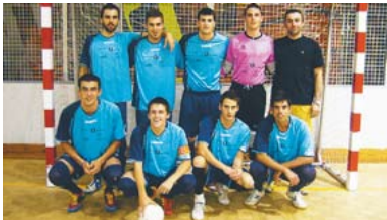
© Els guanyadors de la Lliga Social, la Clínica Dental del Centre || RUBÉN MIRANDA