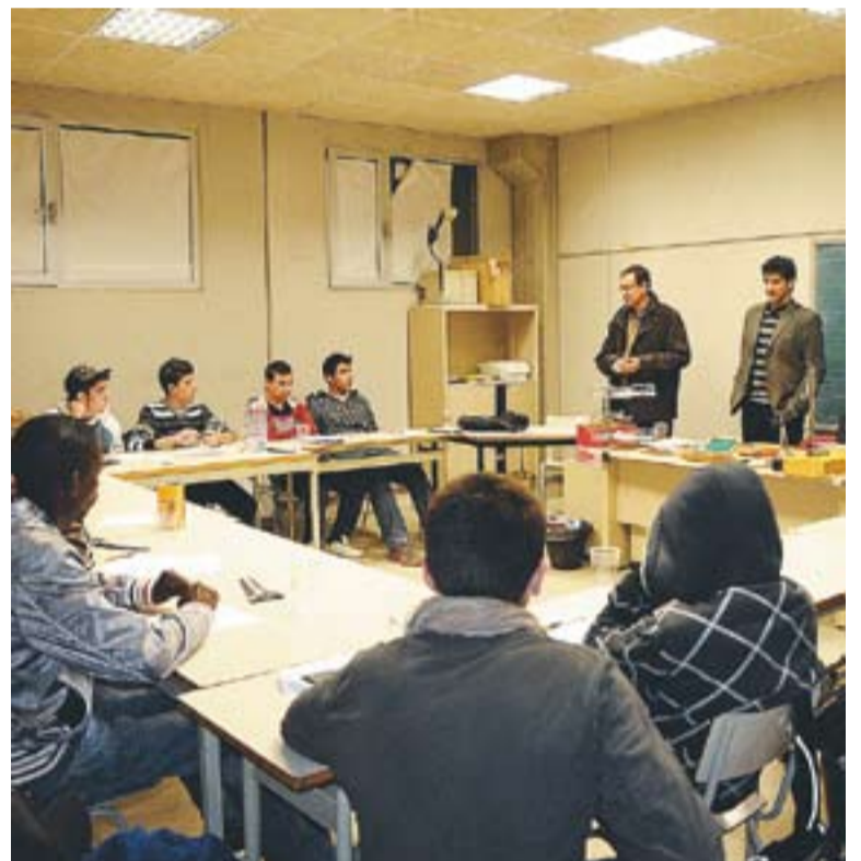
Primer dia de classe del curs de soldadura a la Nau del Metall