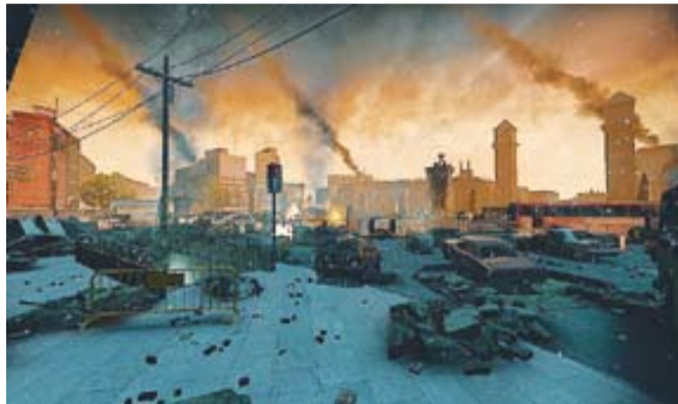
© Una de les imatges creades per la campanya Warcelona. || CARLOS CORONADO

La mecànica del joc 'Warcelona' s'inicia en una espècie d'habitacions que s'han d'anar superant, fins que s'arriba a un helicòpter situat sobre el Museu Nacional d'Art de Catalunya i pots ser rescatat. "La idea era aprofitar tota la cultura espanyola i catalana per a crear una campanya amb una gran ambientació" . "Vam inspirar-nos en