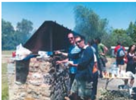
Diumenge sense pluja a Castellar Vell

Envia'ns fotos fetes amb el mòbil: lactual@castellarvalles.cat