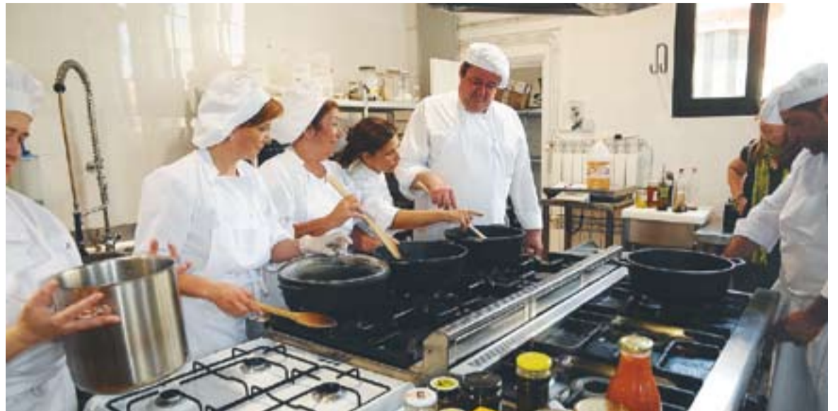
El curs de formació ocupacional de cuina ha tingut lloc a l'espai gastronòmic dels Safareigs de la Baixada de Palau

35 persones han fet tallers de cuina i soldadura. L'Estat ha anunciat retallades del 50% en aquest terreny