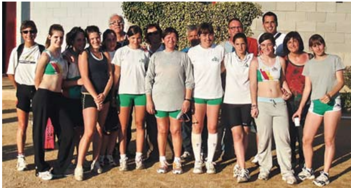
© L'equip del Club Atlètic Castellar que va aconseguir l'ascens a Primera Catalana femenina. || CEDIDA

L'equip castellarenc ha aconseguit classificar-se com a primer. El CAC va obtenir un total de 163 punts, just per davant del Badalona amb 151 i el Granollers amb 125. Les castellarenques van aconseguir aquesta excel·lent posició de la mateixa manera que ho van fer a la primera prova: amb molt