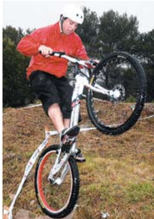
© Albert López va fer el primer podi a elit. || J.G