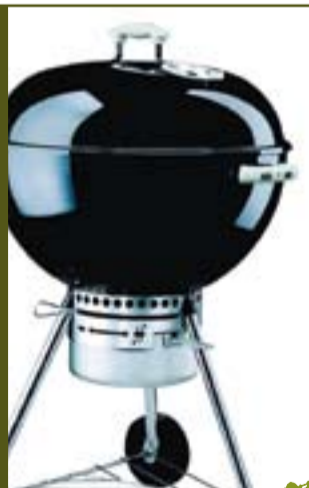
One-Touch Gold Garantia de 10 anys

179,00 € IVA inclòs 47CM Ø 199,00 € IVA inclòs 57CM Ø