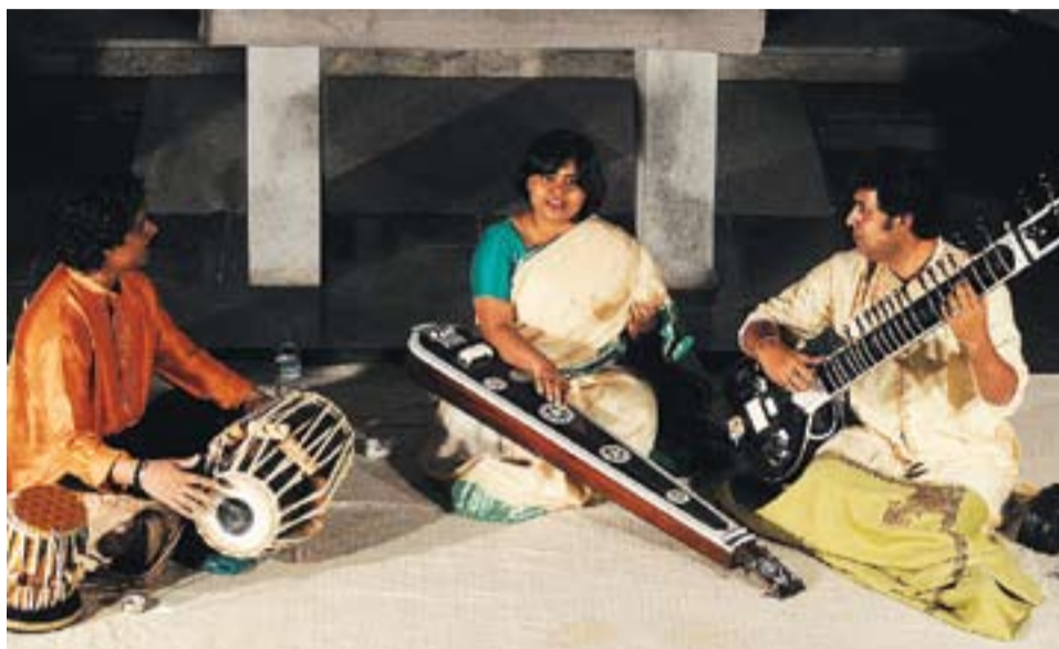
Un moment del concert de Tapan Group, a la Capella de Montserrat.

A banda de la veu, també van destacar els sons del sitar i la tabla , un instrument de percussió que Tapan va tocar amb una agi-