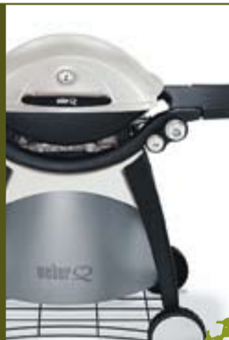
Weber Q 300 Garantia de 10 anys

179,00 € IVA inclòs 47CM Ø 199,00 € IVA inclòs 57CM Ø