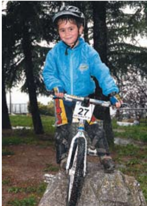
© Alan Rovira és el campió en promesa. || J.G