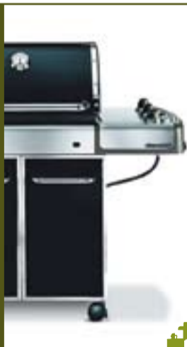
Genesis E-310 Garantia de 25 anys