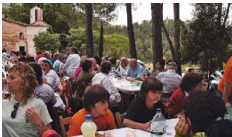
© Dinar de fermanor a l'Aplec del CEC, amb l'ermita de les Arenes al fons || CEC

El grup que serà avui a dos quarts de deu a la Capella de Montserrat és Kora abeteata, un trio que interpreta la música tradicional de l'oest de l'Àfrica i, en particular, la de procedència mandinga, localitzada a Mali, Senegal, Guinea i Gàmbia. Amb ells finalitzarà el tretzè cicle de Concerts a la Capella.