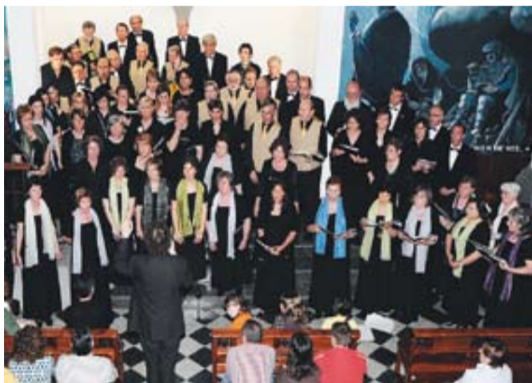
© XVI Musicorral, amb la Coral Xiribec i Turó del Vent, de Llinars del Vallès. || J.G