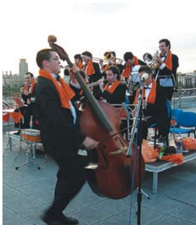
© A dalt, el grup Dealan. A sota, a l'esquerra, London Gay Men's Chorus. Al costat, la Cobla Contemporània. || CEDIDES