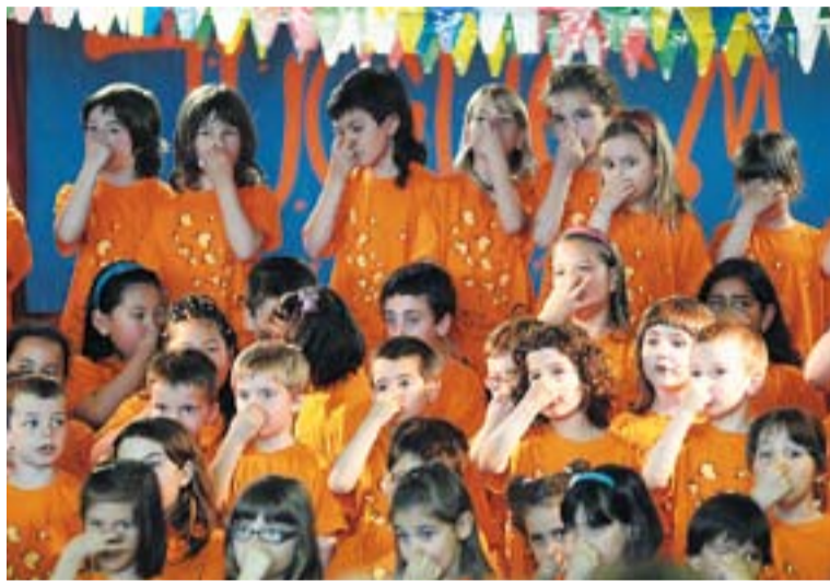
Moment de la Trobada de corals infantils de Catalunya a la comarca.

Totes dues corals van interpretar les peces Senyor Sant Jordi i Canon de la pau . Al final es van atorgar obsequis als cantaires i es va anar a l'escola Immaculada per fer un ressopó. †