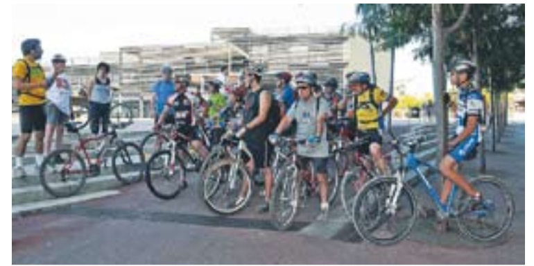
© Sortida de la bicicletada des de Castellar. || L'ACTUAL