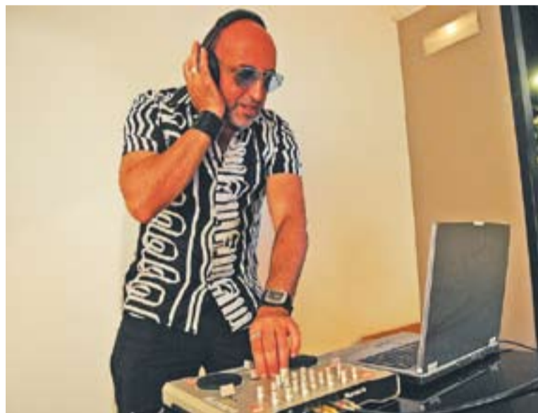
© Dj George Ordóñez from Caracas. || J. GRAELLS