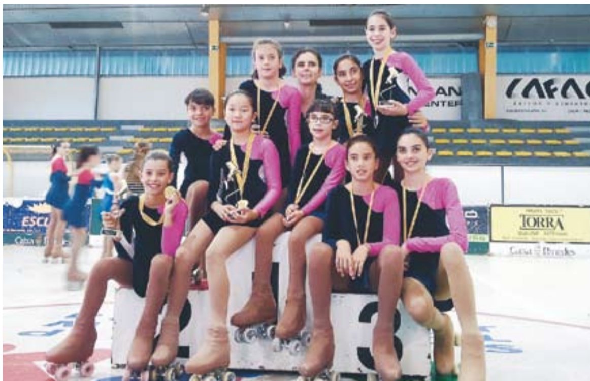
Entrenadora i patinadores en la foto de grup després de la final Intercomarcal de Vilafranca del Penedès.

Croàcia ha estat l'últim país que el Club de Patinatge Artístic de la vila ha visitat per participar al Trofeu Àmfora que organitza la ciutat de Pula