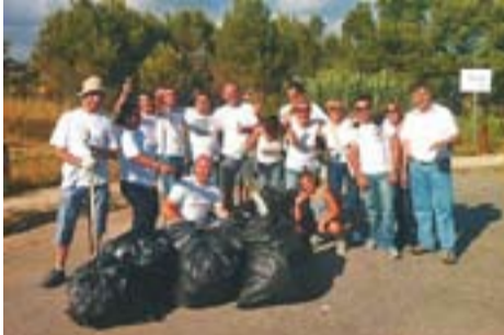
Equip neteja voluntari P. de la Bruguera

Envia'ns fotos fetes amb el mòbil: lactual@castellarvalles.cat