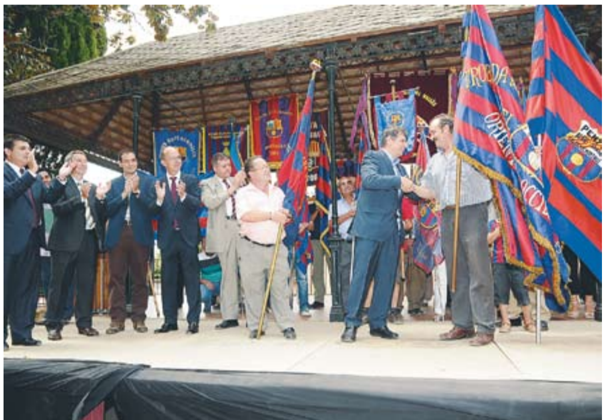
© Autoritats i penyistes blaugranes es van trobar diumenge passat a Castellar del Vallès. || JOSEP GRAELLS