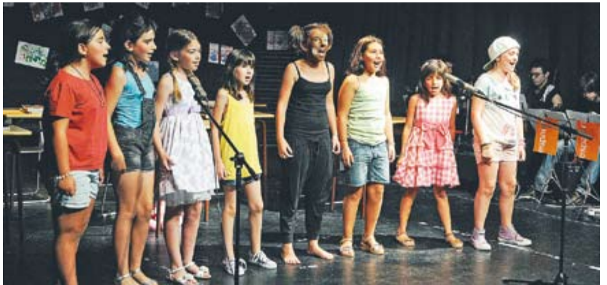
Moment del concert del tercer Stage de Teatre Musical d'Espaiart a la Sala de Petit Format de l'Ateneu.

D'altra banda, dissabte 14 de juliol els alumnes del tercer Stage de Teatre Musical també van actuar a la Sala de Petit Format. Va ser un concert de fi de curs en el qual Xavier Torras va acompanyar les veus al piano. + || REDACCIÓ