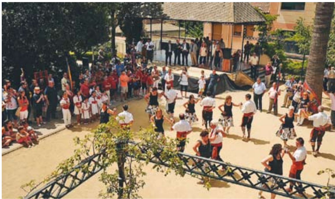
Els Jardins del Palau Tolrà van acollir el Ball de Gitanes de Castellar que clou la temporada 37 de l'entitat.

La Colla de Solters és la que va quedar en primera posició en el primer apartat i segona en els altres dos. Durant el concurs es va valorar la ballada seguint els paràmetres de l'Esbart Dansaire i per al Ball de Gitanes de Castellar, aquesta va ser una dificultat