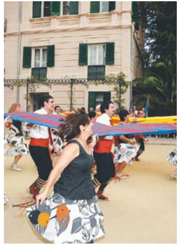
① Cercavila inicial