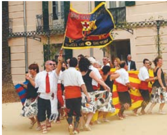
© Alguns moments del Ball de Gitanes a Cerdanyola i a Castellar del Vallès. || CEDIDA / J.G.

afegida ja que a la nostra vila es defensen sols, sense Esbart.