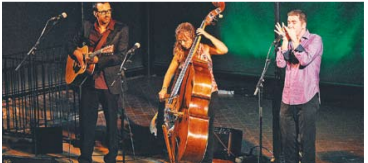
Adalt concert del grup Keympa, abaix actuació de Barcelona Bluegrass Band.

SALA DE PETIT FORMAT | 3r STAGE DE TEATRE MUSICAL