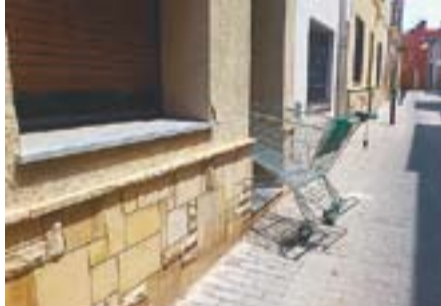
Espera, que entro Autor: Jaume López