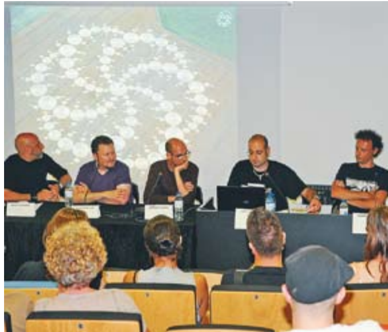
Taula rodona dels Divendres Apocalíptics, divendres 13 de juliol.