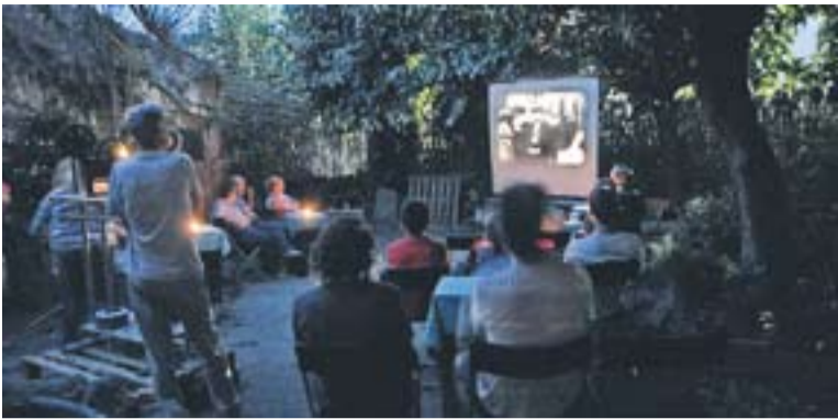
© Imatge de la projecció del dijous 12 de juliol. || JOSEP GRAELLS