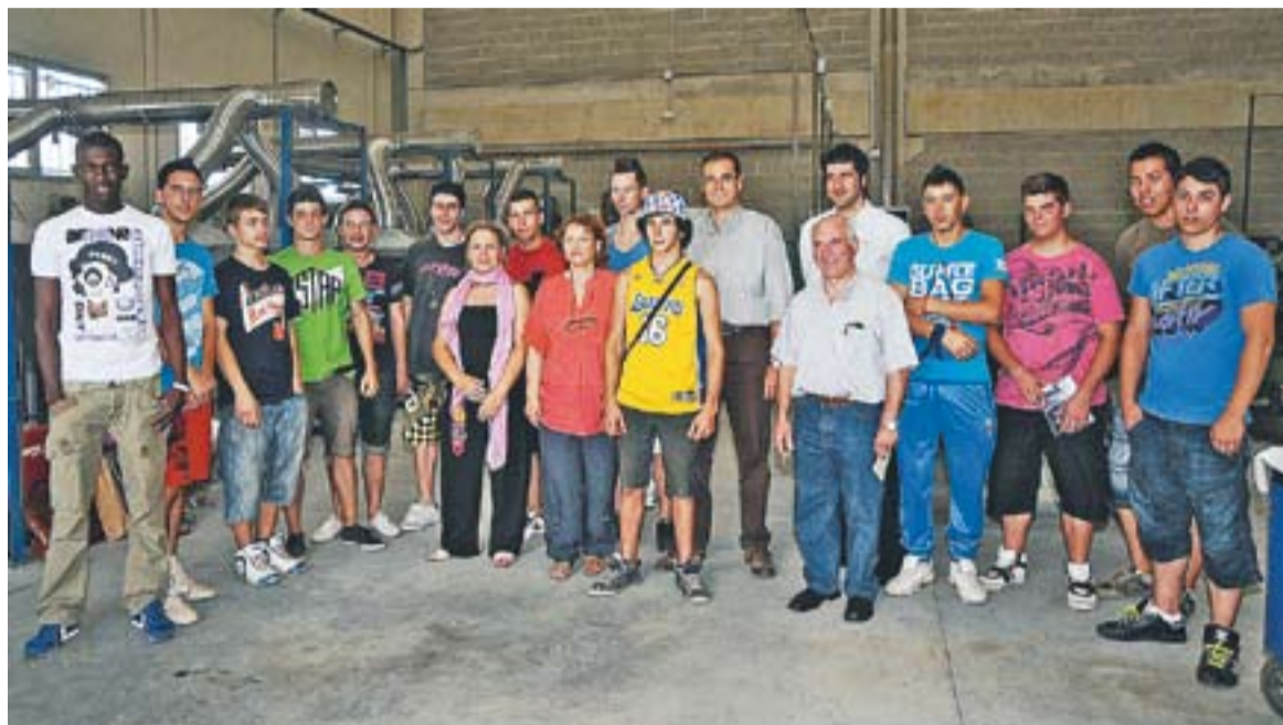
Els alumnes després de rebre el certificat del PQPI amb l'alcalde i la regidora d'Educació.