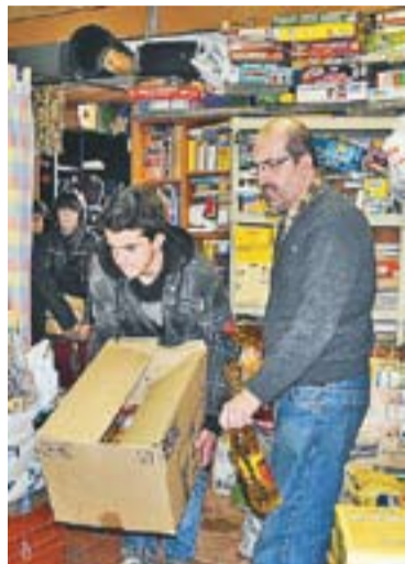
© Preparació dels lots de Nadal || J.G.

L'entitat castellanca té un pressupost anual de 12.000 euros