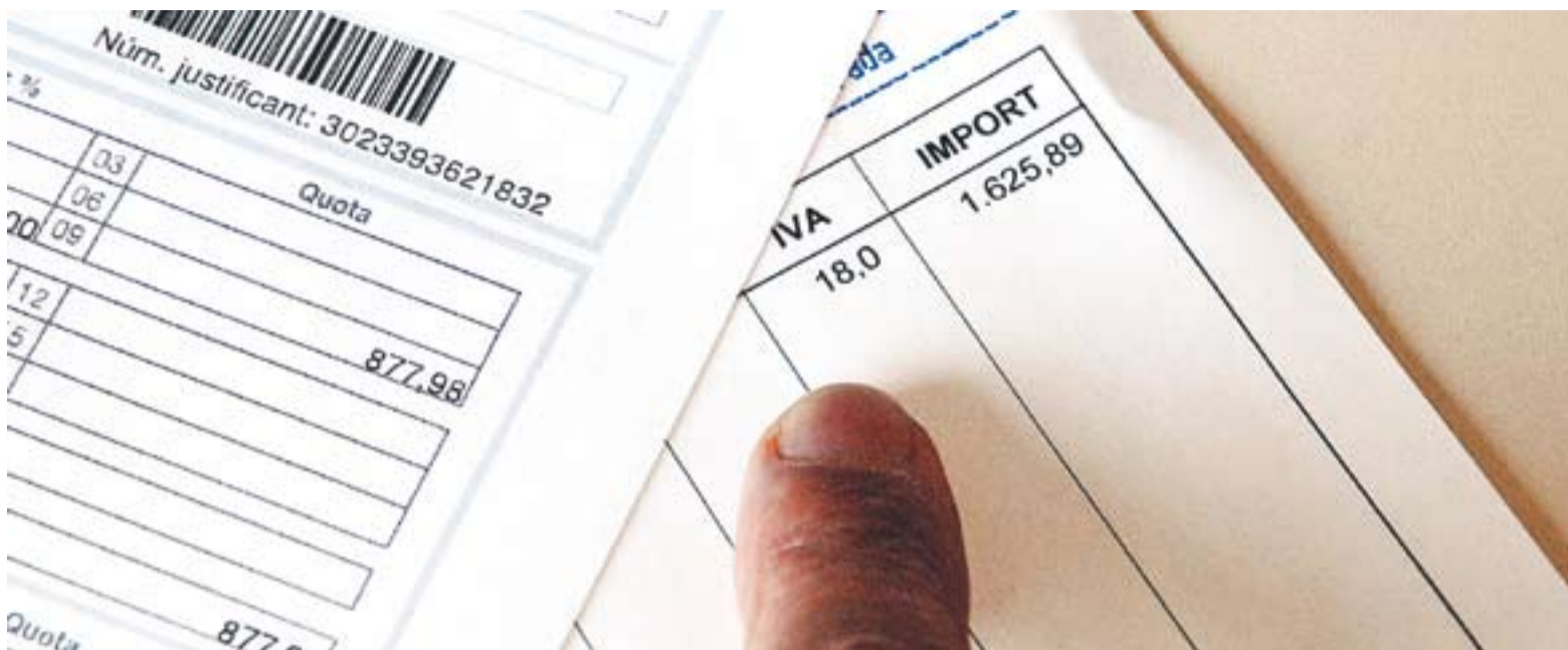
© L'IVA general passarà a partir de l'1 de setembre del 18 al 21% mentre que el tipus reduït pujarà del 8 al 10%. || JOSEP GRAELLS