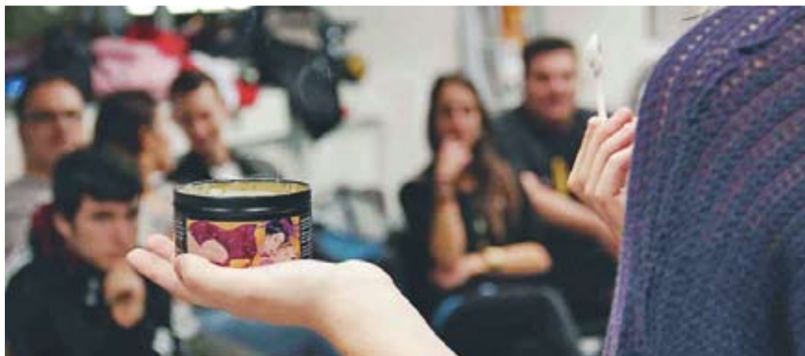
© Sessió de tuppersex de la Carmanyola Picant || ARXIU

La Carmayola Picant és una empresa castellanca que va néixer fa tres anys amb l'objectiu "d'assessorar catalans i catalanes perquè puguin satisfer la seva vida sexual, i aconseguir que aquesta sigui plena i entretinguda" a través de reunions de tuppersex, segons assenyalen les responsables del negoci. Tot i els orígens castellanecs de l'empresa, actualment la Carmanyola Picant opera arreu dels Països Catalans organitzant sessions al Vallès Occidental, el País Valencià o Andorra, entre altres indrets. "Abans de crear la Carmanyola Picant ja treballàvem en aquest sector i sempre vam tro-