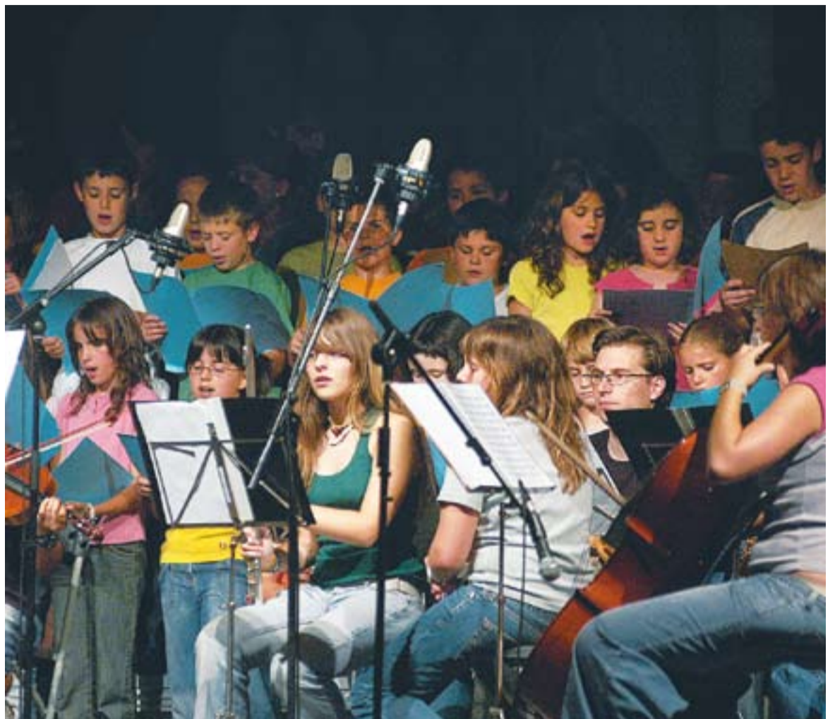
Un dels darrers concerts dels alumnes de l'Escola Municipal de Música Torre Balada.

Divendres 23 es clourà el cicle d'actuacions en motiu de la celebració de Santa Cecília amb el cor gospel, de recent creació a l'Escola Torre Balada. El grup actuarà a les 18.30 h. ✦