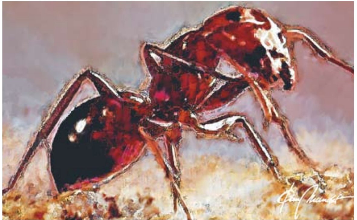
© Sense títol 6669. || JOAN MUNDET

Hem de tenir en compte que aquestes criatures són socials i viuen en comunitats amb milers d'individus regits per una "reina"