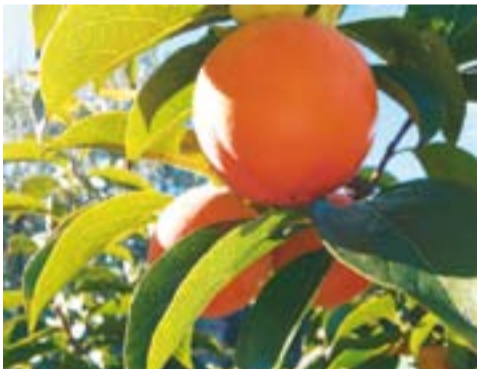
La vinya i l'hortet Autor: Carme Padrisa

Envia'ns fotos fetes amb el mòbil: lactual@castellarvalles.cat