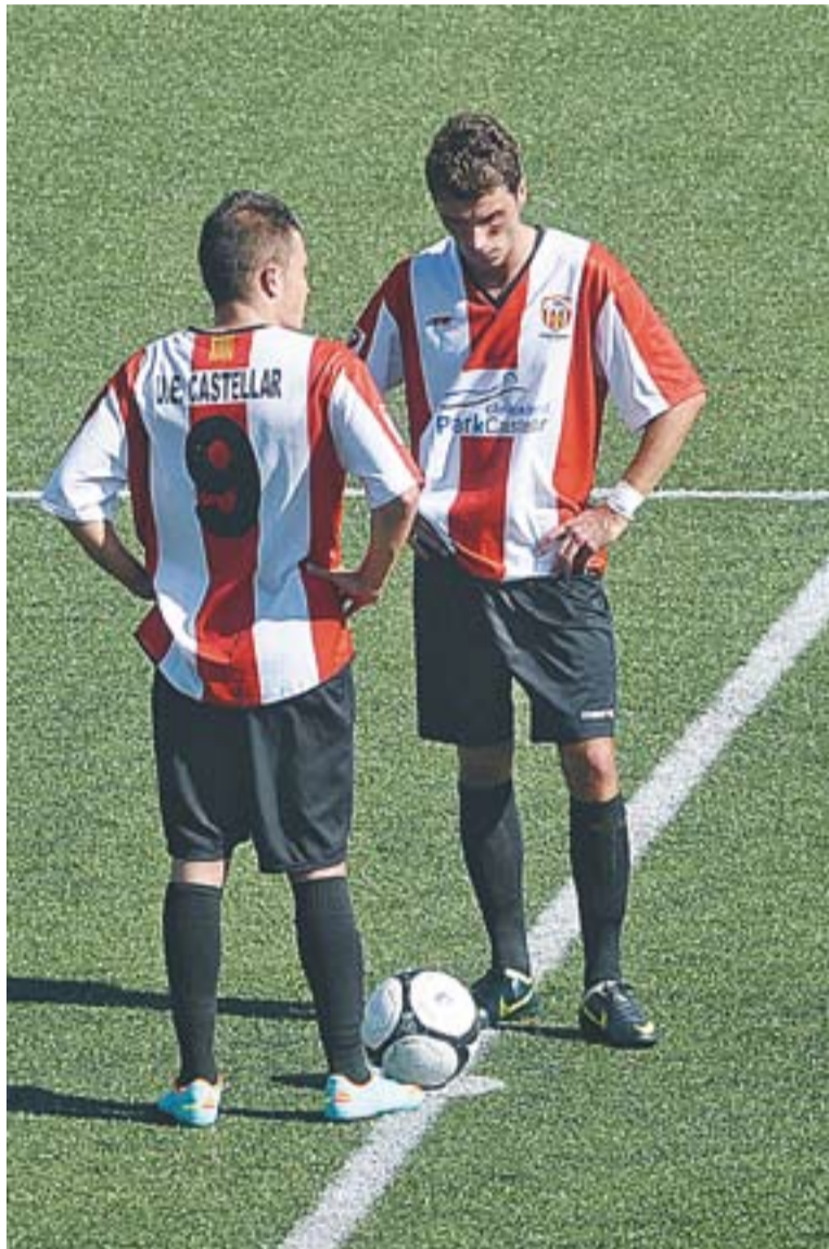
Els castellarencs serveixen des del mig del camp després d'encaixar un gol.

La Unió continua amb 16 punts a la classificació de Segona Catalana després de 10 jornades de lliga. Són setens, en zona còmode, a sis punts del descens a Tercera. D'altra banda el segon equip continua sense guanyar. Aquesta setmana va caure per un contundent 0 a 6 a casa contra el Badia del Vallès. ✦