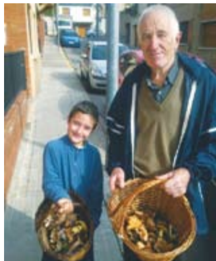
L'avi i el nét tornant de buscar bolets Autor: Joan Rius Mañosa