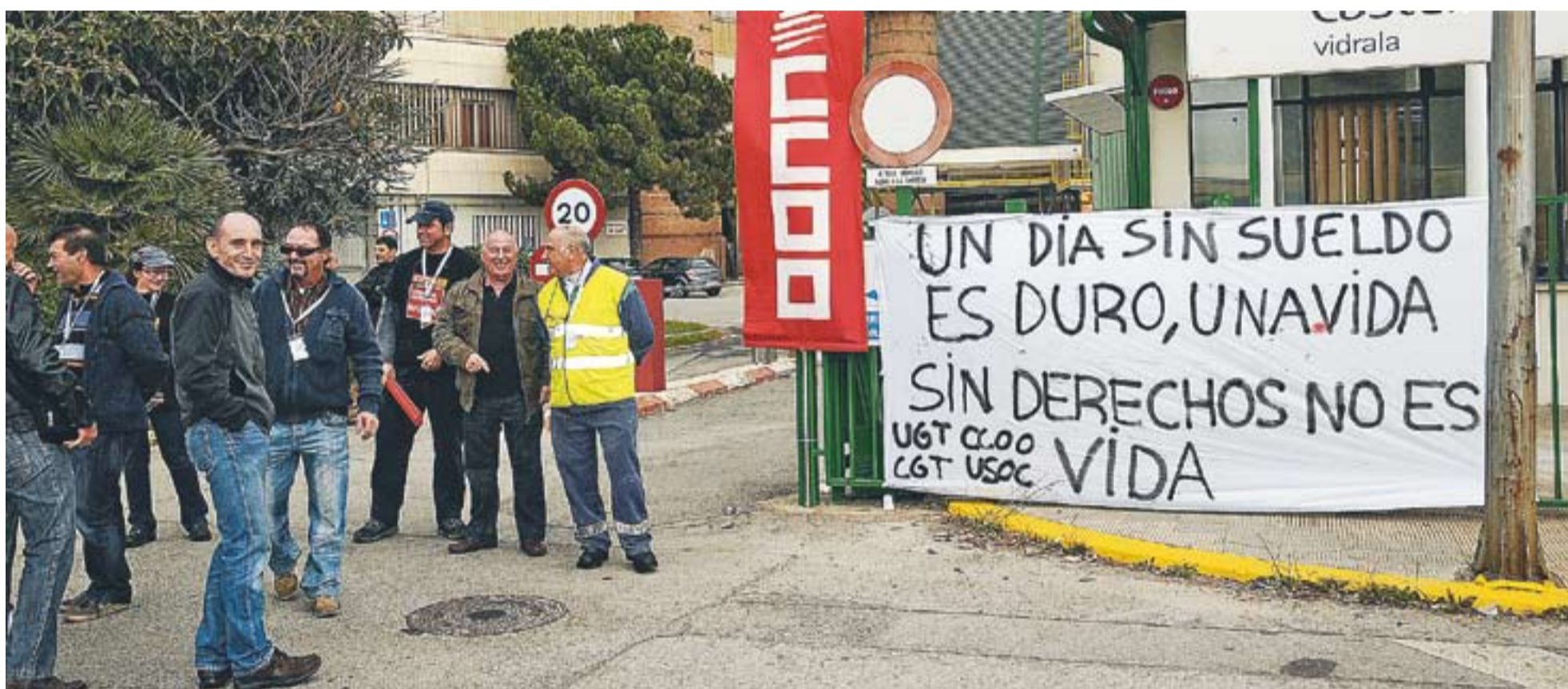
© Treballadors de l'empresa Vidrala, una de les més importants dels polígons locals, concentrats a la porta de les instal·lacions durant la jornada de vaga. || JOSEP GRAELLS