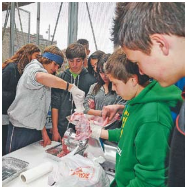
⊕ Taller de botifarras amb Cuina de Safareig a l'Espai Tolrà