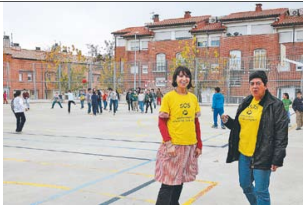
A l'esquerra, el piquet informatiu a l'entrada de Vidrala vigilant que es complissin els serveis mínims i, a la dreta, professores de l'escola Joan Blanquer durant l'hora del pati.