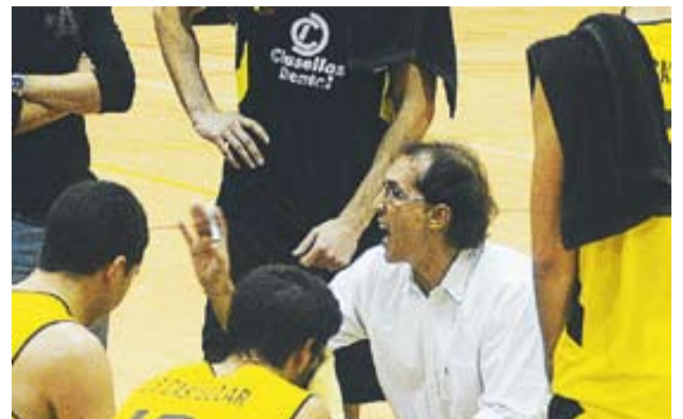
© Txema Solsona en un temps mort al Puigverd. || JOSEP GRAELLS

ció fictícia, ja que hem guanyat a tres equips que estan a la part baixa de la classificació", assegura Jiménez. Un dels rivals a qui han guanyat és l'Athlètic 04, que va tornar a perdre contra el San Lorenzo de Terrassa (5-9). L'equip de Fran Ortega és penúltim de la categoria, encara sense punts. †