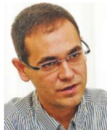
© Ignasi Giménez, alcalde de la vila || J.G.

A la segona carta es demana a les entitats financeres de Castellar que s'apliqui una moratòria fins que no s'acabi de produir aquesta nova regulació anunciada pel go-