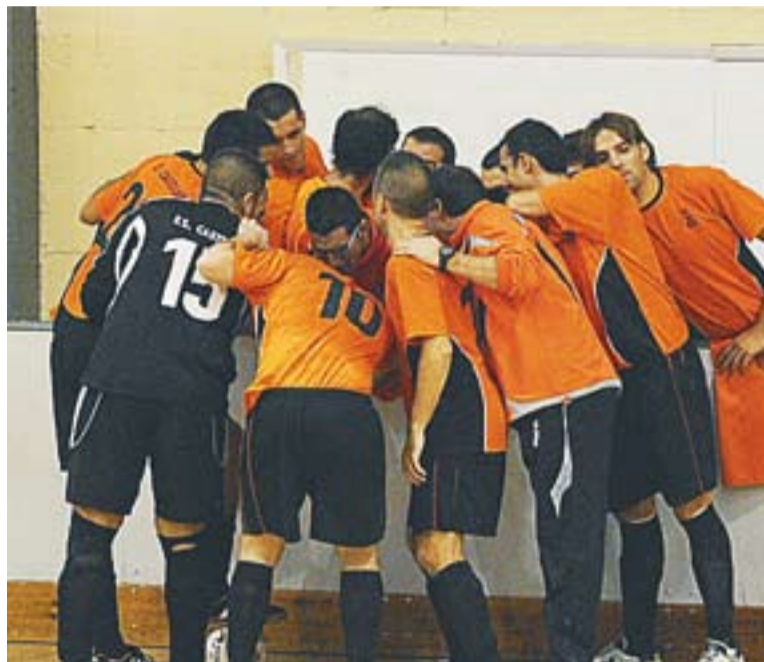
El Castellar en un partit d'aquesta temporada al Joaquim Blume.

A la tercera jornada de lliga els homes de Rubén Jiménez van passar sense despenjar-se per la pista del Grups Arrahona de Sabadell (1-7). Fins i tot el porter Ruben Vidigal va ser l'autor d'un dels gols del Castellar en un inici fulgurant. En només sis minuts els castellarencs ja dominaven 0 a 3 al marcador amb dianes d'Àlex, Víctor i el porter Vidigal, que havia aprofitat que els contraris jugaven de cinc per fer un gol des de la seva àrea. A partir d'aquí el Castellar va dedicar-se a assegurar l'avantatge. "A la que pujàvem una mica el ritme ells no tenien res a fer. L'Arraho-