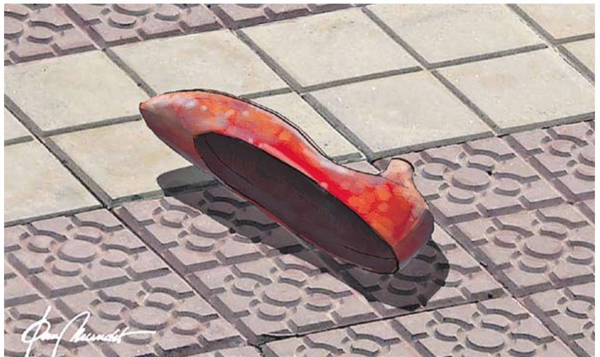
© Allà i aquí. || JOAN MUNDET

Sovint pensem que això passa només als països del tercer món; que "ells" són els bojos; que aquí només tenim episodis aïllats