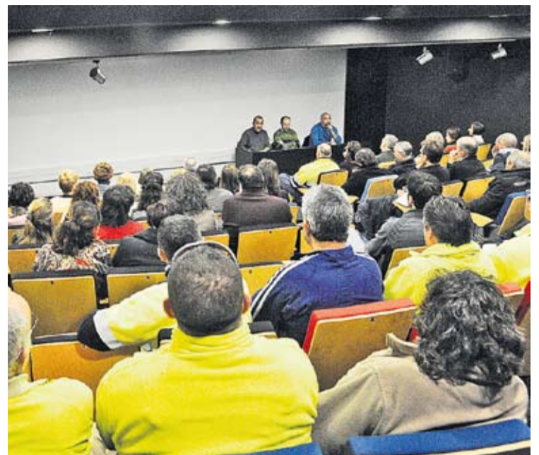
Treballadors municipals en l'assemblea de dilluns passat. || J.G.

Respecte al futur de l'entitat, "hem de fer que no depengui tant de donacions", constata Giménez. El president del patronat ha assegurat que l'OSB s'ha convertit en un dels principals proveïdors del municipi i que s'han fet passos importants per dotar de més recursos a l'entitat. En aquests moments, l'empresa passa per un moment d'interinatge quant a la gestió que està en mans de Sabadell Gent Gran, de la Corporació Sanitària Parc Taulí. Giménez ha precisat que, de cara al futur, "no es buscarà un operador extern". +