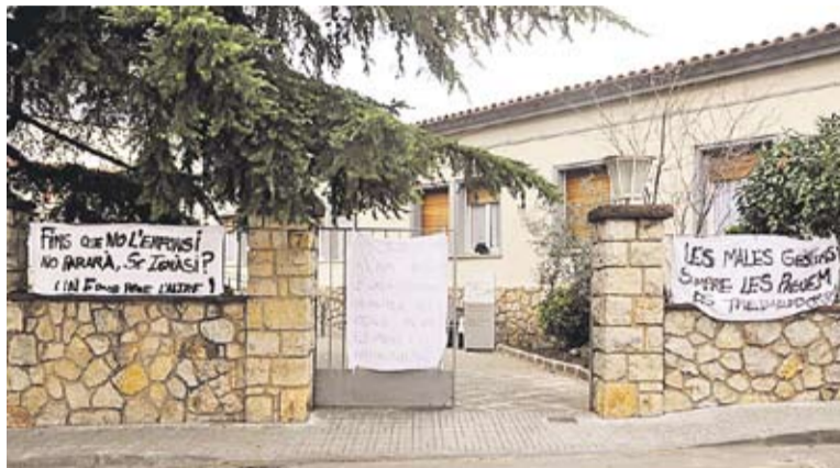
Les treballadores de l'OSB han penjat pancartes a l'entrada de la institució.

Segons les treballadores, la situació a la qual ha arribat l'empresa -amb pèrdues acumulades els darrers cinc anys d'1,15 milions d'euros- és fruit d'una mala gestió "que tothom reconeix, però qui ha de pagar els plats bruts no hem de ser ni les treballadores ni Castellar". Les empleades també demanen que es faci una auditoria externa dels comptes de l'OSB perquè "no ens creiem els comptes, aquí entren molts diners com per estar en pèrdues i de feina no en falta", constaten. Segons les treballadores de l'OSB, "ningú vol aportar solucions i és molt més còmode retallar el sou