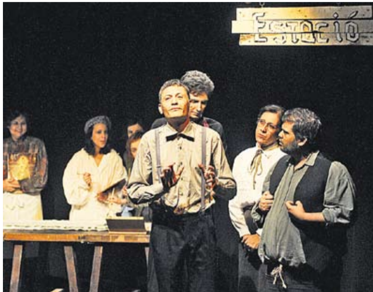
Moment de l'obra 'La visita de la vella dama'.

En aquesta producció d'El Ciervo hi participen bona part dels actors que avui conformen El Ciervo