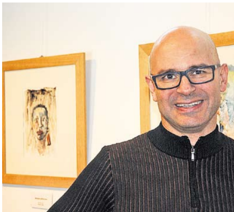
© Josep Masaguer a Cal Calissó amb la seva obra. || JOSEP GRAELLS

Els dibuixos que fa en blanc i negre són un mitjà d'expressió ideal per a les seves emocions més íntimes, oferint un resultat molt dur, diferent de la seva realitat quotidiana. En canvi, aplica el color i les tècniques mixtes per expressar el seu costat més alegre,