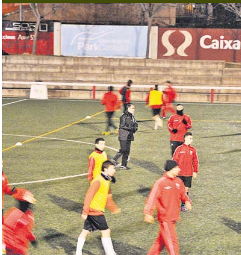
Entrenament de dimarts passat al Pepín Valls.