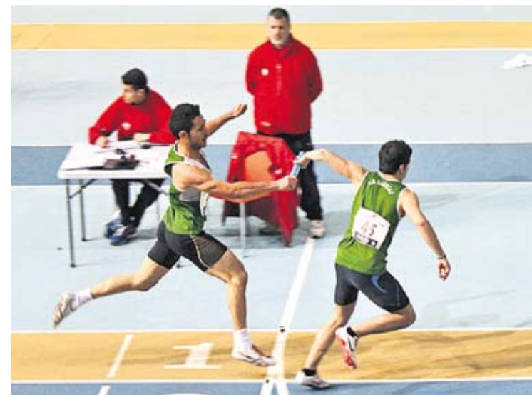
Els relleus van ser un dels baluards del Club Atlètic Castellar.

EL FEMENÍ SEGUEIX EN FORMA || El CB Castellar femení va guanyar (46-40) al Jesuïtes El Clot-AE Casp en l'últim partit de la primera volta, on les noies locals van mantenir des de l'inici del partit un bon ritme de joc. Les castellerenques van fer un bon treball defensiu a la primera part, que van arribar-hi amb quatre punts de diferència. L'encert local va marcar la tònica de la segona part. +