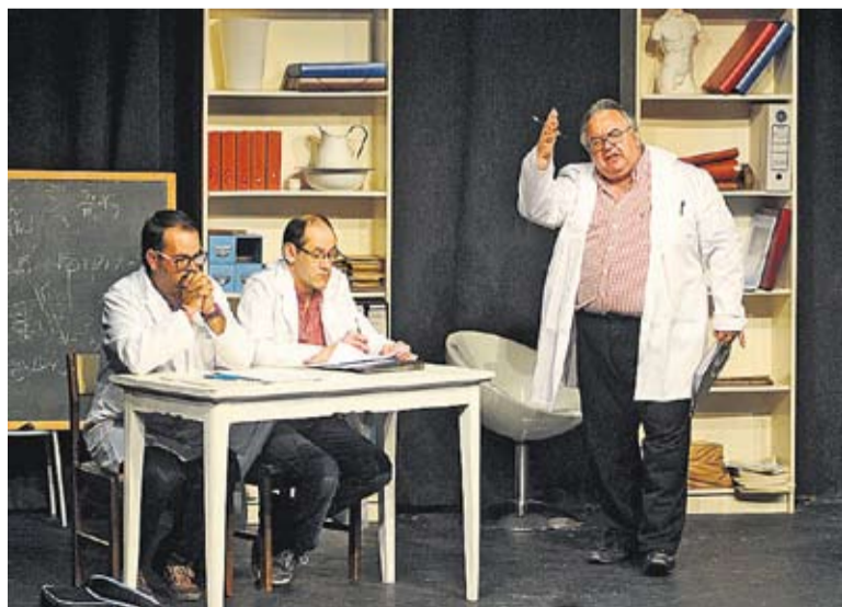
© Escena de l'obra 'Màsters'. || JOSEP GRAELLS

L'espectacle neix d'una experiència a l'Hora Golfa del Conte. Arran d'aquella proposta de l'Esbart es va iniciar un treball en comú en el qual hi participen tots els actors. A poc a poc, es va anar creant un argument més complex que unia totes les històries de l'Hora Golfa, fins que va néixer el projecte. 'Màsters' es podrà veure avui, dissabte 26 i diumenge 27 i també els dies 1, 2 i 3 de febrer. Els preus per a divendres són: 8 euros la general, joves i jubilats i 4 euros els socis de l'Esbart. Dissabtes i diumenges, de 10 euros la general, de 8 els joves i jubilats i de 4 euros, els socis de l'ETC. †