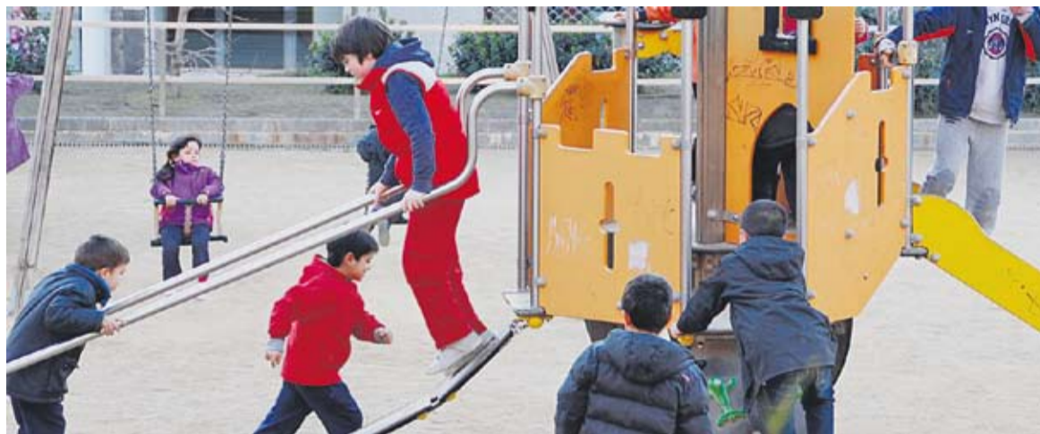
Infants jugant a la plaça Calissó.

D'altra banda, han trobat un lloc al rànquing Aniol, Dorian, Roc, Denis, Sandro, Dídac, Bryan, Jon, Guillem, Hugo o Jan. Són noms d'arrels i procedències molt dis-