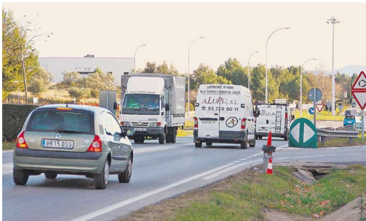
La B-124 a la sortida de Castellar dimecres passat. El projecte del Quart Cinturó permetria connectar la carretera amb la C-58.