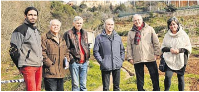
© Representants de Toquem de peus a terra als horts del Brunet || J.G.