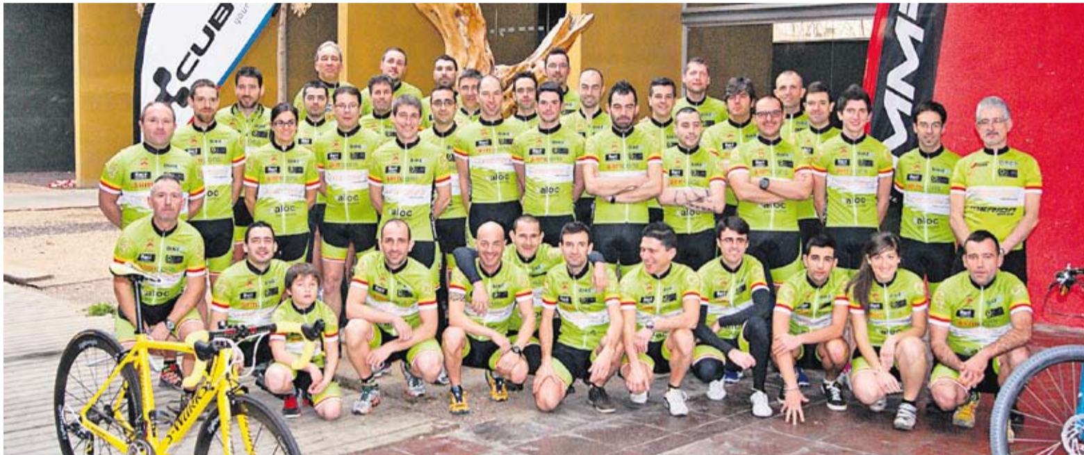
© El Club Ciclista Bike Tolrà es va presentar dissabte passat a l'Espai Tolrà amb un nou increment en el nombre de socis aquesta temporada. || BIKE TOLRÀ

L'entitat castellanca supera els 120 socis i es destaca com un dels club més nombrosos del país