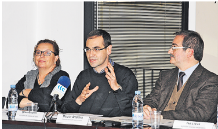
© El cicle es va presentar a Ca l'Alberola dimarts passat. || J.G.

D'altra banda, el Gremi de Jardineria i l'Associació d'Agricultors Viveristes participarà en el projecte facilitant el contacte amb les empreses on els alumnes podran realitzar el mòdul de formació en centres de treball. "El conveni és beneficiós pels alumnes que estaran millor formats, pels docents perquè tenen alumnes motivats, i per nosaltres perquè tindrem professionals més preparats per a les