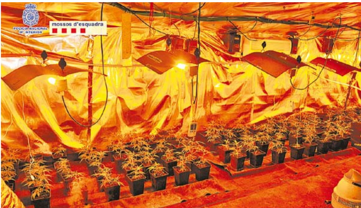
© Part de les plantes de marihuana trobades en dos domicilis a Castellar del Vallès. || CEDIDA