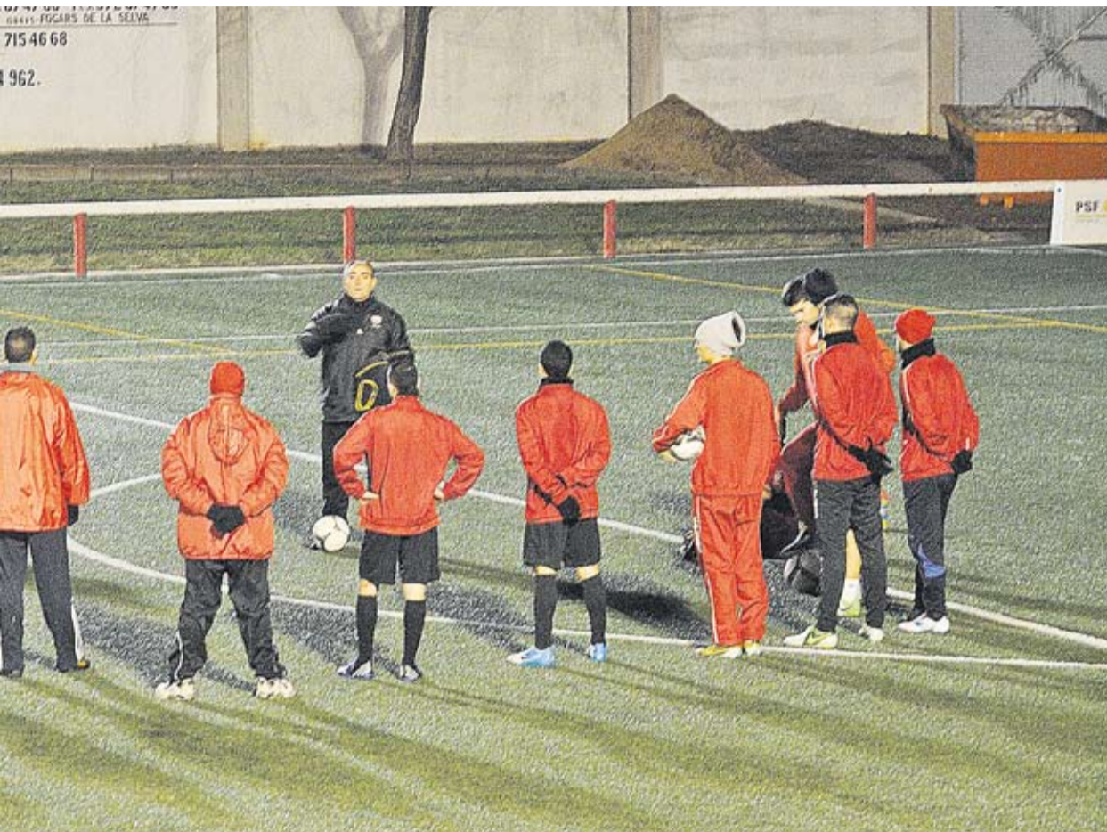
L'equip de la Unió Esportiva Castellar a l'entrenament d'aquest dimarts, preparant-se per al proper partit contra un rival directe, el Sabadell Nord.