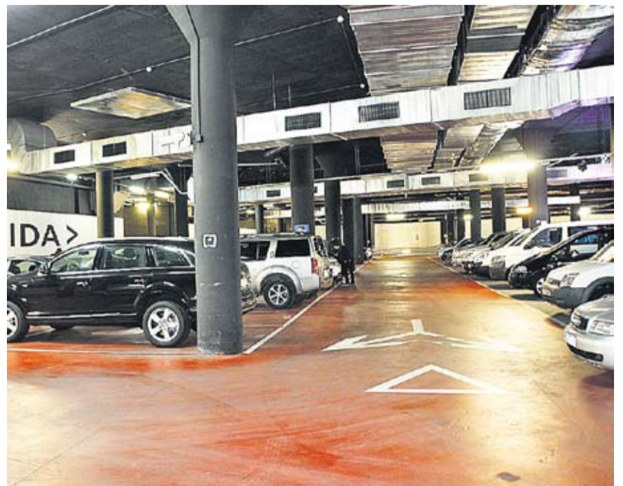
A l'esquerra, una usuària amb els nous parquímetres modificats per SABA. A la dreta, l'aparcament de la plaça Major que incorporarà la connexió amb les oficines centrals de SABA.