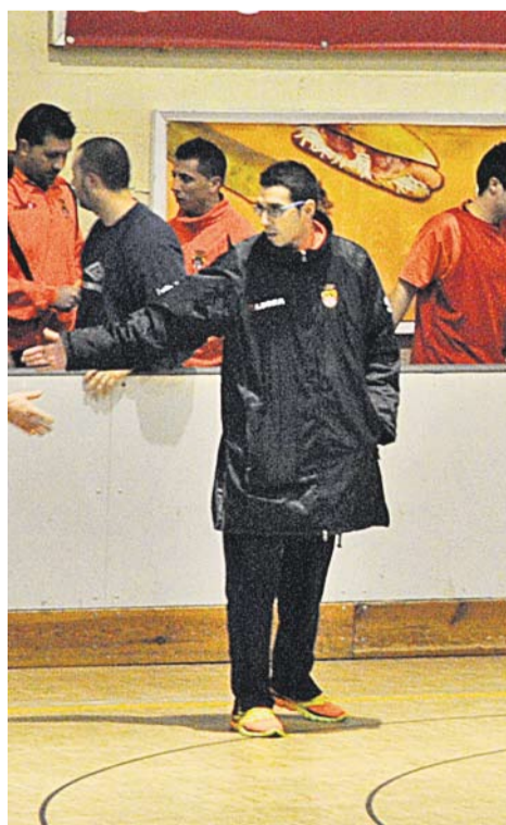
© L'entrenador castellarenc.