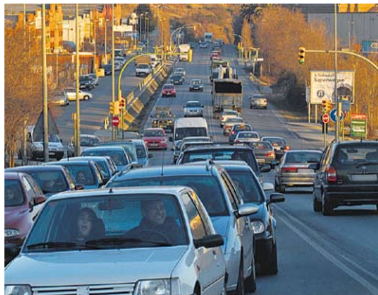
La B-124 és la principal connexió viària per als castellarencs.

En aquest sentit, la Campaña Contra el Quart Cinturó ja havia sol·licitat a l'abril del 2012 que es declarés la caducitat de l'expedient ambiental.