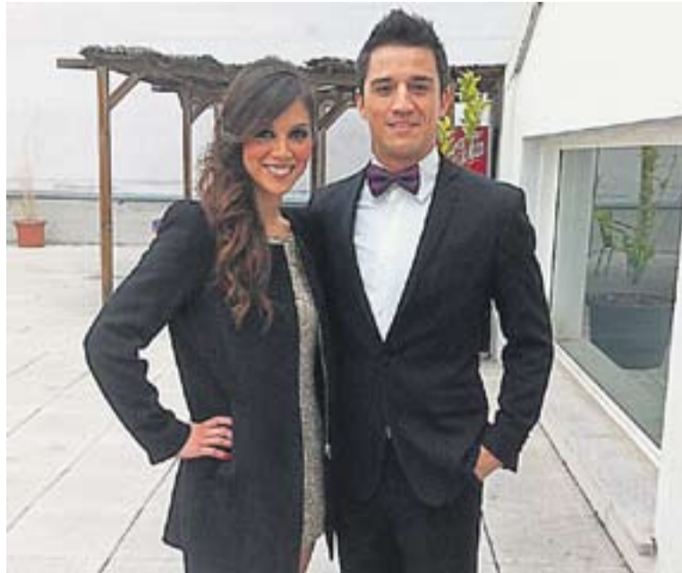
Marta Márquez abans d'entrar a la gala dels Goya.

L'espai va arrencar amb una molt bona dada d'audiència, ja que va aconseguir un share del 7% i a twitter va aconseguir ser trending topic mundial. L'espai ha de competir en la difícil franja de sobretaula. +