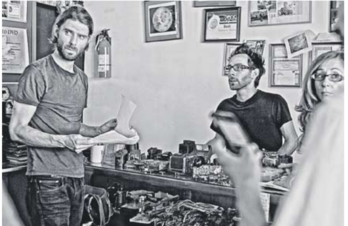
© Èric Boadella, a l'esquerra, durant el rodatge de 'Toastmaster'. || CEDIDA

S'ha gravat a l'entorn de Los Angeles, que és on visc gairebé tot l'any, tot i que encara vinc força a Castellar. El que s'ha fet a Barcelona és la postproducció i per això apareix