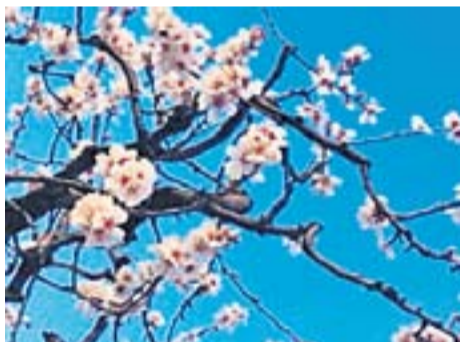
Ametller florit Autor: Frutos Ramírez

Envia'ns fotos fetes amb el mòbil: lactual@castellarvalles.cat