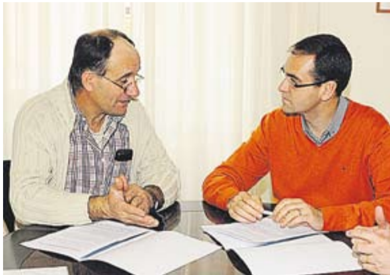
Signatura del conveni entre ADF i Ajuntament, dijous passat

D'altra banda, el conveni recull el compromís de l'Ajuntament de donar suport a les activitats que dugui a terme l'ADF, assumint el cost de manteniment, assegurança i Inspecció Tècnica de Vehicles (ITV) dels automòbils que utilitza l'entitat. Per la seva banda,