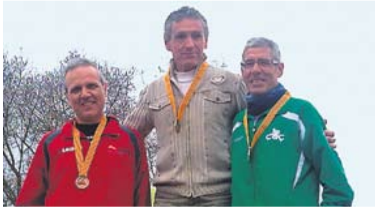
© Joan Moreno, al podi aquest cap de setmana a Vidreres. || CAC

ALTRES COMPETICIONS || Manel Vaca ha estat quart a la duatló de l'Ametlla. Una prova amb 225 competidors i un circuit dur i sinuós en què el castellarenc va acabar