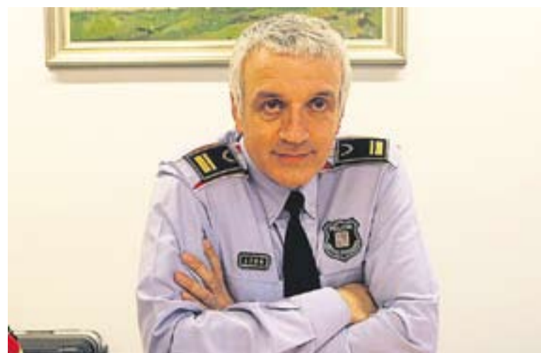
L'intendent dels Mossos en la seva darrera visita a Castellar.

Mossos d'Esquadra i Policia Local també actuen plegats en àmbits com la prevenció de robatoris a comerços en èpoques com el Nadal amb l'anomenada operació Grèvol o la prevenció de robatoris a habitatges. “ La prevenció és la clau. Abans l'origen d'una actuació de la policia era un requeriment. Ara actuem en la resolució de conflictes civils, i estem al costat del ciutadà com un àrbitre imparcial per assessorar-lo, aconsellar-lo i ajudar-lo a solucionar les problemàtiques