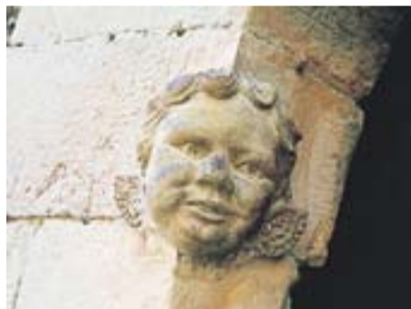
El querubí Autor: Jordi Roig