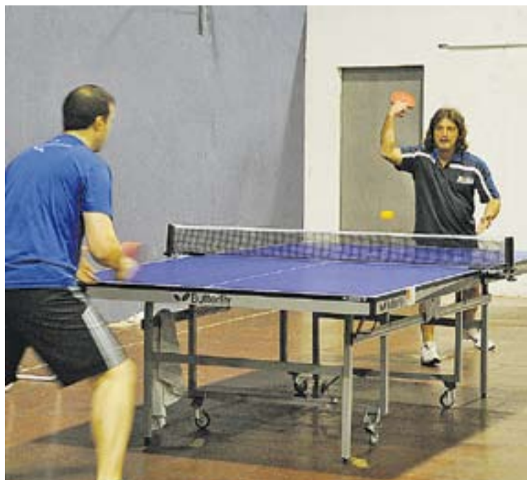
Els castellarencs segueixen liderant la classificació del grup.