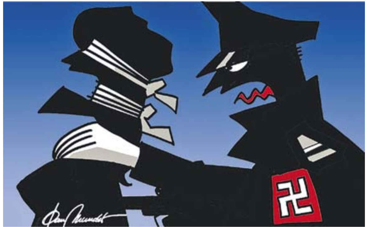
© Els de sempre. || JOAN MUNDET

La immensa majoria de catalans som capaços de fer-ho perquè sabem treballar; perquè els nostres pares, els nostres avis, ens han inculcat el valor de l'esforç i, per tant, no podem permetre que els fruits d'aquest valor ens els robin contínuament. Ens hem de rebel·lar, definitivament, en contra dels espoliadors, dels paràsits que viuen a costa nostra. Aviat tornarem a tenir la oportunitat de què, només nosaltres, amb el nostre vot, puguem decidir qui ha de gestionar el rendiment del nostre esforç. El referèndum per la independència de Catalunya ens obligarà a definir si el que volem és que els nostres recursos els gestionem nosaltres, amb els canvis de model necessaris, o els funcionaris espanyols de