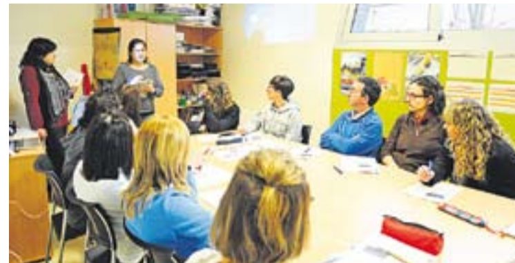
L'última sessió va ser dimarts passat a l'escola bressol Colobrers