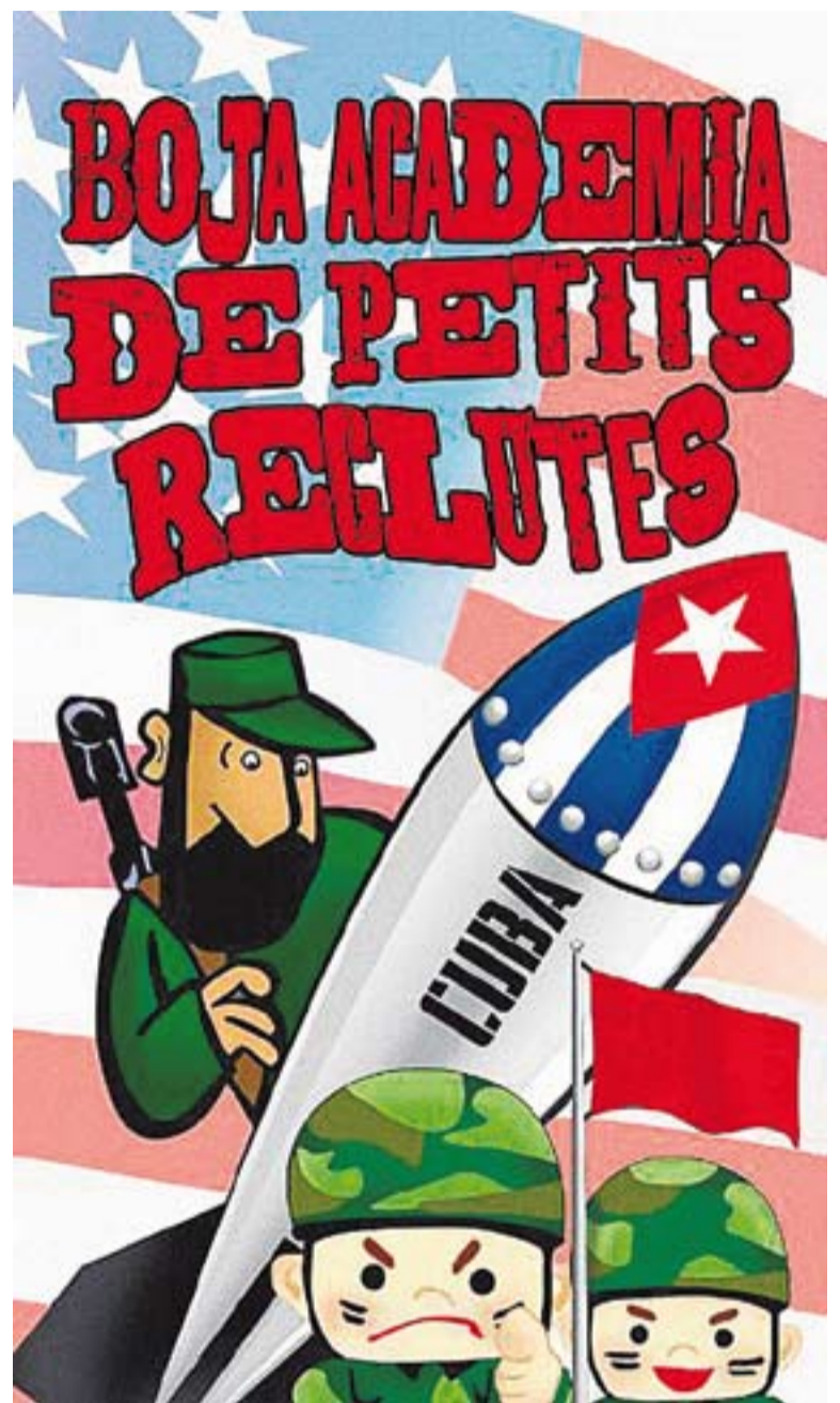
© Cartell de l'obra 'Boja acadèmia de petits reclutes' de Sant Feliu del Racó.