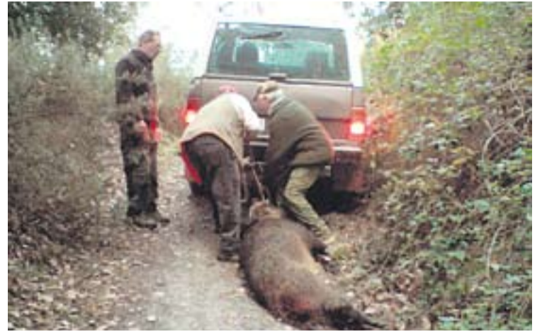
Una imatge d'una batuda anterior.