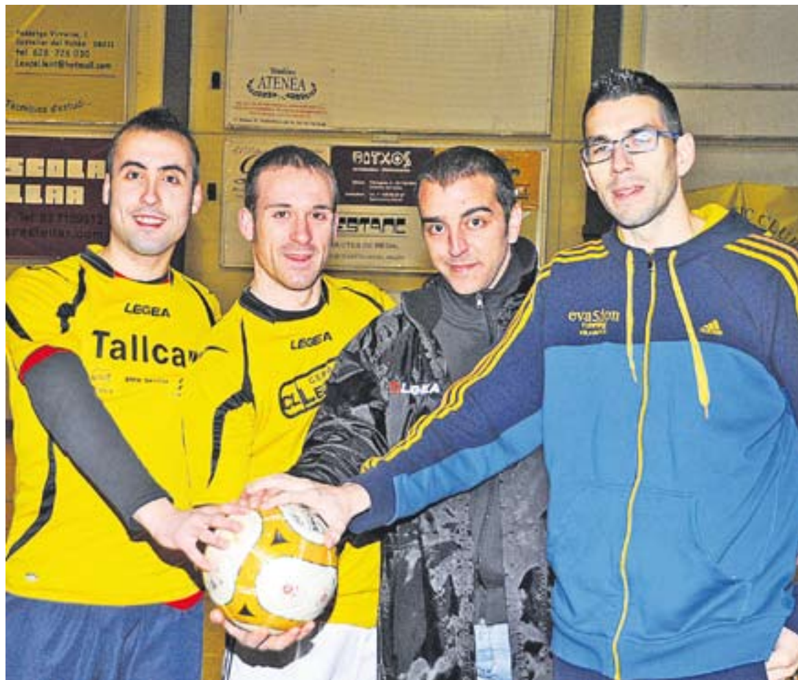
© Jordi Parera i Albert Moya, de l'Athlètic 04, i Rubén Vidigal i Rubén Jiménez del Futbol Sala Castellar. | JOSEP GRAELLS

Athlètic 04 i Futbol Sala Castellar s'enfronten diumenge a Preferent Catalana (12:45h) i a Primera Catalana (17h) al pavelló Joaquim Blume