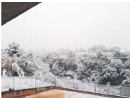
Vistes de la Penya arlequinada Autor: Ricard Abad