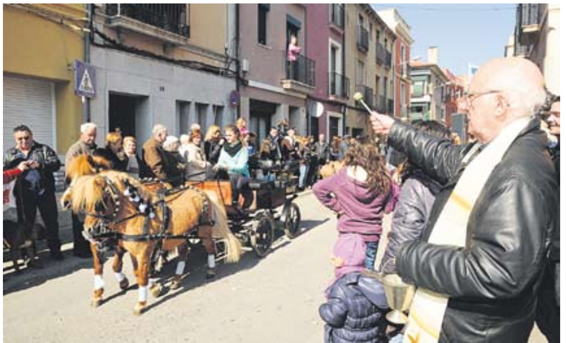
Mossèn Villarino bateja els cavalls, a l'alçada del carrer Major, durant la passada de Sant Antoni Abat.