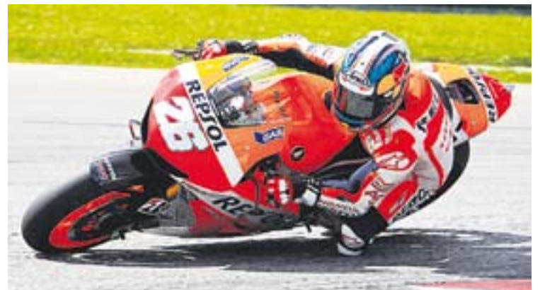
© Dani Pedrosa, aquest dimarts al circuit de Sepang. || MOTOGP

Últim mes per preparar la nova temporada 2013 al Mundial de Motociclisme