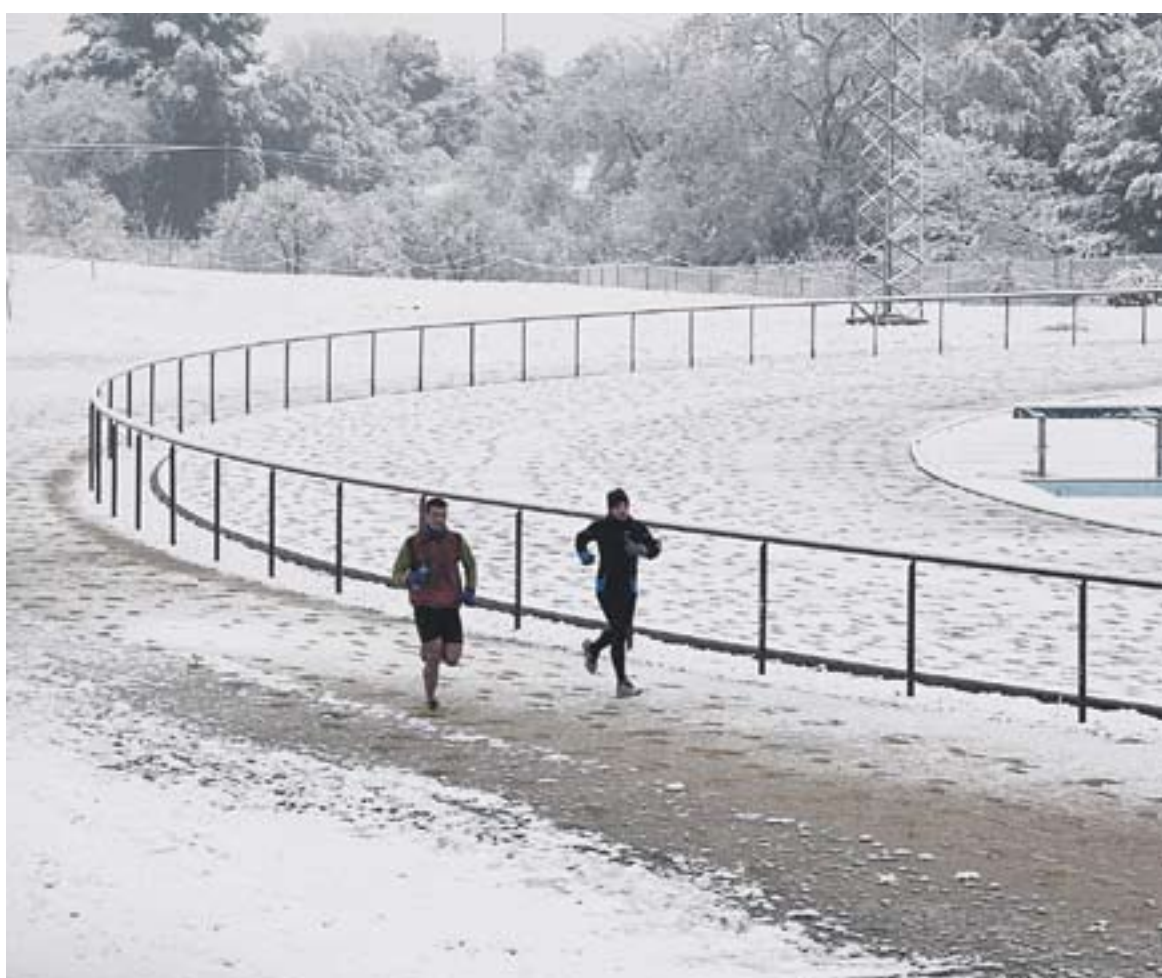
La vila va despertar nevada dissabte passat, en la imatge les pistes d'atletisme. Durant la setmana el fred ha estat intens. || J.G.