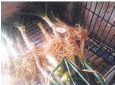
Usos d'un Actual antic Autor: Jordi Niñerola

Envia'ns fotos fetes amb el mòbil: lactual@castellarvalles.cat