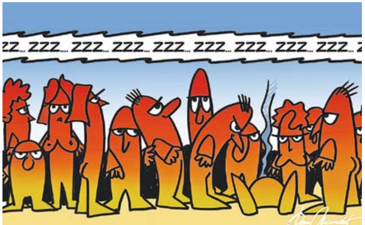
© Sense títol 4339. || JOAN MUNDET

todos, especialmente para los menos favorecidos, inscribiendo estos de- rechos en las estructuras y en el funcio- namiento de la sociedad. La justicia trasciende el interés indivi- dual, se preocupa del interés general y el bien común. La justicia social no se encierra dentro de las fronteras na- cionales, sino que regula las mutuas relaciones entre las naciones y los Es- tados. Da como deber a los países eco- nómicamente fuertes a asistir a las naciones que viven en la pobreza y en la miseria, para que puedan vivir de un modo digno de seres humanos. La justicia social debe comprenderse a partir de la dignidad de la perso- na, de los derechos inviolables que deben ser respetados y promovidos de forma dinámica y progresiva. Los derechos humanos no se limitan al área económica, sino que se extien- den al área civil y al área religiosa. La comprensión de la dimensión ética de estos conceptos permite que las per- sonas puedan actuar por un mundo más justo, en su país y fuera de él. La justicia social se refiere a la misma