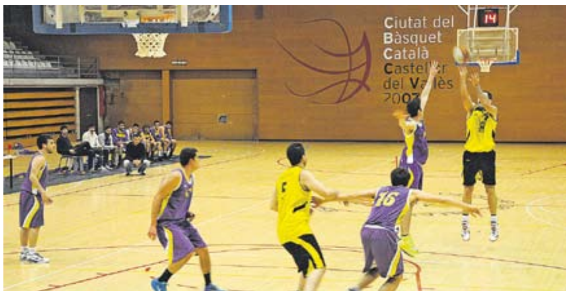
L'encert en el tir exterior va portar els castellarencs cap a la victòria.

El CB Castellar sotmet a triples un rival directe en la lluita pels primers llocs, el JAC Sants (93-65) i empata a punts amb el quart lloc de Copa Catalunya