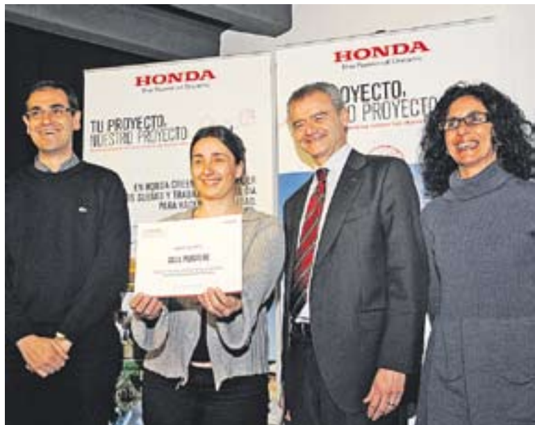
Liurament del guardó, dimarts passat, a la sala d'actes d'El Mirador. || J.G.

Honda premia la tasca de la Sala Puigverd