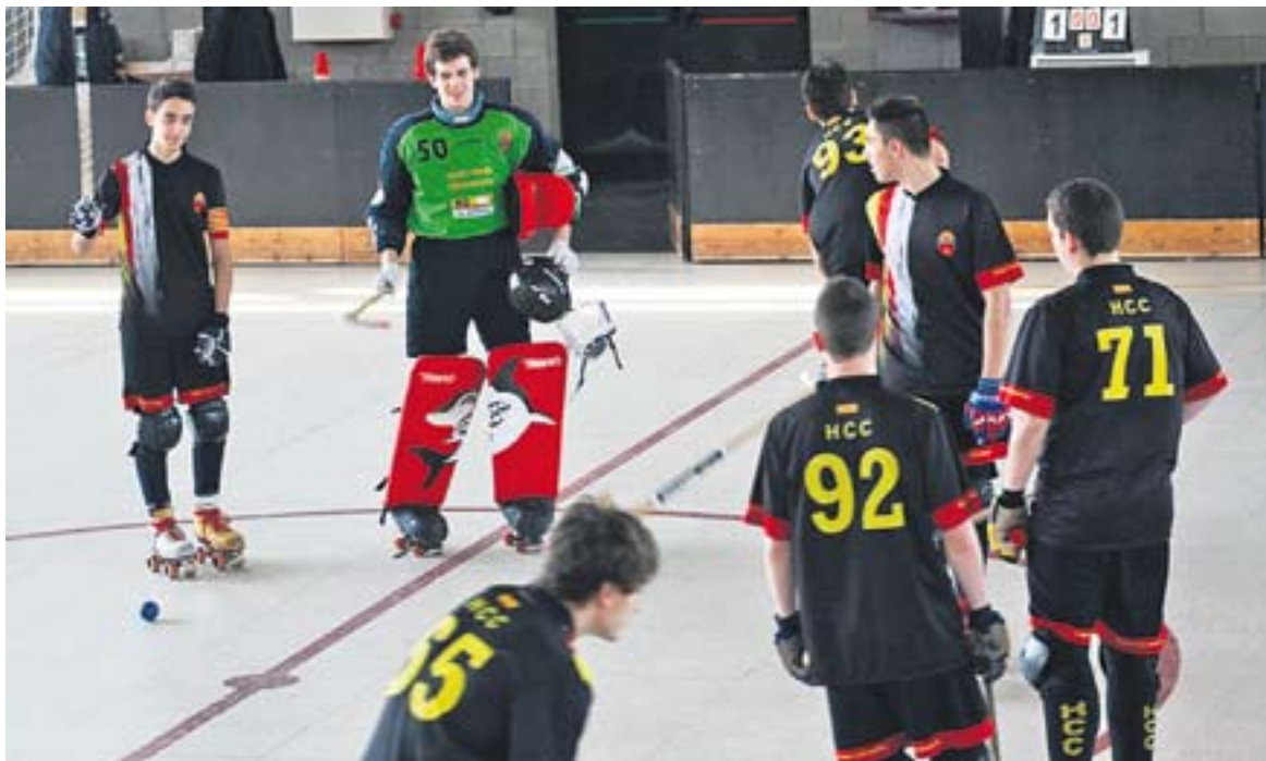
L'equip de l'Hoquei Club Castellar no va tenir pietat del conjunt rival aquest cap de setmana.

L'equip castellarenc s'imposa amb comoditat contra l'Olesa, un dels equips de la zona baixa, i obté la setena victòria de la temporada a Segona Catalana