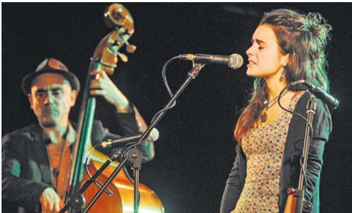
Joan Chamorro i Andrea Motis, en concert. Sala Blava de l'Espai Tolrà, divendres 1 de març.