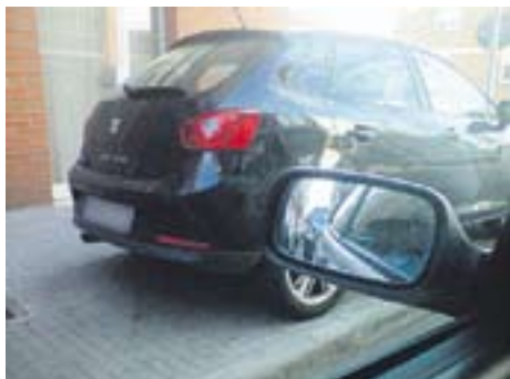
Exemple de poc civisme aparcant

Envia'ns fotos fetes amb el mòbil: lactual@castellarvalles.cat