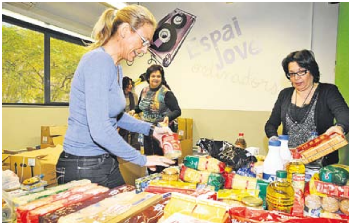
La campanya de recollida solidària de Nadal va permetre oferir lots de productes bàsics a 120 famílies.

DISTRIBUCIÓ DELS AJUTS || L'any passat es van concedir ajuts econòmics municipals a un total de 235 famílies, amb un import total de 150.000 euros. Del total del pressupost gestionat, un 42% dels ajuts es van destinar a donar suport a infants i famílies (beques de menjador, ajuts per escolarització en escoles bressol, ajuts per l'adquisició de llibres, ajuts per inscripció al Casal d'Estiu...). “Prioritzem molt que els nens tinguin un bon àpat, si s'han de quedar al menjador escolar, intentem gestionar-ne la beca, també que tinguin els llibres i el material escolar” . Cal assenyalar, però, que el número de beques de menjador sol·licitades ha disminuït: “Ara hi ha