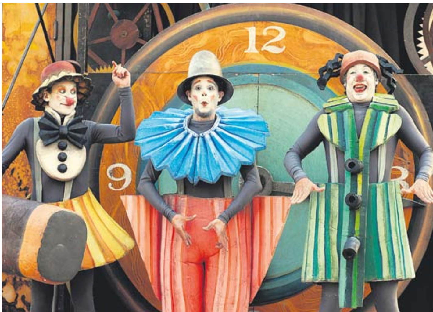
Actuació de la companyia La Tal a Cal Calissó durant la Setmana del Pallasso 2007 amb l'espectacle 'Carrilló'.