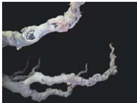
Arbres amb caràcter Autora: José Zaguirre