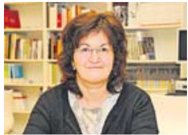
© Montse Barros. || JOSEP GRAELLS

Montse Barros va començar a pintar de ben jove, va estudiar a Barcelona i va fer la primera ex-