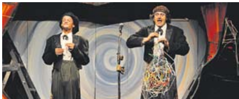
© La companyia rubinenca ja ha actuat a la Setmana del Pallasso. || J.G.

♦ Els naixements cauen a la vila any rere any. El 2012 n'hi va haver 230, la xifra més baixa registrada des de l'any 2001 ACTUALITAT P3