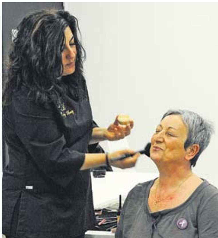
© Taller de Luxury Beauty a la sala Xavier Caba. || JAVI BARBOSA

Avui mateix, a banda de la lectura del manifest prevista a les 13 hores, el magazín 'Dotze' de Ràdio Castellar acollirà la tertúlia 'L'organització familiar ara', un contrast de realitats d'homes i dones de diferents edats. També destaca el pròxim 13 de març, a les 19.30, a la Sala Lluís Valls Areny d'El Mirador el taller 'Com gestionem les dones el nostre dia a dia?' a càrrec de Mavi Tresvares, psicòloga. A banda d'altres tallers i tertúlies hi ha diverses exposicions temàtiques com la de l'Escola Municipal d'Adults sobre directores de cinema o Dones i oficis a Castellar del Vallès, que es pot visitar a El Mirador fins el 15 de març. L'Institut Castellar també acull 'Artistes i dones', treballs d'alumnes sobre pintures dels segles XIX i XX la dona. +