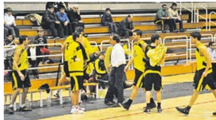
© Els castellarencs en un partit al pavelló Puigverd. || JOSEP GRAELLS