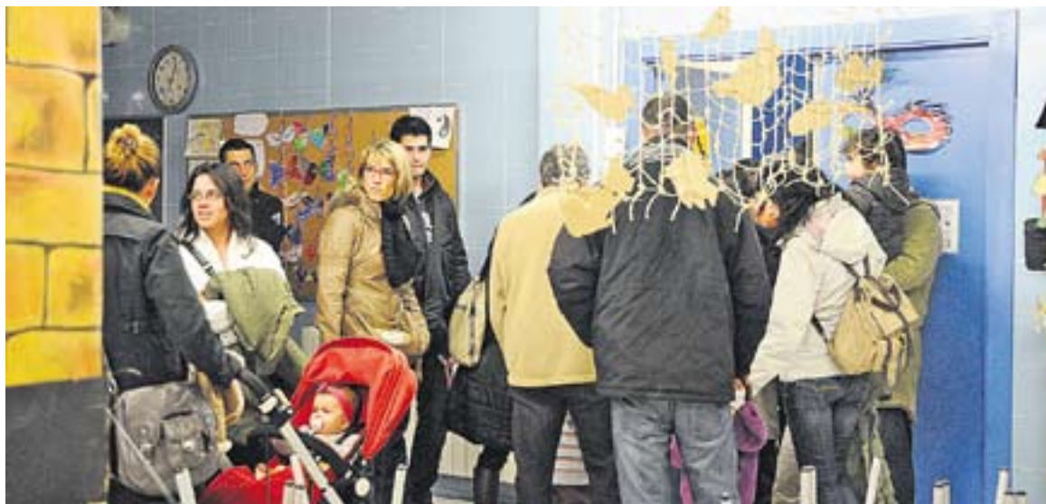
⊕ Durant aquesta setmana els centres han fet jornades de portes obertes perquè els pares coneguin les escoles || J. G.

En canvi, ben diferent és la previsió per a les places de secundària en els propers anys, que segons les dades, serà a l'alça. Així, i segons la piràmide d'edats, 308 habitants empadronats a Castellar s'hauran d'escolaritzar a 1r d'ESO al curs 2013-2014, 307 ho hauran de fer al curs 2014-2015, 321 al curs 2015-2016 i 363 al curs 2016-2017, anys en