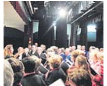
© Trobada de corals a Sant Feliu.

Respecte els balladors, tant els més veterans com els qui comencen per primera vegada, cal agafar forces perquè aquest serà un any trepidant. S'esperen diverses celebracions arreu del país que l'entitat anirà comunicant properament. †