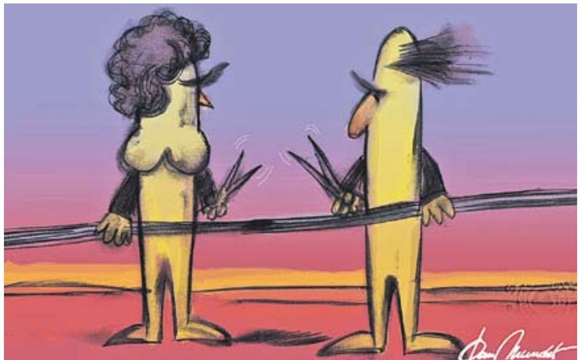
© Clac...clac... 8 març. || JOAN MUNDET

Aquest 8 de març volem recordar i fer un homenatge a totes aquelles dones i homes que, al llarg de la història i a tots