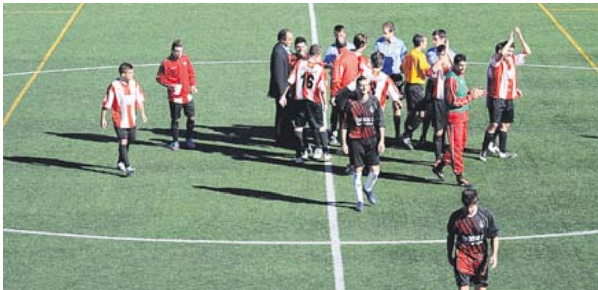
La Unió Esportiva Castellar encara no havia remuntat un partit a casa aquesta temporada.

El conjunt de Miguel Vidal capgira el marcador contra el Taradell (2-1) amb gols de Raya i Cristian en el debut del juvenil Rubén Canelada a la porteria castellarenca