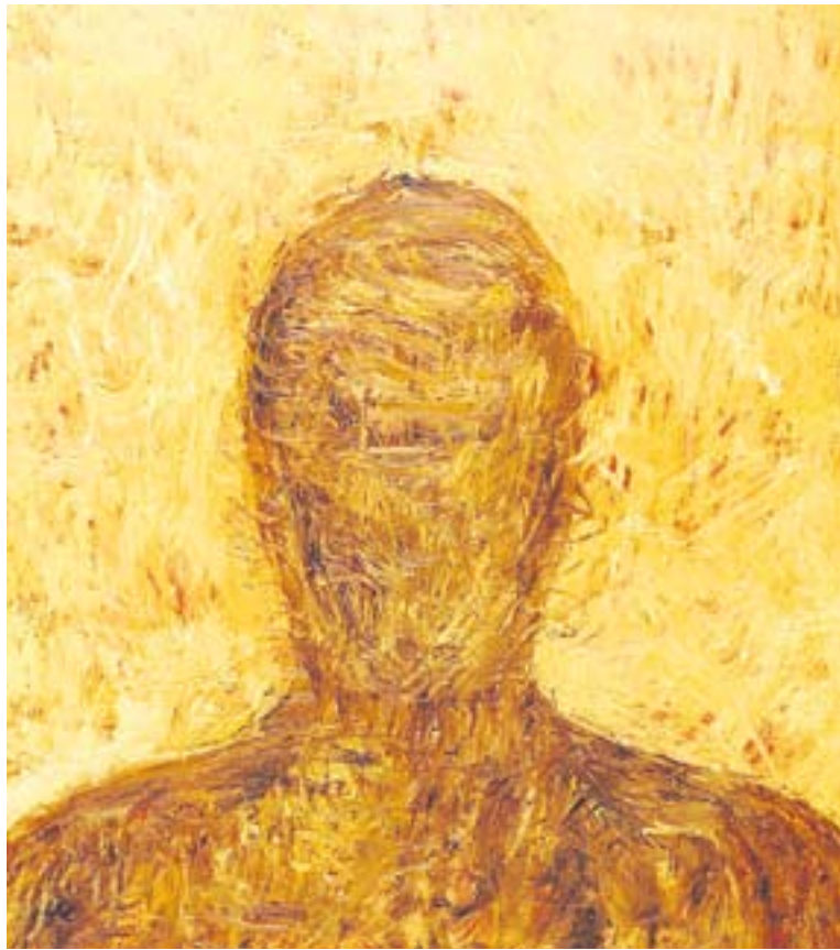
© 'Monòleg', quadre de la sèrie de Montse Barros. || CEDIDA

posició l'any 1976. Ha fet quadres de sèries de diverses temàtiques: de viatges, de paisatges, etc. "Els quadres que ara exposo ja els tenia mig fets, vaig viure aquesta trista experiència l'any 2003 i per això vaig fer la sèrie, per evocar el patiment dels malalts i familiars d'aquestes malalties".