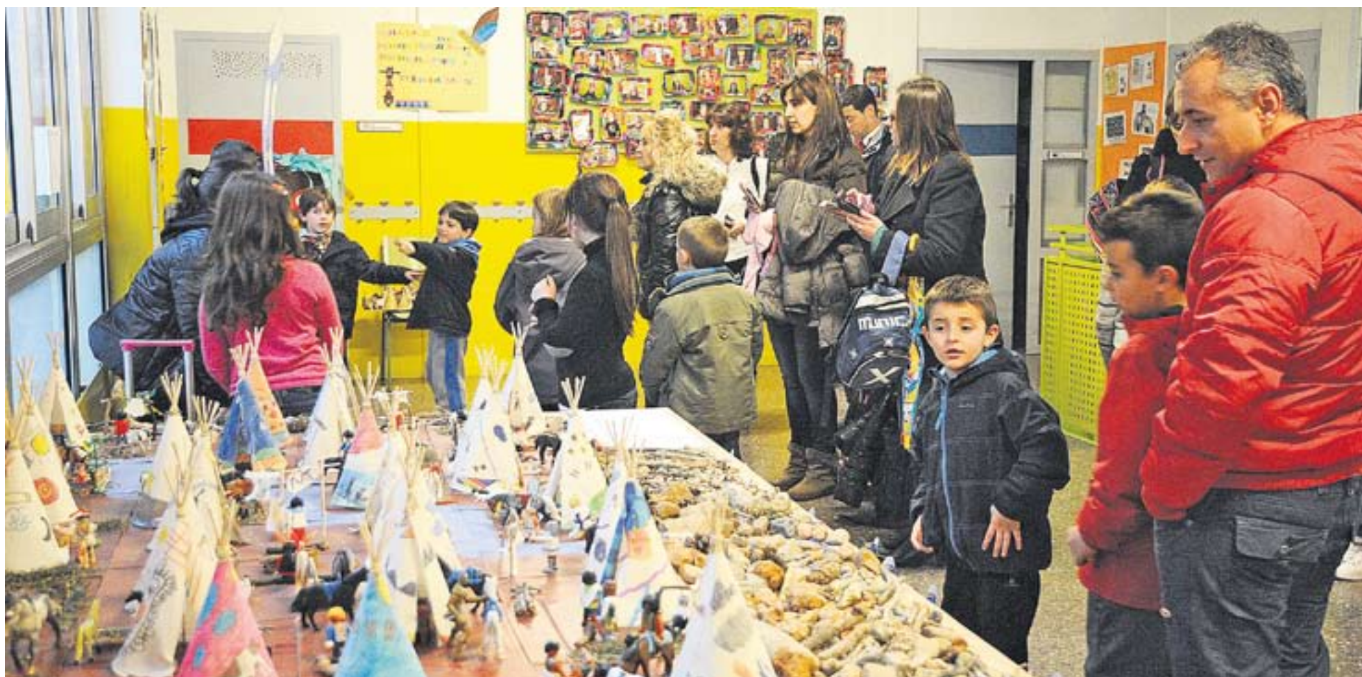
© Durant aquests dies, els pares i mares estan assistint a les jornades de portes obertes de les escoles de la vila, com el cas del Sant Esteve dilluns passat. || JOSEP GRAELLS