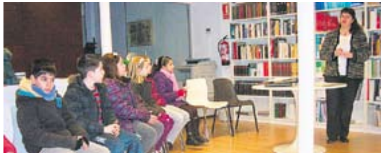
© Alumnes d'El Sol i la Lluna a l'Arxiu. || C.D.

han entrat al dipòsit on han après alguns mots propis de l'ofici d'arxiver: "Dins, veiem què és un compacte -on es guarda la documentació-, els nens l'obren, que els fa molta gràcia, i veuen com està guardada la documentació en les caixes. Llavors fem una pràctica on també coneixen el llenguatge arxivístic, com camisa, que és la carpeta on està la documentació, o la mòmia, que és el paper que informa que aquell expedient està en préstec".