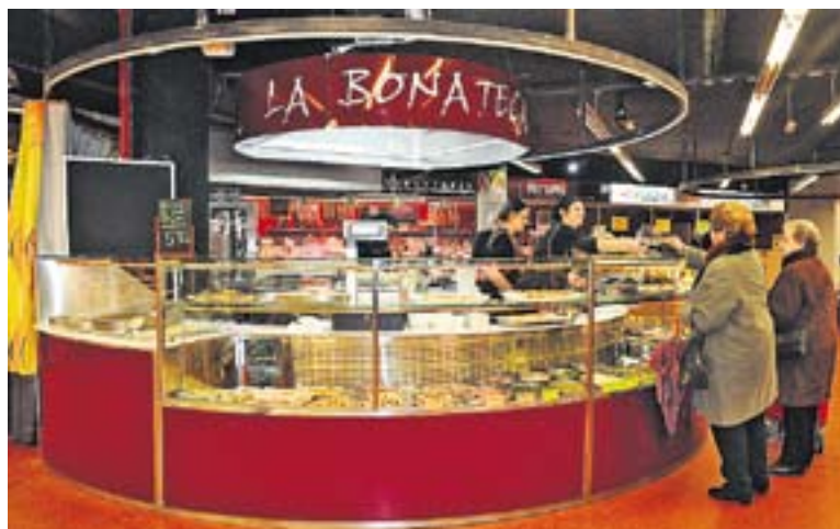
© La nova parada de La Bona Teca al Mercat municipal. || JOSEP GRAELLS

La parada està atesa per tres persones, quatre en els dies de més punta de feina, que solen ser els divendres i dissabtes. A La Bona Teca es pot trobar tot tipus de plats preparats “fets de verdures, pastes, peix, i carn a més de