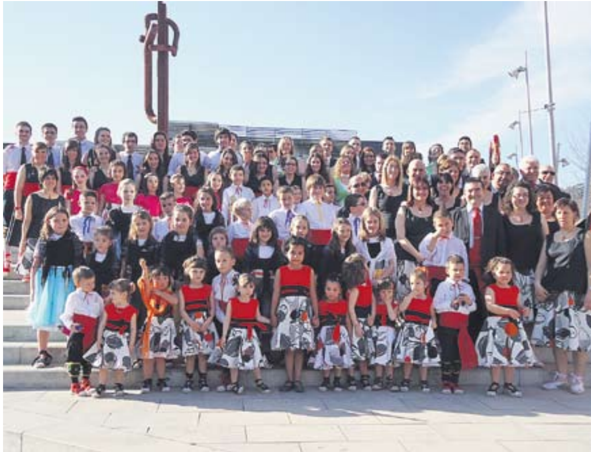
© Foto de conjunt dels balladors i balladores del Ball de Gitanes de Castellar. || BALL DE GITANES

En aquest sentit, en aquesta edició s'obrirà una porta nova perquè entri en aquest grup de danses tradicionals una colla més del Ball de Gitanes. Una colla que encara no té un nom concret i que té per objectiu fer-se gran, madurar i acabar