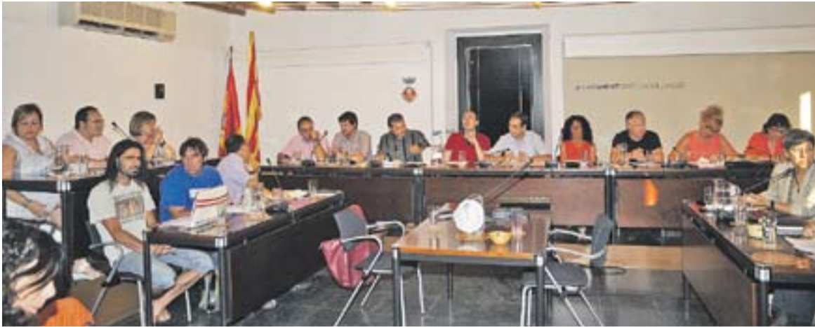
© Imatge del darrer ple de juliol, del passat dia 16. || JOSEP GRAELLS