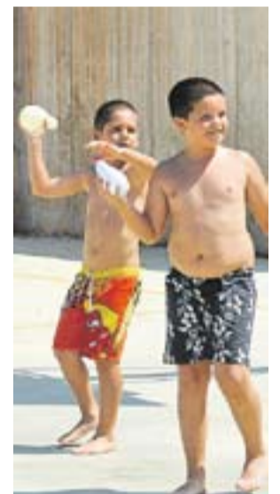
© Artcàdia i Esplai Sargantana. || JOSEP GRAELLS

2012: Per sorolls de veïns o vehicles la policia local ha intervingut més de 250 vegades