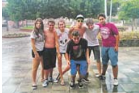
Sota la tempesta Autor: Òscar Moreno