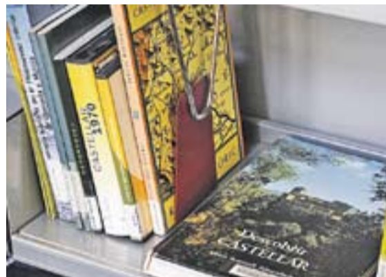
© Part del catàleg d’obres sobre Castellar que es pot consultar a la Biblioteca Municipal.