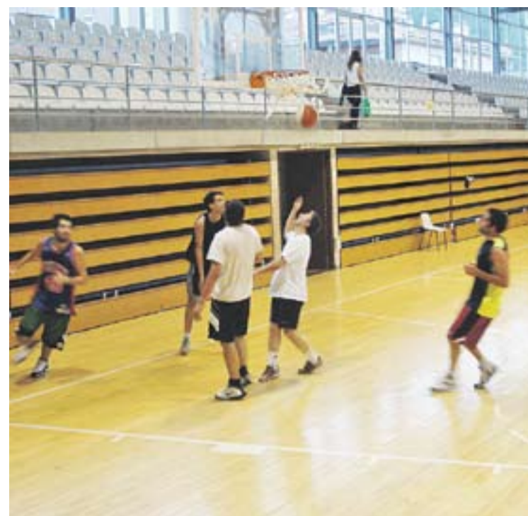
Un partit de la lliga social de bàsquet al pavelló Puigverd.