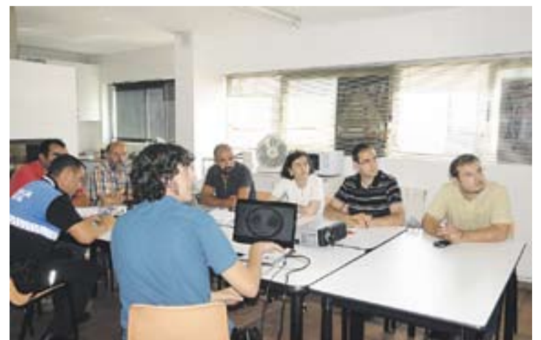
El simulacre va tenir lloc dimecres al Parc de Bombers Voluntaris de la vila.