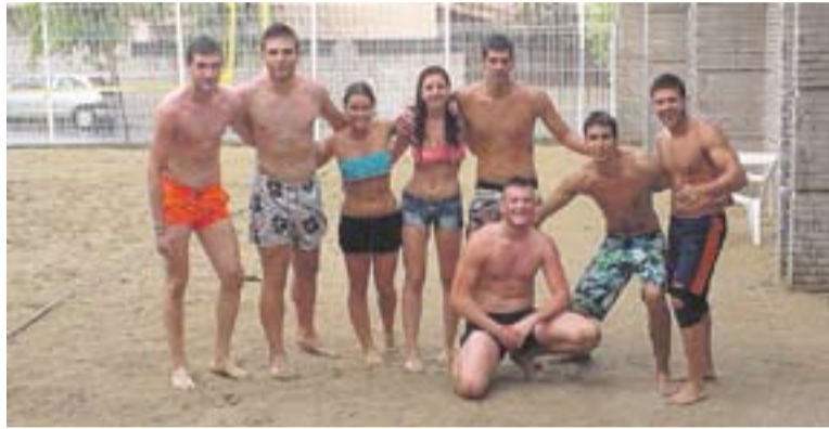
Els dos equips que van disputar la final del torneig de vòlei platja.

Després de diverses hores de fase prèvia i una ronda eliminatòria, la final va començar dissabte cap a les vuit del vespre i va estar molt igualada entre els dos equips. La pluja va fer acte de presència durant l'últim partit però no va afectar excessivament al desenvolupament de la competició.