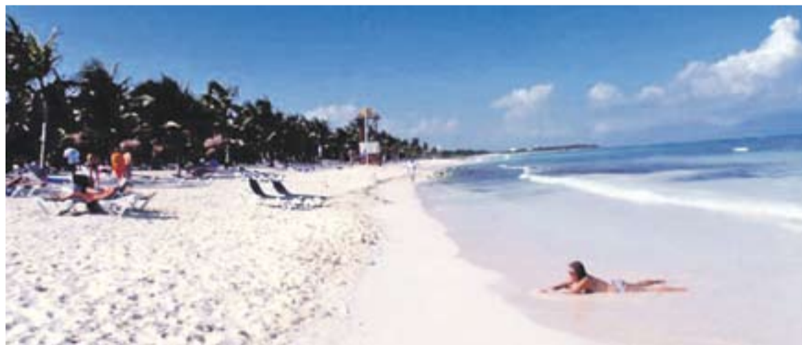
© Platja de la Riviera Maya. || MÍRIAM XIPELL