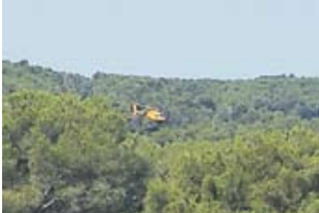
Inspecció línies alta tensió

Envia'ns fotos fetes amb el mòbil: lactual@castellarvalles.cat