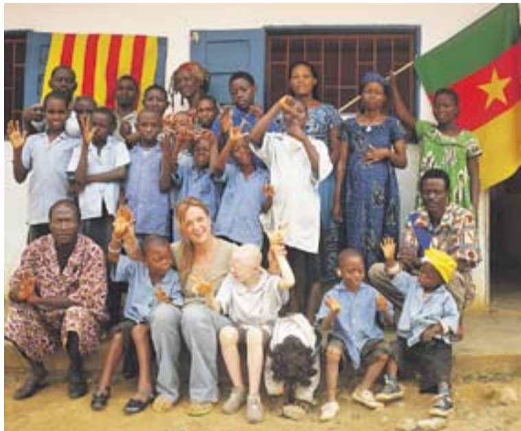
© L'escola de sords IMSHA a Camerun -en una imatge d'arxiu- rebrà ajut. || CEDIDA

Un quart projecte que també rebrà subvenció municipal és el de l'entitat UnomasUno+ a Gàmbia titolat "Desenvolupament agrícola