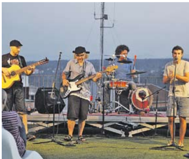
El integrants d'Humarea a la terrassa d'El Mirador.

Més de 60 persones van seguir dilluns passat el darrer concert de les Nits d'Estiu a la terrassa d'El Mirador. En aquesta ocasió, el grup convidat era Humarea, una proposta d'arrels flamenques procedent de l'extraradi de la Barcelona que no defuig tampoc el pop. De fet, Humarea va alternar temes propis de la formació amb versions, entre les quals va destacar la mítica 'Volando Voy', del cantant i compositor Kiko Veneno, però que va fer immortal al cantautor andalús Camarón de la Isla. +