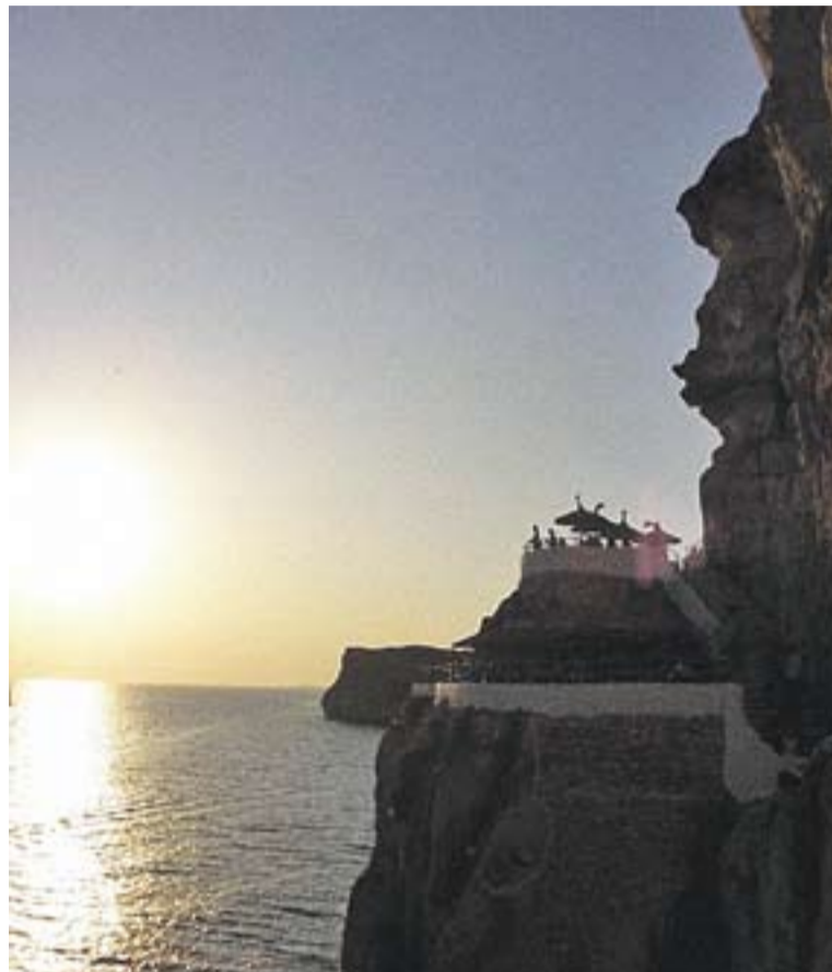
© Capvespre a la cova d'en Xoroi a Menorca. || ÀNGELA GÓMEZ

VIU L'ESTIU AMB L'ACTUAL.CAT || Si voleu compartir l'estiu amb L'ACTUAL, envieu-nos una foto de les vostres vacances a lactual@castellarvalles.cat i la publicarem al nostre portal web www.lactual.cat . Si ho preferiu, podeu enviar-nos una foto d'altres estius que us hagin marcat especialment, postals, i en definitiva, records que us acompanyen cada cop que arriben les vacances. En qualsevol cas, no us oblideu d'enviar-nos també un breu text explicatiu que acompanyi la foto. ➔