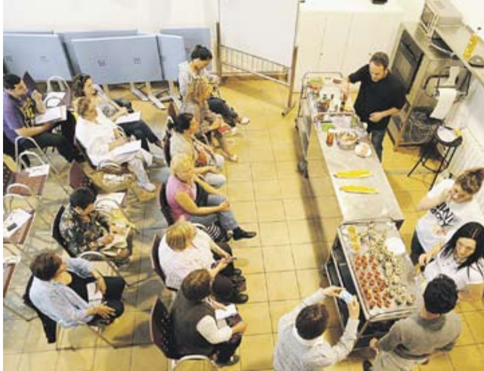
© Alfonso Fernández explica receptes per no malbaratar aliments en un taller als Safareigs. || J.G.

A banda d'oferir una programació dedicada a la gastronomia, una de les finalitats era establir sinèrgies amb comerciants de la vila. “Hem treballat amb botigues i productors Castellar i dels voltants i això és fantàstic. El que més em satisfà, a banda d'aquestes col·laboracions, és trobar-me la gent que ha participat pel carrer i que em comentin que el sopar