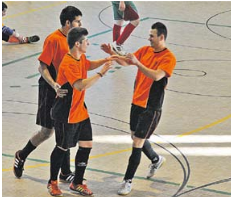
© Els jugadors en el darrer partit a casa de la temporada passada. || J. G.

Per ara el sènior del FS Castellar encara no ha fet incorporacions i s'espera a la tornada de vacances per fer els pertinents fitxatges. El tècnic Rubén Jiménez vol incorporar com a molt tres jugadors, un per posició, però no es decidirà fins que l'equip torni de les vacances d'estiu. Els entrenaments de pretemporada s'iniciaran el 26 d'agost. ➔