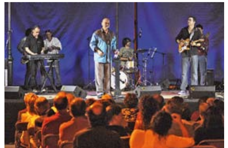
© 200 persones van assistir al concert de La Ruta. || J. GRAELLS