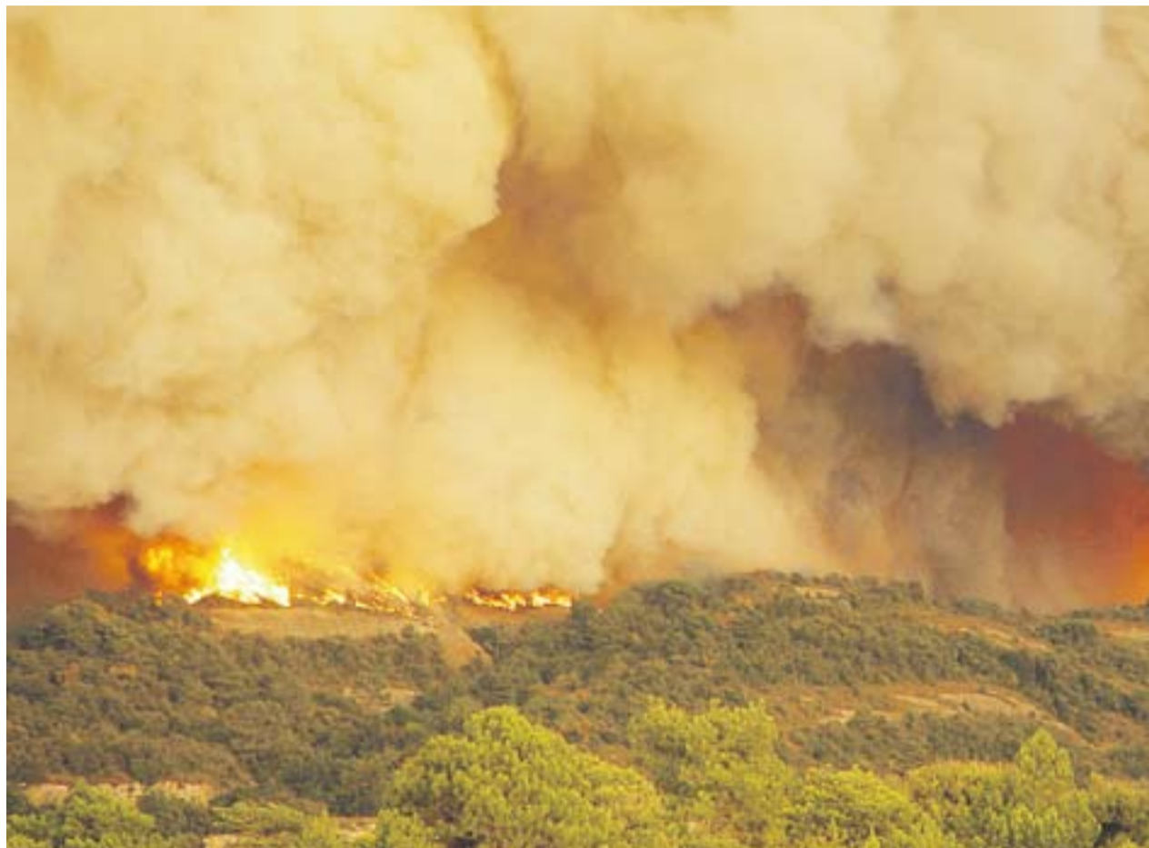
L'incendi del 2003 es va estendre ràpidament a causa de les condicions meteorològiques

Casajuana. Durant la nit, l'incendi es va estabilitzar, però dilluns es va anar revifant. Desgraciadament es van trobar cinc persones d'una mateixa família que van morir asfixiades pel fum de l'incendi. Rovira assegura que la vida no et prepara per això: "Va ser definitiu i va superar qualsevol suposició, qualsevol cosa que jo podria preveure o preparar... Mai, mai podia pensar en això. I trobar-te que dos