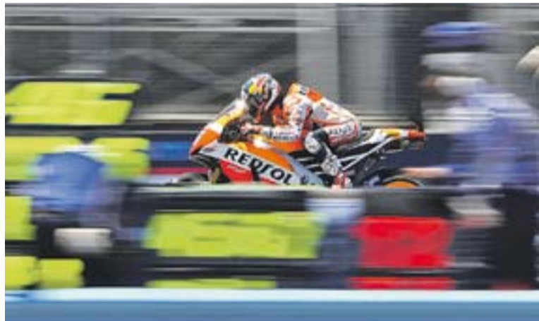
Dani Pedrosa durant la cursa de la Laguna Seca, diumenge.

Durant aquesta setmana el pilot de Repsol Honda s'ha fet unes