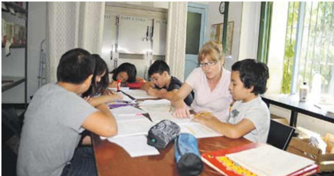
Els alumnes repassen continguts amb una professora de reforç a Cal Gorina.

Una desena de mestres de Castellar fan classes de reforç durant el juliol