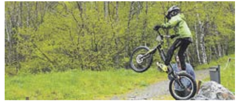
© Alan Rovira en una prova d'aquesta temporada. || CEDIDA

D'aquí a quinze dies el castellarenc es farà més proves i se sabran més detalls de la seva condició física de cara al GP d'Indianàpolis. Ara el castellarenc té 16 punts menys que Marc Márquez i 10 més que el mallorquí Jorge Lorenzo a la general del campionat. †