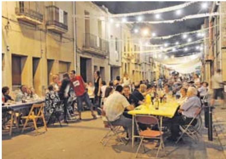
Sopar de veïns al carrer Sant Jaume en una edició anterior

Demà, a partir de les 18 h, els més petits podran gaudir dels jocs infantils. A les 21 h tindrà lloc el sopar de veïns i a les 23 h s'ini-