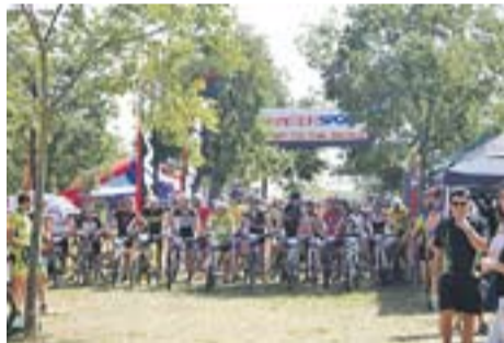
4 hores de resistència en BTT