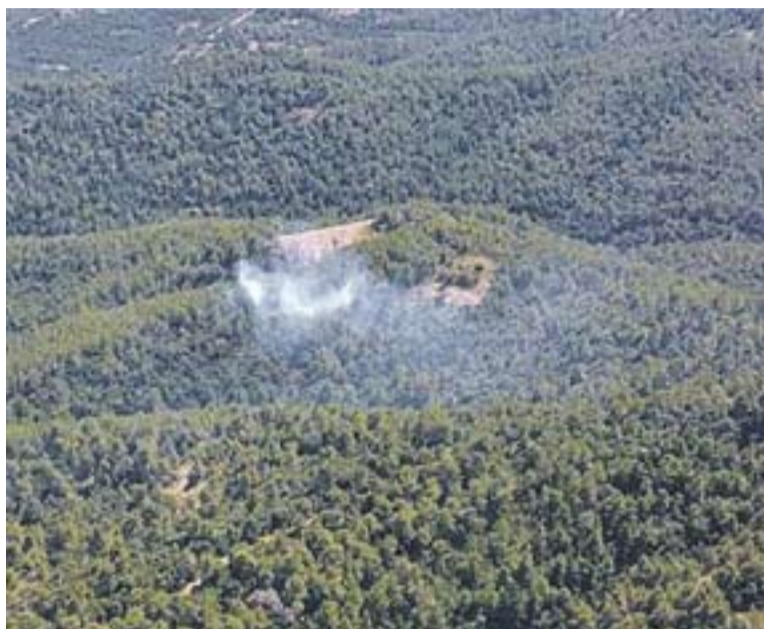
Fum a la zona de la canal de Santa Agnès, el passat 29 de juliol.

La canal de Sant Agnès és un lloc de difícil accés, a prop de la B-124, i per tant va ser necessària l'actuació de cinc dotacions aèries de Bombers que es van sumar a una desena de dotacions terrestres en la lluita contra les flames. Fins al punt calent s'hi van desplaçar també una dotació dels Bombers Voluntaris de Castellar i també de Matadepera, a banda d'efectius d'ADF. +