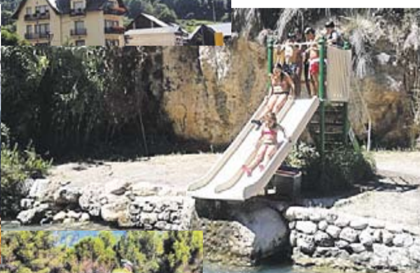
MONTANEJOS Dolors Castañé