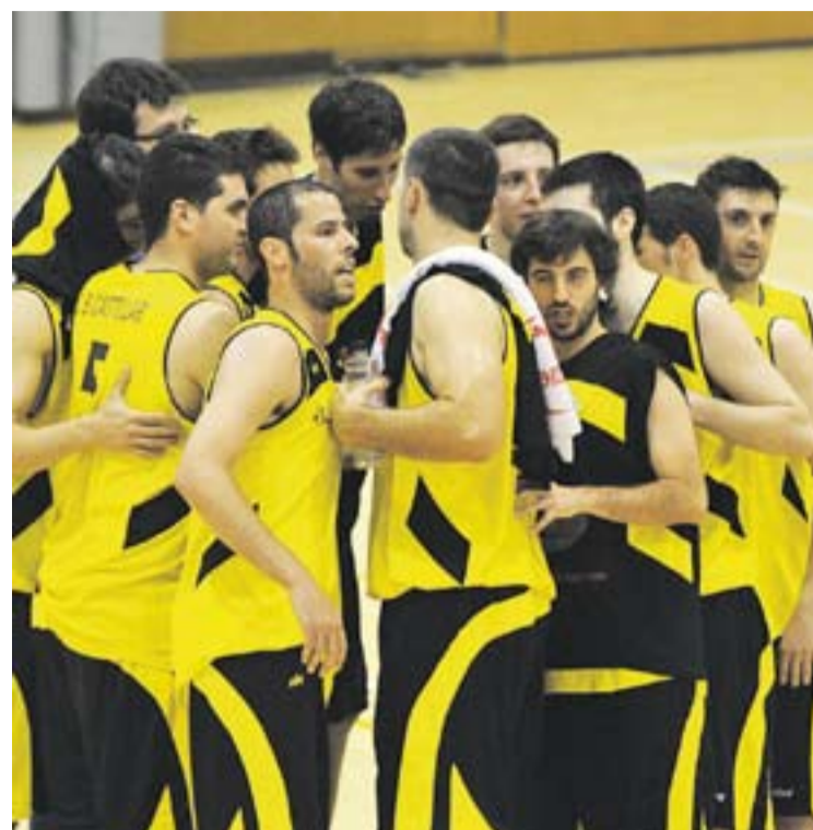
© L'equip, en una partit de final de la temporada passada. || JOSEP GRAELLS

Pel que fa al tercer i quart lloc, els Preminis Fathers es van desfer del CB Sant Llorenç tot i la sensible baixa de Canalís. Els llorençans havien fet una sortida fulminant, comandats per Juanca, amb 3 triples al primer quart. Anteriorment, els No Me Pises van adjudicar-se el cinquè lloc davant els Cadetillos, tornant-los la derrota patida en lliga regular. +