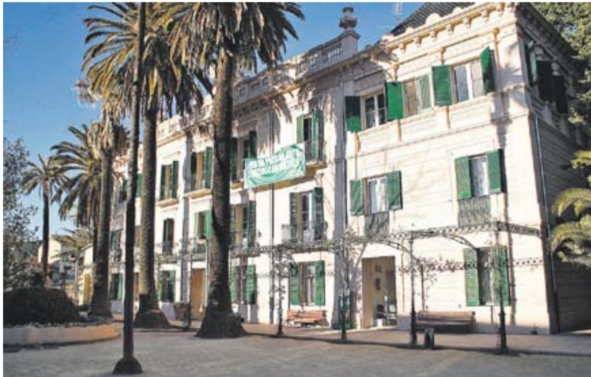
Façana de l'Ajuntament al Palau Tolrà

Quant a l'educació, els ajuntaments només tindran l'obligació d'oferir solars per fer-hi centres escolars i mantenir-los. “L'educació és el gran ascensor social que tenen moltes famílies, i l'Ajuntament deixarà de prestar aquest servei. Què passarà amb l'Escola d'adults, l'Escola de música, les escoles bressol i les beques? Hi ha