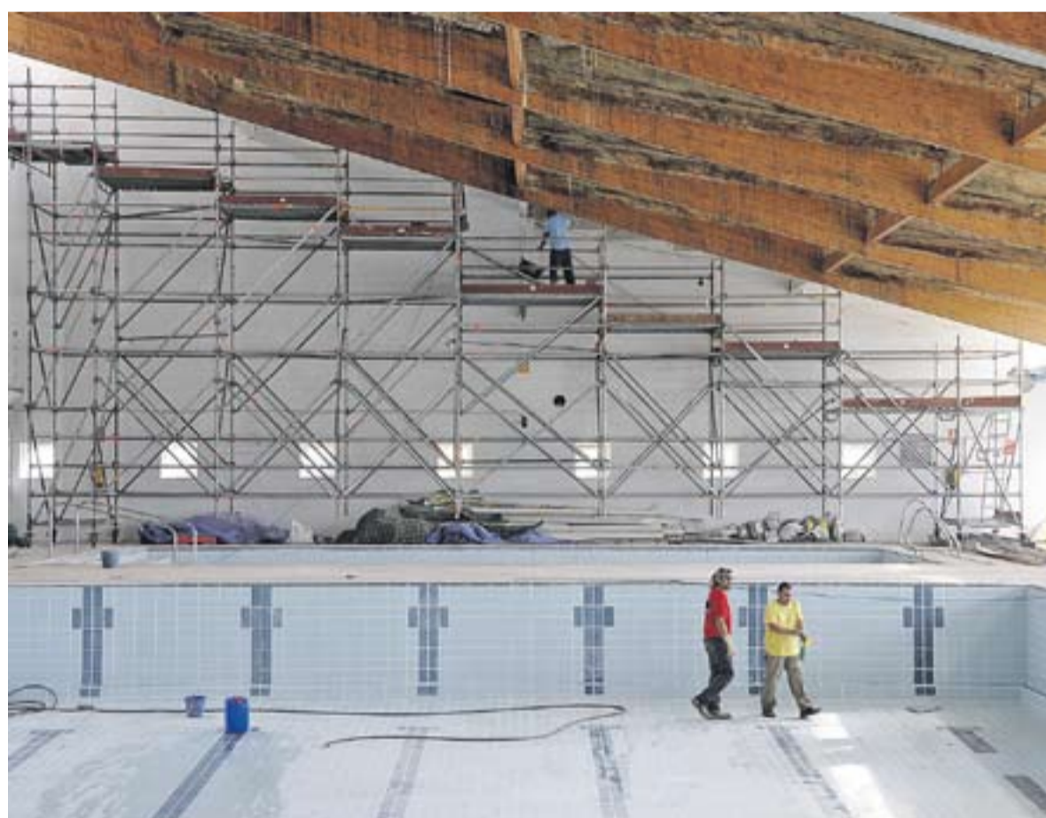
⦿ Aquesta setmana s'han fet treballs de sanejament i pintura a les bigues i feines de reparació al vas de la piscina. || J. G.