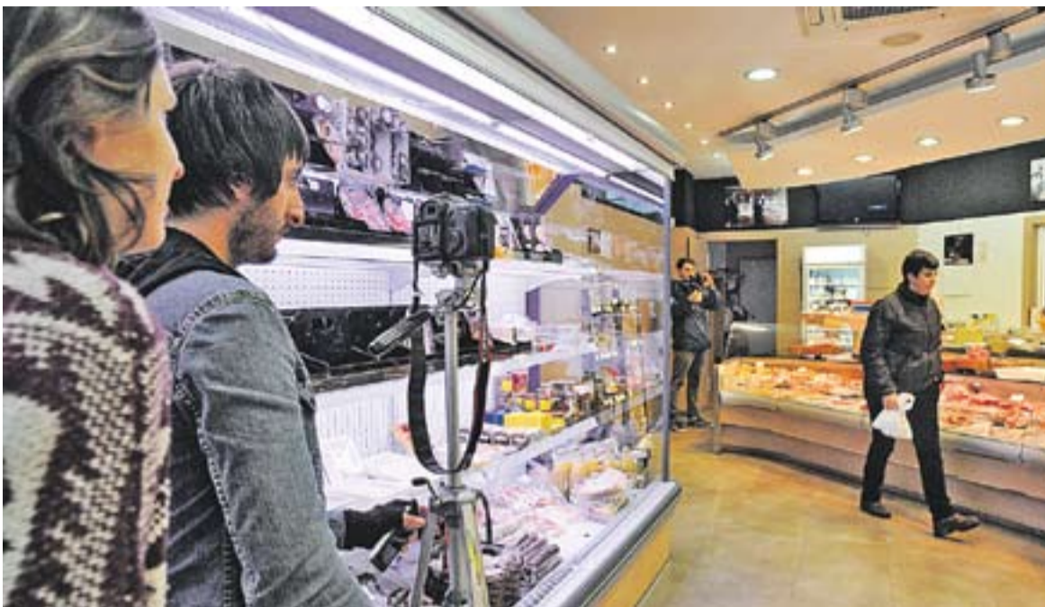
Una imatge del rodatge a Càrnicas Merche del film 'The Tail of Two & a Half'.