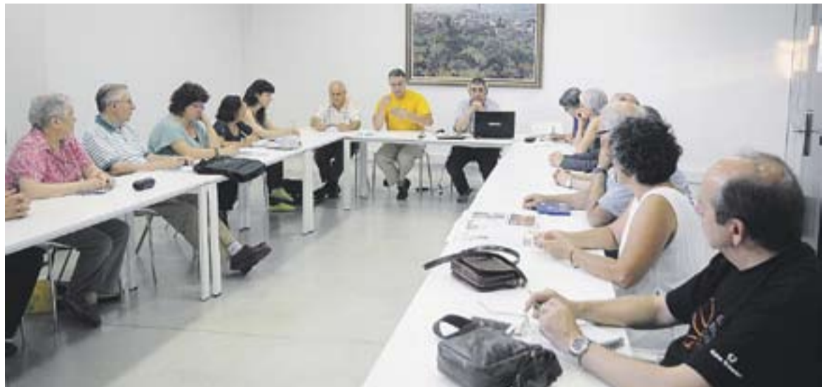
Organitzadors de la cadena humana de Castellar en una reunió de finals de juliol.