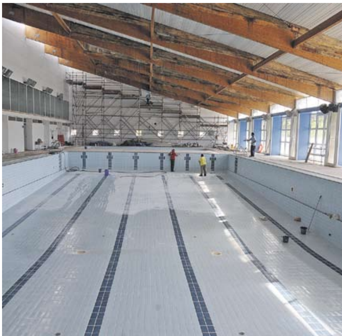
Imatge de les obres a la piscina coberta d'aquest dimarts passat.

Segons els terminis previstos, els espais que quedaran inhabilitats per al seu ús reprendran el seu funcionament durant la segona quinzena del mes de setembre, una vegada s'enllesteixin