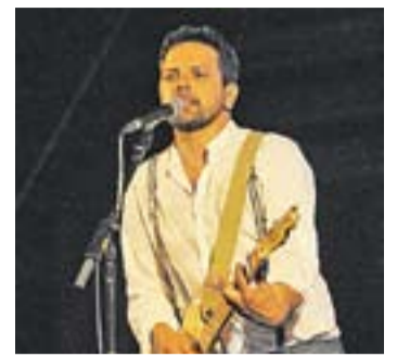
© Andreu Rifé. || J. G.