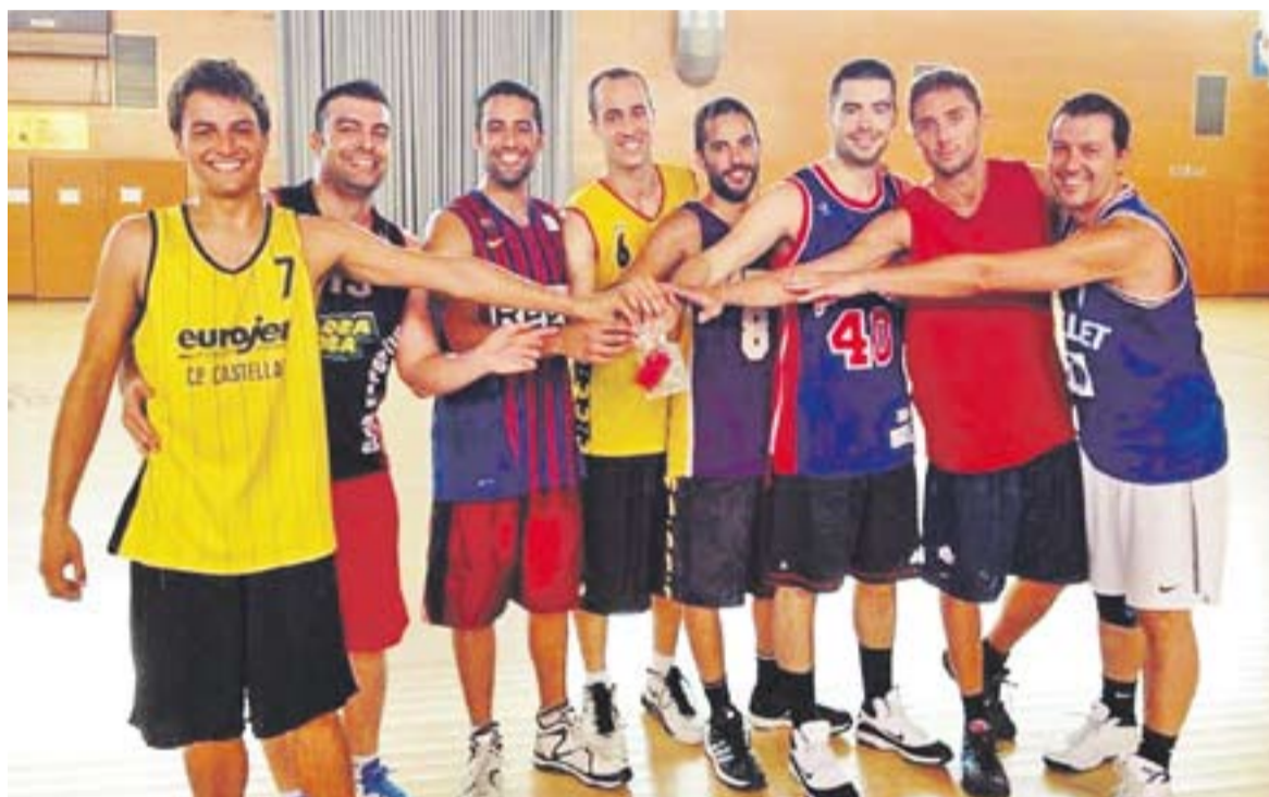
Els jugadors de l'Allavontens, campions de la primera edició de la lliga social d'estiu de bàsquet.

El Club Bàsquet Castellar tornarà a organitzar la competició, que aquest juliol es va emportar l'Allavontens en la seva primera edició