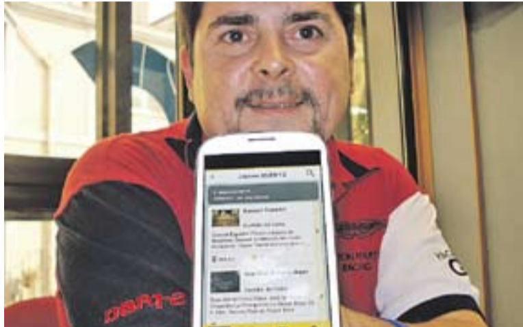
© Cruells, de Xopik, mostra l'aplicació de la Festa Major. || J.R.

Per accedir a aquests continguts extres, només cal baixar-se a través de les plataformes d'Android i App Store l'aplicació de Xopik on, a més dels comerços, hi ha la nova subcategoria