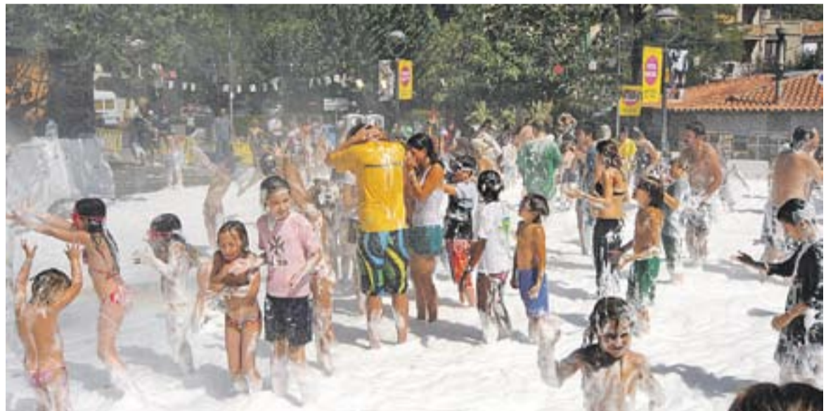
© El Correfoc clourà dilluns la Festa Major. Dilluns al matí també tindrà lloc el bany d'escuma a la plaça. || JOSEP GRAELLS