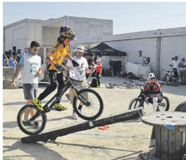
© Alan Rovira en una prova d'aquesta temporada. || CEDIDA