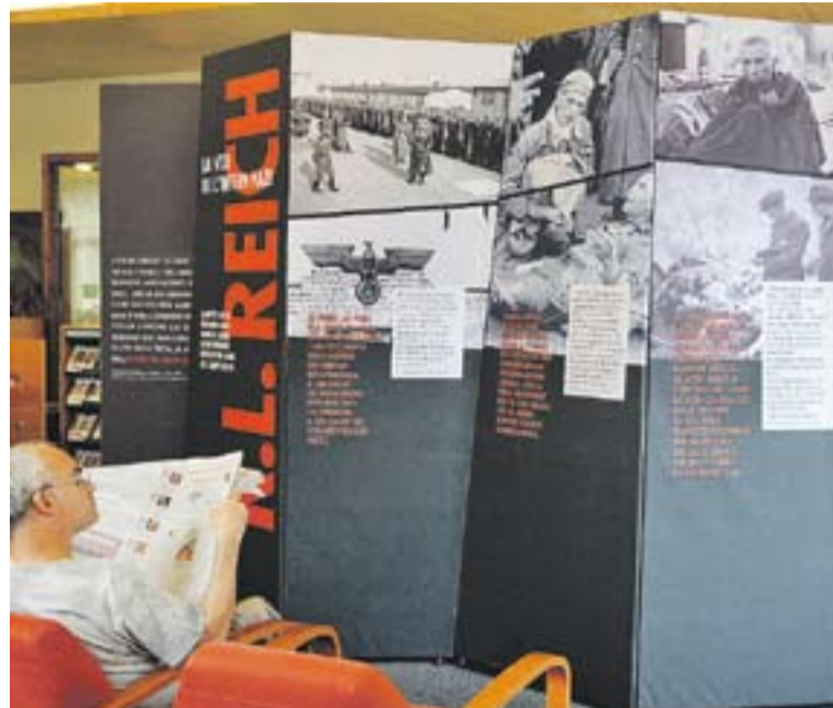
Una imatge de l'exposició 'K.L.Reich. La veu de l'infern nazi'.

A l'exposició, que consta d'un tòtem introductor de presentació i un desplegable de 9 plafons que resumeix els punts més rellevants de l'obra d'Amat-Piniella, es poden veure crues imatges acompanyades de fragments del llibre, on s'explica el dia a dia d'una multitud amorfa, grisa, abandonada, desferres humanes que batallen per un tros de pa brut com les seves pells. La sàdica crueltat imposada en els camps de concentració van convertir els presoners en espectres humans. Una autèntica tragèdia provocada per l'ésser humà. Per l'estúpida i mesquina de l'ésser humà. L'exposició marca el punt de partida de tot un reguitzell d'actes commemoratius