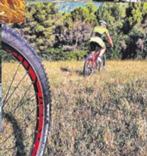
BTT A CASTELLAR @nectus1