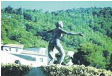
La dona acollidora Autor: Maite Ferrer

Envia'ns fotos fetes amb el mòbil: lactual@castellarvalles.cat