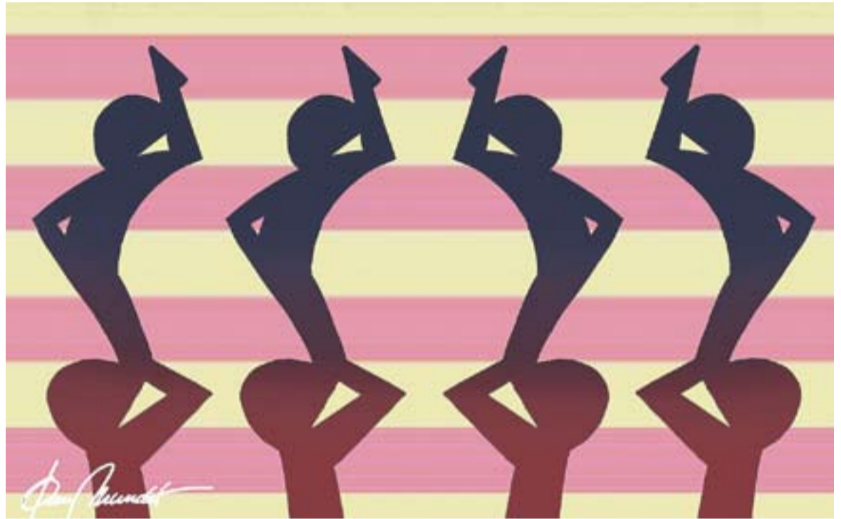
© Tots fent pinya. || JOAN MUNDET

No crec que hi hagi més perill que practicant qualsevol altre esport.