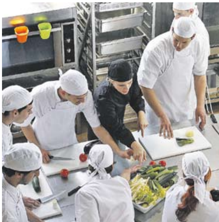
© Els Safareigs ja han acollit aquest any un curs de cuina de COPEVO. || J. G.

Els PQPI són uns estudis homologats per la Generalitat, que tenen per objectiu proporcionar als nois i noies que no han acreditat l'ESO una formació bàsica i professional que permeti una inserció social i laboral satisfactòria, i alhora possibilitar la seva