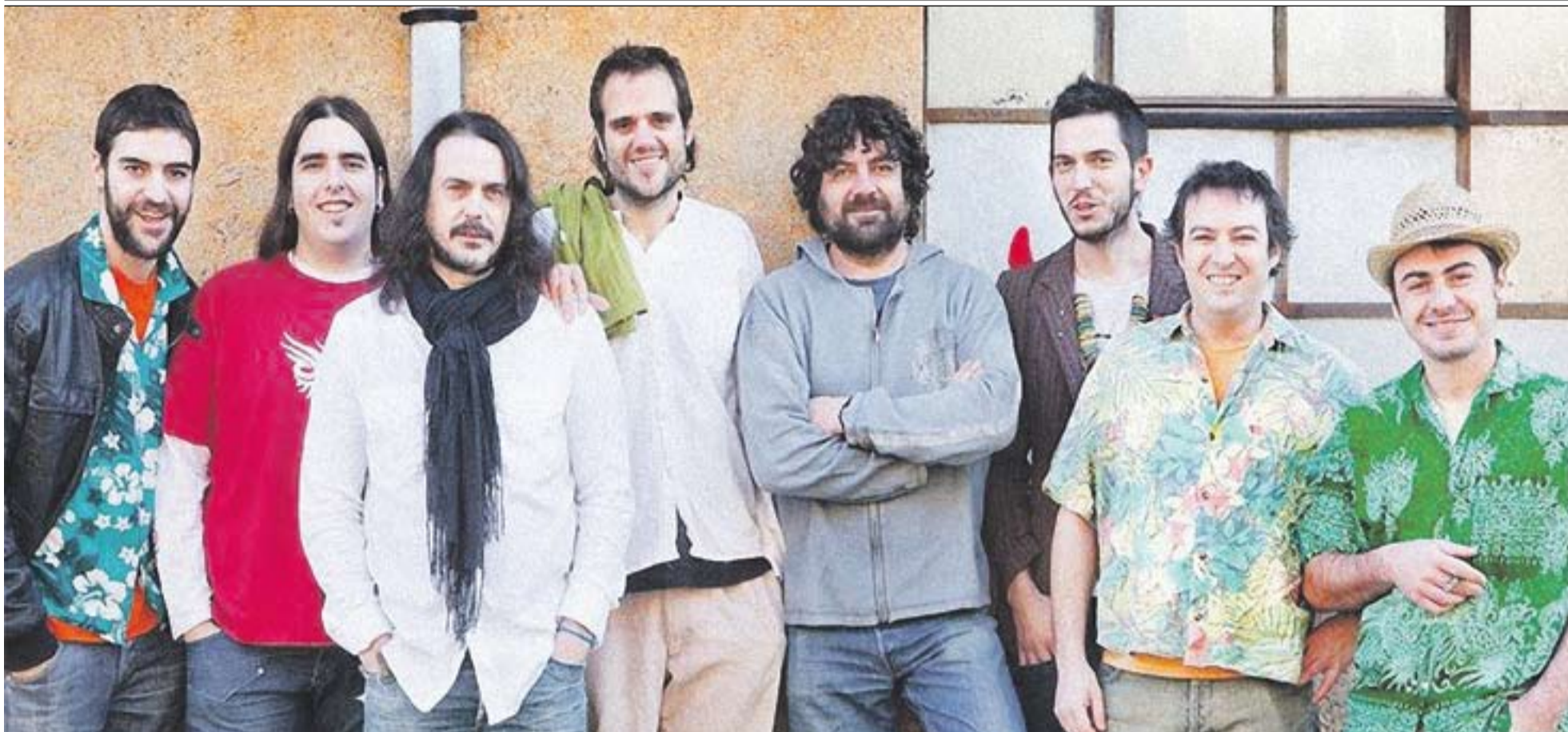
© Músics del grup sabadellenc Rauxa. Actuen divendres a les 23 h a la plaça Doctor Puig de Sant Feliu del Racó . || CEDIDA