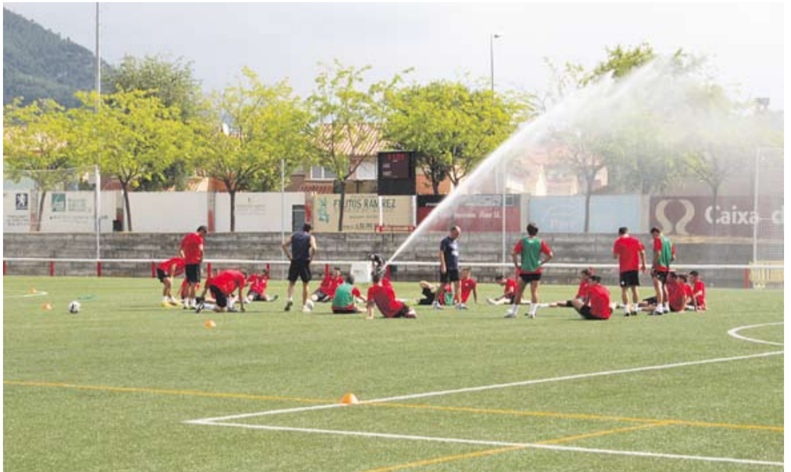
© Els jugadors de la Unió Esportiva Castellar van fer una sessió preparatòria fins i tot el dia 15 d'agost.