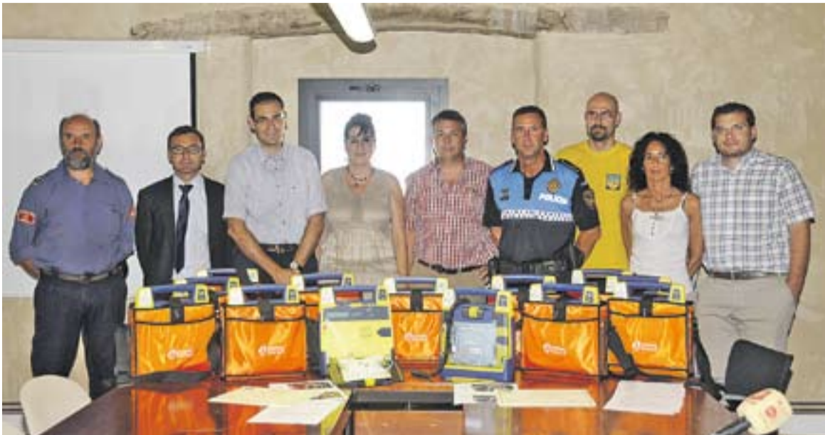
Els desfibril·ladors es van lliurar el passat 31 de juliol.