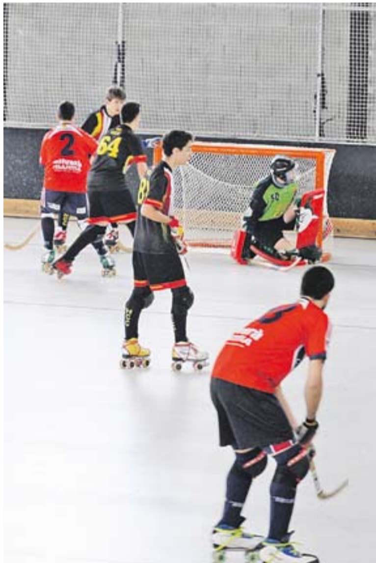
© Una acció de la temporada passada.