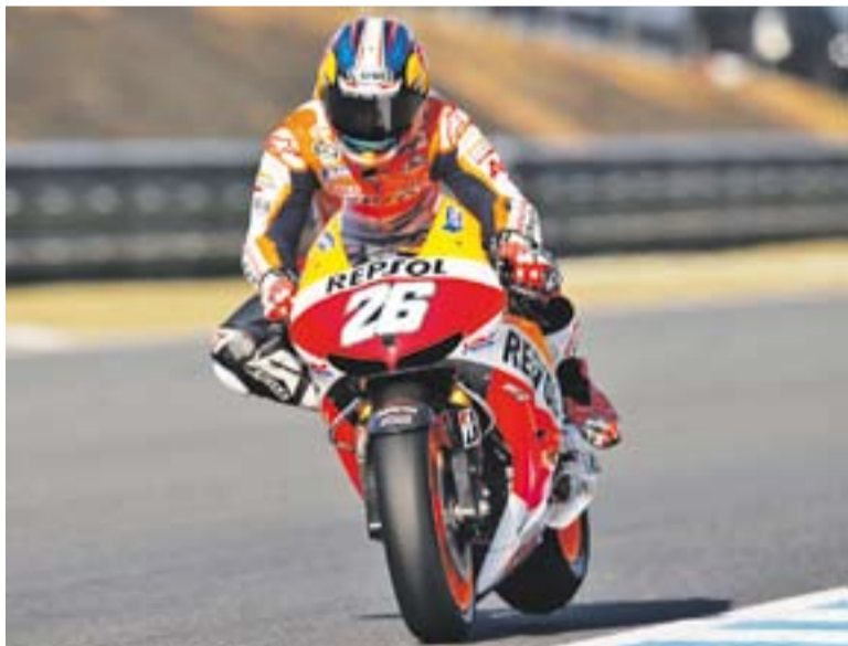
© Pedrosa, en una frenada durant la cursa del GP del Japó a Motegi. || REPSOL MEDIA

En l'última prova, el castellarenc espera fer una bona cursa per a acabar amb bon sabor de boca un campionat que no ha acomplert les seves expectatives. † || A. SAN ANDRÉS