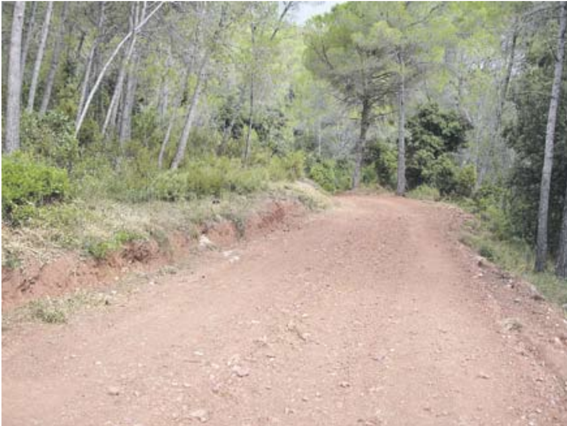
© Camí de la serra de Pinós, arranjat pels ADF. || M. MUNTADA

MEDI AMBIENT | ARRANJAMENT CAMINS FORESTALS