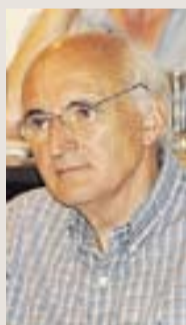
Josep Carreras Portaveu de CiU

"Creiem que qui més té, ha de pagar més que qui menys té. I això ho permet l'IBI. Tan sols una dada, un 10% dels rebuts, assumeixen el 40% de l'impost"