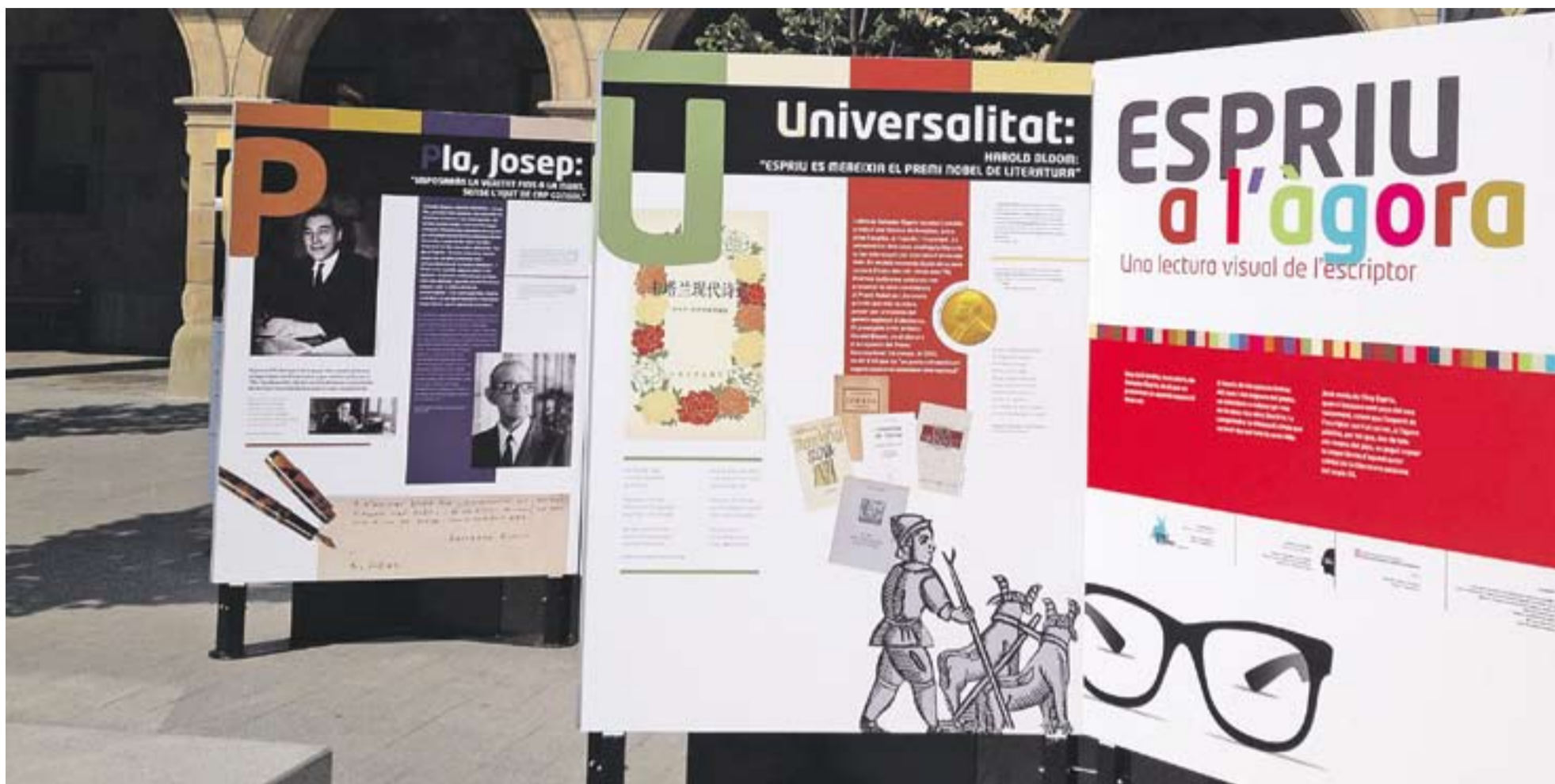
© Plafons que conformen l'exposició visual dedicada a Salvador Espriu titulada 'Espriu a l'Àgora' que s'exposa a Castellar fins al 15, ideada, dissenyada i produïda per Reunió de Papaia Projectes Artístics. || CEDIDA