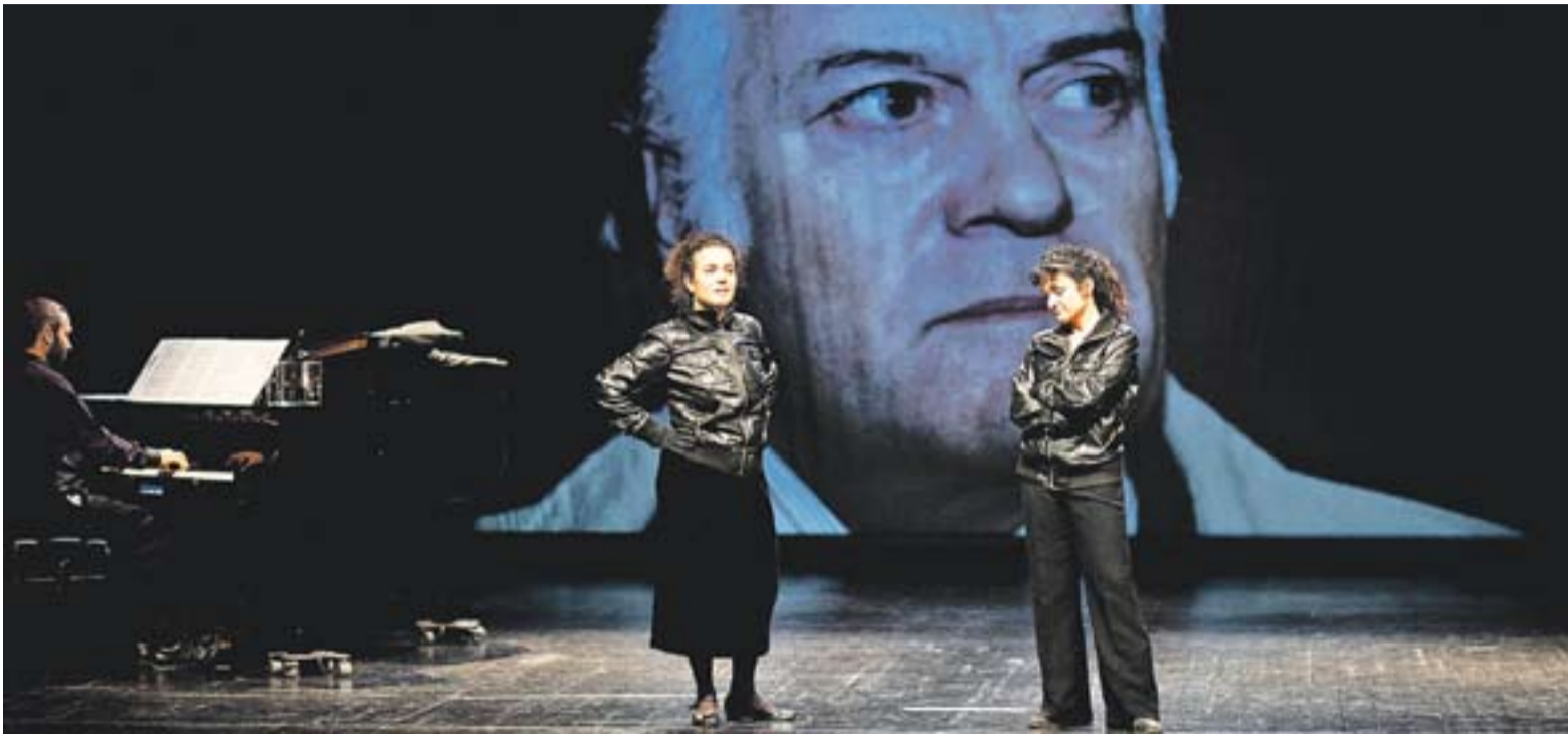
Una escena de l'espectacle de 'Les Dames de Charlie' a l'Auditori Miquel Pont el cap de setmana passat.