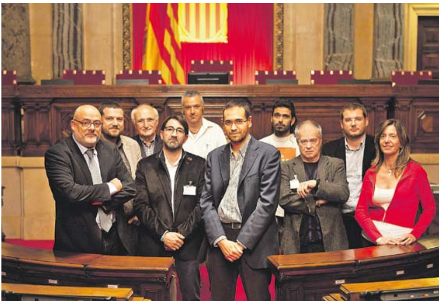
© L'alcalde de Castellar, Ignasi Giménez, amb els portaveus dels grups municipals i els diputats vallesans de CiU, PSC i ERC, a l'hemicicle del Parlament. || Q. PASCUAL