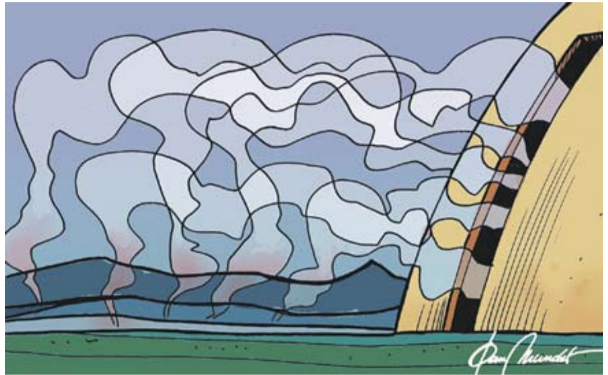
© Palau guarda fums. || JOAN MUNDET

sol, tafaneja lliurement per totes les llars properes, entrant en silenci per finestres, xemeneies i per qualsevol escaleta, deixant una invisible targeta de visita que descobrirem per la seva ferum. La roba estesa també el delata. El fum va allà on el porta el vent i, segons la pressió atmosfèrica, sovint