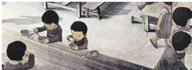
Fotograma del documental que es podrà veure el dia 7 de novembre.

Els dilluns de 19.30 h a 20.30 h i de 21 h a 22 h, i els dimarts de 15.15 h a 16.15 h s'estan duent a terme classes de ioga que encara tenen obertes les inscripcions a anasaperas@hotmail.com . Cal Go-