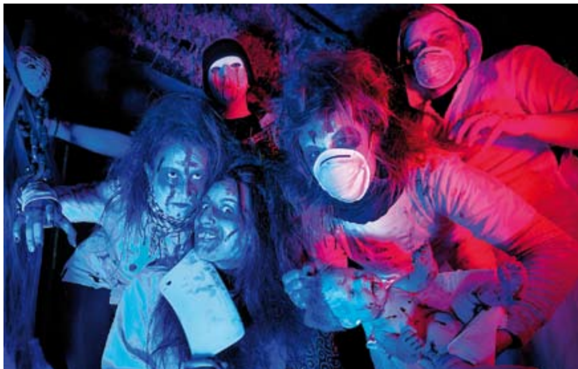
Els actors i actrius del túnel del terror van posar els peus de punta als 160 visitants.

La cloenda de la programació especial de Castellar Jove arribarà demà amb la Festa Halloween a la Sala Blava de l'Espai Tolrà que començarà a les 21 hores i s'allargarà fins la 1 de la matinada. La festa és temàtica, de terror, i cal anar disfressat per assistir-hi. La Sala Blava oferirà servei de guarda-roba a banda d'un 'photocall' on captar les millors disfresses, que al final de la nit de dimecres, tindran premi. De moment ja s'ha distribuït 250 entrades.