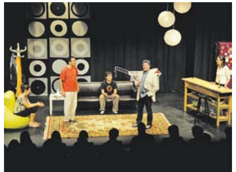
Moment de l'obra 'Burundanga' en la passada edició.

"El públic no està esperant aplaudir al final de l'espectacle, sinó que interacciona constantment amb nosaltres". Tant el Pau com la Carmina animen els espectadors a participar, ballant o responen preguntes. "En aquesta ocasió, com que l'espectacle és a l'Auditori, el públic no ballarà però sí que volem que participi activament amb nosaltres". Un dels punts forts de 'L'ocell d'argent' també és la narració. "Nosaltres creiem molt en la història, els nens s'enganxen molt". +