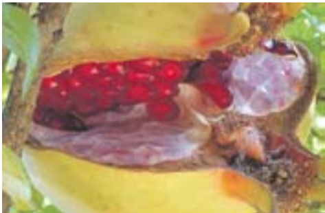
Magrana del Brunet Autora: Carme Padrisa

Envia'ns fotos fetes amb el mòbil: lactual@castellarvalles.cat