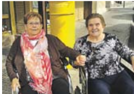
Dues belles amigues de fa temps