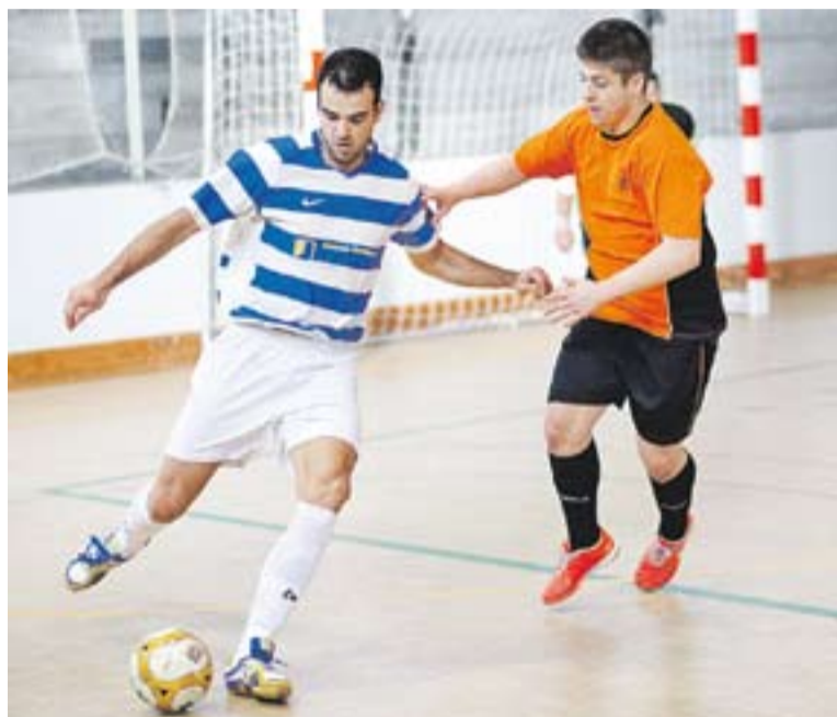
Una acció del partit del FS Castellar contra el Balsareny.