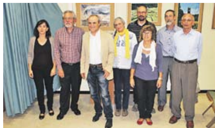
© Les directives entrant i sortint, juntes, després de l'assemblea. || M. CORNET

enganyosa (7-3) a la pista del Sant Joan, en un partit que a la mitja part ja perdien 4-0. Tot i les nombroses ocasions, el primer gol no va arribar fins a deu minuts per al final, ja amb 6-0 al marcador, obra d'Antonio Morillas. Els de Les Fonts, però, encara van tenir temps de fer el setè. El 7-2 (Morillas, una altra vegada) i el 7-3 (Godoy) ja van ser una anècdota.