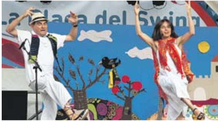
L'espectacle 'L'ocell d'argent' de la companyia Bufanúvols.

'L'ocell d'argent' és un espectacle que Bufanúvols va estrenar a la Festa Major de Gràcia de l'any 2012. "A més, és un espectacle que també funciona molt bé per a les escoles perquè és molt pedagògic, es treballen molts valors", incideix Tarruell. També s'hi