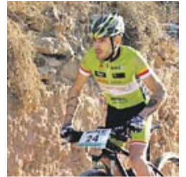
© Un dels participants. || CEDIDA