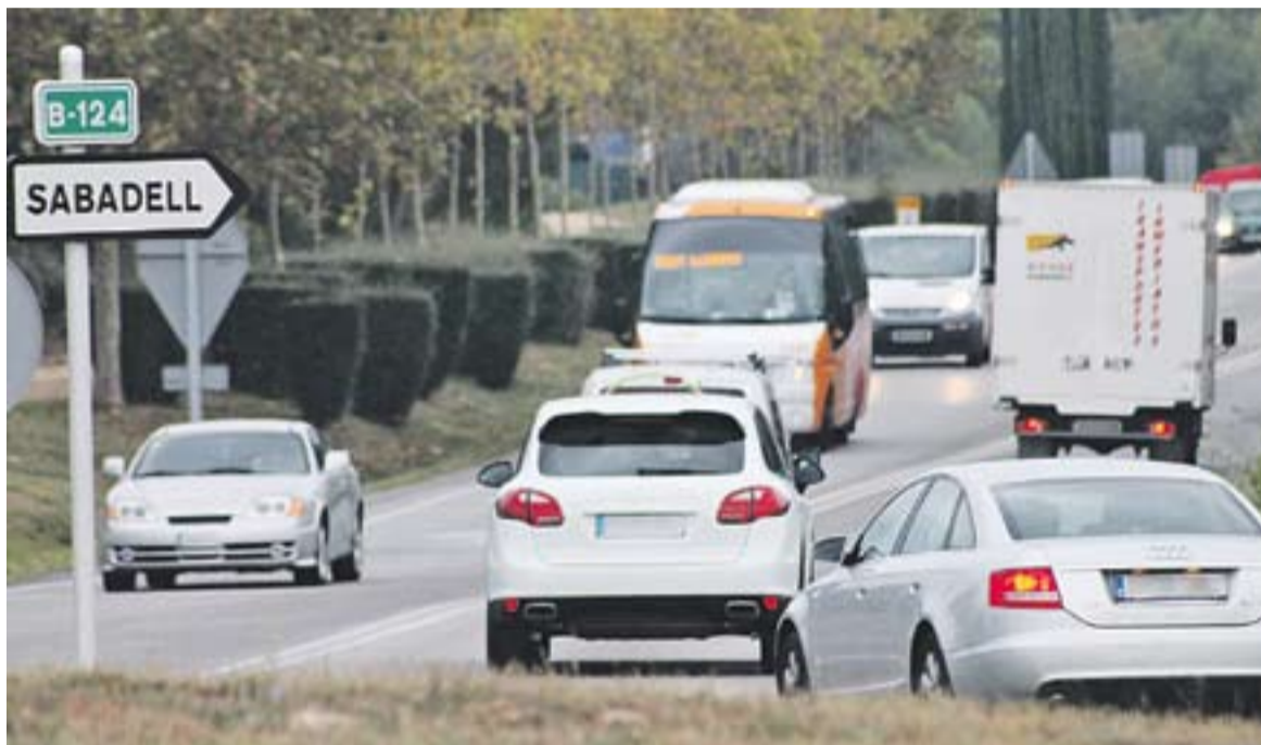
© El principal trajecte, en un 46,7% del casos, és entre Castellar i Sabadell i la corresponent tornada || Y. CALVO

En el conjunt de desplaçaments, més de la meitat dels entrevistats, un 51,3%, obeeix a motius ocupacionals -anar a la feina, estudis o gestions de feina- mentre que la resta és per motius personals -oci, diversió, espectacles, gestions personals o la visita d'un amic o familiar-. Sabadell és el principal municipi de destinació i tornada. "És un fet bastant evident que la