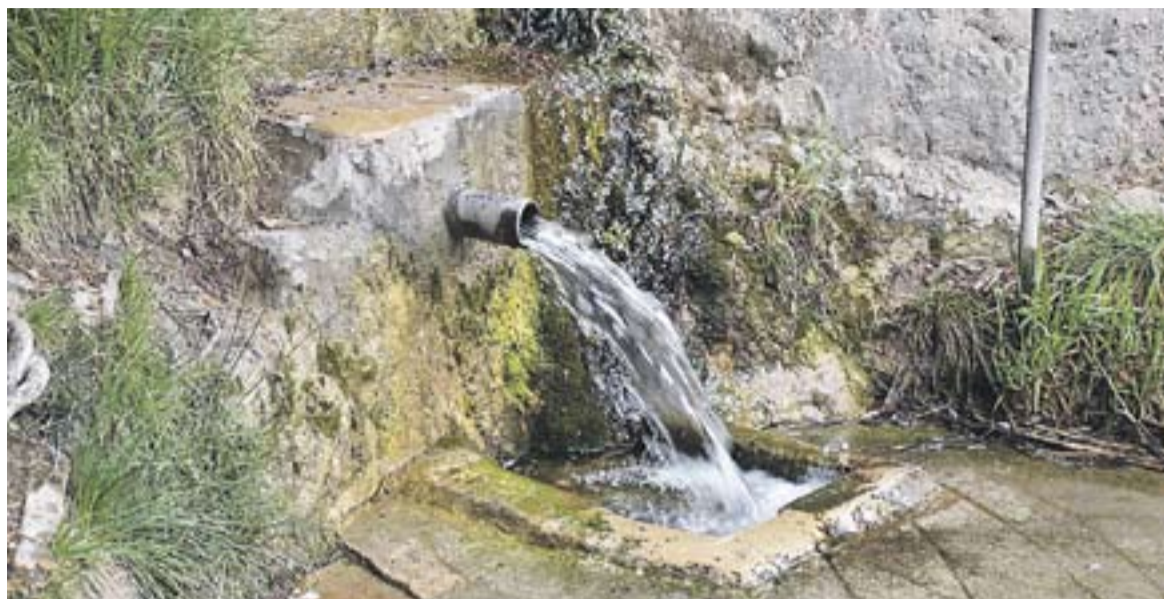
© Una foto d'arxiu de la Font de la Boixa, amb aigües sense garantia sanitària. || AJ.CASTELLAR

FONTS DE CASTELLAR | ANÀLISI DE PRIMAVERA