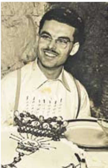
A la dreta, la màquina torradora.

Amb aquest article, L'ACTUAL continua una sèrie que vol recordar botigues, entitats, establiments i llocs d'esbarjo de la nostra vila ja desapareguts