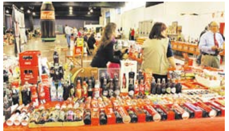
Moment de la trobada de Coca-Cola i plaques de cava a l'Espai Tolrà

També es va celebrar la Trobada de col·leccionistes de plaques de cava de totes les marques i colors. A més, es va vendre una ampolla de cava Capdevila Pujol Especial de la Trobada. "Per motiu de la trobada s'ha fet una ampolla molt maca amb una placa amb un dibuix de la Coca-Cola. Al començament teníem 125 ampolles i s'han esgotat totes. Per tant, els que vulguin trobar aquesta placa ho tindran difícil", assegura Josep Valero, col·leccionista de plaques de cava de Castellar. +