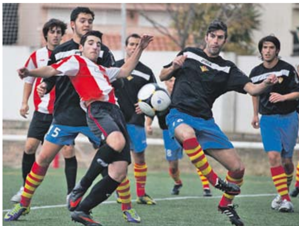
Un jugador de la Unió Esportiva lluita per una pilota envoltat de rivals del Tona.