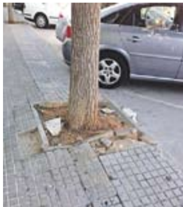
© Algunes voreres i escocells. || PP