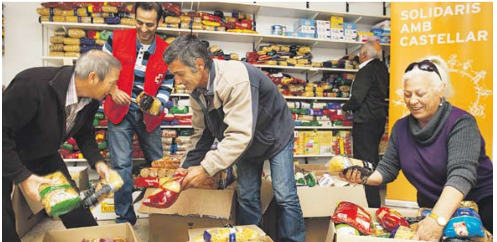
Els voluntaris de 'Solidaris amb Castellar' fent l'inventari dels productes per elaborar els lots.

ENTREPANS SOLIDARIS || A la campanya Solidaris amb Castellar cal sumar la iniciativa dels establiments del Mercat Municipal de Castellar del Vallès, que van