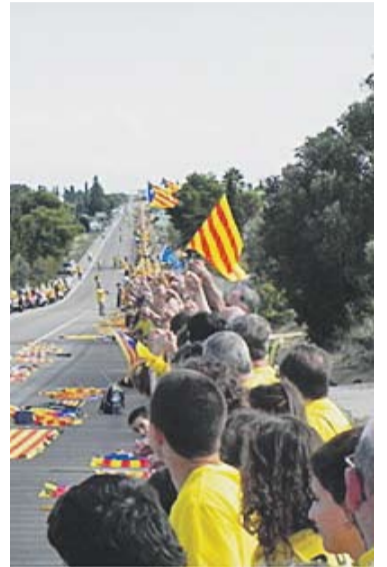
Tram castellarenc a la 'Via'.

L'11 de setembre de 2013, onze autocars coordinats per l'ANC de Castellar van sortir des de Ronda Tolosa en direcció a Tordera i les Terres de l'Ebre, per participar a la Via Catalana per la Independència. Més d'un miler de castellarencs van sumar-se a la cadena humana. Aquest divendres, dos mesos després, Castellar reviurà a l'Auditori Miquel Pont la seva participació a la via. L'ANC de Castellar ha programat la projecció del dvd Castellarencs a la Via Catalana , que recull el viatge que va fer la comitiva de la vila als diversos trams de la cadena humana. La segona part de la trobada estarà protagonitzada per una conferència-col·loqui a càrrec del Cercle Català de Negocis (CCN). Segons apunta l'ANC de Castellar en un comunicat de premsa, el lobby es defineix com "una associació d'empresaris, directius o professionals que, per tal de poder garantir el futur del teixit empresarial català, volen dispo-