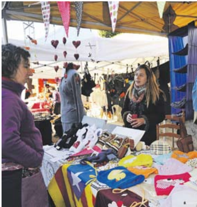
Articles artesans a la Festa del Solstici 2012 de Cal Gorina.

A les 18 h de la tarda hi ha previst un concert amb B.B.Kintt, un quintet de metall compost per trompetes, trompa, trombó de vares i tuba, que compta amb la col·laboració de la botiga i escola de música TAM de la plaça Calissó. A les 19 hores es podrà ballar amb la batucada Tucantamdrums de l'ETC. +