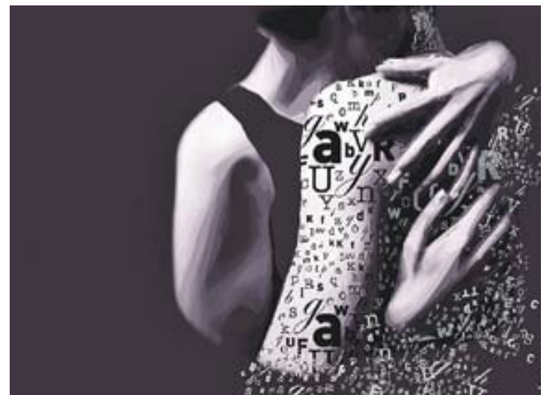
S'inicia el cicle 'Llegides' de l'Esbart Teatral de Castellar.