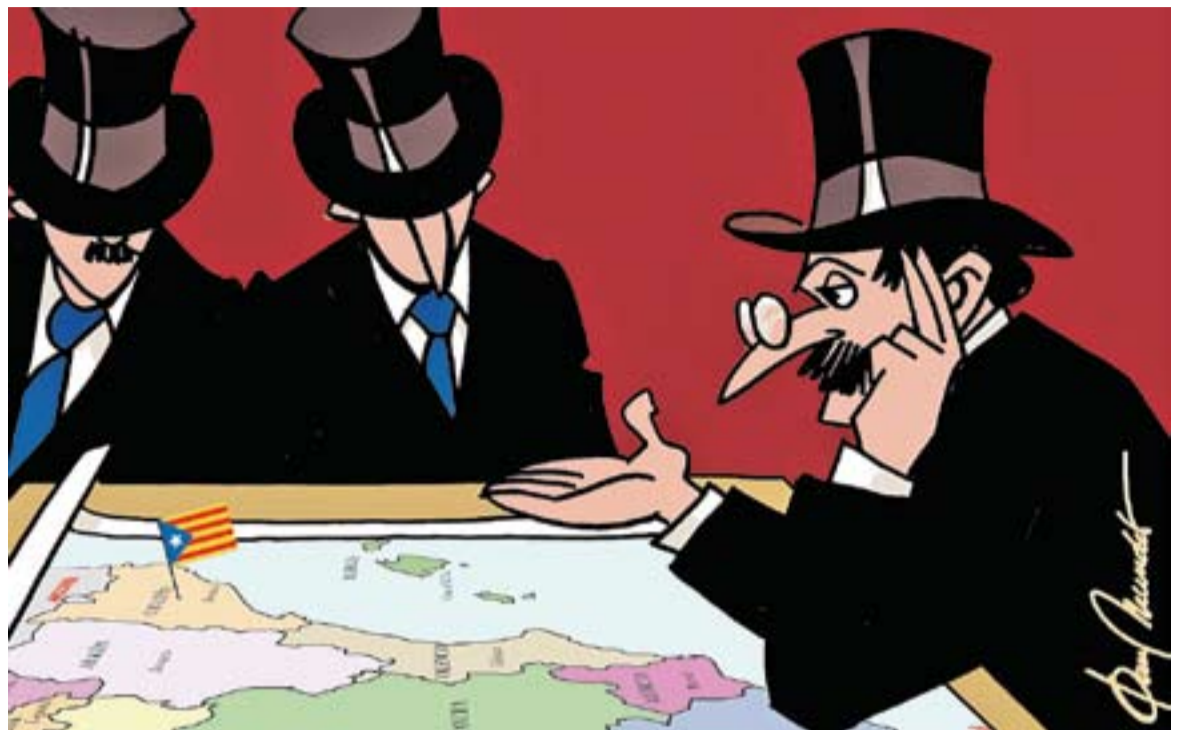
© Ni contigo ni sin ti. || JOAN MUNDET

Aquesta doble identitat catalana seguirà fins el dia que Espanya recone-