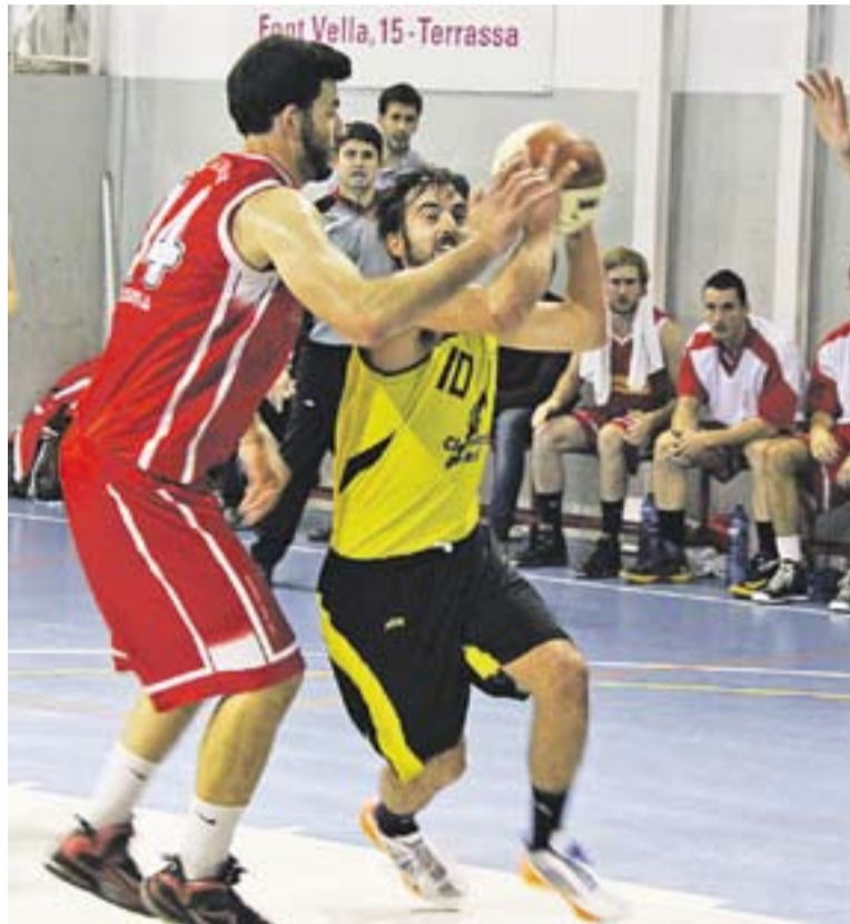
© David Pino busca la cistella del Sant Pere durant el partit de dimecres. || M. CORNET

De fet, el 13-24 va ser el màxim avantatge del Castellar, que va haver de suar molt da-