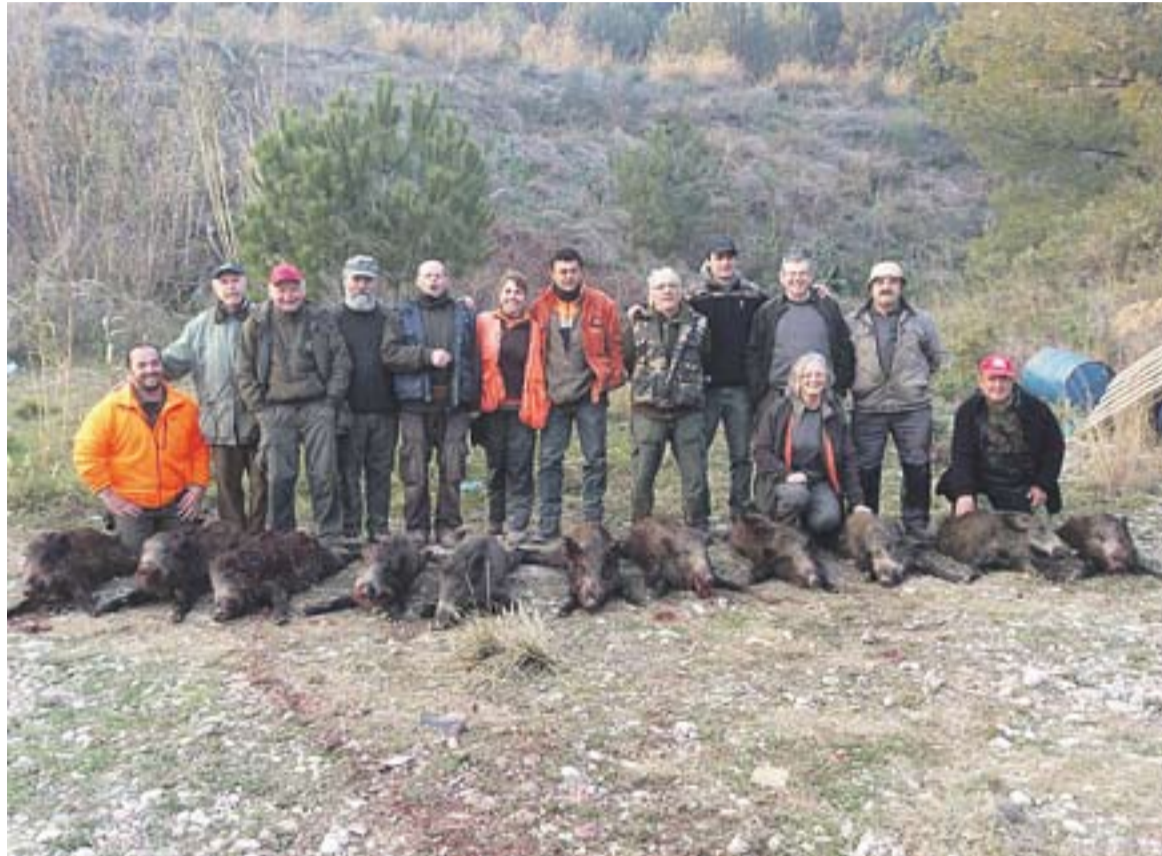
⊙ Dia de la cacera on es van abatre 11 senglars al torrent mitger. || SOCIETAT CASTELLARENCA

L'excel·lent sequera d'aquesta època fa que moltes torreneres estiguin seques i els porcs senglars hagin de baixar cap als camps i conreus, fent malbé algunes explotacions agrícoles. “No són grans pèrdues, però parlem de 2.000 o 3.000 euros en certes finques” , explica el presi-