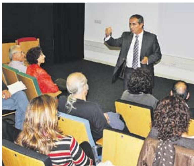
⊙ Mercader va presentar la cooperativa a una trentena d'assistents. || R. GÓMEZ