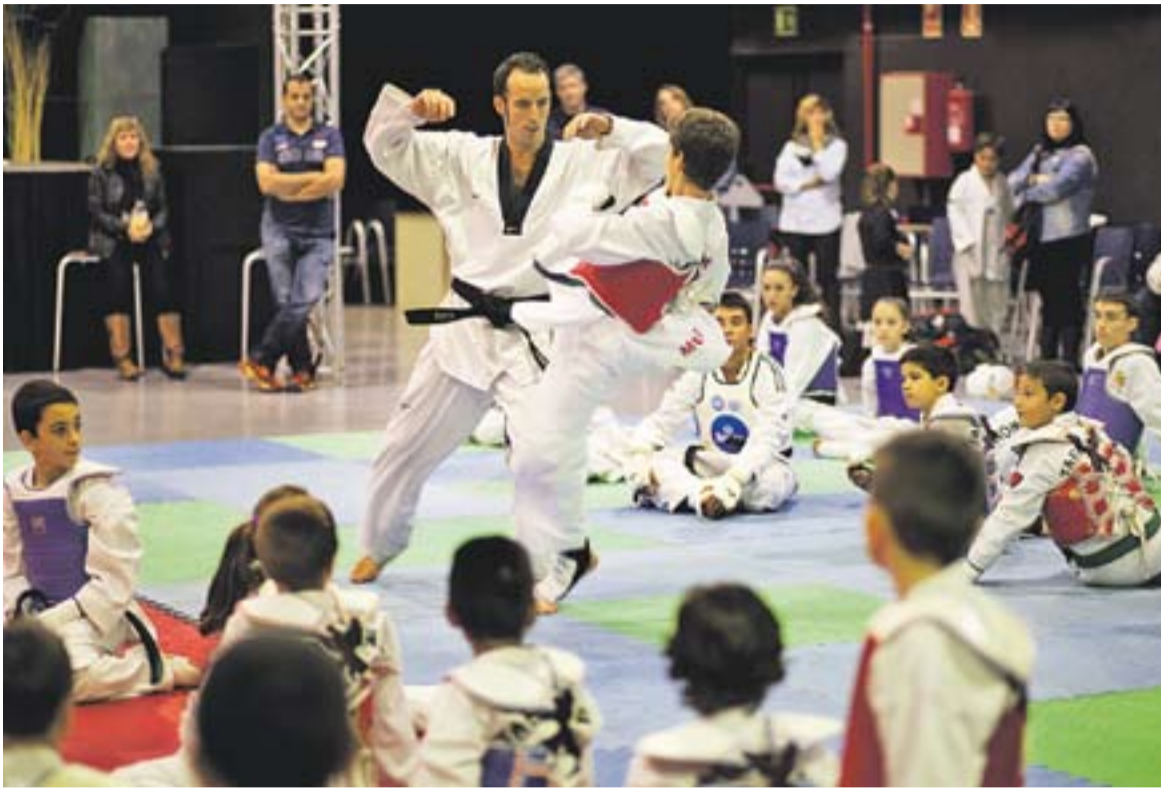
Imatge de la instrucció de la tècnica de combat, a la Sala Blava de l'Espai Tolrà .