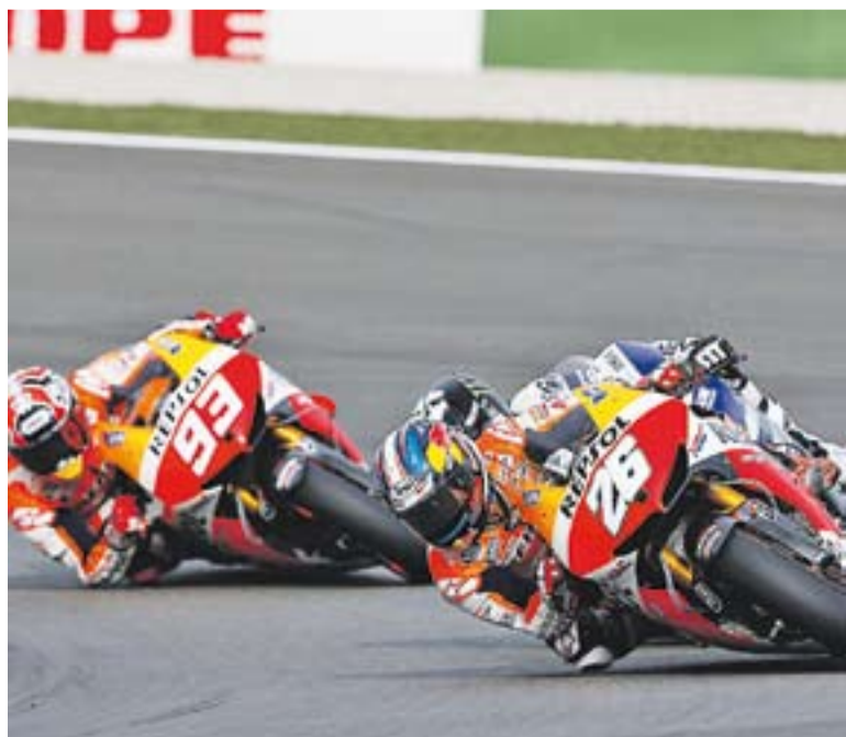
Dani Pedrosa, en un dels moments que va liderar la cursa.