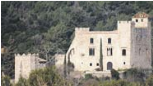
Castell de Clasquerí Autor: Óscar Moreno

Envia'ns fotos fetes amb el mòbil: lactual@castellarvalles.cat