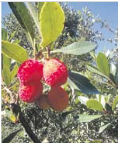
El fruit de l'arboç Autor: Abraham Egea