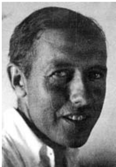
Víctor Masriera en els anys de joventut

Ja casat, Masriera va anar a dues acadèmies importants de París, la Julien i la Colarosi, "on en aquell moment hi havia