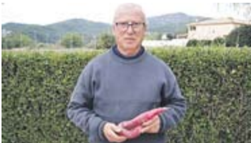
Rave de 50 centímetres Autor: Óscar Moreno

Envia'ns fotos fetes amb el mòbil: lactual@castellarvalles.cat