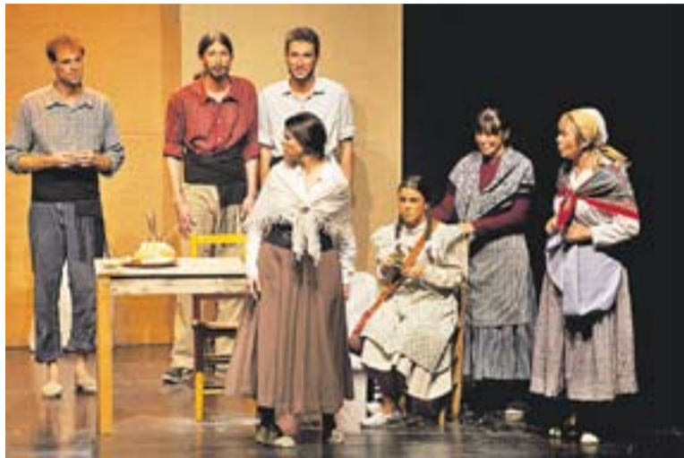
'Terra Baixa' de Kakaiba a l'Auditori Municipal.