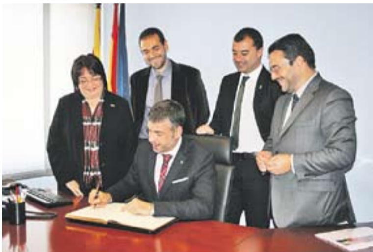
⊙ El conseller Vila, assegut, amb la presidenta comarcal i els alcaldes vallesans.

En principi, s'ha acordat que es redacti un nou estudi informatiu l'any 2014 perquè comencin les obres el 2017 com a màxim. "Es preveu construir un viaducte a la zona de Can Pagès per connectar el tram amb el desdoblament de la B-124. Per l'altra banda del Ripoll, es tra-