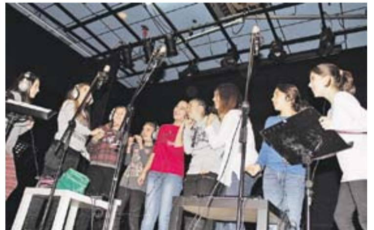
Moment de la gravació del nou disc d'Espaiart.

D'altra banda, en el marc de la celebració de Santa Cecília, Espaiart va protagonitzar dos actes musicals. El primer, divendres 22 a les 20.30 h Cal Calissó, amb un concert amb els alumnes de Cant, les Joves de la Coral Musicorum i El Cor de la Nit. Dissabte 23 d, l'Auditori va acollir un segon concert d'Espaiart, a càrrec d'alguns alumnes de l'escola. ➔