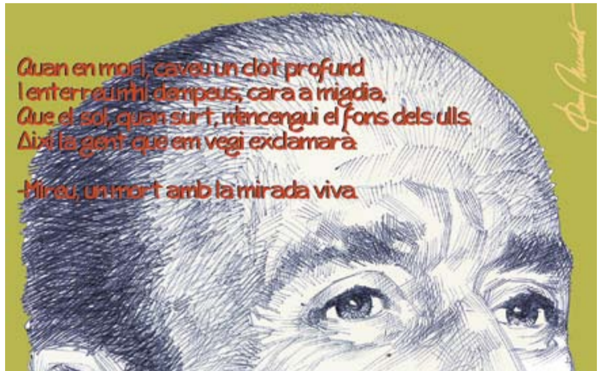
© Miquel Martí i Pol.

Aquell llunyà primer dia, el poeta, que ja estava malalt, em va fer llegir en veu alta els poemes que tenia aquells dies entre mans