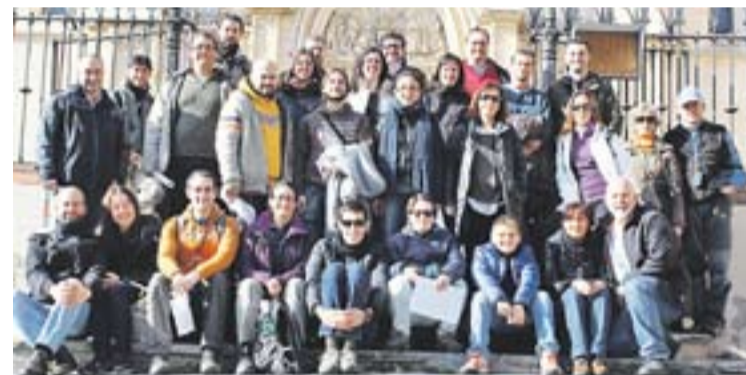
© Els participants a la trobada de geocerca davant l'església. || BROTS CULTURA

Arribats a cada punt de l'itinerari, es donava una explicació de cada indret i s'agafava la pista per a les coordenades finals del cache , és a dir, es barrejava la cultura amb un joc de localització per als 'geocaxerus'. "Pel camí vam poder trobar alguns altres caches com els de la sèrie de "CDV i la Guerra Civil" i "Castellar amb Ulls d'Infant". La ruta la podeu trobar penjada a geocaching.com (Ruta Tolrà GC4DEWH) La valoració de l'entitat és molt positiva: "Va ser una trobada cultural diferent i molt divertida, en la qual es van superar totes les expectatives en reunir a participants de 8 indrets diferents de Catalunya". ➔