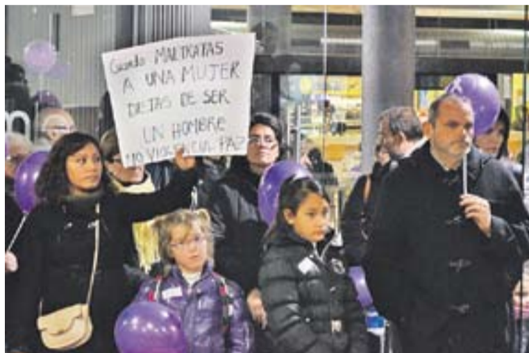
Castellarencs que van mostrar el seu rebuig a la violència masclista.