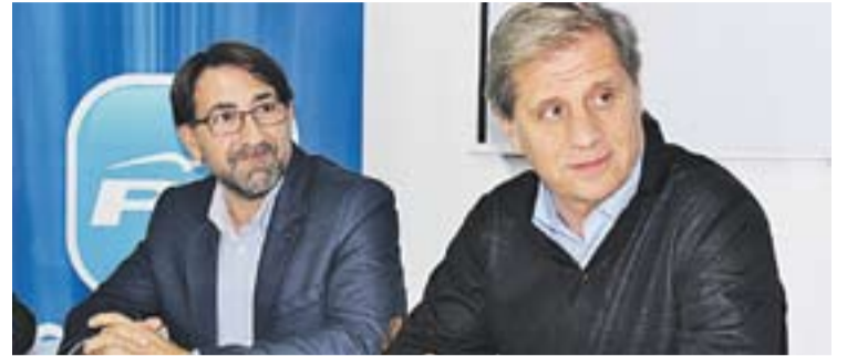
Carpio amb Fernández Díaz a la seu del PP castellarenc.