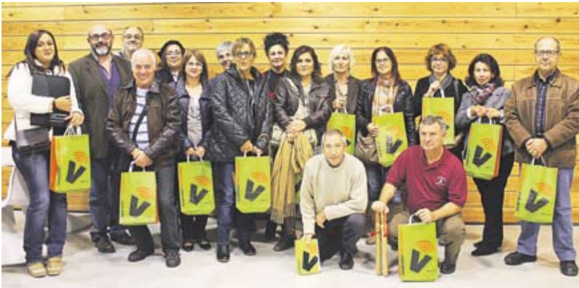
El voluntariat lingüístic és un dels recursos que tenen els vilatans per millorar les seves habilitats amb el català.