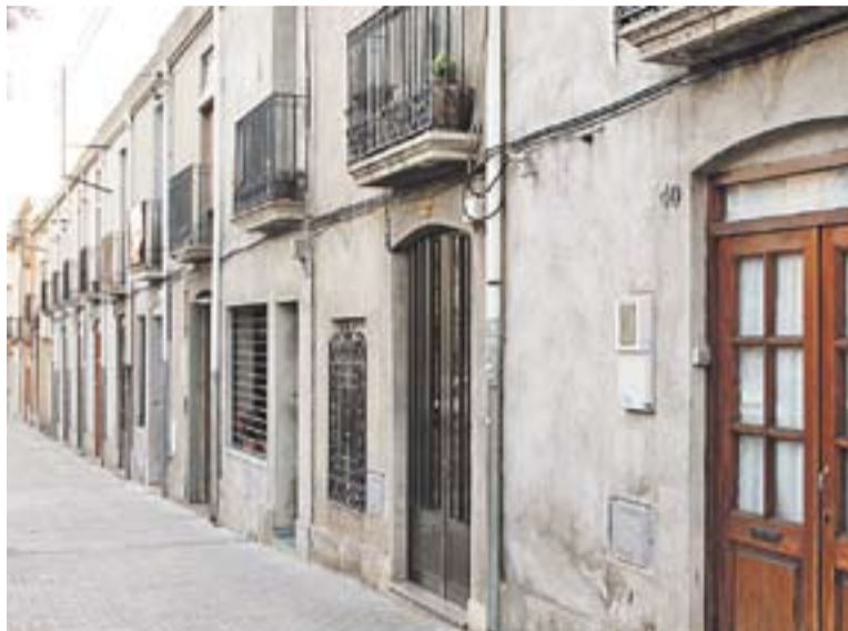
Les cases incloses dins del pla especial de protecció.

De fet, aquest mateix tema es va repetir en el següent punt, en aquest cas aprovat per unanimitat: l'aprovació provisional del pla especial de protecció de les cases entre mitgeres del carrer Passeig del número 40 al 58. Aquest pla especial, va explicar el tinent d'alcalde de Territori, suposa establir un nivell de protecció "de caràcter parcial". El portaveu de CiU, Josep Carreras, va explicitar el suport del seu grup a l'aprovació tot recordant que "el conjunt de cases del