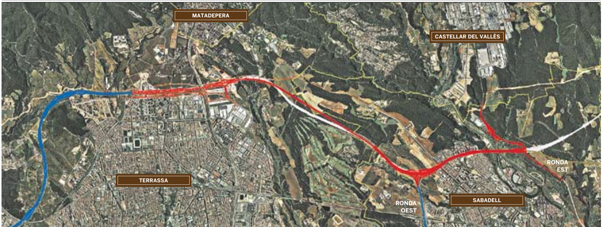
Plànol que simula -en vermell- el tram de B-40 que connectarà Terrassa amb Sabadell i amb la B-124.