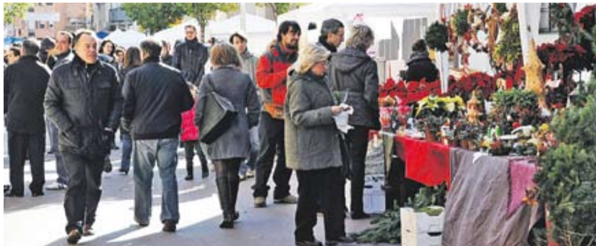
Diferents parades de la Fira de Sant Esteve de l'any passat amb productes nadalencs

Quant a la programació d'actes, dissabte tindrà lloc el taller infantil de quadres nadalenques d'Activijocs (11h), i una cantada de nades a càrrec del cor Aires Rocieros (12h). A la tarda es podran degustar torrades solidàries en favor de la Marató de TV3. Diumenge també es faran tallers infantils amb Ceràmica d'Argila (11h) i l'actuació de la colla castellera de Castellar, els Capgirats (12h).