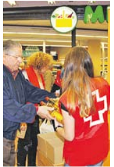
© Voluntaris al Mercat || C. DOMENE

Així, fins a 72 voluntaris de Via Solidària - Càritas i de la Creu Roja, que també donaran un cop de mà, se situaran la tarda de divendres i tot el dia de dissabte a les portes del supermercats Consum, Aldi, Mercadona i Condis de Castellar. L'objectiu és arribar a recaptar 6.000 quilos. “Nosaltres tenim uns 620 usuaris a l'entitat. El Banc d'Aliments calcula uns 10 quilos per usuari, per això, si recaptem 6.000 quilos, aquests es quedaran a la vila. Si aconseguim superar