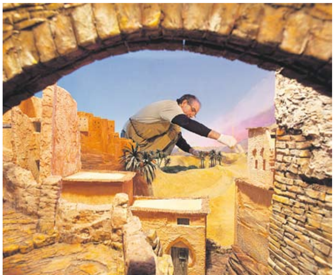
Un pessebrista enlestint un diorama per a l'exposició d'aquest dissabte. || Q. PASCUAL