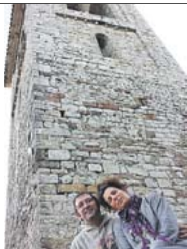
Visita al Puig de la Creu Autor: Josep Zaguirre