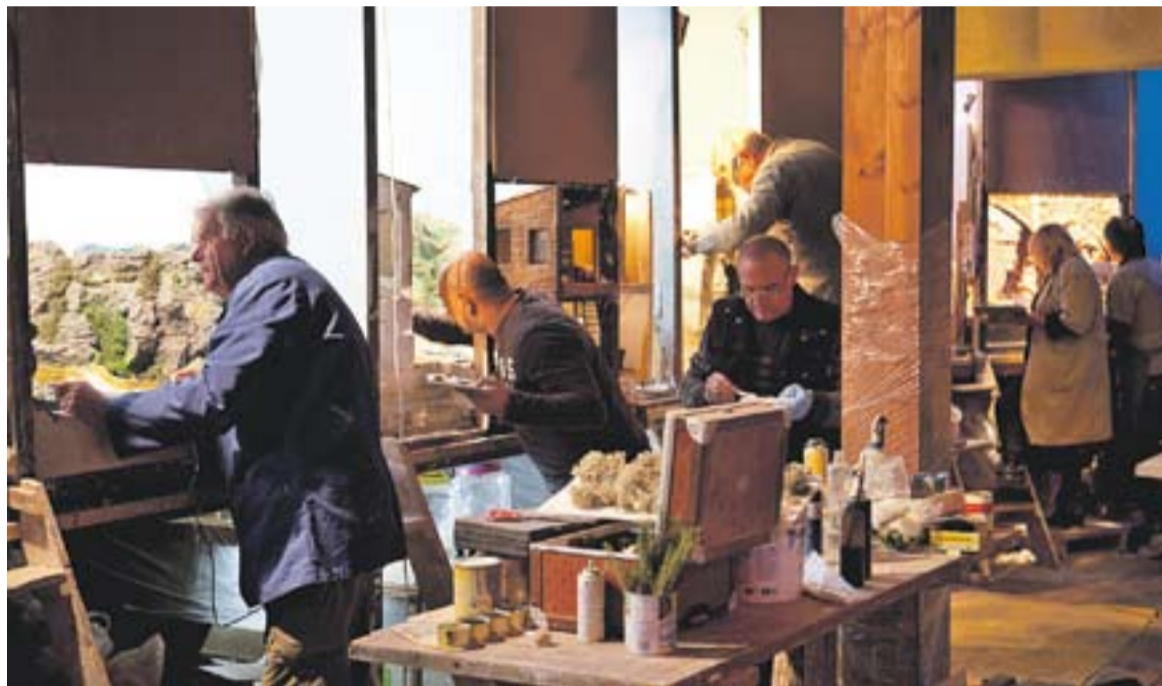
① Els pessebristes, dilluns passat, ultimem els pessebres abans de la inauguració de dissabte

El tema de la meteorologia exigeix més tecnologia, de manera que s'afegeix una mica de dificultat tècnica a la construcció