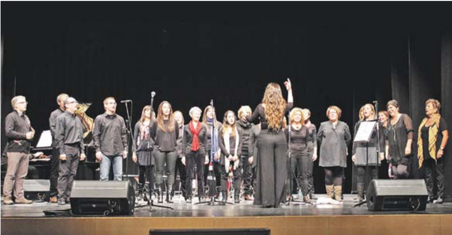
© El cor de gospel de l'Escola Municipal de Música Torre Balada va oferir un exitós concert a l'Auditori Municipal el passat divendres. || CEDIDA