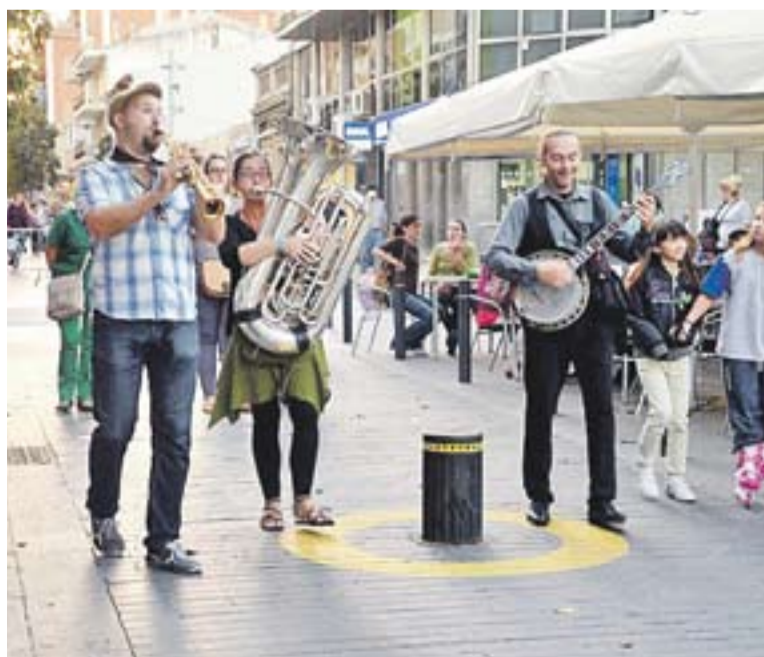
Actuació al carrer de Casi el Mejor Trío de Tu Vida.

Alguns dels temes que Casi el Mejor Trío de Tu Vida tocan són 'All of me', 'Minor Sunny', "i Don't worry be happy, que normalment no es fa per ballarins però que nosaltres hem adaptat" . De moment, la formació encara no té composicions pròpies però sí que han fet arranjaments. +