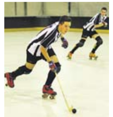
© Victor Bonilla. || Q. PASCUAL