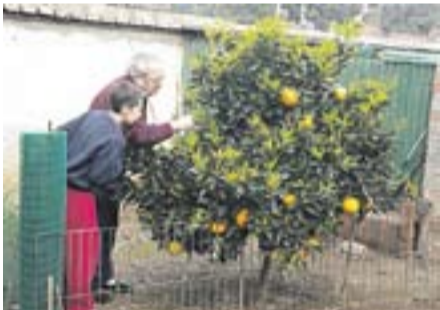
El taronger Autor: Salut Peig

Envia'ns fotos fetes amb el mòbil: lactual@castellarvalles.cat