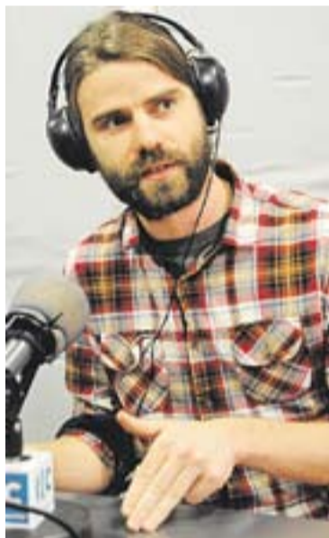
© Èric Boadella. || J. GRAELLS

Quan es va estrenar al BRAM! de l'any 2013 "Toasmaster" encara no estava del tot finalitzada, encara hi faltaven alguns retocs tècnics". Es va estrenar ja del tot enllestida al mes de setembre. "Ara al febrer visitarà tres festivals, un a Washington i dos a Califòrnia". L'èxit de la pel·lícula dependrà de la promoció. "I d'aquesta promoció en dependrà que vingui més o menys gent a veure-la". Sovint, cal invertir tant o més en fer la pel·lícula que en promocionarla. L'equip de Boadella també ha iniciat contactes amb alguna distribuïdora americana. +