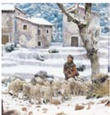
Grup Pessebrista de la Capella de Montserrat