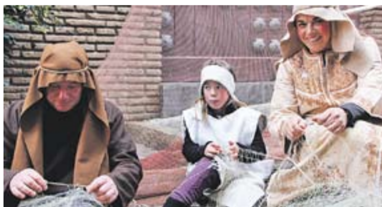
Escena a la plaça del Poble Espanyol i escena de pescadors.

Els voluntaris es van repartir per tot el Poble Espanyol per escenificar les diferents parts del pessebre. "La gent que va visitar el Pessebre Vivent mostrava la seva satisfacció, i això ens enorgulleix" . El dia 4 de gener només el grup del Pessebre Vivent de Sant Feliu va omplir l'espai del Poble Espanyol. "Vam ser molt valents, perquè l'espai és molt gran i ens feia por no poder-lo omplir" .