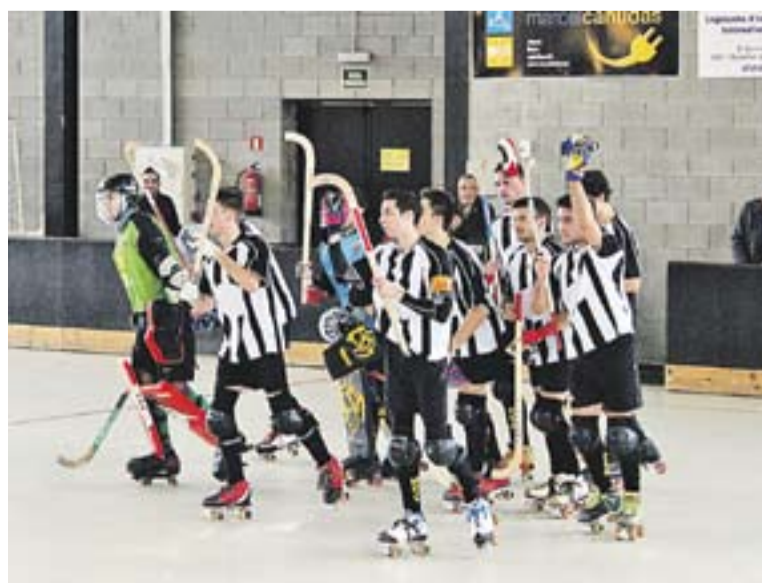
© Els primers equips de Castellar, en diversos moments de la temporada. || M. CORNET