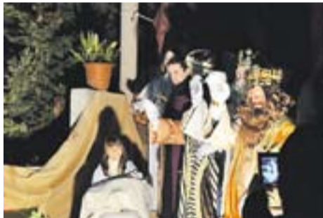
Reis 2014 Autor: Óscar Moreno