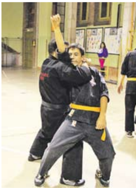
Diferents figures de combat, dels més menuts i dels grans.