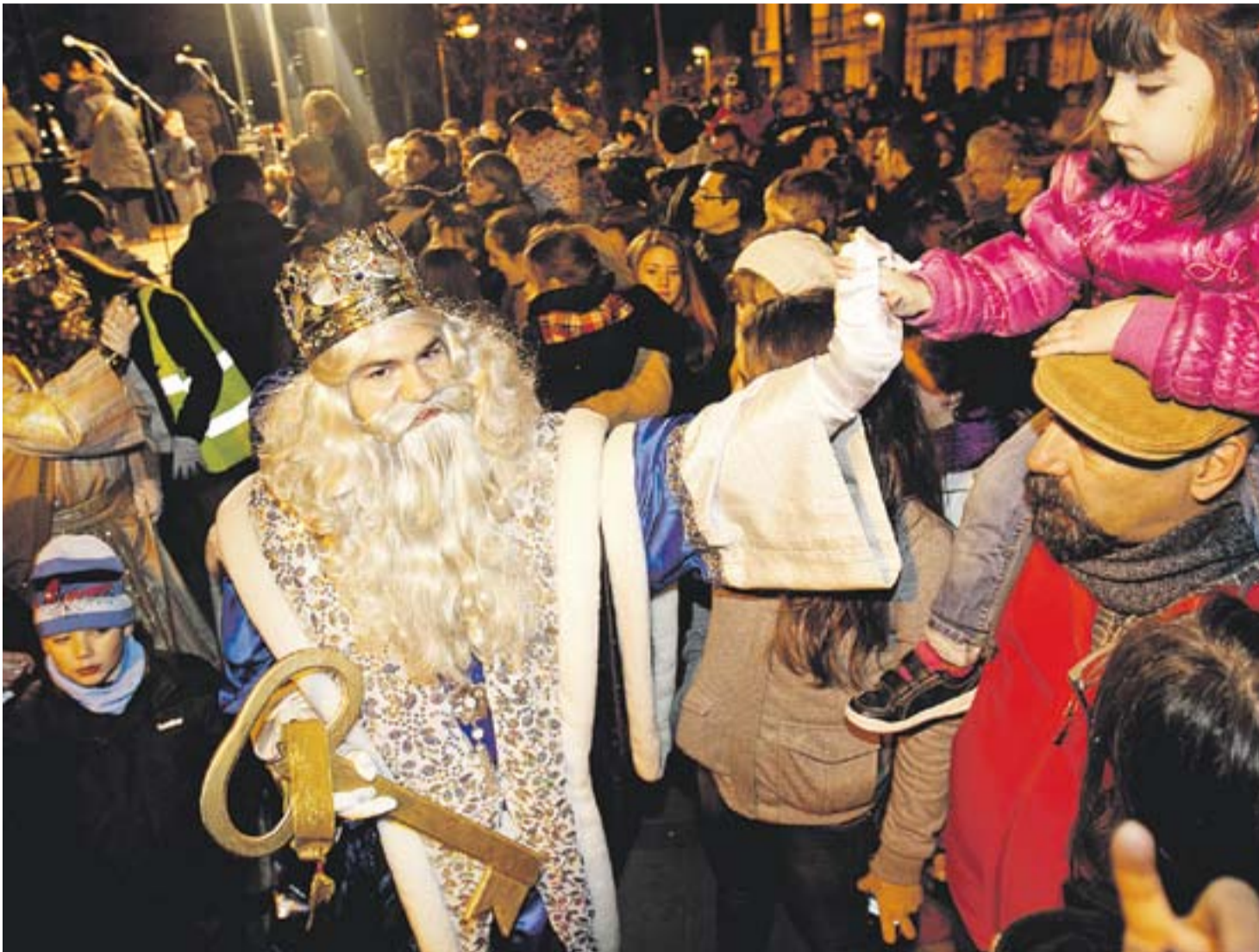
© El rei Melchior saluda una nena de Castellà tot just després de rebre la clau màgica que obre totes les llars de la vila. || Q. PASCUAL