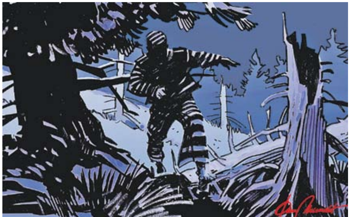
© El desgavell. || JOAN MUNDET

obra, censurada inicialment, percebrà aviat una crítica de l'exili i la guerra tant punyent o demolidora com la d'Amat Piniella. Ambdós llibres debaten la qüestió del bé i el mal, de la guerra i la injustícia, de la bogeria dels temps. Tots dos fomenten per a les generacions futures una memòria històrica col·lectiva. No obstant, la qüestió de si és bo o no recordar el passat està present encara en el debat. Una de les grans qüestions dels nostres temps és la reflexió sobre el passat. Saber què se'n deriva de les conseqüències dels fets passats. A l'actualitat, és una pre-