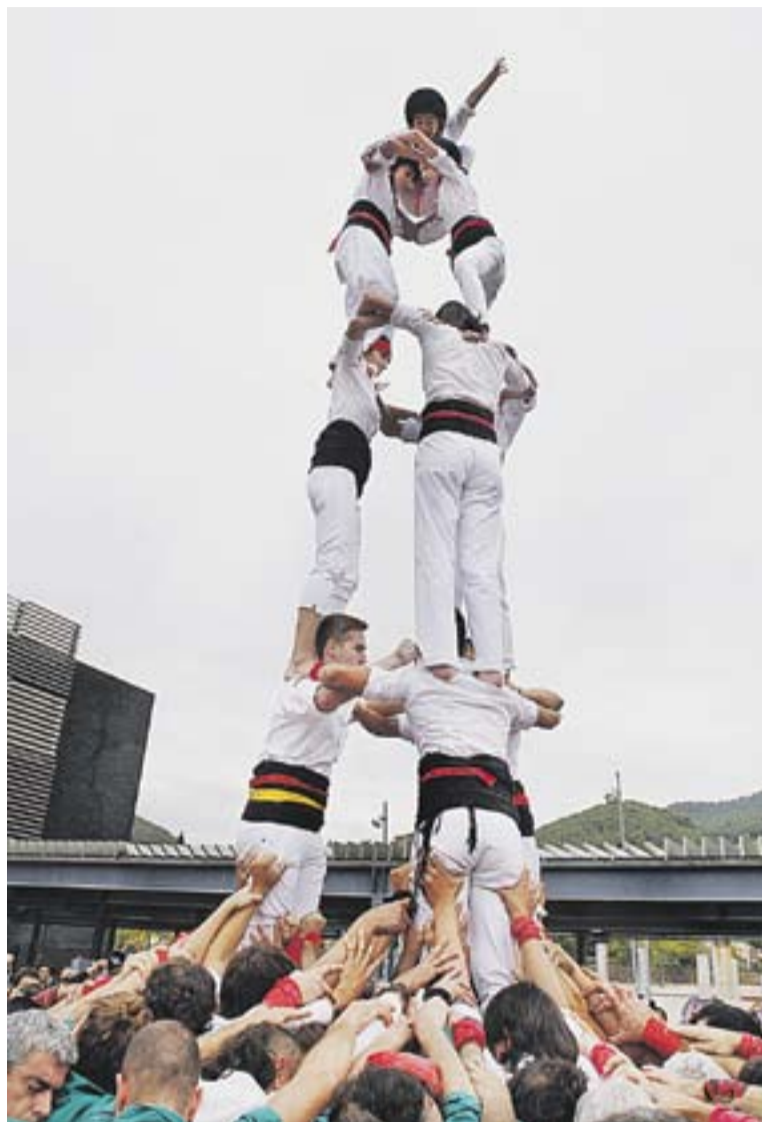
El debut dels 'Cappgirats', un dels grans moments de 2013 a Castellar.

Segurament, l'expressió que alguna cosa s'està movent dins la societat es va veure reflectida a Castellar durant el 2013 amb la gran expectació que va aixecar la visita de Teresa Forcadell el maig passat amb prop de 400 persones seguint la conferència sobre el Procés Constituent que