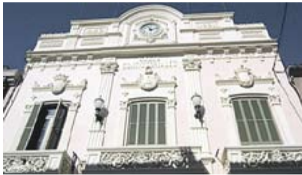
Façana de la Capella de Montserrat (esquerra) i visita als refugis antiaeris i façana de l'antic Ajuntament