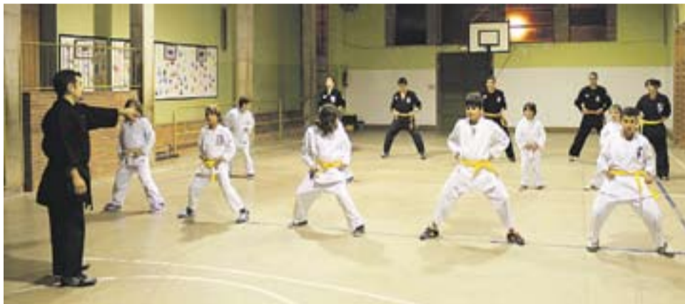
© Loren Jiménez tot dirigint l'entrenament. || M. CORNET

LA DISCIPLINA, CLAU || "Si riem, si parlem o si traïem males notes ens fa fora" , comen-