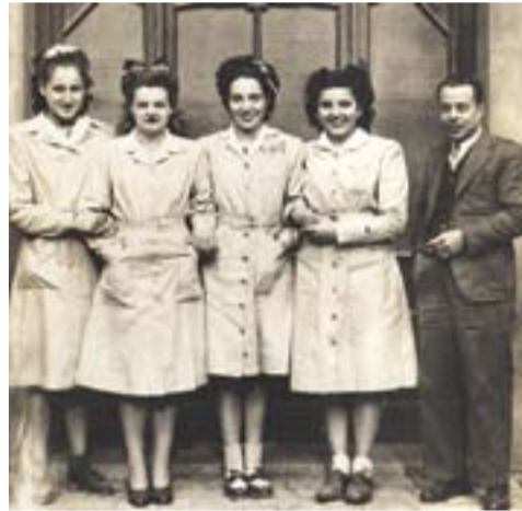
© Concepció Batlle, Concepció Rius, Teresa Prat, Lourdes Miralles (dependents) i Joan Vidal (caixer).