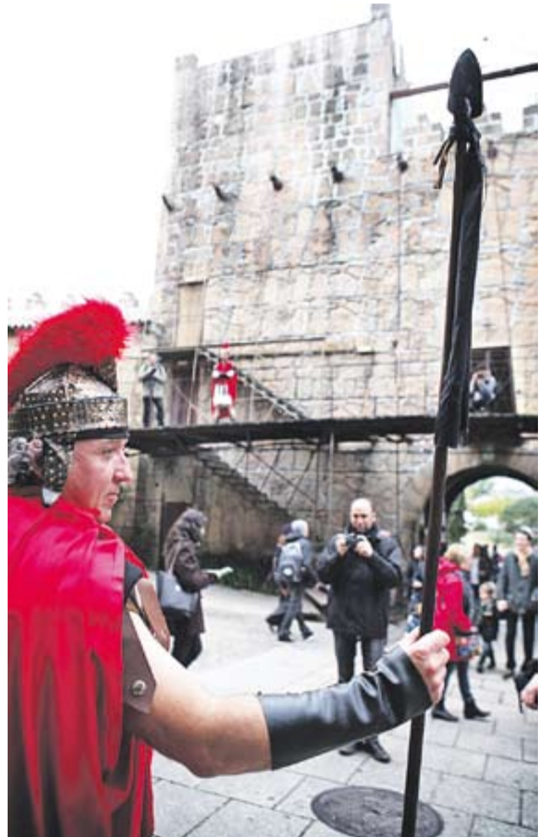
Escena de romans a l'entrada del Poble Espanyol.

L'entusiasme dels figurants del Pessebre Vivent de Sant Feliu va ser tan gran "que ja estem esperant l'any que ve amb ganes, per a fer-lo créixer més encara!" . +