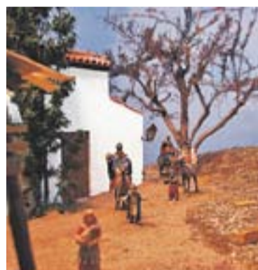
Grup Pessebrista de Sant Feliu del Racó