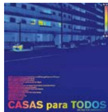
Cal Gorina, CCCV, L'Aula

+ INFO: https://www.facebook.com/sonaswingcastellar