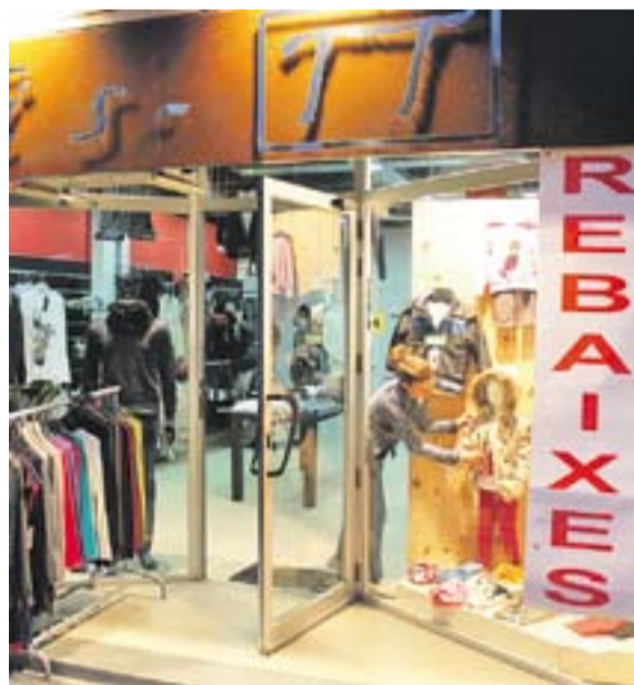
© Els aparadors d'Esports Castellar, Cucades i Vis TT Il·luint els rètols i descomptes d'aquests dies. || Y.CALVO