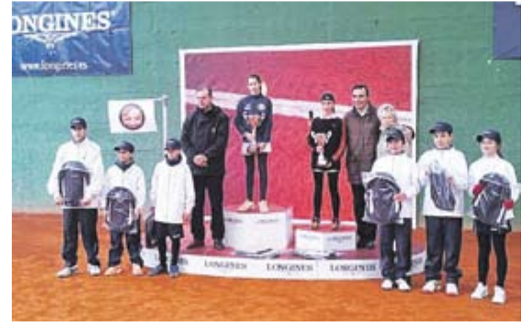
El podi final del torneig disputat a Madrid per Aina Domingo.