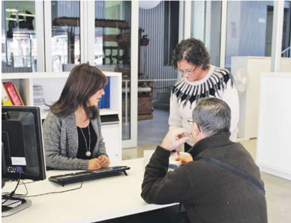
© Oficina Local de l'Habitatge, a El Mirador, en una imatge d'aquest dimecres. || R. GÓMEZ

En les properes setmanes començaran els treballs per detectar quants i quins són els habitatges propietat d'entitats bancàries, promotors i immobiliàries que, tal com diu la Llei pel Dret a l'Habitatge de Catalunya, estan buits des de fa més de dos anys. Els tècnics n'avaluaran quines en són les causes, i a continuació s'enviaran els requeriments que es considerin oportuns. En aquest sentit, Canalís assegura “què és difícil xifrar el nombre de pisos buits a Castellar, donat que cal estudiar cas per cas, per saber sota quines circumstàncies no estan ocupats, com és el cas dels que estan sotmesos a un procés de venda, d'execució hipotecària o dació en