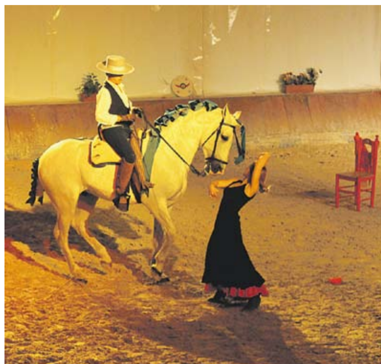
Imatge d'un espectacle anterior de Binomio Equestre.

Qui vulgui, després de La magia bajo las alas també podrà gaudir d'un sopar, ja que el Binomio Equestre compta amb servei de restaurant. Les reserves es poden fer a la web de Binomio Equestre http://www.binomioequestre.com o bé per tel., al 937472211. +