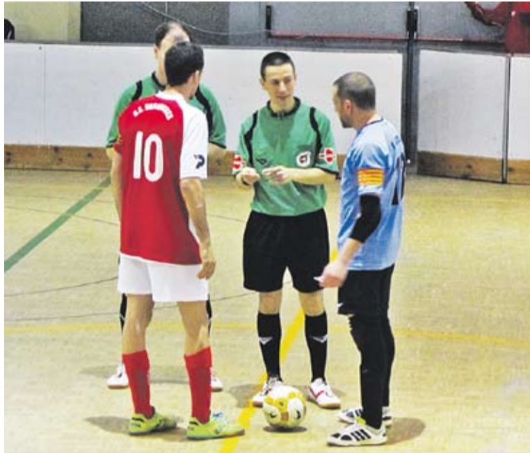
Els dos capitans, durant el sorteig d'abans de començar el partit.