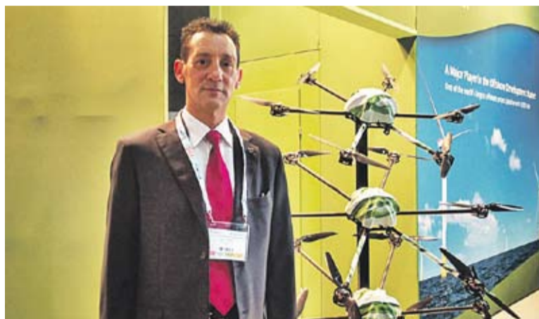
© Joan Canyes, al congrés europeu EWEA de Barcelona. || CEDIDA

L'acord amb el holding kuwaitià no és l'única dada positiva de l'empresa castellarenca d'aquests dies. La setmana passada, la Direcció general de l'Autoritat Portuària de Wilhelmshaven (Alemanya), va signar un acord de col·laboració amb Start-Point de trànsit i punt