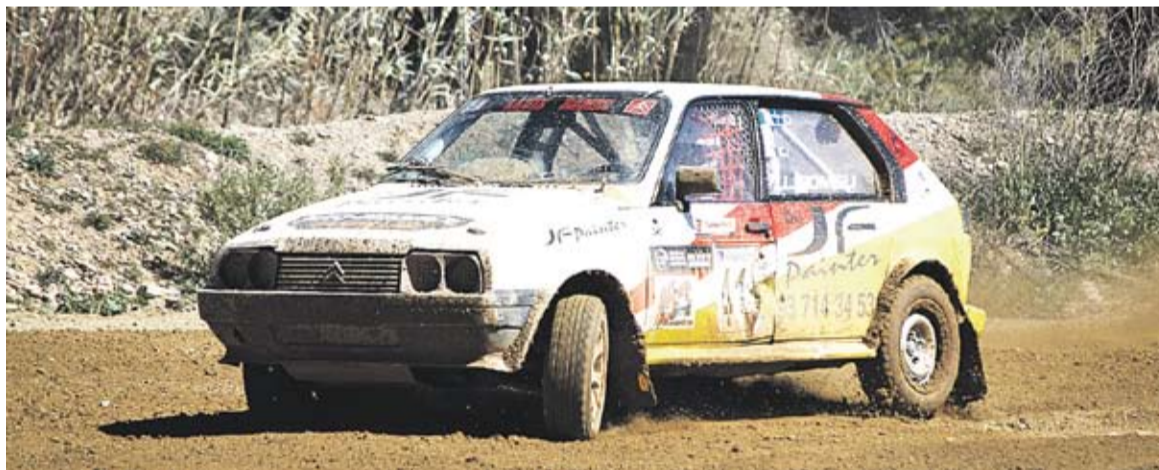
© A d'alt, massiva afluència de públic a la sortida de Car-Cros. A sota el pilot castellarenc Romeu, creuat || Q. PASCUAL / J. GONZÁLEZ