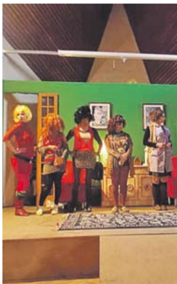
© Assaig de l'obra de l'AAVV El Racó.