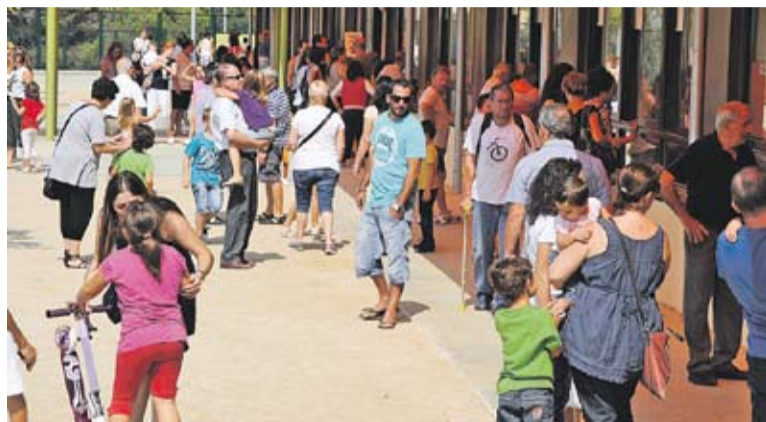
Inici de curs escolar a l'escola El Sol i la LLuna

Enguany era la primera vegada que s'implantava la zona única escolar, és a dir que els pares i mares podien escollir qualsevol centre escolar de Castellar sense tenir en compte el lloc de residència. Tot i aquesta nova normativa no hi hagut grans diferències respecte l'any anterior, les famílies han escollit els diferents centres de Castellar d'una manera equilibrada. “Observem per les sol·licituds fetes, que el 95% dels alumnes preinscrits a P3 podran matricular-se als centres escollits en primera opció. Ha quedat molt equilibrat” , ha assegurat la regidora. És el mateix percentatge assolit l'any passat en el procés de preinscripció per al curs 2013-2014.