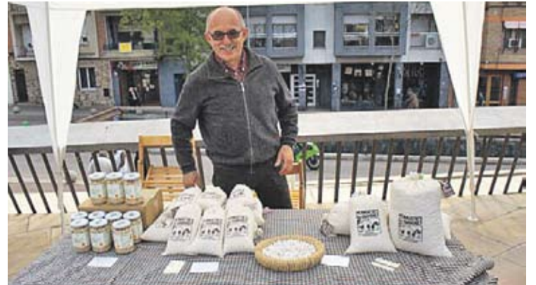
© Casamada amb el tradicional sac de mongetes i els nous pots en conserva. || O. M.