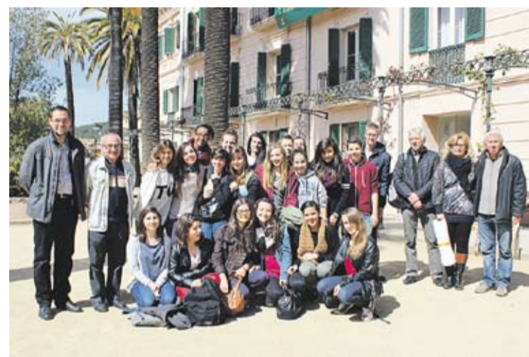
Els alumnes de l'institut Grazeilles als jardins del Palau Tolrà

A més de fer una visita a l'Ajuntament, els alumnes van iniciar l'activitat a les instal·lacions de l'institut, on van presentar treballs realitzats a partir del Quixot i van dur a terme una activitat de matemàtiques relacionada amb Gaudí. Posteriorment van visitar el Museu de l'Antoni (col·leccionista de la Coca-Cola) i les instal·lacions de Ràdio Castellar. Dimarts i dijous van passar el dia a Barcelona. Aquest intercanvi lingüístic entre els dos instituts és la culminació d'un programa que es va iniciar fa més de nou anys. +