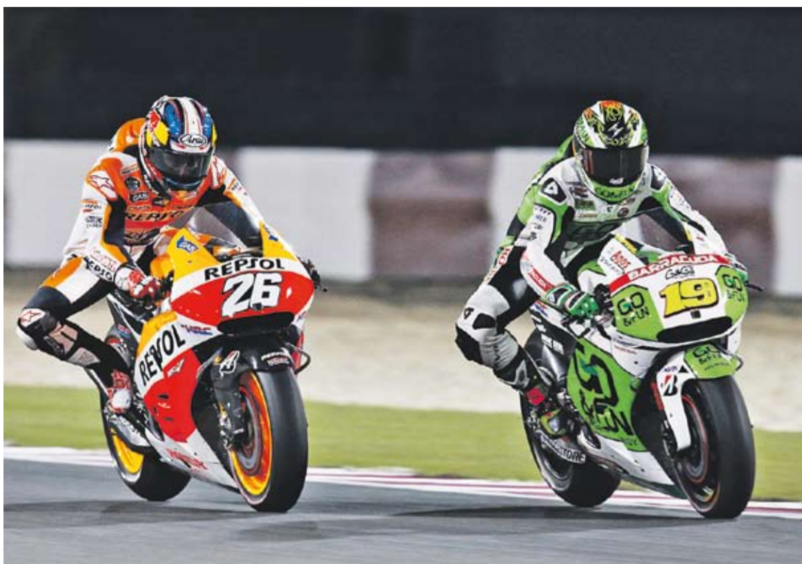
© Dani Pedrosa lluitant amb el pilot talaverí Álvaro Bautista || REPSOL MEDIA