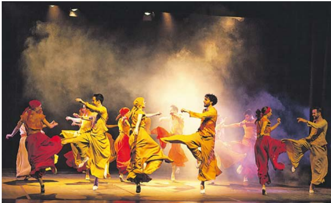
Moment de l'actuació de l'Esbart Sant Jordi de Barcelona.

L'inici de la funció semblava, no obstant, bastant clàssic: un teló negre, un escenari buit i un joc de llums sobri, tot comandat per la veu d'un presentador invisible, que anunciava als assistents les diferents danses. Mitjançant un important treball de caracterització, els dansaires van interpretar danses populars tradicionals grupals d'arreu de la geografia de l'antiga Corona d'Aragó. Obria l'exhibició la Dansa de Castellterçol , on els vailets i les pubilles ballaven formant els típics cercles concèntrics en moviment, propis de la tradició catalana, en ocasions aixecant els braços en una posició molt semblant a la sardana. A aquesta seguien Les majorelles d'Horta de Sant Joan , divertint pel seu caràcter festiu i enèrgic, on l'ús de les puntes i els talons i les constants cabrioles dels homes