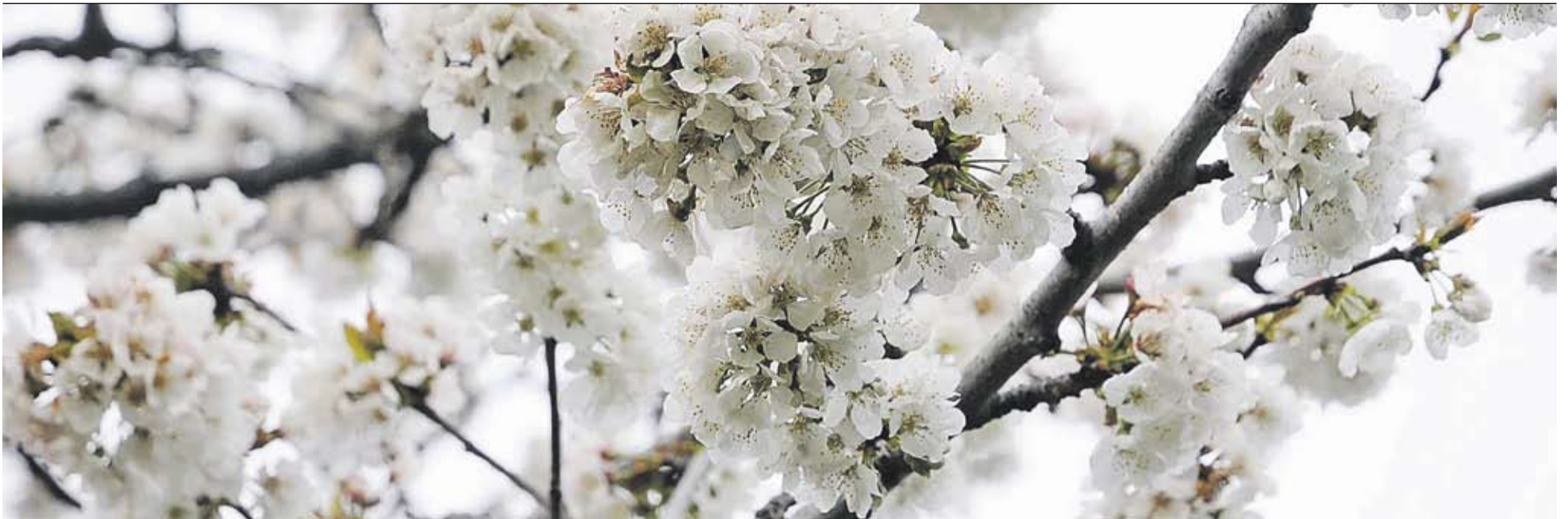
Cirerer en un pati de l'exemple de Castellar del Vallès