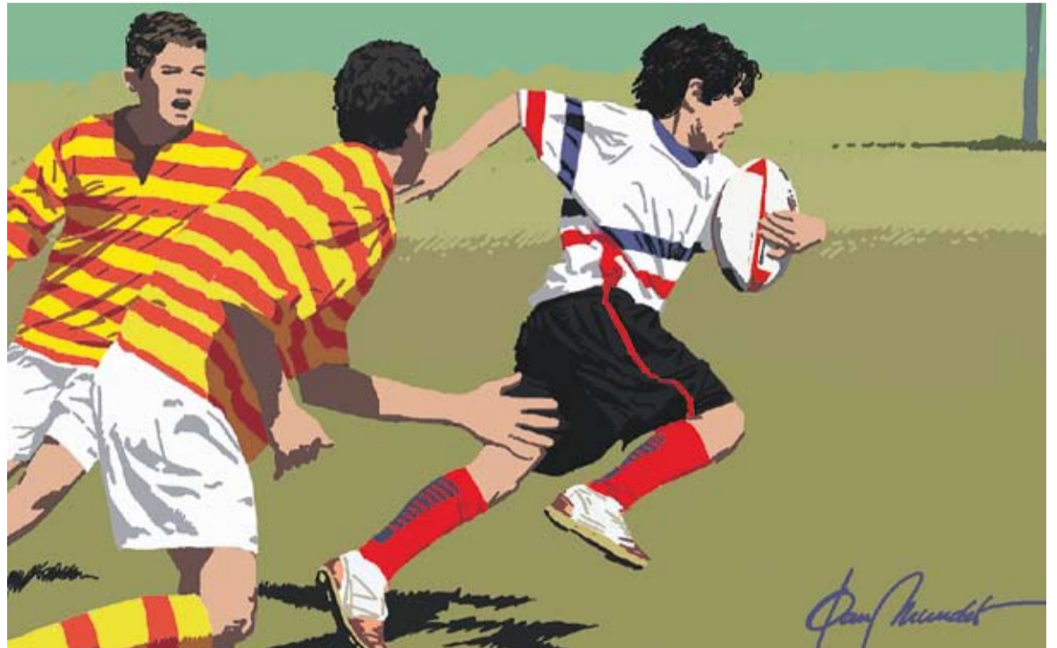
© Rugby dos. || JOAN MUNDET

Al rugbi no tens cap enemic, ni tan sols al que porta la samarreta de diferent color a la teva. És un oponent, i per això el respectes