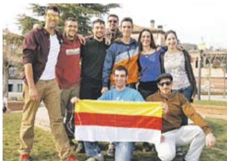
Celebrant Sant Josep Autor: Korral