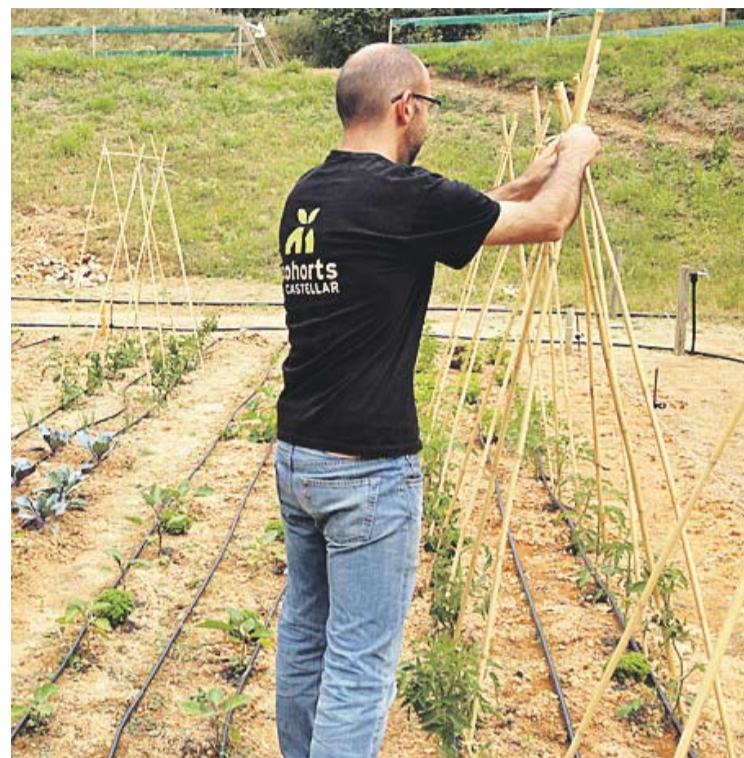
© Els horts d'Ecohorts. || CEDIDA