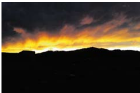
La Mola a punt d'anar a dormir Autor: Àngel Pastor

Envia'ns fotos fetes amb el mòbil: lactual@castellarvalles.cat