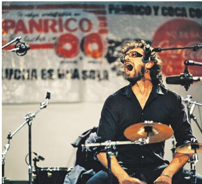
El percussióista de Morosito en acció durant l'actuació a la Sala Blava.