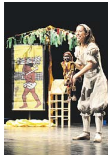
Un moment del muntatge.

vestits, el moviment i la posada en escena que ja auguraven el que s'havia de veure seguidament amb la versió dansada del mite del Ripollès. La capacitat narrativa i expressiva que va demostrar l'Esbart de Sant Martí en aquesta segona part de l'espectacle va ser d'una genialitat increïble, ja que sense cap tipus d'atrezzo o narrador va actualitzar d'una forma molt impactant una de les històries més rellevants del panorama cultural català, no només quant a l'expressivitat corporal sinó també en la generació d'imatges, que arribaven al fons de l'ànima per la qualitat estètica i feien més humà el trist relat del comte de Sant Joan de les Abadesses. Un treball magnífic. +