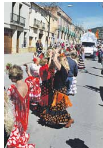
© Rua Andalusia. || Ò. MORENO