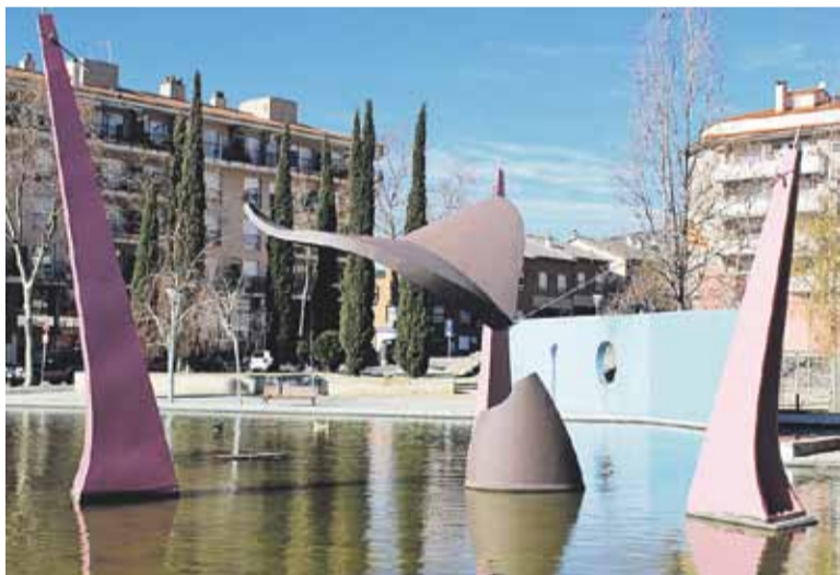
© Detalls i pla general de la balena de la plaça Catalunya. || Y. CALVO