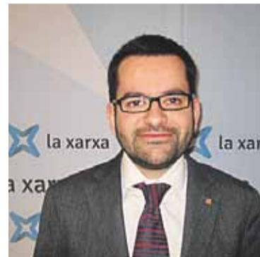
© Roger Albinyana vindrà el dia 15.

Les xerrades també pretenen abordar el procés sobirana des de diferents perspectives, com el periodisme, la