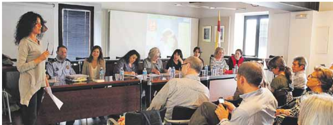
Presentació d'ADA Castellar, dilluns passat, a Ca l'Alberola.