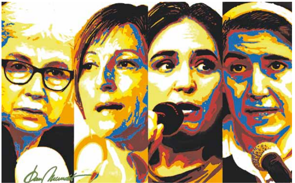
© Dones catalanes. || JOAN MUNDET

Estem en un punt de la història on sabem que no calen revolucions per avançar. Des de Darwin sabem que podem evolucionar. Evolucionar vol dir tirar endavant, però conservant el que hem aconseguit i que considerem que és bo. Per què us penseu que hi