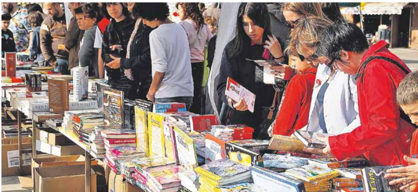
Parades de llibres durant una edició anterior de Sant Jordi a Castellar del Vallès.

Sant Jordi es prepara a Castellar amb parades de llibres i roses, tallers infantils i signatura de llibres amb autors castellers