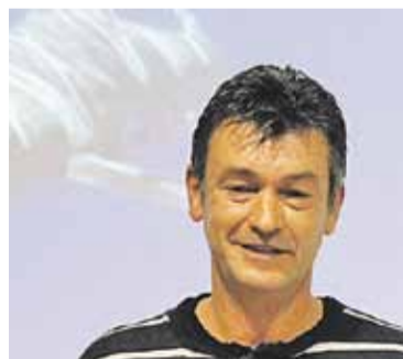
© J. Aymerich, instructor

Durant la presentació del curs, Aymerich va fer un repàs de la seves