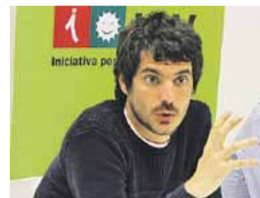
© Ernest Urtasun || R. GÓMEZ

En aquest sentit, l'ecosocialista va subratllar que darrere de la reforma laboral i de les pensions es troba l'ombra de Brussel·les. "Són polítiques que s'han adoptat com a condició pel rescat bancari del Banc Central Europeu" , apunta Urtasun. El cap de llista d'ICV va reivindicar un canvi de rumb de les polítiques econòmiques "per generar ocupació, protegir els aturats de llarga durada i elaborar polítiques industrials europees per