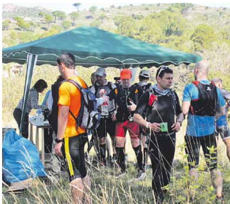
© Participants retornant i control de pas a la Vall d'Horta. || O. MORENO - M. ANTÚNEZ