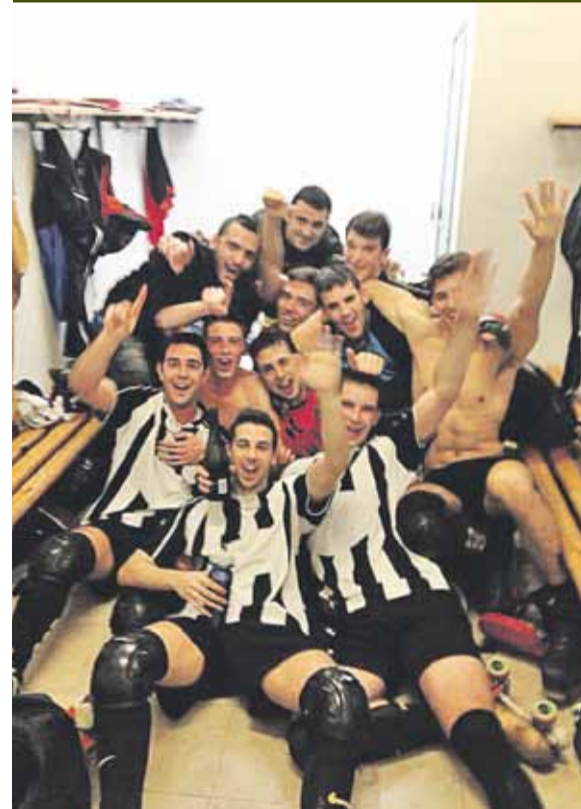
Celebració de l'ascens al vestidor.