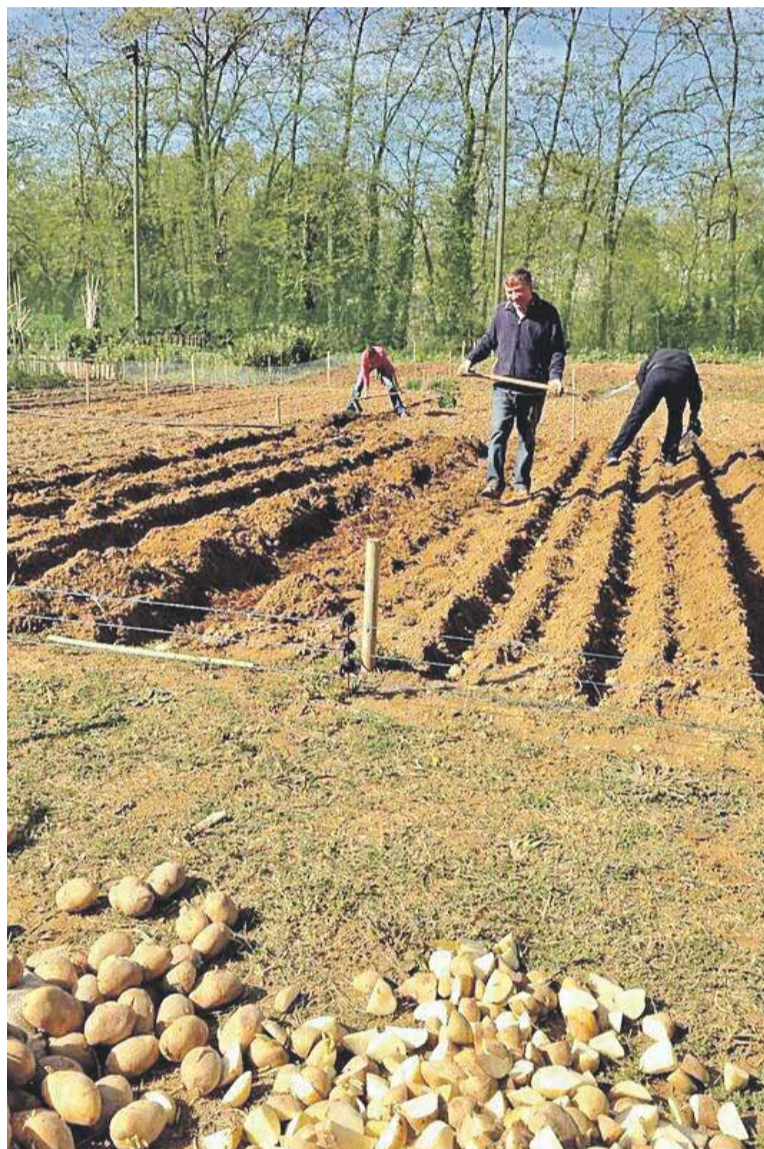
Els hortolans d'Ecohortes recullen la primera collita de patates