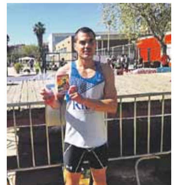
© Planas, amb el trofeu. || CEDIDA