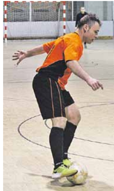
© Juan Antonio Fernández. || M. CORNET

part, l'equip de Jiménez mai no va afluixar i va arrodonir el marcador amb un trio de gols final de Juan Antonio Fernández. Abans, a la primera part, també havia fet un trio de gols Alexandre Mateo. La resta de dianes van ser obra de Manuel López (2) i Víctor Silvestre. + || REDACCIÓ