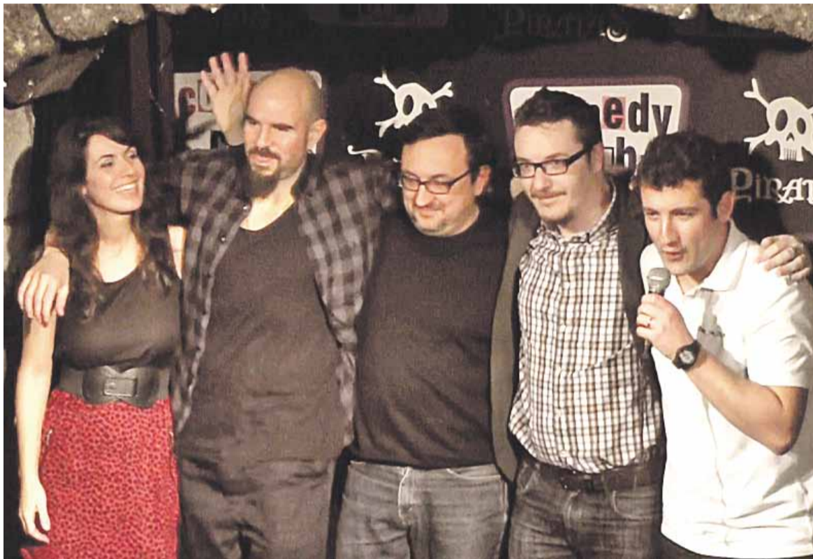
© El grup de monologuistes Fem Riure durant un dels seus espectacles. || CEDIDA

El grup de monologuistes Fem Riure s'estrena a l'Esbart Teatral