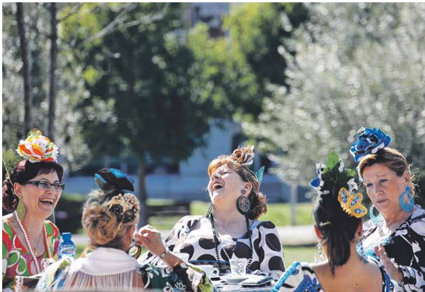
El sol que va lluir durant el cap de setmana va afavorir la celebració de la Feria de Abril.