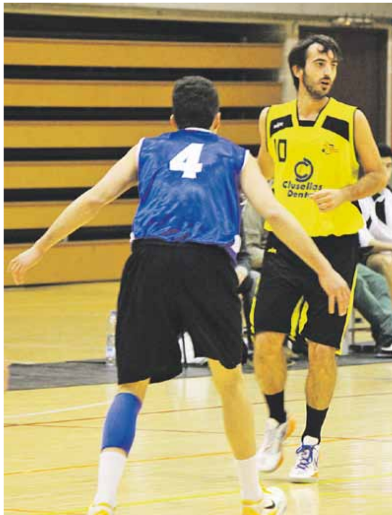
David Pino, autor de 17 punts a Reus, durant el duel de la primera volta.

El Reus Ploms va començar dominant el partit, ja que el primer quart es va acabar amb un 19-15 favorable als seus interessos. El Castellar, però, va saber controlar molt bé els nervis, i se'n va anar al descans amb avantatge en el marcador (34-35). Un parcial de 16-23 en el tercer període va ser el que va dictar sentència i en l'últim quart, malgrat que els reusencs van tornar a ser millors (16-10), ja no van ser capaços de capgirar el marcador. Els locals es van arribar a posar un punt amunt en el darrer minut però els de Dídac Herero no van tardar a abastar l'avantatge definitiu. Això sí, el triomf va ser més agònic del que es preveia. Després d'una pilota robada, els groc-i-negres també van disposar d'una tècnica a favor, però cap dels quatre tirs lliures va entrar. La següent pilota en joc també va