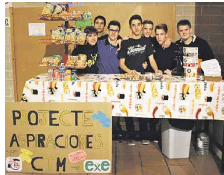
Els membres del Cadet B del CB Castellar, al bar situat al Puigverd.