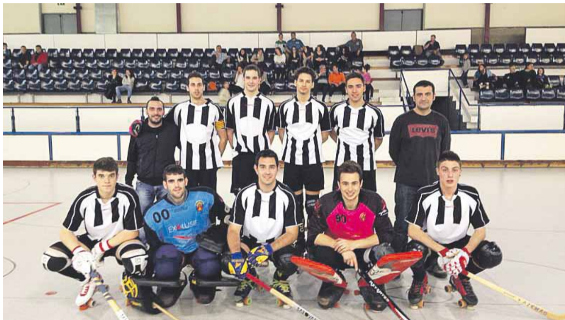
L'equip de l'HCC, que ha certificat l'ascens matemàtic.

El partit que passarà a la història, el disputat a la pista del Club Patí Roda, no va ser tan fàcil com podia fer preveure la classificació, i no precisament per la qualitat del rival. Des de la sortida dels vestidors ja es va veure que els blanc-i-negres jugaven contra ells mateixos. Els nervis davant la possibilitat d'assolir l'ascens no els deixaven moure la bola com sabien i no aconseguien arribar amb fluïdesa a la porteria contrària. Els pesava el