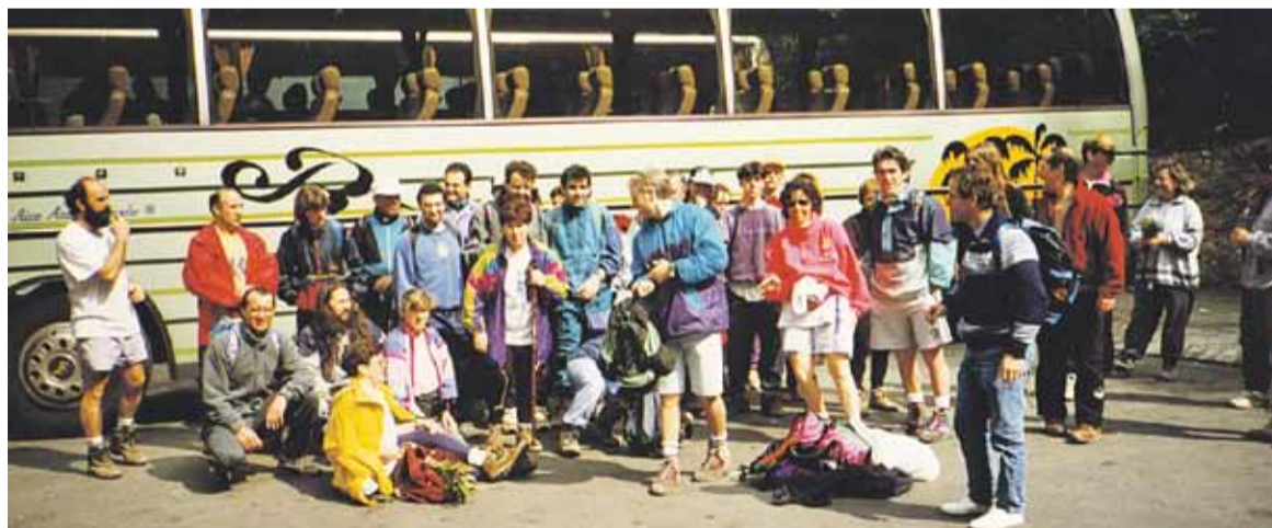
Alguns dels participants a la travessa el 1996.

Un dels trets de la travessa Castellar-Montserrat és que tothom ha de ser autosuficient. “Sí