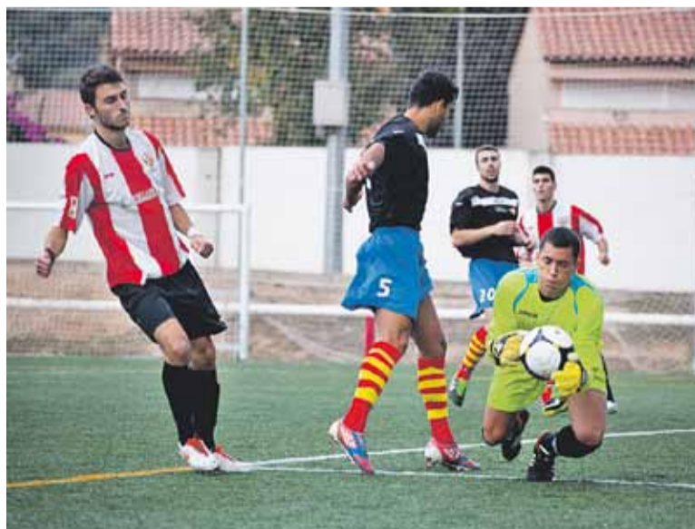
Joan Brullet lamenta una ocasió fallada contra el Tona.

"A finals de mes hem de fer un treball i i anar a exposar-lo a Saragossa o a Madrid", explica un dels participants tot i no descartar, "si va bé, mantenir-lo permanentment". Barrera, de la seva banda, destaca que "l'objectiu és que vegin que són capaços de canviar el món", i subratlla el fet que els nois hagin decidit dedicar els seus esforços a millorar el material per iniciativa pròpia: "A partir d'aquí, hem muntat un projecte on els alumnes han dissenyat una estratègia per a trobar recursos i una solució". La iniciativa la van començar a principis de febrer i ha inclòs tallers i xerrades amb professionals. Totes aquelles persones que facin una donació se'ls inclourà com a col·laboradors al document final. +