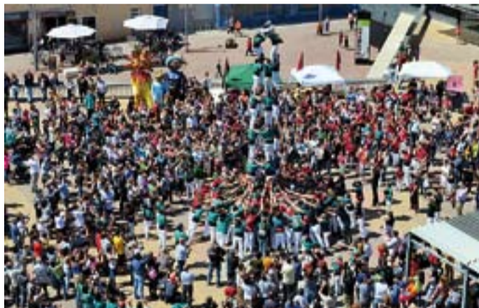
Actuació dels Saballuts en un moment de la jornada.