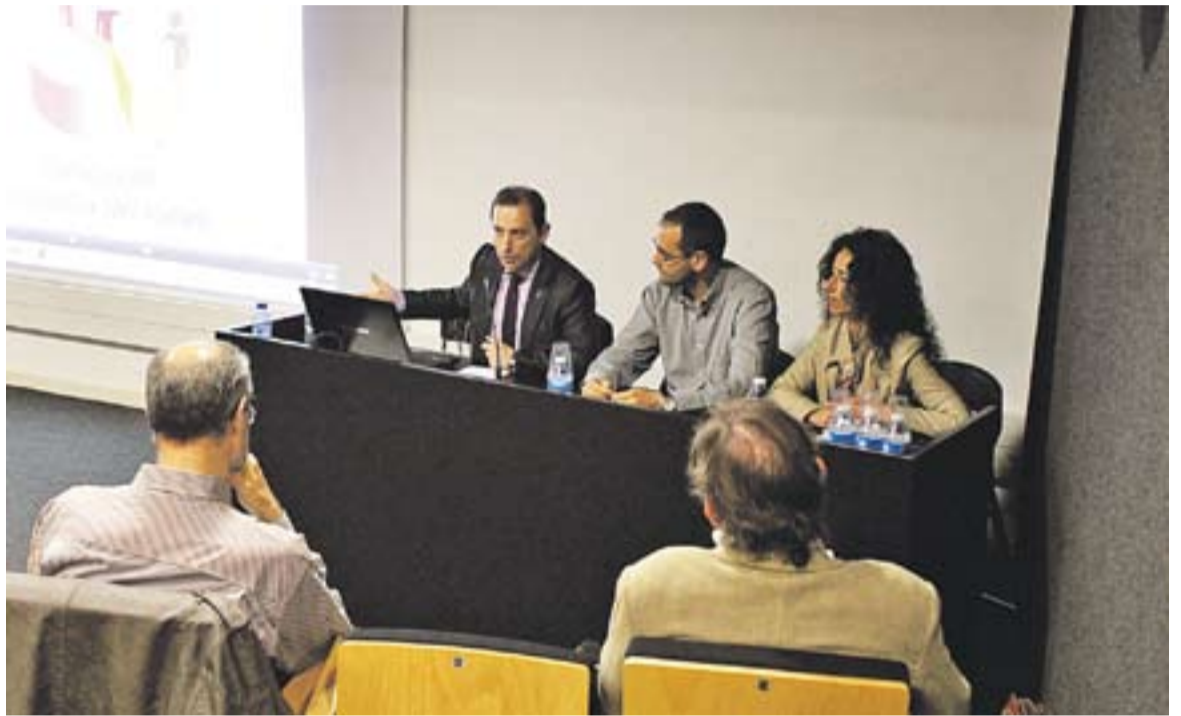
© Presentació dels indicadors de salut de Castellar, amb el diputat J. Oliva, l'alcalde i la tinent d'alcalde a Serveis a les Persones || R.G.

CADA COP MÉS VELL || La dilatació de l'edat de la maternitat és un dels símptomes del canvi de la piràmide demogràfica i dels hàbits socials. La població castellarenca tendeix a envellir: per cada 100 persones de 0 a 15 anys, n'hi ha 69 de 65 anys o més. De fet, la mitjana d'edat de la pobla-