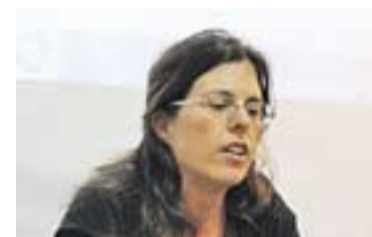
© V.Miró, a la presentació || R.GÓMEZ

Quant a la metodologia, el Multireferèndum es podrà votar per via digital, el vot presencial anticipat i el vot el mateix dia a les quatre meses que es col·locaran a les places d'El Mirador, Catalunya, Espai Tolrà i Europa, decisió que va acordar a la primera assemblea pel Multireferèndum de dimarts passat. Els castellarencs que hi vulguin col·laborar poden contactar amb la plataforma a través de multireferendumcastellar@gmail.com +