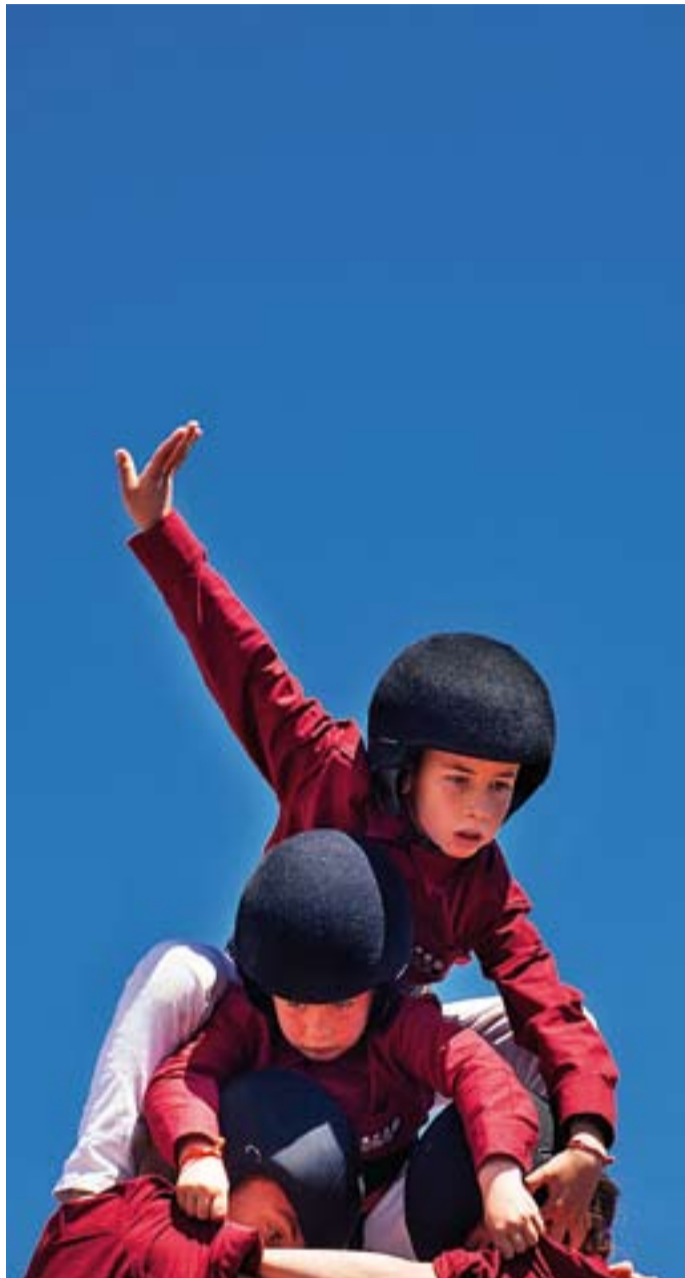
© Primer castell amb la camisa color bordeus. || Q. PASCUAL

Actualment els Castellars de Castellar del Vallès compten amb uns 120 socis. Tot i això, la colla està oberta a tothom qui hi vulgui entrar. “ Només s'ha de venir als assajos, que t'agradi, que tinguis ganes d'implicar-te i després tot surt rodat. Tothom pot venir a provar i si els agrada i se senten a gust amb la gent, s'hi poden incorporar ”, assegura Calsina. Els assajos són els dilluns i els divendres al vespre.