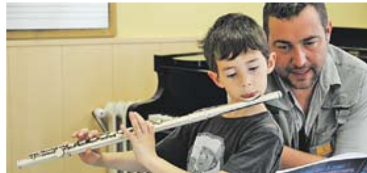
© Jornades de portes obertes de l'Escola de Música Municipal. || ARXIU