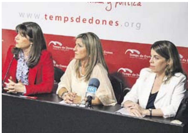
© M.J. García Cuevas, i M.Igual i A.García, a la presentació de Temps de Dones || R.G.

Malgrat que Temps de Dones va néixer com un grup avesat a les dones, des de l'entitat expliquen que a hores d'ara està obert a tot el conjunt de la ciutadania. A través de xerrades, tertúlies, i ronda de contactes