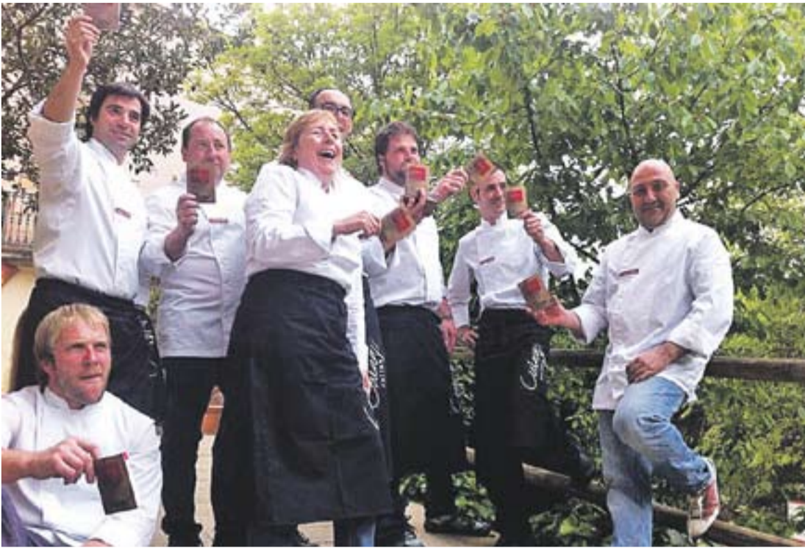
© Alguns dels xefs del col·lectiu Cuina Vallès amb el passaport a la mà. || CEDIDA