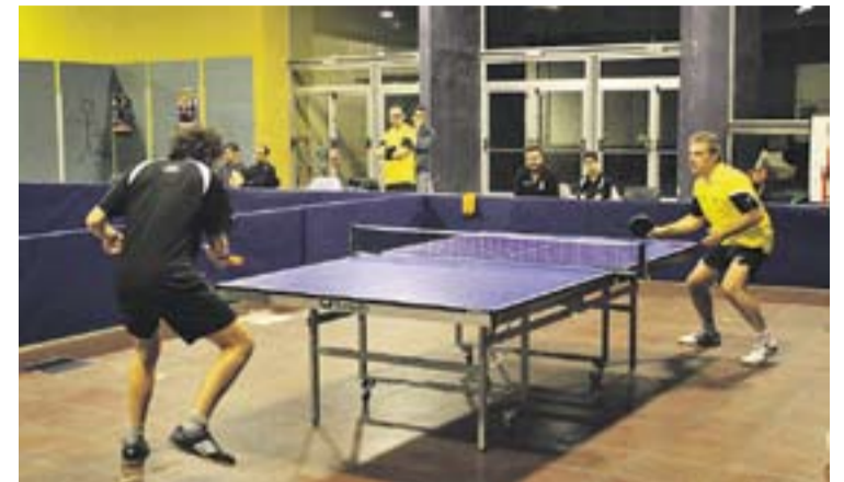
© Lluís Font, de groc, durant la partida que va donar el 2-2 a l’ATT Castellar. || M. CORNET