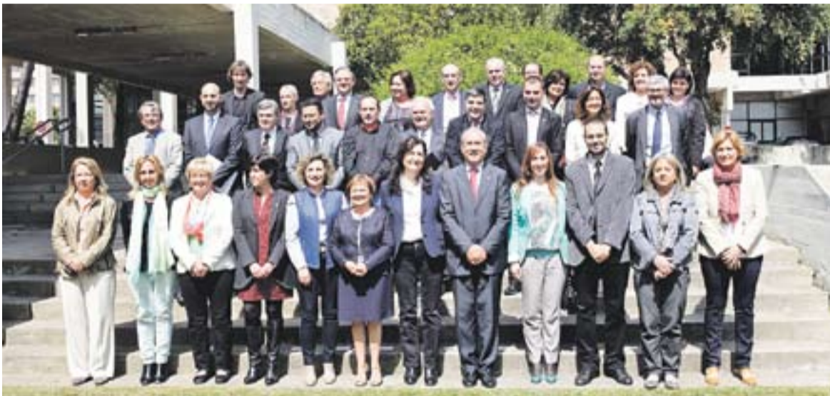
© L'alcalde de Castellar, el tercer per la dreta, amb els altres alcaldes i representants signants de la declaració || UGT

El document vol ser full de ruta per a la recuperació econòmica de la comarca