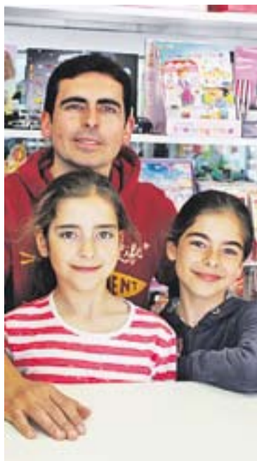
© El quiosquer Daniel Nicolás || J.R.

Aquestes títols no són bitllets integrats, és a dir, no permeten realitzar transbordaments amb altres línies de bus o mitjans de transport. El preu de la targeta V-1 és de 8,25 euros, mentre que la targeta V-2 té un preu de 16,25 euros. Ambdós abonaments comporten un estalvi del 20% per als usuaris respecte el cost dels títols integrats. +