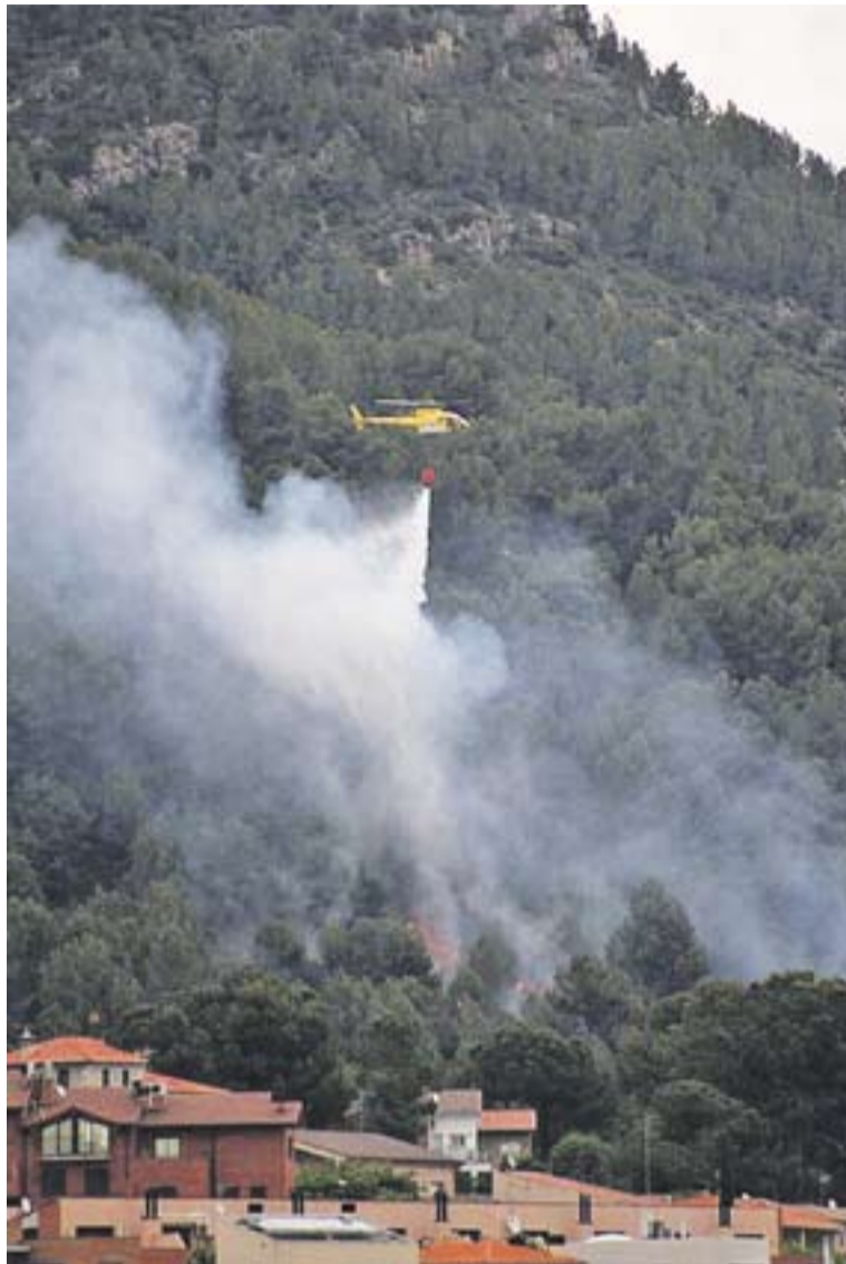
© Feines d'extinció del foc a càrrec de mitjans aeris. || V. CUERVO

na de fum ja era visible des de bona part de Castellar. Fins al quilòmetre 28,5 de la carretera C-1415-a -la carretera de Sentmenat- es van desplaçar nou dotacions de bombers, dos mitjans aeris i set terrestres, a més dels Bombers Voluntaris de Castellar i dels ADF de la vila, i efectius de la Policia Local i els Mossos d'Esquadra. L'orografia de la zona, de difícil accés, i les sobtades ratxes de vent van complicar la lluita contra el foc, que va cremar una hectàrea de vegetació forestal. Afortunadament, el vent va amainar, i al voltant de les 19 hores els bombers anunciaven la retirada dels mitjans aeris perquè el foc estava encerclat i en fase control. A les 21:15 hores el foc ja es va donar per extingit, malgrat que tres dotacions terrestres es van quedar al Puig de la Creu unes hores més remullant la zona per evitar que revifés el foc. †