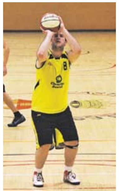
© Aitor Murúa, llançant. || M. CORNET

A la represa, però, el Castellar "va deixar de treballar tant en equip", en paraules del mateix Herrero, i aquest factor va acabar confluïnt en el cop d'autoritat del Martorell, que va ser gairebé definitiu. En l'últim quart, els groc-i-negres es van arribar a posar a vuit, però la