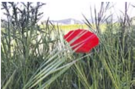
Comencen a sortir Autora: Ana Sánchez

Envia'ns fotos fetes amb el mòbil: lactual@castellarvalles.cat