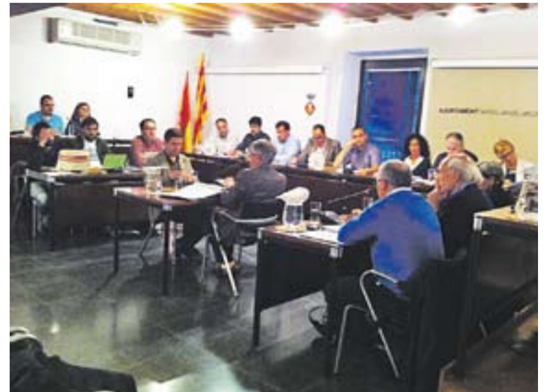
La sala de plens de Ca l'Alberola, dimarts passat.

NOVA ADJUDICACIÓ || Finalment, el ple va votar amb el 'sí' de PSC, CiU i PP i el 'no' de L'A tornar a adjudicar a l'empresa FCC la gestió de la neteja viària i la deixalleria municipal i el servei de recollida d'escombraries per un import anual d'1,7 milions IVA exclòs. Una de les empreses que licitava el concurs va presentar una esmena a l'aprovació que va tenir lloc en el ple de desembre passat i la taula de contractació va tornar a valorar la maquinària amb la qual es farà la recollida d'escombraries al cas antic. El resultat ha tornat a atorgar la màxima puntuació a FCC. ➔