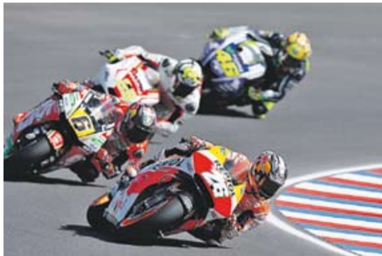
Dani Pedrosa durant el moment en que va liderar la cursa.

Pedrosa va anar remuntant fins col·locar-se tercer, mentre el pilot de Cervera lluitava amb Lorenzo per la primera posició i no va ser fins l'última volta que el castellarenc va passar al mallorquí, al qual Márquez ja havia