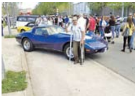
Un dia de passeig a... Autor: Abraham Egea