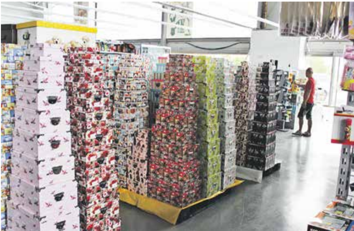
Un operari col·locant gènere dimecres passat en un dels passadissos de l'Híper Vallès

Híper Vallès, que ocupa un espai de 2.585 m 2 , obra dimarts les portes