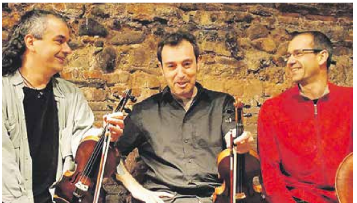
© Tres dels components d'Arcattia que oferiran el concert. || CEDIDA

Arcattia són un grup de cambra versàtil, amb experiència en els escenaris del país i amb el desig de posar en comú part de la literatura cambrística escrita per a cordes en les seves diferents formacions (des del duo fins al sextet) com a mitjà de desenvolupament musical i artístic. ✦ || M. ANTÚNEZ