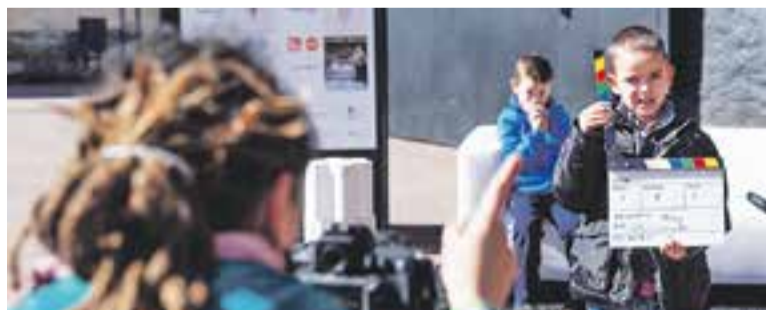
© BRAM infantil el febrer passat. || Q. PASCUAL

Els centres escolars de Castellar del Vallès han realitzat aquest curs 2013-2014 un total de 730 activitats, visites o préstecs de la Guia Didàctica, un recurs que ofereix la Regidoria d'Educació de l'Ajuntament. Enguany, la Guia Didàctica recollia 106 propostes distribuïdes en vuit àrees temàtiques: Coneguem la nostra vila (18), Castellar i el món cultural (19), Castellar i la salut (15), Castellar i el medi ambient (16), Castellar i el món agrícola (4), Castellar i l'empresa (7), Castellar i l'educació en valors (12) i Materials (15). Com és habitual, les propostes que arriben a més alumnes són les audicions musicals, el cicle de teatre per a les llars d'infants i pels centres d'educació infantil i primària i el teatre en anglès, activitats incloses dins de l'àrea Castellar i el món cultural. Aquest apartat ha inclòs com a nove-