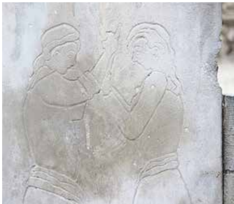
Detalls del monument a Joan Munt, mestre bastoner.