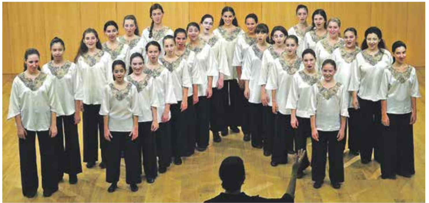
© Cor Bat-Kol Girls' Choir de Tel Aviv. || CEDIDA

El cor de noies Bat-Kol del Conservatori de Música de Tel Aviv (Israel), dirigit per Anat Morahg, es va fundar l'any 1984. Està format per uns 100 cantaires de 6 a 18 anys i es divideixen en tres grups. El mes d'abril de 2011 els cantaires de 12 a 18 anys va participar a l'Eslovàquia Cantat 2011- Concurs Coral Internacional, en el que van guanyar tres medalles d'or i el Gran Premi. La directora va ser guardonada amb el Premi Especial del concurs per la seva direcció. En anys anteriors, el cor Bat-Kol havia guanyat diversos premis i medalles en concursos de corals internacionals a Finlàndia, Àustria i Itàlia. El cor va participar al Festival Europa Cantat d'Utrecht l'any 2009 i va realitzar i participar en els tallers impartits per directors de renom mundial. El cor col·labora amb l'Òpera d'Israel, així com amb l'Orquestra Filarmònica d'Israel i altres orquestres. Els membres de Bat Kol reben una