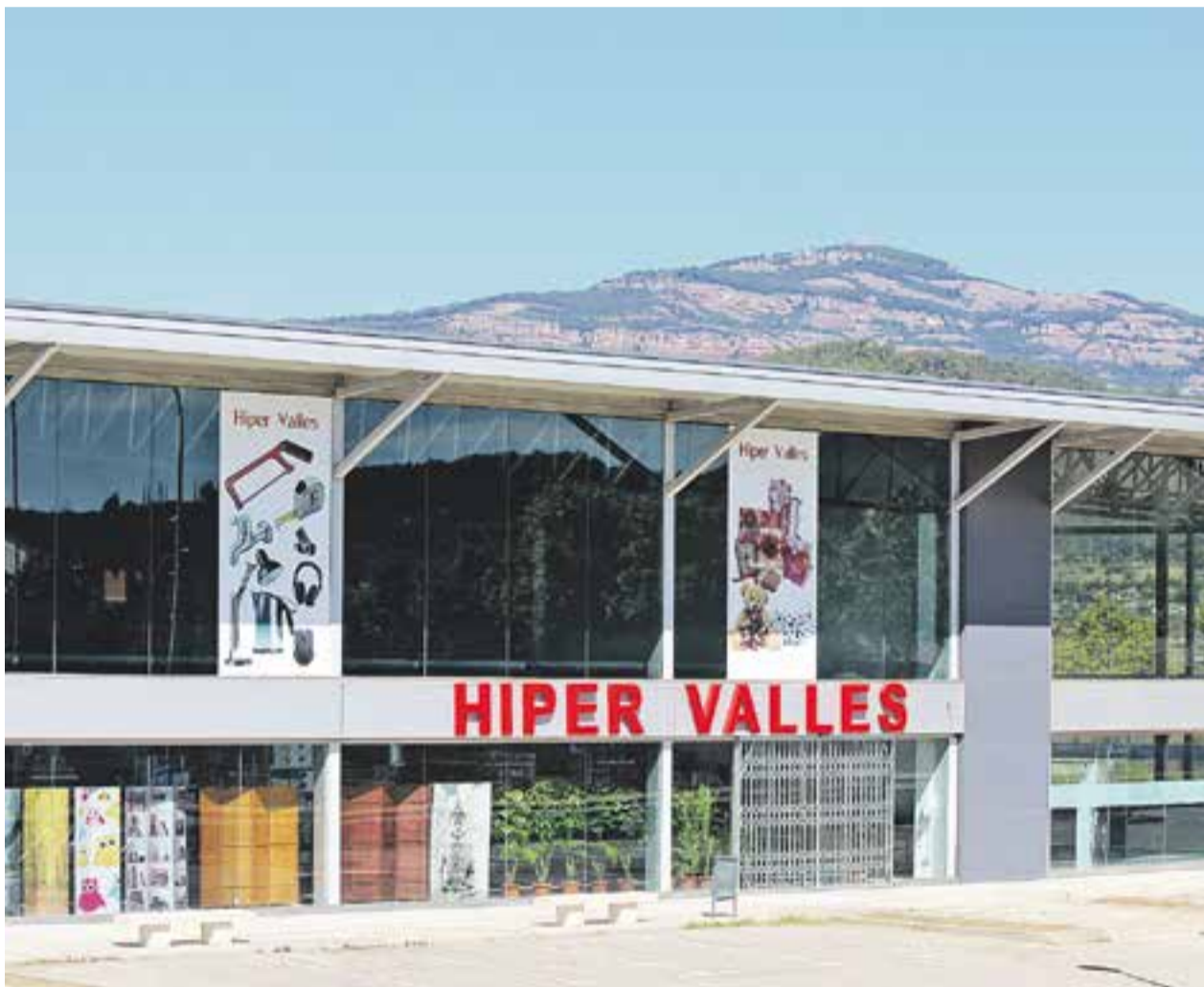
© Hiper Vallès, ubicat a l'edifici Impuls del polígon del Pla de la Bruguera, obrirà portes el pròxim dimarts. || C. MARTÍNEZ ACTUALITAT P5