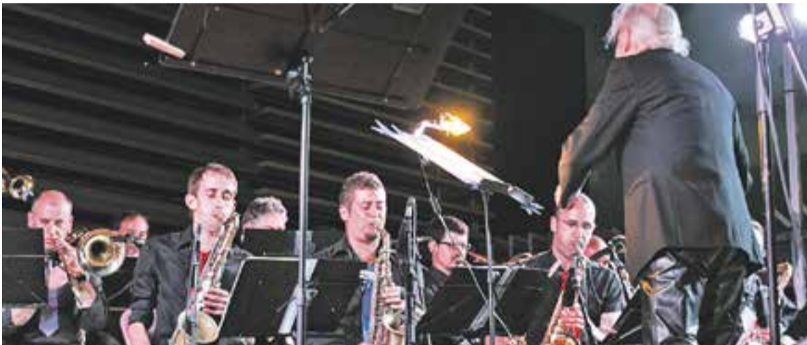
© A dalt, l'Orquestra Castellar. A sota, la Big Band.cat a la plaça d'El Mirador, divendres. || ÒSCAR MORENO - SERGIO RUIZ