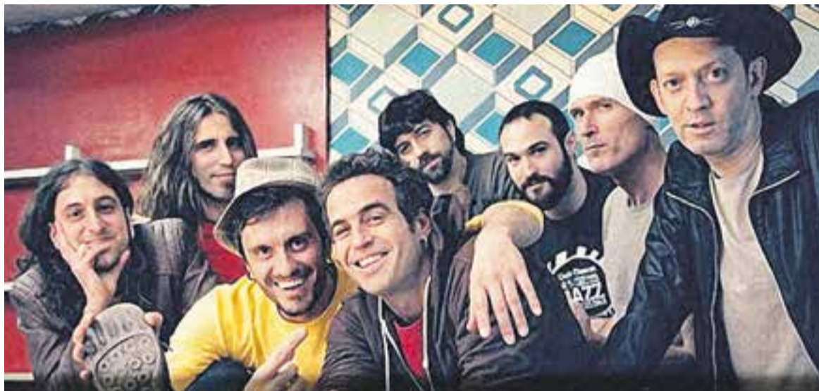
© Macedònia torna el dia 11 de setembre a la plaça d'El Mirador. A la dreta, Els Strombers, que actuaran el dia 13 de setembre al Recinte Firal de l'Espai Tolrà.