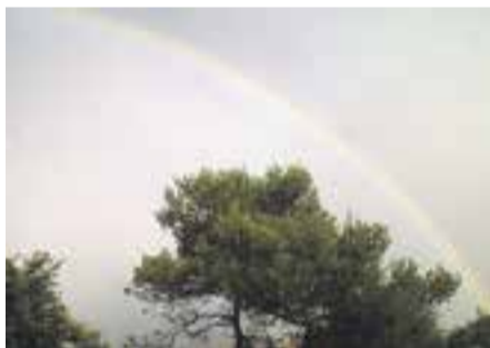
Arc de Sant Martí a Sant Feliu Autora: Pepi Lacambra