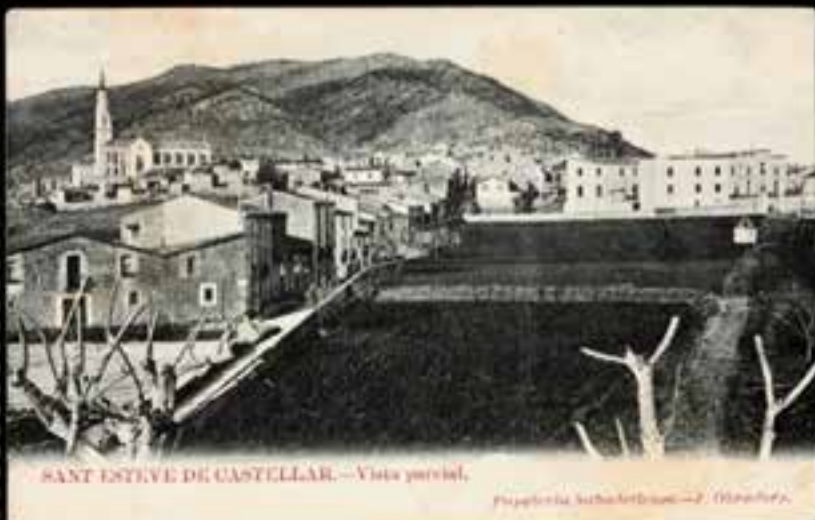
SANT ESTEVE DE CASTELLAR. -- Vista panoràmica.