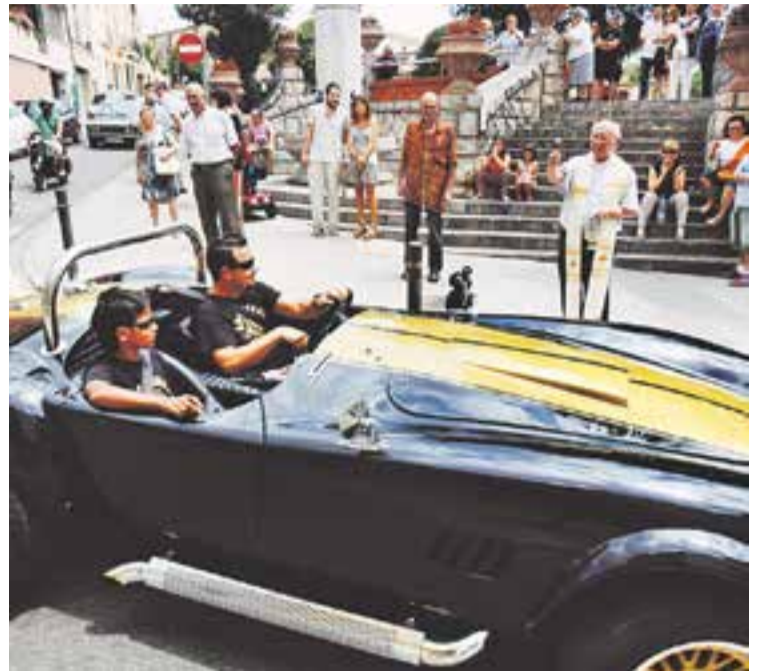
© Mossèn Villarino beneeix els cotxes a la font de la plaça Major. || Q. PASCUAL