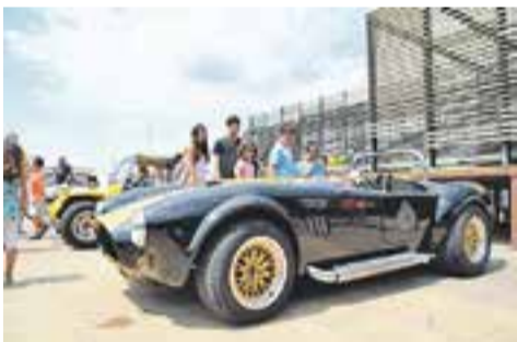
Fans dels cotxes

Envia'ns fotos fetes amb el mòbil: lactual@castellarvalles.cat