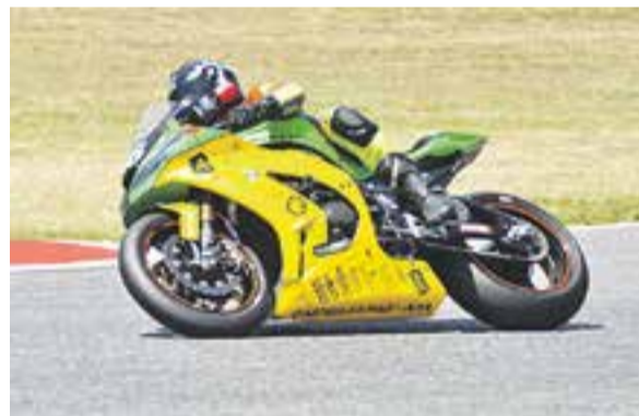
A dalt, sortida tipus 'Le Mans'. A sota, l'equip amb presència castellarenca. A la dreta la Kawasaki de l'APA-Castellarnau

ritat esta per sobre, fins hi tot, de la velocitat, com indica David Jaén en declaracions al programa de motor 'Peu al Ferro' de Ràdio Castellar: "La velocitat màxima en aquestes curses no és el principal tret, tot i que òbviament és important, la constància en la cursa es fa indispensable per poder mantenir