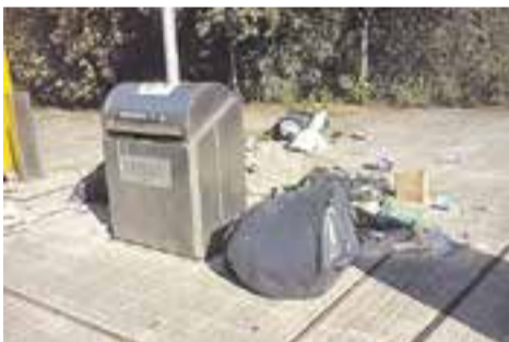
Sant Feliu del Racó, nou parc natural? Autor: Abraham Egea

Envia'ns fotos fetes amb el mòbil: lactual@castellarvalles.cat