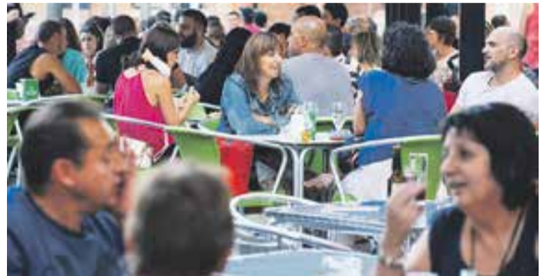
Ambient de terrasses als bars de la plaça del Mercat.

Els guanyadors dels tres premis que es sortejaven a través de les butlletes són Mireia Casajuana, que ha guanyat un cap de setmana a la Casa Rural