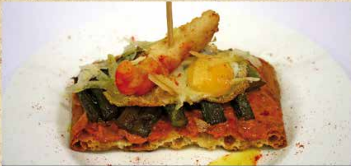
Pa de coca amb salsa de calçots, espàrrecs saltejats amb all, ou de guatlla, llagostí arrebossat i encenalls de formatge manxec.

"Mar i Muntanya" de Ca l'Aurora, la tapa més valorada pel públic en la 1a edició.