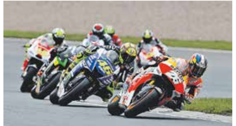
Dani Pedrosa lidera un grup en un moment de la cursa.