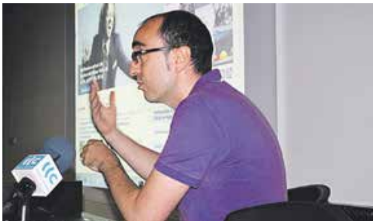
© Óscar Lomas en la presentació de la nova imatge. || C.DOMENE