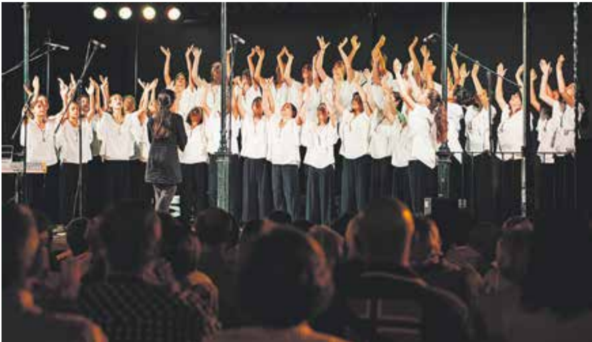
Les Bat-Kol Girls van combinar les seves veus amb una molt bona posada en escena.