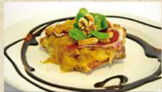
Coca amb Rosbif, de Cal Crustó