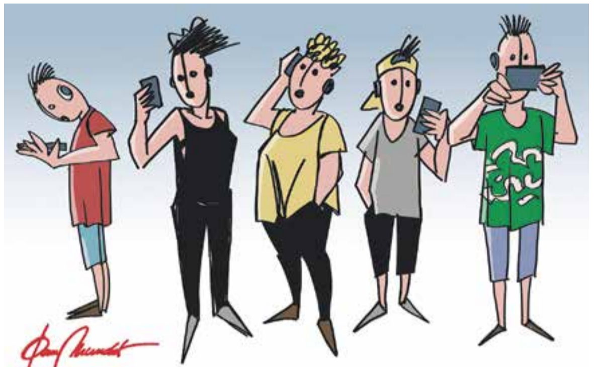
© La colla. || JOAN MUNDET

Tot té un caràcter exponencial, i aquesta és la grandesa de les xarxes socials però a la vegada és també la seva maledicció