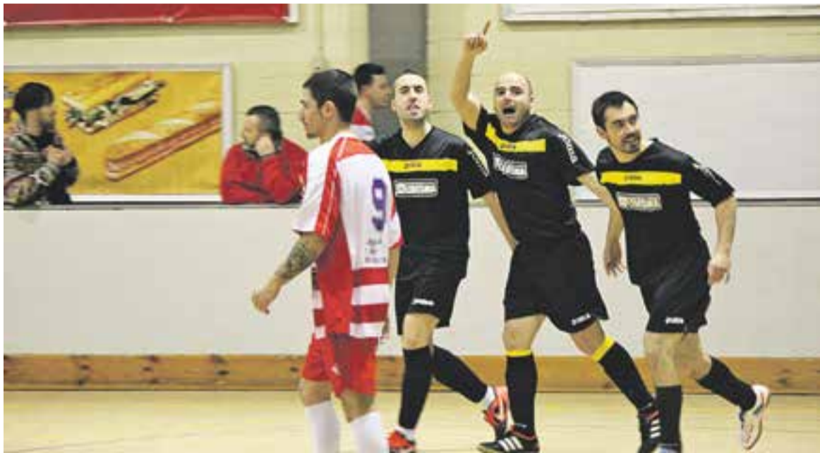
Els jugadors de l'Athletic 04 celebren un gol durant l'últim partit jugat a casa seva contra el Can Parellada.