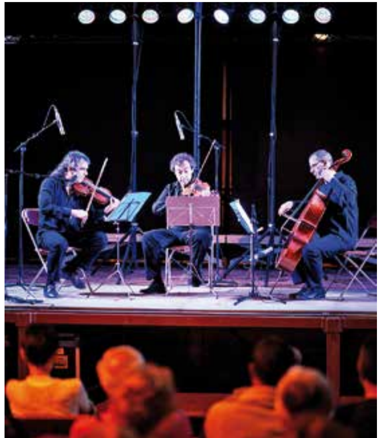
© Arcattia va repassar grans peces de la història de la música de cambra. || Q. PASCUAL

lunya. Acompanyades només per un teclat, les Bat-Kol Girls van demostrar la seva gran versatilitat musical, sent capaces d'interpretar qualsevol tipus de peça. "Canten música coral de tota mena. Tenen el seu propi repertori israelià, també canten cançons sefardites, cançons tradicionals d'arreu del món, temes clàssics, alguna vegada també han interpretat alguna peça d'estil blues o jazz..., o sigui que tenen un repertori molt ampli" , assegura Rosset. La instrucció musical que reben des de petites i la dura disciplina a la que són sotmeses aquestes noies es va fer palès amb probablement un dels millors espectacles de les Nits d'Estiu d'aquest any. Les Bat-Kol Girls han estat convidades a la 49a edició de les Jornades Internacionals de Cant Coral, que organitza la FCEC cada any i que s'ha celebrat al llarg d'aquesta setmana. Durant la seva estada a Catalunya, el cor ha actuat a diverses localitats catalanes, entre les quals es troba Castellar. Les noies israelianes van actuar al Palau de la Música dissabte a la cloenda del festival just abans de tornar-se'n a casa. ✦