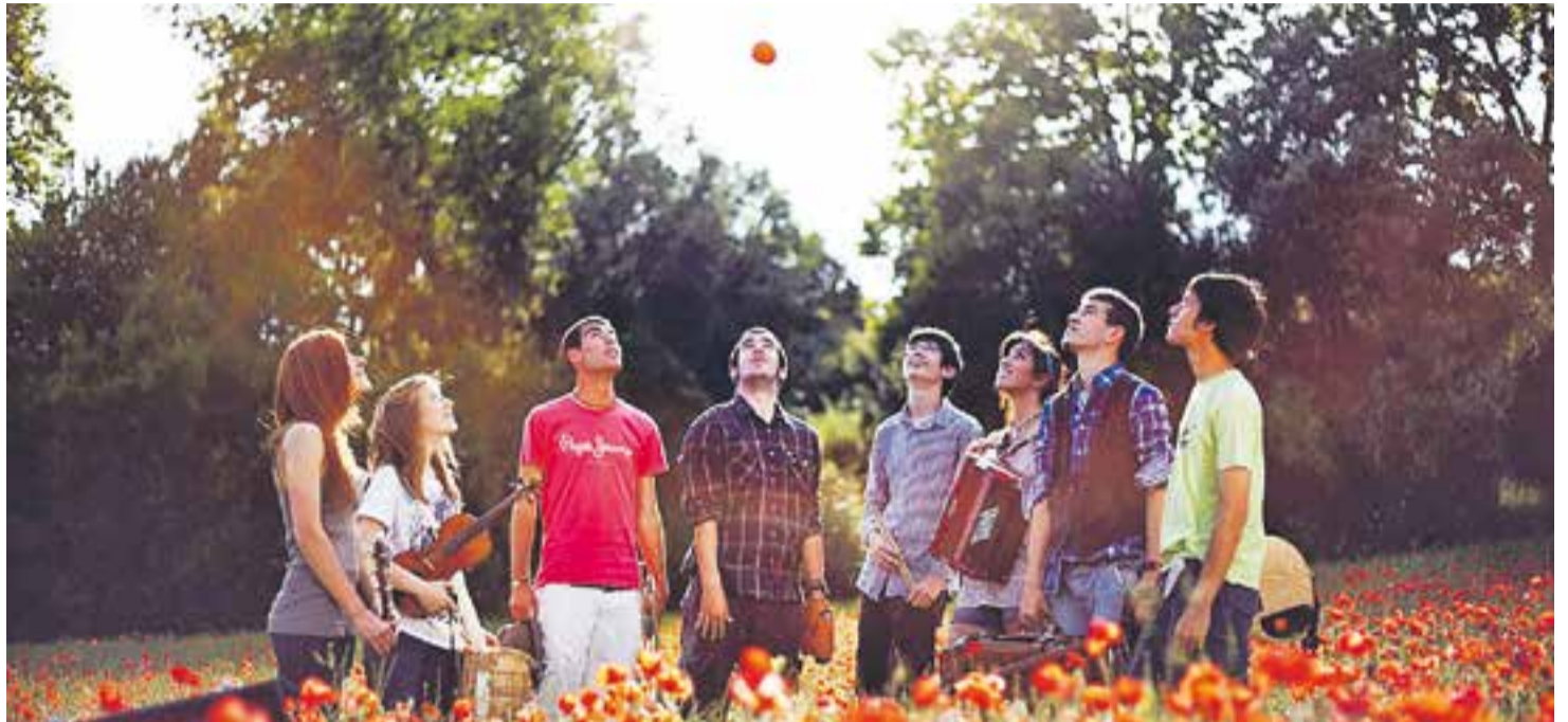
El grup terrassenc Sense Sal actua aquesta nit als Jardins del Palau Tolrà.

panorama de conjunts pop-folk apareguts en els darrers anys al país. Han estat seleccionats en diversos concursos i han ofert més d'un centenar de concerts. El grup ha guanyat diversos guardons i ha estat finalista del concurs de maquetes Sona9 l'any 2011. La formació va treure al mercat el seu primer treball discogràfic, 'Tardes de sol i préssecs', l'any 2011. Actua aquesta nit, a les 21.30 hores, als Jardins del Palau Tolrà.