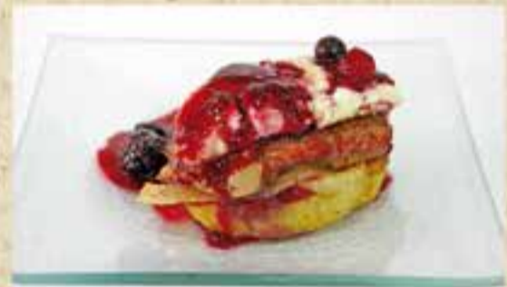
Filet de vedella amb fruites del bosc, de Bar Avenida

Les dues tapes, seguides de la 1a, més valorades: