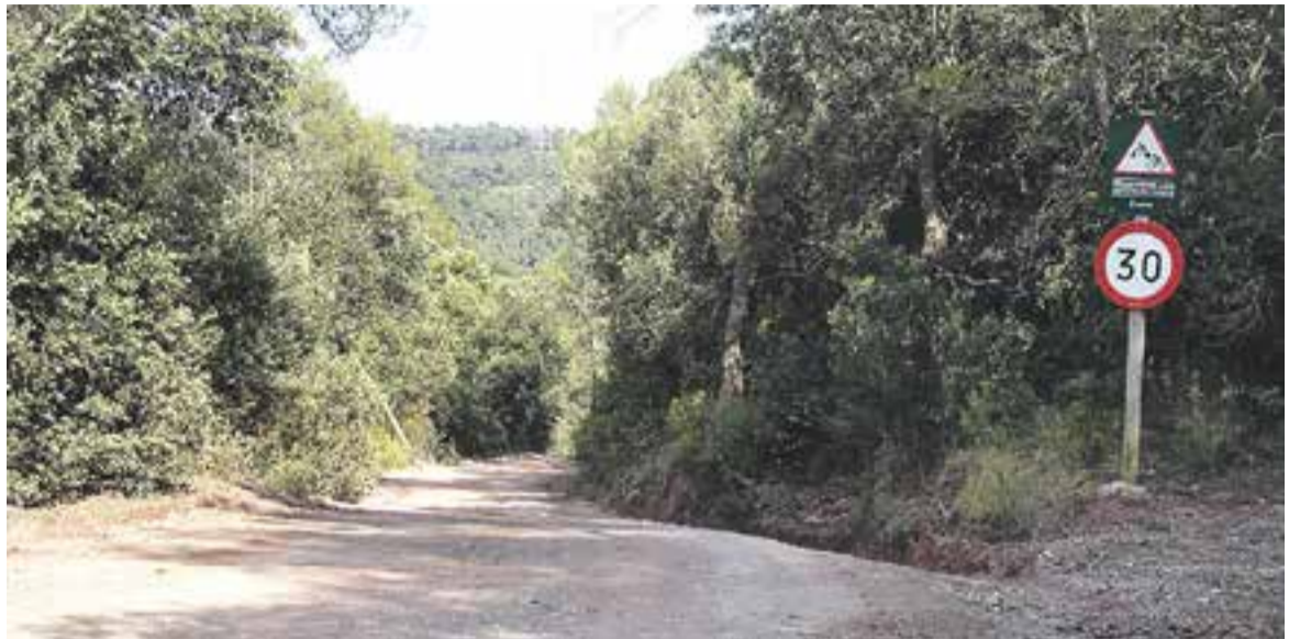
Senyal de limitació de velocitat a 30km/h al camí de Can Cadafalc.