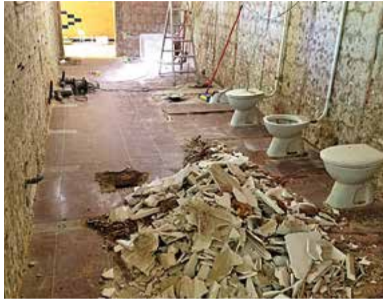
© Les obres als lavabos de l'escola Emili Carles-Tolrà ja han començat. || AJ. CASTELLAR

El pressupost per a aquestes actuacions és de 110.300 euros, que es finançaran a través d'una subvenció de la Diputació de Barcelona. L'empresa encarregada de fer les obres és la castellarenca Senecast, SL. A banda d'aquestes obres, durant aquest estiu es realitzaran també alguns treballs de manteniment a altres centres escolars de la vila, com ara feines de pintura i d'arranjament de desperfectes. +