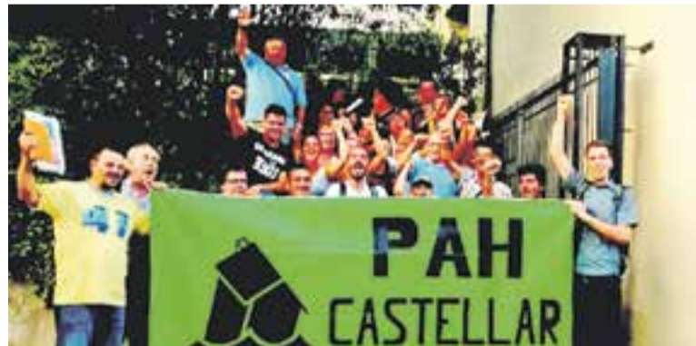
La PAH després d'escoltar el punt sobre habitatge debatut en el ple de dimarts.

La PAH de Castellar no es mostra satisfeta amb l'adhesió al conveni per crear un fons social d'habitatge que es va aprovar a la darrera sessió plenària perquè asseguren que "pot frustrar les negociacions de la PAH amb les entitats financeres per aconseguir lloguers socials a les pròpies llars de les persones afectades". La plataforma ha lamentat en un comunicat que fa mesos que l'Ajuntament no compta amb la PAH per treballar en els temes referits a l'habitatge "ni tan sols quan aquestes decisions que pren estan directament relacionades amb les persones desnonades o afectades per processos hipotecaris". Quant a les darreres mesures que ha aprovat l'Ajuntament en matèria