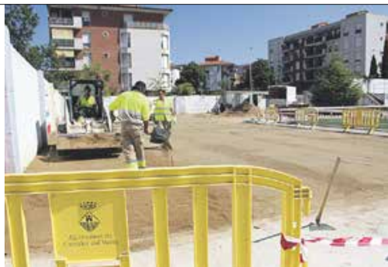
© L'àrea, de 450 m 2 , està situada entre els carrers Tarragona i Jaume I. || AJ.CASTELLAR

En total, el nou espai de gespa ocuparà 420 m 2 , mentre que la resta de metres l'ocuparà un paviment de formigó. Es preveu que els treballs, que tenen un cost de 10.000 euros, finalitzin a finals del mes de juliol. +