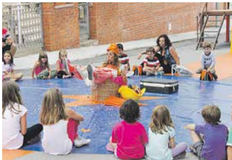
⊙ Activitats infantils del diumenge al migdia. || S. RUIZ

en què, per un preu de 10 euros, qualsevol podia gaudir d'un sopar, que després es va convertir en un ball, amb els veïns de la urbanització. La festa va continuar diumenge de bon matí amb una xocolatada popular. Tot seguit havien d'actuar els Castellers de Castellar del Vallès, però finalment no ho van poder fer. Al migdia, les celebracions van continuar amb el tradicional bany d'escuma, que ha canviat