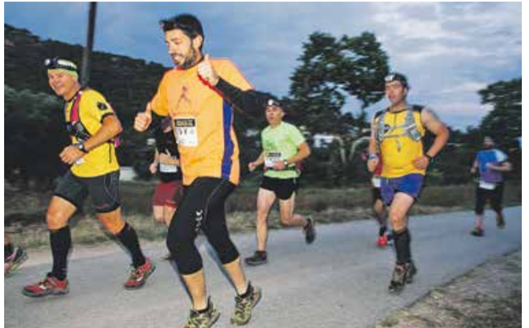
© A l'esquerra, imatge dels moments previs a la sortida, a davant de l'església de Sant Feliu del Racó; i, a la dreta, els participants en la cursa nocturna Salamandra Trail, en plena competició. || Q. PASCUAL