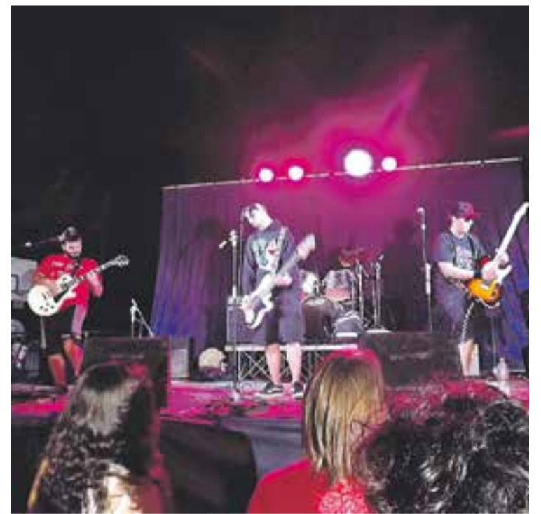
⊙ Un moment dels concerts d'Elkintopino Music Festival.

"A tots, els volem donar les gràcies per donar-ho tot, i també als tècnics de llum i so, cuiners, cambriers, ajudants, socis i públic que ens va acompanyar, a l'Ajuntament, pels equips cedits i tot el que comporta aquest tipus d'esdeveniments" , conclouen. ✦