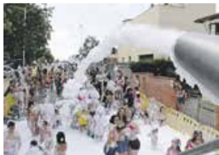
'Selfie' amb escuma Autor: Sergio Ruiz