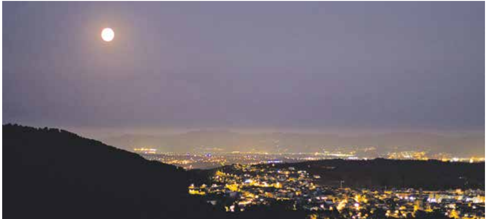
⊙ Panoràmica de la Superlluna des de Sant Feliu del Racó el passat 10 d'agost.

La mitjana de temperatures màximes ha vorejat els 30 graus, un grau per sota que l'any passat. Enguany la xifra rècord que s'ha assolit ha estat de 35 graus, la mateixa temperatura màxima que es va registrar el juliol del 2013. "L'última setmana d'agost s'han registrat les temperatures més altes de tot l'estiu. Amb tot, no hem tingut dies de calor intensa i això condiciona la nostra percepció. Després de 3 dies de calor tornava a refrescar", explica el meteoròleg Jordi Moré. "Durant juliol i agost no s'ha produït cap onada de calor i les temperatures han estat lleugerament