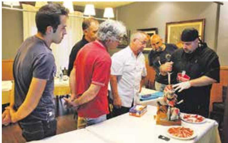
Primer taller de pernil de la Carnisseria Casé el juliol passat.

La Carnisseria Casé programarà l'últim divendres de cada mes, de 20h a 23h, al restaurant Frutos (c/Lleida, 8), un taller sobre el pernil ibèric. Precisament aquest divendres tindrà lloc una de les sessions, que s'iniciarà amb una xerrada interactiva amb un expert en pernills de la casa Juan Manuel de Guijuelo –distribuïdor des de fa 30 anys de Casé–, i un tallador de pernil. Durant les explicacions s'encetaran diferents tipus de cuixa que els assistents degustaran a l'hora que aprenen tot els secrets d'aquest producte. De fet, entre els conceptes que es treballen al taller es troben els criteris per triar un pernil, les diferències entre els pernills de gla, d'enceball o d'engreix tant per forma com per gust, els tipus de ganivets que s'han de fer servir per tallar-lo, les parts d'un pernil, com s'han d'encetar i tallar-lo, les normes de seguretat quan es talla una peça o les normes de manteniment i conservació. “Volem que la gent descobreixi el món del pernil ibèric, que pugui distingir entre els produc-