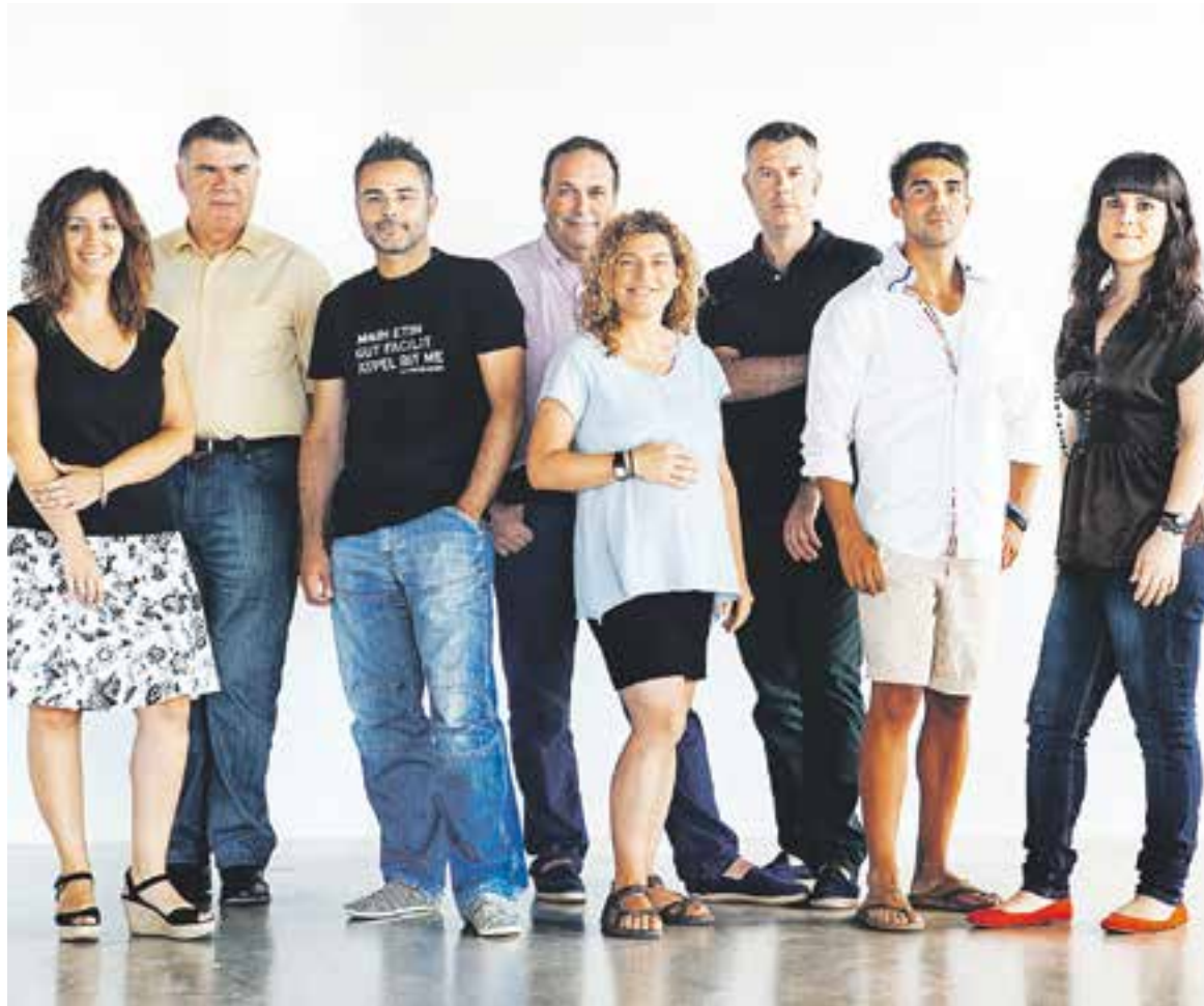
📍 L'equip de disseny i redacció de L'ACTUAL. || Q. PASCUAL

Aquest exemplar que teniu a les mans és l'edició número 300 de L'ACTUAL. 300 números fets amb l'objectiu d'oferir informació de proximitat a Castellar a través d'una cita setmanal tots els divendres des del 15 de febrer del 2008. Després de 300 números, la vocació d'informar la societat castellanca es manté viva en suport paper –es distribueixen 5.000 exemplars tots els divendres d'entre 24 i 32 pàgines- i s'ha eixamplat amb èxit –des d'octubre de 2010- al món digital gràcies al portal LACTUAL.cat –que integra els continguts de L'ACTUAL i de Ràdio Castellar- i la seva presència informativa a les principals xarxes socials oferint actualitat minut a minut. Per tant, als 5.000 exemplars de paper setmanals s'ha d'afegir una audiència de gairebé 10.000 usuaris únics mensuals de LACTUAL.cat, segons dades obtingudes a través de Google Analytics.