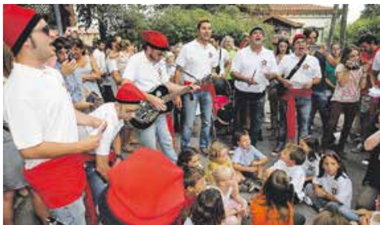
© Les tradicionals Cantades de Sant Feliu (2013). || ARXIU

A la tarda, a les escoles, s'han programat diverses activitats per a petits i grans, de 17.30 h a 19.30