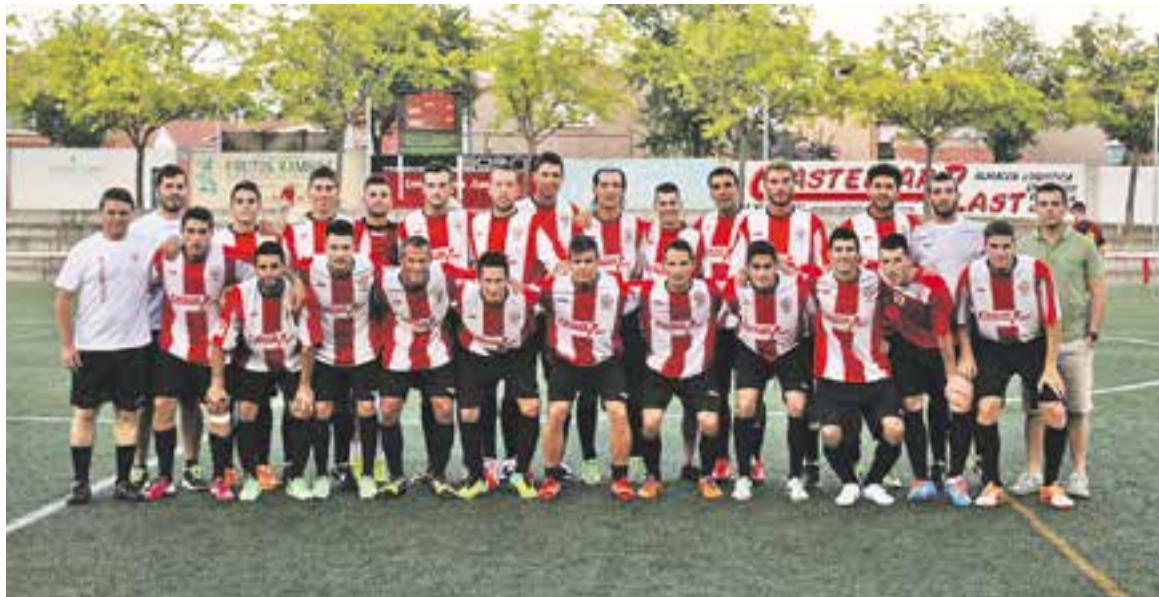
© Bona part de la plantilla de la Unió Esportiva Castellar 2014-2015, abans de l'amistós contra el Mercantil.