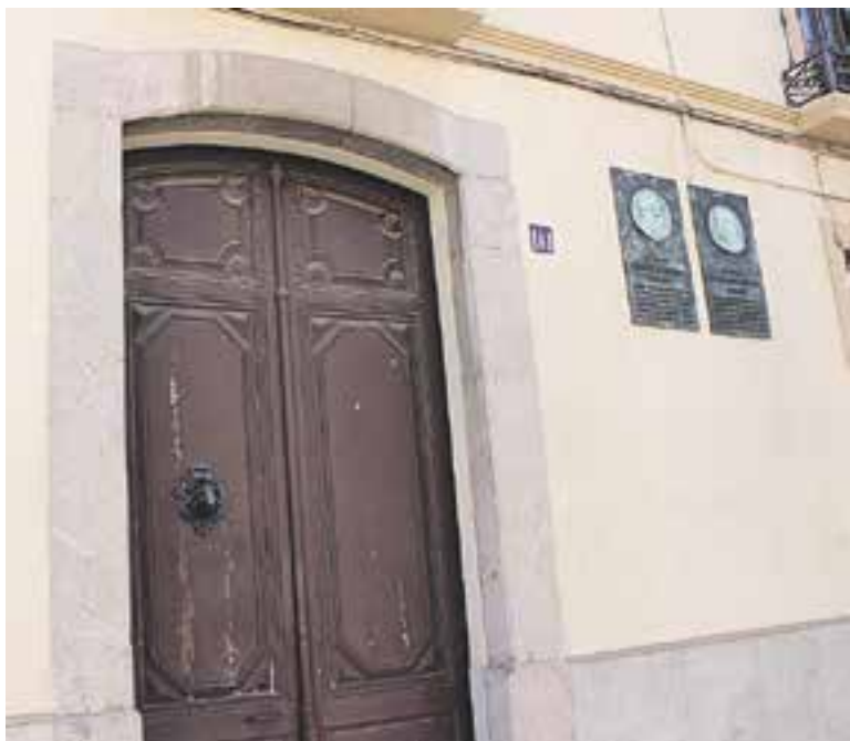
Plaques d'homenatge a la façana del carrer Passeig.