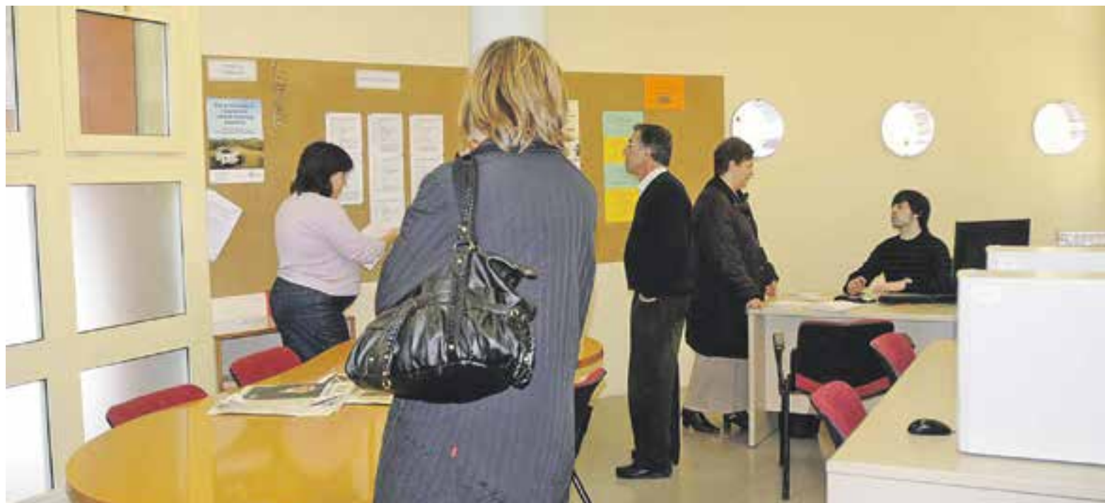
Imatge d'arxiu de l'espai on es gestionen les ofertes de la Borsa de Treball del Servei Local d'Ocupació (SLO).

Les ocupacions més demanades a les ofertes són perfils tècnics relacionats amb el metall (oficials de primera ajustadors, soldadors, planxistes, calderers...), electricistes i lampistes, peons d'indústries manufactureres i les relacionades amb hostaleria, cambrers i ajudants de cuina. En menor quantitat, es sol·liciten professionals relacionats amb la cura de persones grans, ja sigui a la llar o a residències,