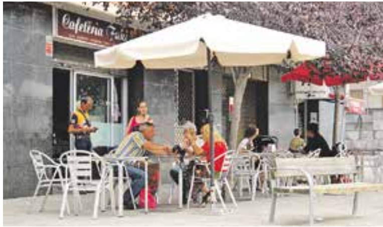
Terrassa del bar Fuki, local ubicat a la Plaça Major.

En arribar al lloc, els agents van comprovar que els presumptes lladres havien forçat la persiana exterior però que no havien sostret cap objecte i que havien marxat del lloc. Es va muntar un dispositiu de recerca per