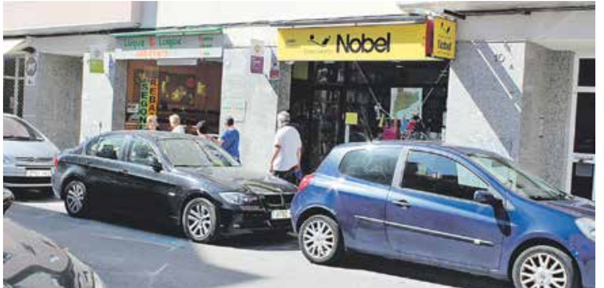
Aspecte dels comerços del carrer Sala Boadella aquest dimecres.

L'Associació Catalana de l'Empresa Familiar del Retail (Comertia) ha fet públiques unes dades on es constata que