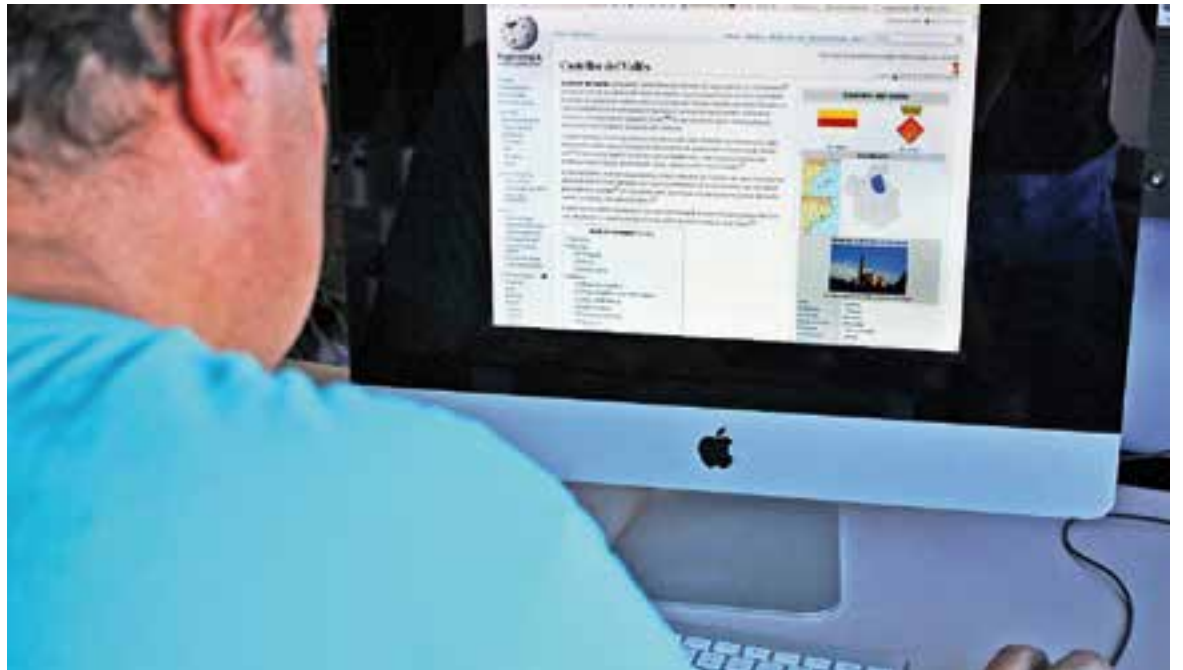
© Entrada sobre Castellar a la Viquipèdia. || C. MARTÍNEZ

“A la Viquipèdia has de referenciar-ho tot, no pots posar-te a escriure el que et sembla, sinó que hi ha d'haver una font que ho validi”, afegeix Niñerola. La idea és que, com aquest article, se n'hi afegeixin d'altres actualitzats i contrastats sobre Castellar. Per tant, tot i que les entrades les pot fer tothom, hi ha un conjunt de persones vigilant que allò que s'escriu tingui veracitat, es remeti a una font. “En el cas de Castellar, hi ha moltes referències a Plaça Vella, ja que és la revista