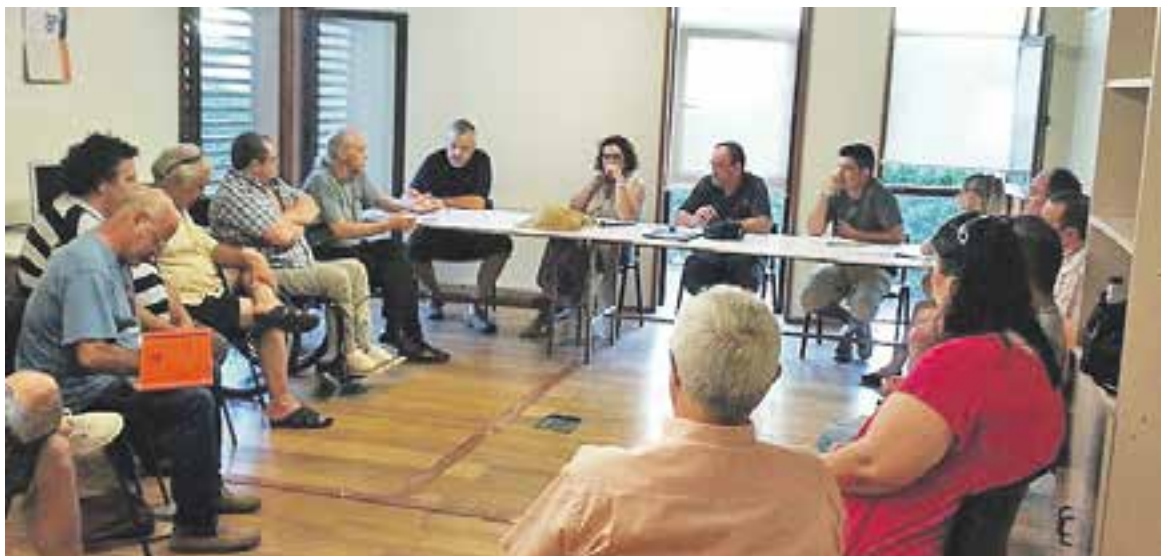
Trobada amb amb membres d'ERC i la plataforma d'aturats de Sant Vicenç dels Horts.

la urgència de donar sortida a la difícil situació en què es troben molts dels vilatans. Segons explica el RAF, en la reunió, els representants de l'Ajuntament es van comprometre a prendre mesures per incentivar la contractació de gent del municipi per part de les empreses. A banda d'aquesta trobada, el grup RAF va tenir una segona reunió el 30 de juliol amb membres d'ERC i la plataforma d'aturats de Sant Vicenç dels Horts, per parlar del model energètic de la biomassa i de les oportunitats que aquest model planteja. + || REDACCIÓ