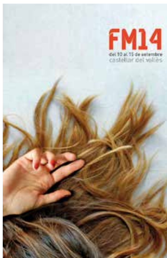
📍 Cartell de la Festa Major. || C. MARTÍNEZ

Hi ha qui hi veu una persona que dorm, o dues, d'altres, algú que escolta música, que fa mandres, que salta, que parla pel mòbil, que recorda el concert d'ahir o el primer petó. L'important no és el que sembla, sinó el que hi veu cadascú. I tu què hi veus? Opina a les xarxes socials amb el hastag #cartellfmcastellar14. +