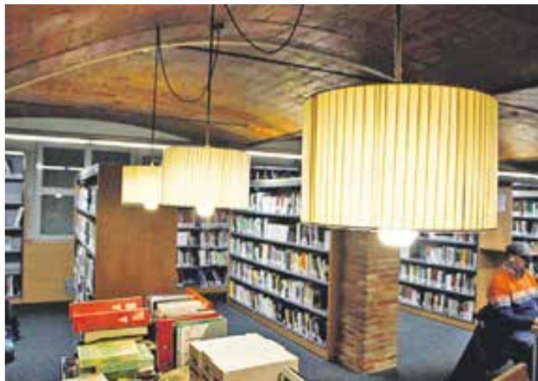
© Imatge de la biblioteca municipal Antoni Tort. || ARXIU

pal, Antoni Tort, opinen que aquest cànon repercutirà en les compres de material (uns 8 lots l'any, aproximadament) perquè els diners destinats a això hauran de servir per pagar la nova taxa "i possiblement disminuiran les adquisicions que ara arriben a través de la Diputació de Barcelona i la Generalitat de Catalunya", han explicat.