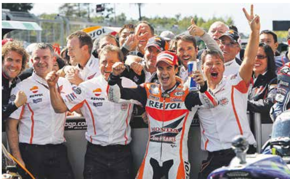
Dani Pedrosa celebra el triomf a Brno amb el seu equip.

El castellarenc aspira a tornar a guanyar al gran premi de Gran Bretanya