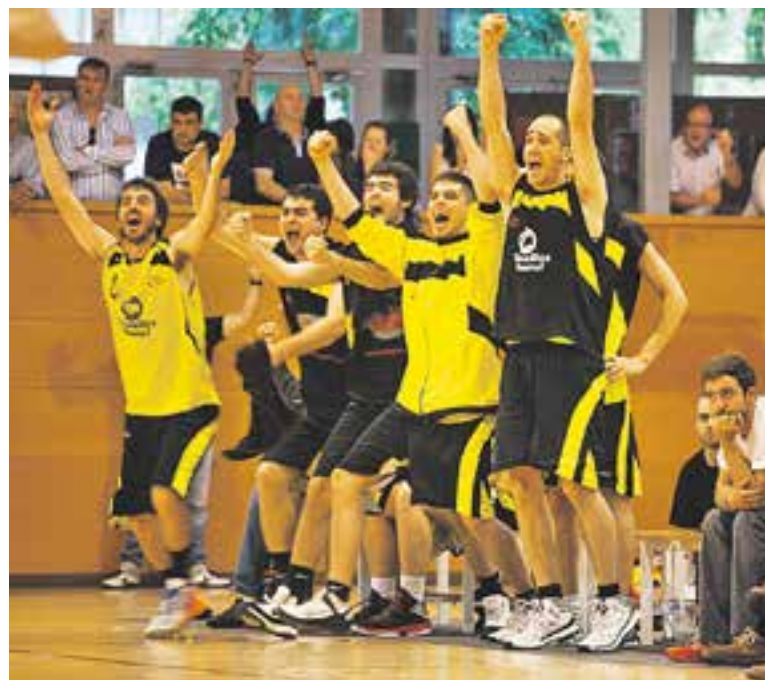
Els jugadors celebren la permanència de la temporada passada.

Per a aconseguir totes aquestes fites, Bordas té molt clar que també s'ha d'afiançar l'apartat econòmic: "A hores d'ara es pot dir que estem sanejats. Però per a millorar esportivament s'ha de reforçar l'organigrama del club, i això passa per fer evolucionar també la política econòmica. Tot plegat s'ha de fer pas a pas, a la