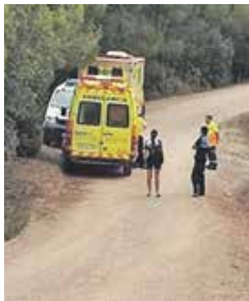
© Una ambulància atén un ciclista accidentat al camí de Can Cadafalc. || J. PRATS

"Fa un mes, gairebé cada dia, teníem avís d'un ciclista accidentat. Per sort, després de les campanyes d'informació, les patrulles dels ADF i la conscienciació dels ciclistes, hi ha hagut una disminució molt important dels accidents" . +