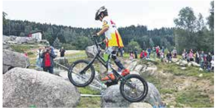
© Rovira, durant un moment de la competició a la República Txeca. || CEDIDA

CICLISME | CAMPIONAT DEL MÓN DE BIKE TRIAL