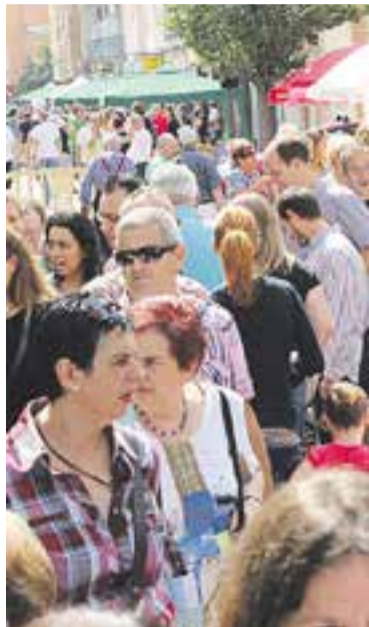
La fira de l'any passat.

A la fira hi haurà tant presència de comerços locals com de fora de la vila, que oferiran