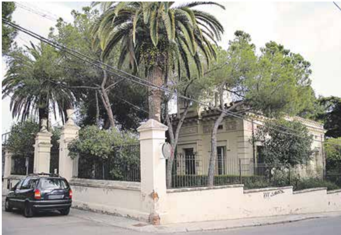
La façana i la tanca perimetral de l'Escola Municipal de Música Torre Balada es restauraran.

Uns altres 106.000 euros es destinaran a la conservació i manteniment de l'enllumenat públic, im-