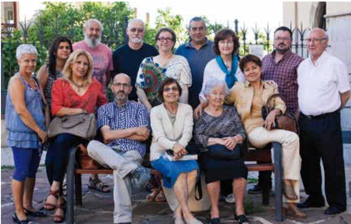
© Voluntaris de Via Solidària-Càritas, juliol 2014. || Q. PASCUAL

Una actuació de Dansa Parc tancarà l'acte d'entrega als jardins de Palau Tolrà