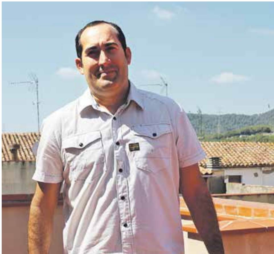
© Juan Carlos Blas, autor de la novel·la 'Siempre lo supe'. || M. ANTÚNEZ

La novel·la s'ha publicat amb Círculo Rojo, que s'encarrega també de gestionar els canals de venda: FNAC, Amazon, etc. La idea és que el llibre surti publicat no només a Catalunya, sinó també a l'Estat i al Perú, "on hi tinc contactes". L'obra forma part d'una trilogia, "tot i que la publicació de les dues següents dependrà de l'acceptació que tingui aquest primer volum". Està destinat als lectors amants de les històries de persones i el suspens. +