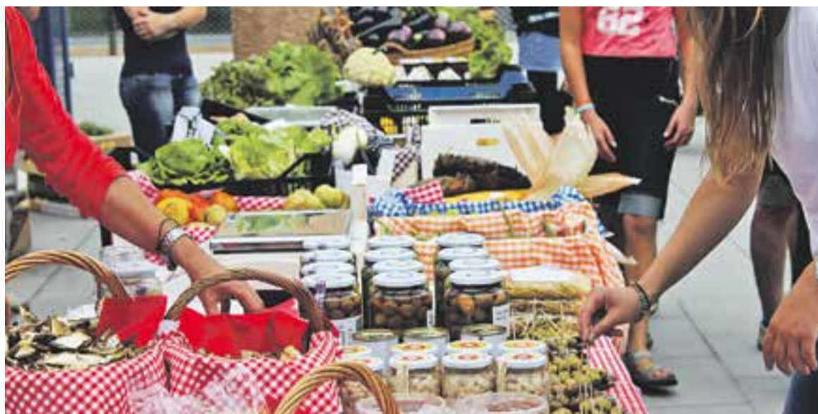
⊕ Mercat de productes de proximitat celebrat durant la Festa Major de l'any passat.

Una repassada al programa d'aquesta Festa Major permet comprovar la gran quantitat d'entitats, comerços i empreses que estan implicats en l'organització d'actes. Per exemple, l'associació de veïns Nou Eixample ofereix múltiples cites com la caldereta al carrer Galícia