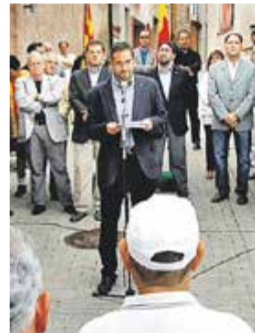
☉ Acte institucional del 2013.

Els tres acords de la proposta expliciten que l'Ajuntament assumeix i manifesta “el compromís i disposició” a cooperar amb les institucions per fer possible l'organització de la consulta el 9 de novembre i a donar suport al president de la Generalitat quan es faci la consulta. El segon acord estableix fer arribar aquest compromís a l'ANC abans d'aquest 11 de setembre perquè, “de forma conjunta amb d'altres organitzacions del teixit associatiu de Catalunya”, el facin arribar a la