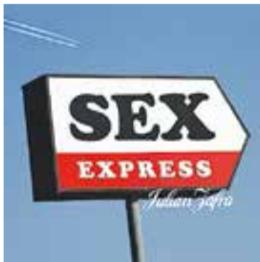
Portada del nou treball.

"Penso que hi ha música bona i música dolenta, independentment