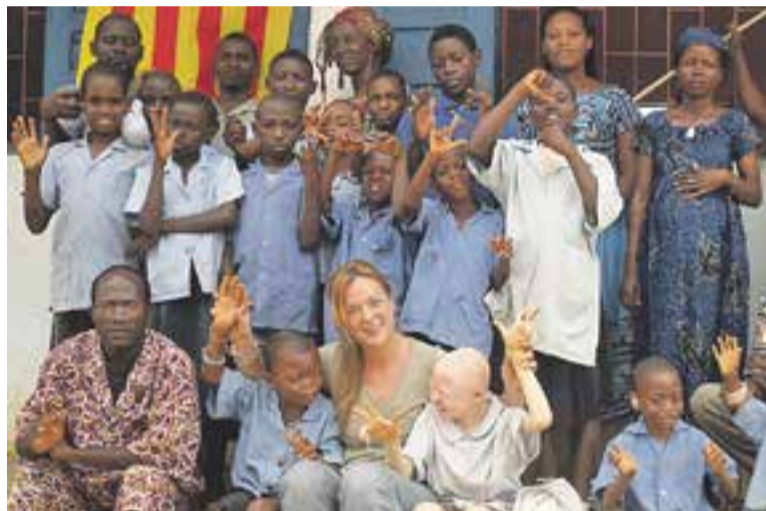
© Escola de sords IMSHA d'Éseka al Camerun amb membres de Codes-Cam. || CEDIDA

També es finançarà un projecte de la Lliga dels Drets dels Pobles en favor de les associacions de gestió i desenvolupament del Paranapura que impulsen el desenvolupament comunal sostenible a través de propostes impulsades per joves i dones capacitats. Així mateix, es finançarà la segona fase del projecte "Huertas de la Esperanza", que du a terme Castellar x Colòmbia a Cundinamarca, Colòmbia. També repetirà l'ONG Codes-