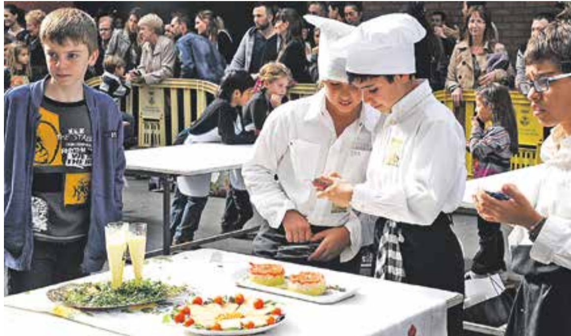
© Uns participants a la Mostra de Petits Cuiners del 2012 fent una fotografia de la seva creació. || ARXIU

Qui sí presenta novetats en aquesta Mostra és Cárnicas Merche, que ha estat treballant fins al darrer moment per incorporar la seva darrera novetat: les croquetes sense lactosa i sense glu-