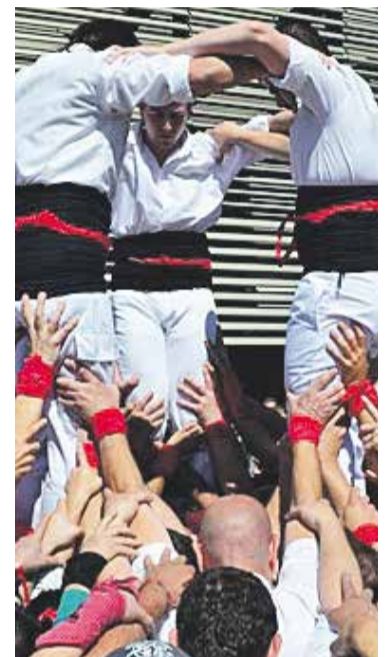
© Bateig dels Capgirats. || Q. PASCUAL

Aquest divendres 17 i dissabte 18, els Castellars de Castellar han anunciat que faran a la vila una actuació anomenada 'Correpilars' "en agraïment als patrocinadors que ens van donar suport pel nostre bateig de l'abril passat" , expliquen en un comunicat. En concret, els 'Capgirats' faran aquest divendres a la nit quatre pilars davant d'alguns bars que han col·laborat amb l'entitat. La cita arrencarà a partir de les deu de la nit a la zona de l'Espai Tolrà. L'activitat del 'Correpilars' continuarà el dissabte al matí entre les deu i la una a la resta de comerços que van patrocinar el seu bateig. Els pilars es faran a partir de les 10 del matí a l'avinguda de Sant Esteve. Amb aquestes actuacions els Castellars de Castellar volen agrair públicament als comerços i establiments col·laboradors el seu suport. + || REDACCIÓ