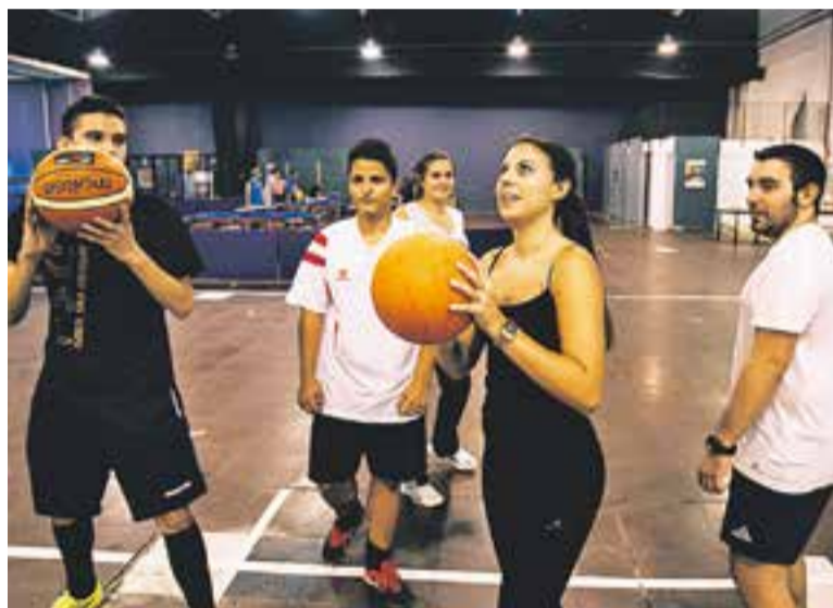
Dues imatges de les activitats joves del cap de setmana passat.