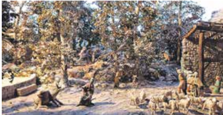
© Imatge d'un diorama exposat en la mostra de l'any passat. || ARXIU

Segons informa a través d'un comunicat el Grup Pessebrista de Castellar del Vallès, la