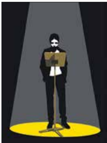
© Cartell del cicle 'Llegides'. || ARXIU

Aquest diumenge, a les 18:30h, tindrà lloc a l'Auditori Municipal la projecció d'una nova pel·lícula dins del cicle de cineclub de Club Cinema Castellar Vallès. En aquesta ocasió es tracta del film Hermoda juventud , dirigit per Jaime Rosales i estrenat aquest 2014. Enguany, el drama, que ha rebut una bona crítica per part dels espectadors, ha estat guardonat al Festival de Cannes. La pel·lícula escenifica la complicada vida de dos joves enamorats que, mancats de recursos, lluiten per sobreviure a l'Espanya actual. Sense massa esperances ni ambicions, una filla en comú uneix els protagonistes per fer front a la situació. Natalia i Carlos, interpretats per Íngrid García i Carlos Rodríguez, es veuen finalment forçats a rodar una pel·lícula porno amateur per guanyar diners. + || GUILLEM PLANS