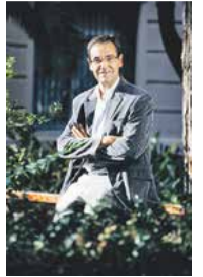
© Giménez compleix el seu segon mandat a l'alcaldia de Castellar || Q. P.

Segons informen els socialistes a través d'un comunicat, en el cas que més d'un candidat aporti els avalls necessaris, les eleccions primàries es celebraran el 22 de novembre. Si es presenta un únic candidat, la seva elecció es sotmetrà a la votació