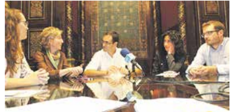
© Representants d'Humana i de l'Ajuntament en la signatura. || AJ. CASTELLAR