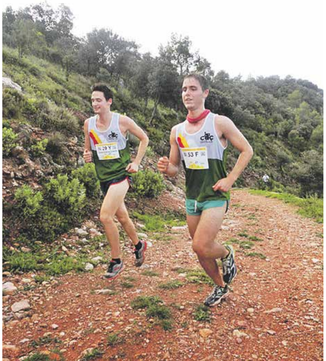
Ⓞ Dos atletes del CAC en un dels trams de la nova cursa que organitza l'entitat castellarenca.