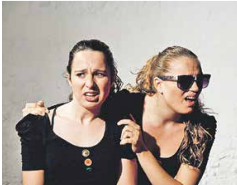
Les dues protagonistes dels 'Sis misteris'.

Els diàlegs extrets de 'Misteri Buffo' de Dario Fo, contraposen el català antic ple d'ornamentacions lingüístiques amb una posada en escena molt senzilla, i ens porten temàtiques tan conegudes com la crucifixió de Jesús o la resurrecció de Llätzer. Escenes on els pobres són pobres i els poderosos segueixen tenint el poder per sobre de la humilitat i la compassió. Els personatges ens mostren la part més incòmoda de la societat on els interessos i l'avarícia són el que predomina en temps difícils. Amb representacions on el Papa s'ornamenta amb peces d'or, i on el poble treu benefici econòmic a