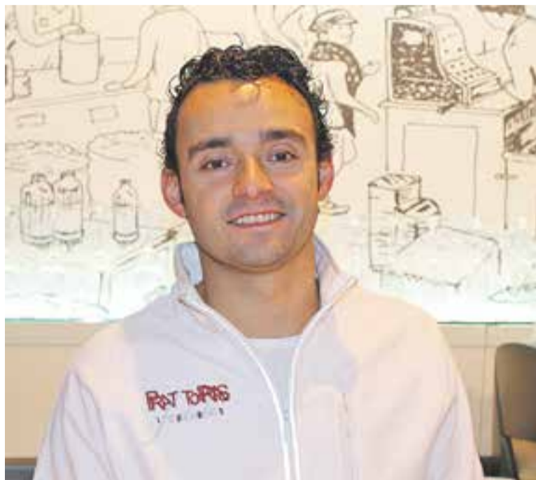
© Esteve Torras a la parada de la cansaladeria Prat-Torras. || J. RIUS

• Els descomptes que aplicareu no són per a tots els productes? No. Cada paradista ha posat el