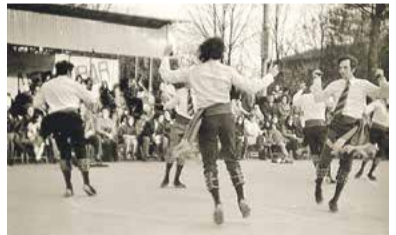
A dalt, ballada al pavelló (2014). A baix, ballada a plaça dels anys 70

De fet, Castellar és dels pobles on hi ha més colles. La junta actual està impulsant des de fa tres anys el projecte d'una sisen colla, intermèdia entre casats i solters. També intenten buscar més balladors, sobretot nens i petits. És un moment de construcció, difícil segons Comellas, "però també maco, perquè fem 40 anys, i intentem fer activitats, però costa. Són cicles" . Per celebrar l'aniversari s'estan preparant un seguit d'actes que donaran a conèixer d'aquí a poc. "Afrontem aquesta etapa amb molta il·lusió" i afegeix: "el ball de gitanes es viu, t'hi cases" . +