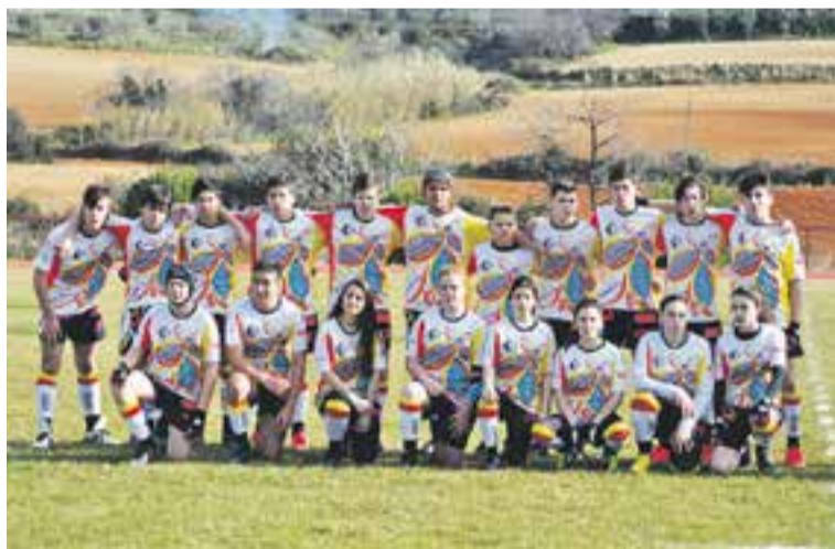
Imatge del partit i de l'equip, al seu debut diumenge passat.