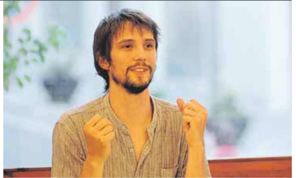
© Marc Comadran en una conferència sobre el poeta Joan Arús el 2012.

INFRAESTRUCTURES || En aquest procés d'expansió, era difícil que les dinàmiques culturals de la gran ciutat es poguessin