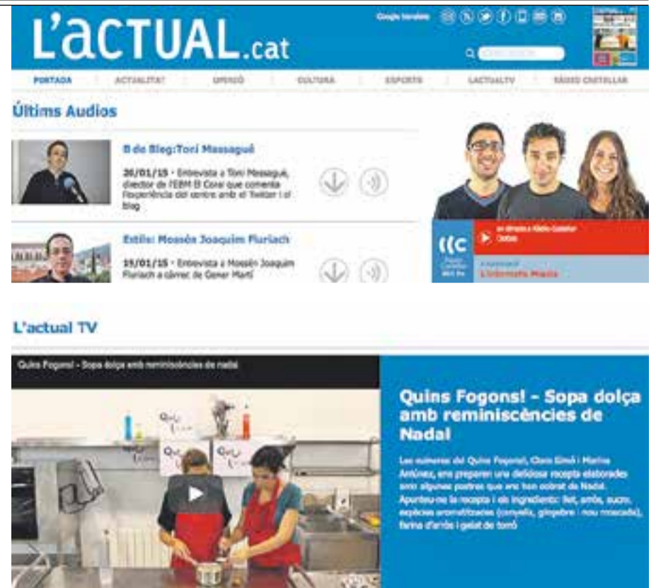
⊕ Els nous portals de Ràdio Castellar i LACTUAL TV. || L'ACTUAL

Durant aquests dies ha entrat en funcionament un nou apartat a LACTUAL.cat dedicat exclusivament als vídeos (LACTUAL TV) i un altre per a Ràdio Castellar i la seva ràdio a la carta. L'objectiu d'aquest nou disseny del web és donar vida pròpia i més visibilitat als continguts multimèdia –tant de vídeo com d'àudio -. De fet, LACTUAL TV i Ràdio Castellar