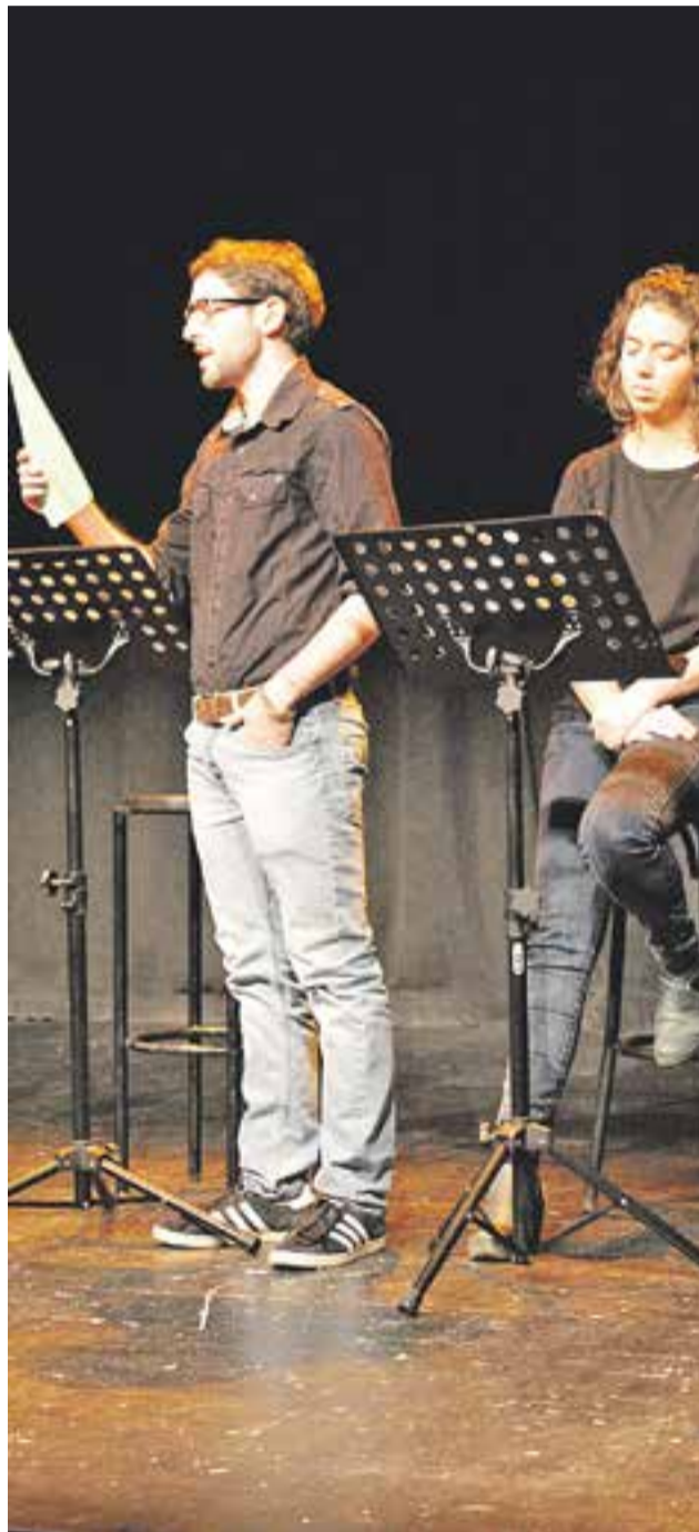
Una edició anterior de 'Llegides'.

Aquesta edició de Llegides es podrà veure aquest divendres 23 i dissabte 24 a les 21.30 h a la Sala de Petit Format de l'Ateneu. Els pròxims textos de Llegides seran La lliçó , d'Eugène Ionesco (27-28 de març), i El sopar dels idiotes , de Francis Veber (29-30 maig). ✦