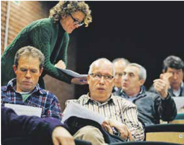
© Dimarts passat va tenir lloc la segona assemblea d'ADF i propietaris forestals. || Q.P.

Les sol·licituds es podran presentar fins al 30 de setembre al Registre General de l'Ajuntament, a partir d'un formulari que es pot obtenir al Servei d'Atenció Ciutadana