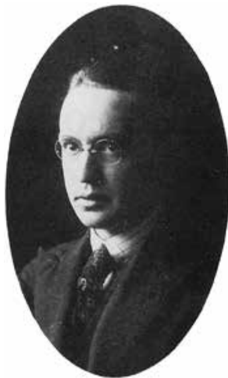
© Arús en una imatge de joventut. || J.VILATOBÀ

Segons Comadran, el noucentisme "és un moviment paradoxal". D'una banda, és un dels moments més importants "de la nostra història i de la institucionalització de la cultura catalana": es funda l'Institut d'Estudis Catalans, la xarxa de biblioteques i la Biblioteca de Catalunya. Però, d'altra banda, "queda a l'ombra d'altres moviments amb més projecció internacional com el modernisme i les avantguardes". De fet, Comadran va llegir fa poc la seva tesi