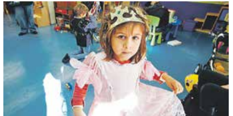
© Una nena jugant amb les disfresses a la ludoteca municipal. || Q. PASCUAL

El servei romandrà actiu fins al dissabte 14 de febrer, de dilluns a divendres de 17 a 19.30 hores, i també els dissabtes al matí, d'11.30 a 13.30 hores. +