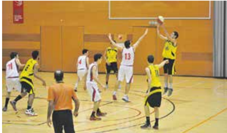
© Sergio García llança des de la línia de triple davant La Salle || A.SAN ANDRÉS

Herrero destaca la victòria dels seus jugadors contra la Salle Manre-