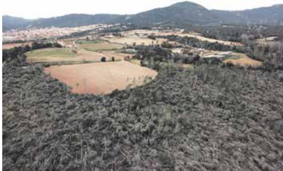
La ventada, el fenomen meteorològic més destacat de 2014.

El 2014 ha estat el tercer any més càlid de les dues últimes dècades igualant els registres de 2011