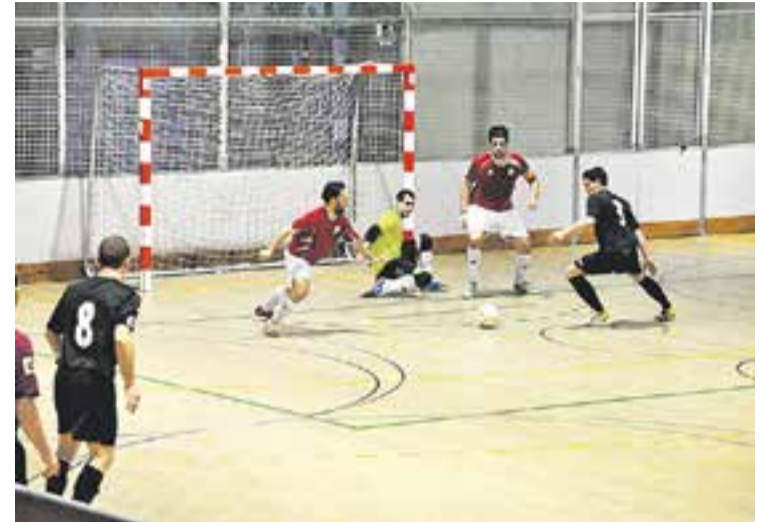
© Jugada d'atac de l'Athlètic 04 contra el Premià de Dalt || MARTA GUIRADO