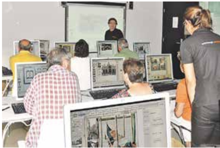
Imatge d'arxiu d'un curs a una sala d'ofimàtica d'El Mirador.

També s'han programat cursos d'ofimàtica bàsica i ofimàtica avançada, un curs d'ACTIC inicial