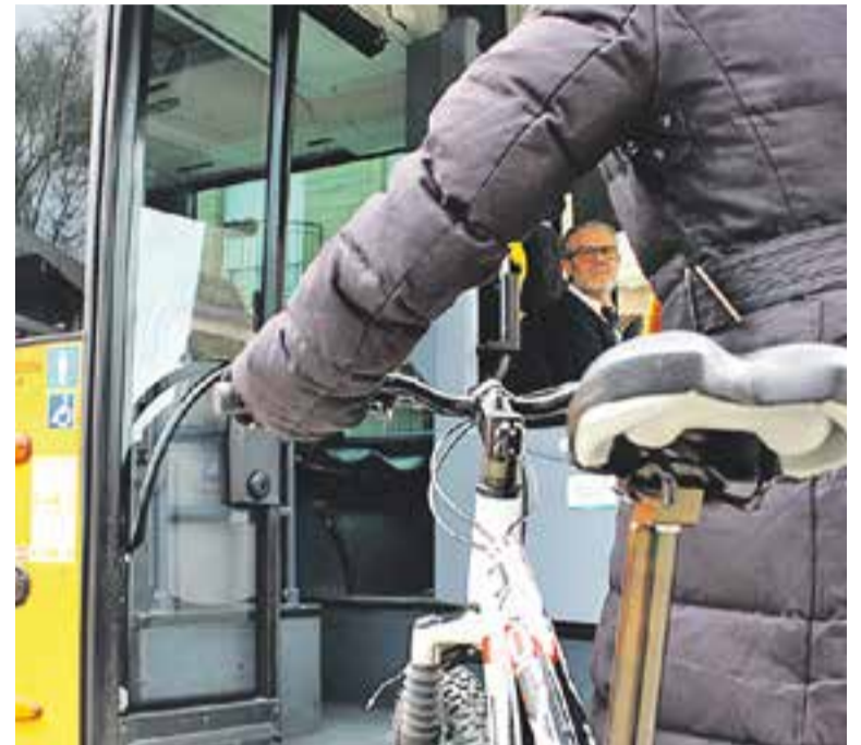
La nova normativa de la Generalitat és vigent des de l'1 de gener.

està aprovada, sembla que encara hi ha una certa confusió entre els usuaris i les empreses que donen servei de transport. Així, Ràdio Castellà es va posar en contacte amb Sarbus - empresa concessionària del transport interurbà a Castellà - la qual va informar que ja estan adequats amb la nova normativa. "La normativa, ara per