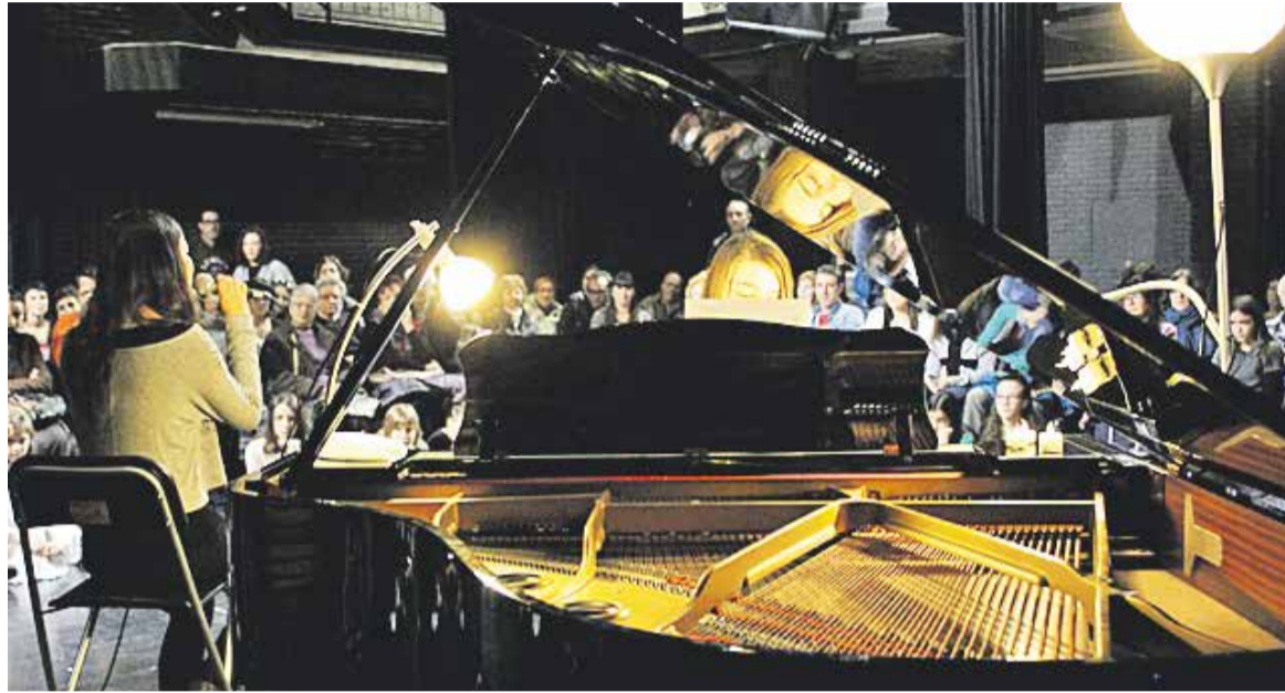
Una interpretació de cant i piano en la segona sessió de les audicions.

La primera sessió va començar a les 11 del matí i va consistir en exhibicions de dansa dels més grans del grup i mostres de teatre i de diferents instruments dels més petits. Tot i que Gatell reconeix que van patir una mica, "la veritat és que ens ha agradat molt veure com estaven els nens, com han sabut resoldre amb unes característiques com aquestes de tenir el públic tan a prop" , va afirmar un cop acabades les audicions. La segona sessió va ser a les 12.30 i el públic assistent va poder veure a escena teatre, peces musicals de piano i una intervenció de cant. Segons la directora, "la segona sessió ja era de nens més