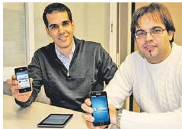
© D. Reina i A. Hervás, creadors de la comunitat Tappx. || ARXIU

Sí. Volem arrossegat dins del Mercat la gent jove i que coneguin serveis i comoditats que els oferim. +