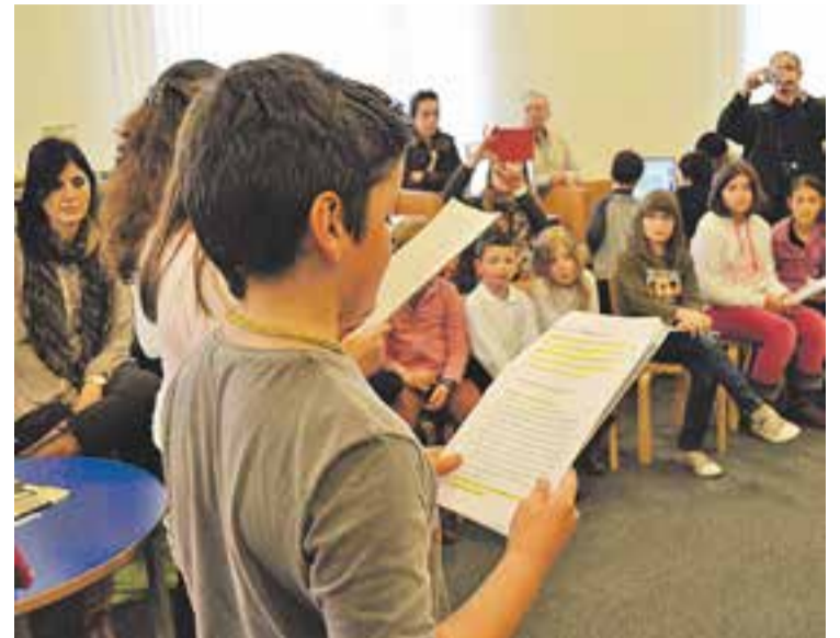
La lectura de creacions literàries que es va fer l'any passat.

relacions i diferències familiars, la justícia, els polítics i les seves decisions, els crítics teatrals, la monarquia, les lleis, la religió, els toreros, els bancs i, fins i tot, les companyies de telefonia. Hi apareixen els temes que rodegien l'ac-