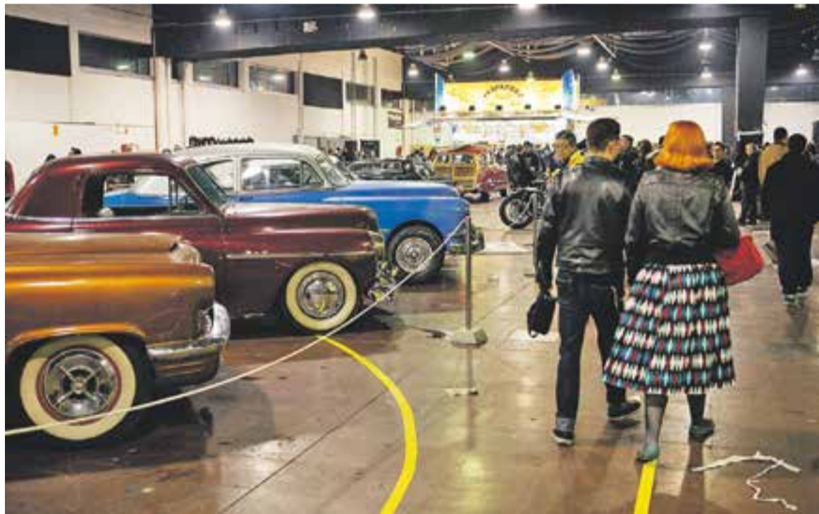
© Cotxes, motos, bicicletes i 'lifestyle' es van donar cita a les tres naus de l'Espai Tolrà de Castellar. || Q. PASCUAL

nant. Ja no és tan hermètic com abans i es veu una nova onada de bikers més lliures i en els quals destaca més la seva personalitat amb la seva moto".