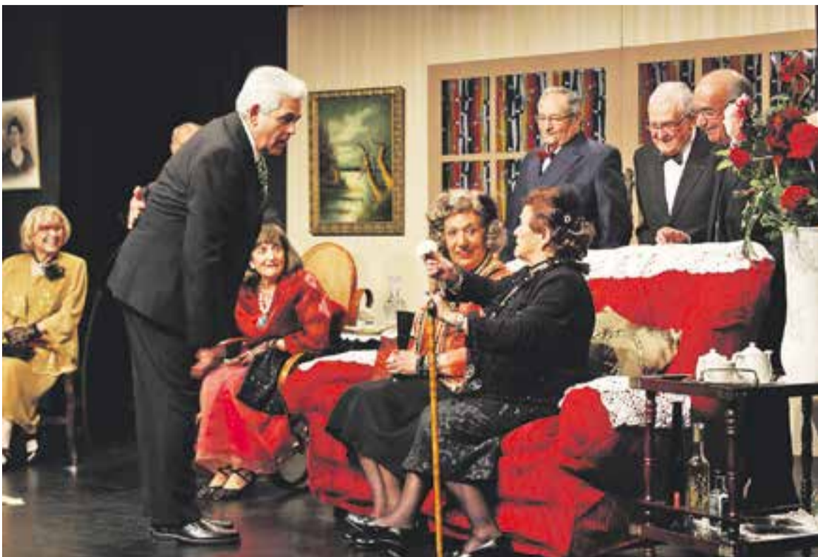
Un moment de la representació de 'Gente bien'