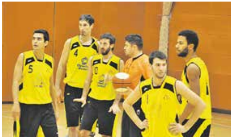
Els jugadors del CB Castellar, en una imatge d'arxiu.