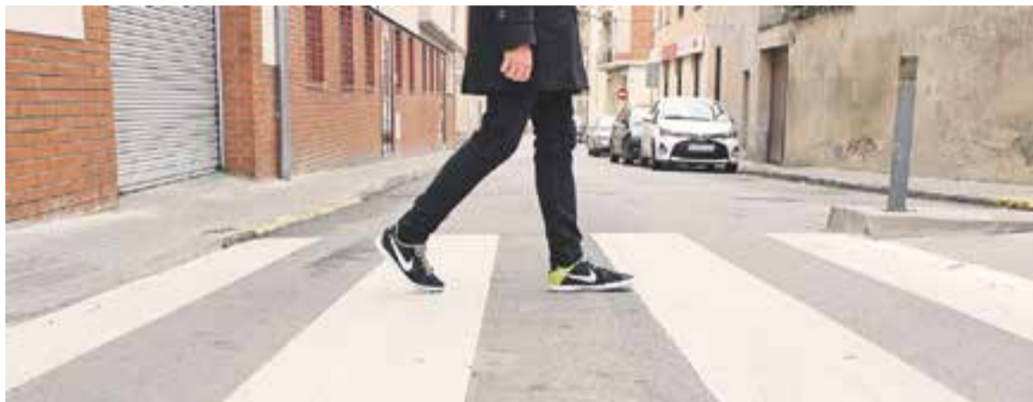
Ⓢ Un vianant travessa el pas zebra del carrer Mestre Ros.

L'empresa Marcas Viales SA és l'encarregada de dur a terme les feines, que s'han distribuït en dues fases i que es preveu que acabin a mitjans del mes d'abril. Així, la primera fase dels treballs, que han començat a la zona de l'Ei-