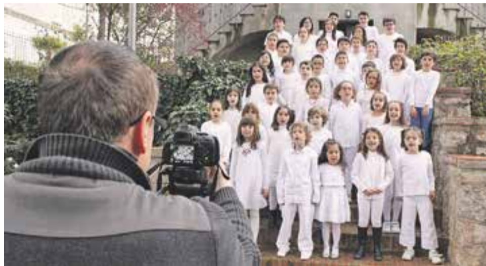
☉ Gravació del videoclip "Batega amb força".

La celebració va continuar dimecres i dijous, amb més tallers, audicions, classes obertes i fins i tot una Jam Session. †