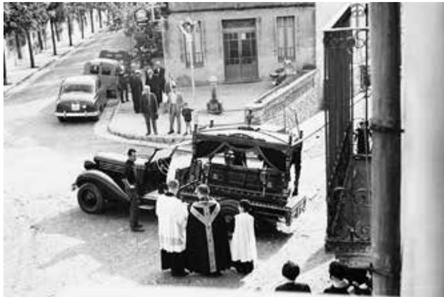
AUTOR: RAMON LLINARES UMBERT FONTS: RAMON LLINARES UMBERT

CADA SETMANA, UN NOU FASCICLE DEL COL·LECCIONABLE AL TEU QUIOSC, PAPERERIA O LLIBRERIA