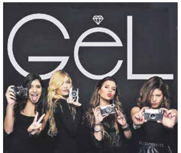
© Les quatre integrants de Gel. || CEDIDA

El grup té previst treure un tema amb videoclip cada tres mesos, a més d'altres cançons versionades que acompanyaran amb vídeos "més casolans". I quan es pugui, tornar a fer concerts. ✦