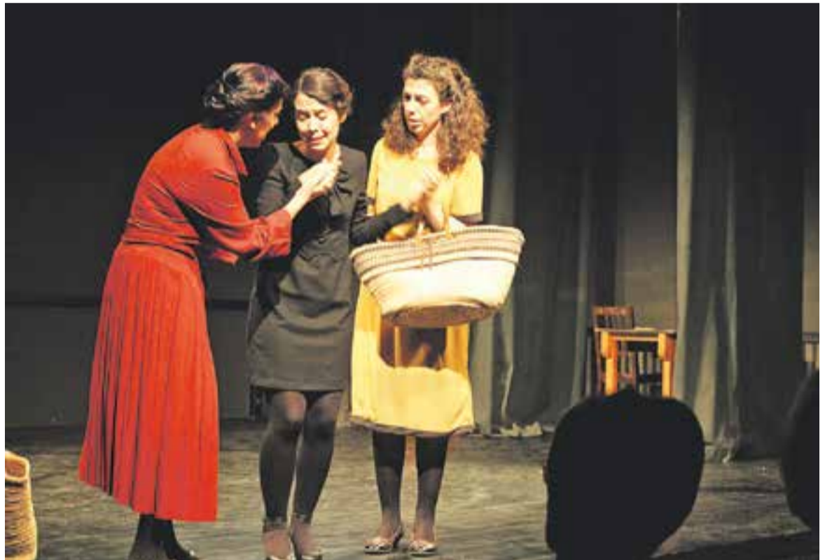
⊙ 'Les trompetes de la mort' ha sigut la primera reposició de l'ETC. || A. PARERA

A l'Esbart estan convençuts que es tracta d'una bona oferta, i animen tothom que vagi al teatre. Aquesta programació que presenta l'Esbart és fruit, en part, d'un canvi organitzatiu. "S'anaven fent coses, però no hi havia un grup que ho coordinés" , explica Tena. Van veure, doncs, la necessitat que hi hagués un grup cohesionat "per tal que ens ajudem entre nosaltres i ens sentim més recolzats" . +