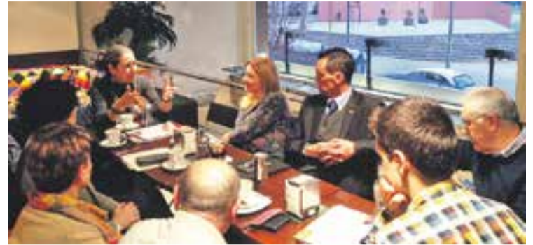
Cafè tertúlia a la pastisseria Andreu amb la candidata de CiU, a l'esquerra.