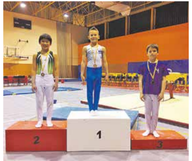
© Sergio Kovacs a l'esglaió més alt del podi al Campionat de Catalunya || CEDIDA