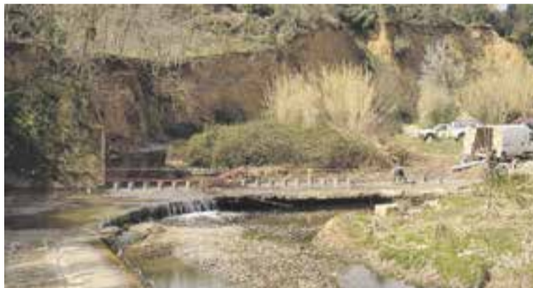
Ⓢ Obres de millora a la passera del Molí d'en Busquets

El riu Ripoll, al seu pas pel Molí d'en Busquets, comptarà amb una nova passera fixa per a vianants a partir de finals de març. Els treballs de construcció de la nova passera els està duent a terme l'empresa CIPO, sota la direcció dels serveis tècnics de l'Ajuntament. L'actuació consisteix en la construcció de 28 pilarets de formigó armat de 30 cm de diàmetre i 35 cm d'alçada i un amb el mateix diàmetre i 17,5 cm d'alçada. Aquestes elements, que tenen una separació entre eixos de 80 cm, s'ancoren a la llosa de pedra existent a la llera del riu, d'uns 23 metres de llargada aproximadament. També s'ha ampliat un tram del gual per poder conservar l'amplada necessària per garantir el pas de vehicles. ➔ || REDACCIÓ