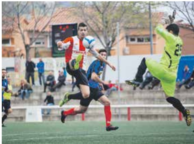
La UE Castellar va generar fins a 12 ocasions de gol al partit.

La segona part començava com havia acabat: amb domini local. Tot-hom tenia al cap les segones parts