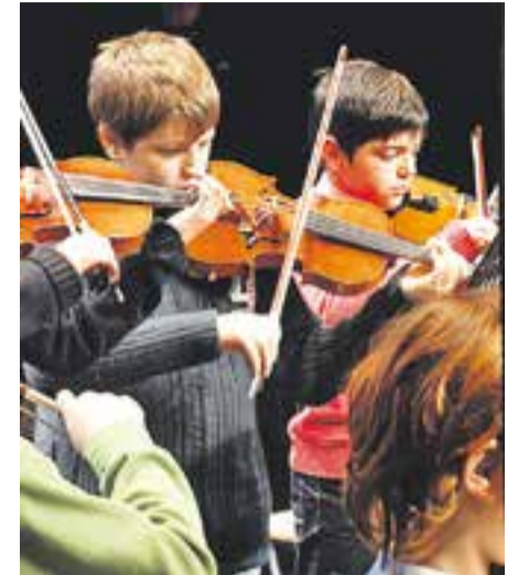
☉ Alumnes durant el concert.