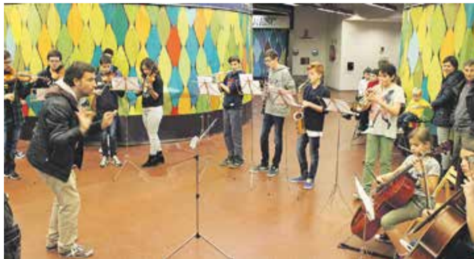
☉ Actuació del Grup de vent al Mercat. || A. PARERA