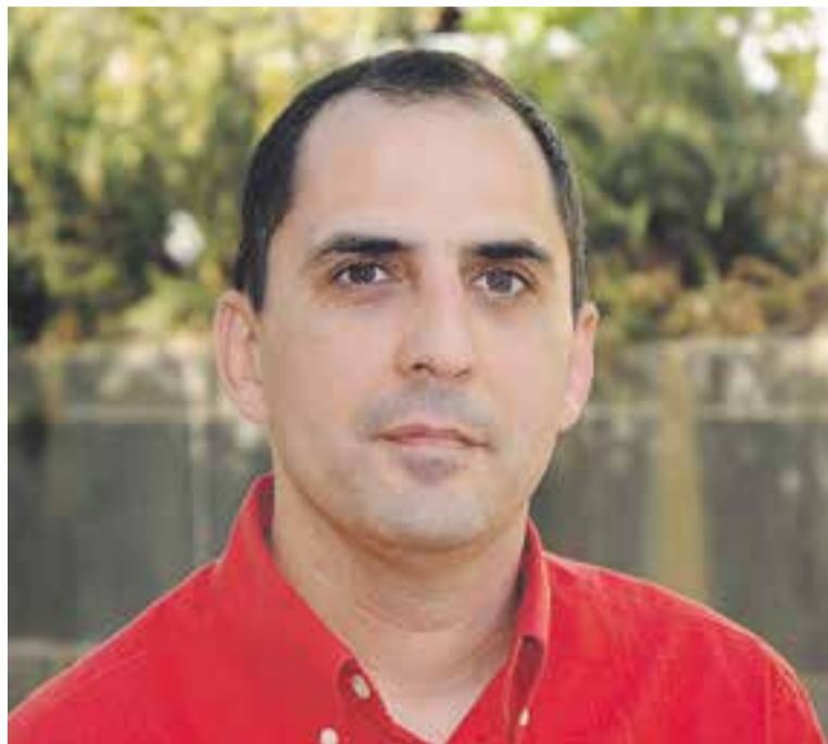
© Artur Roman, és membre de l'àrea psicosocial de la Creu Roja. || ARXIU

Nosaltres, l'equip d'intervenció psicosocial d'emergència, el que fem és,