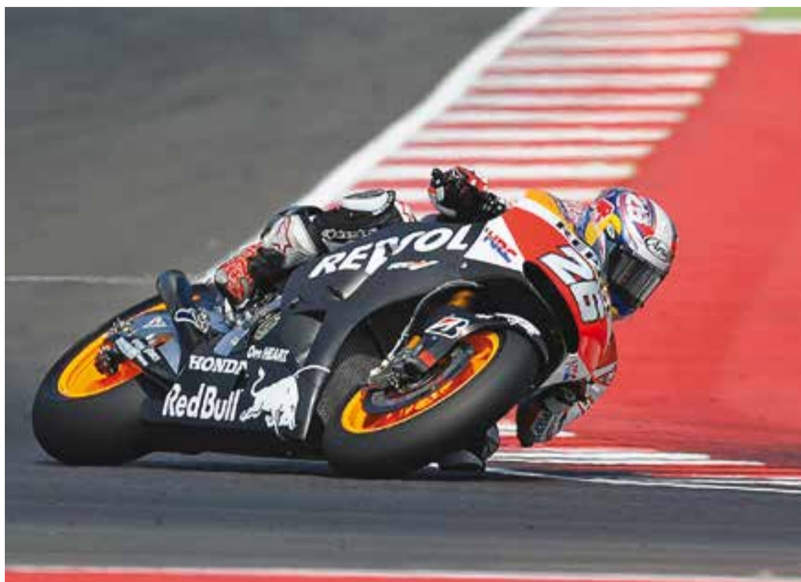
El de Castellar va provar les millores a l'Honda RC213V al circuit de Misano aprofitant les vacances