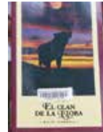
El Clan de la Lloba