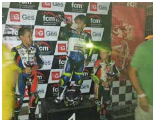
© A l'esquerra el podi de dissabte a la Nocturna d'Alcarràs. A la dreta, el podi de diumenge a la Copa Rodi de Dirt-Track. || CEDIDES