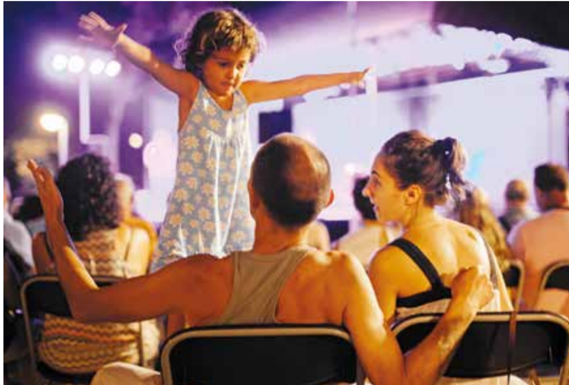
📄 El cor Schola Juvenil de Venezuela va ser una les actuacions més multitudinàries de les Nits d'Estiu.

tes cinc actuacions s'han d'afegir els 700 assistents a les quatre audicions de sardanes amenitzades per les cobles Jovenívola de Sabadell, Sant Jordi Ciutat de Barcelona, Principal d'Amsterdam i Ciutat de Girona. A més, 250 persones van assistir a la