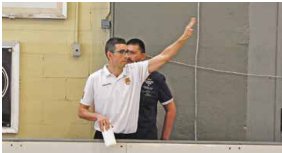
© Rubén Jiménez, dirigint l'equip en un partit de la passada temporada. || QUIM PASCUAL