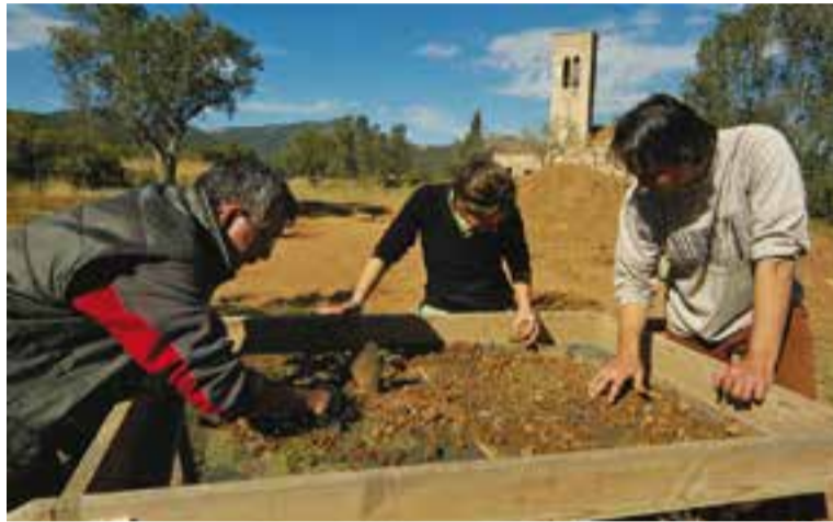
Imatge de les darreres excavacions que es van fer a Castellar Vell, al 2007.

Ara, la Generalitat, l'Ajuntament, la Universitat Autònoma i la Universitat del País Basc tenen la voluntat de reprendre la tasca investigadora amb un projecte de recerca arqueològica 2015-2017. De fet, la Generalitat va aprovar dins del Projecte Quadriennal de Recerca Arqueològica 2014-17, la proposta de recerca al jaciment arqueològic de Castellar Vell, presentada per l'empresa de serveis Arrago S.L. Això implica que es poden programar campanyes d'excavacions de dos mesos anuals amb equips de treball formats per professors de les universitats col·laboradores, estudiants del Grau d'Arqueologia de la UAB i l'equip professional d'Arrago barrejant treball científic i docent.