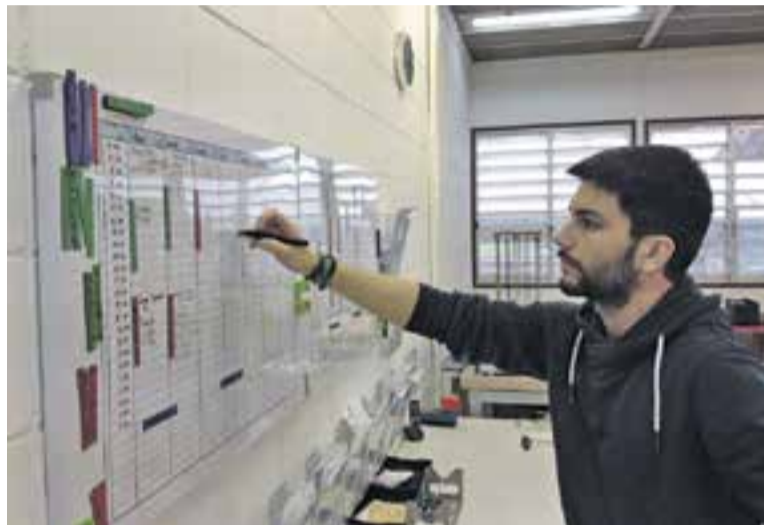
Un empleat a les instal·lacions de Flubetech.