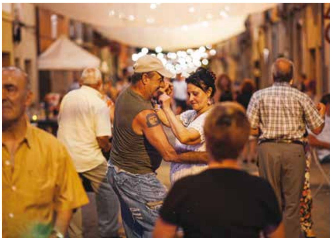
Ball popular al carrer Sant Jaume.