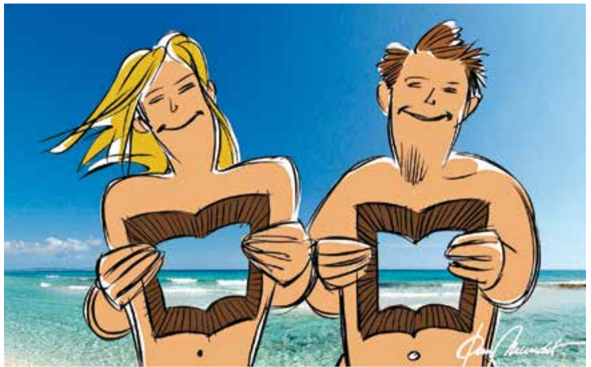
© Bona lectura i bones vacances. || JOAN MUNDET

Quins llibres qualifico de Literatura? Aquells que són capaços de crear imatges dins de la meua ment i deixar-me conèixer el món de què parlen. Però aquesta qualificació és meua i no pretenc que sigui univer-