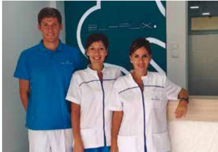
L'equip de la nova clínica dental Bukalix davant la porta de l'establiment.