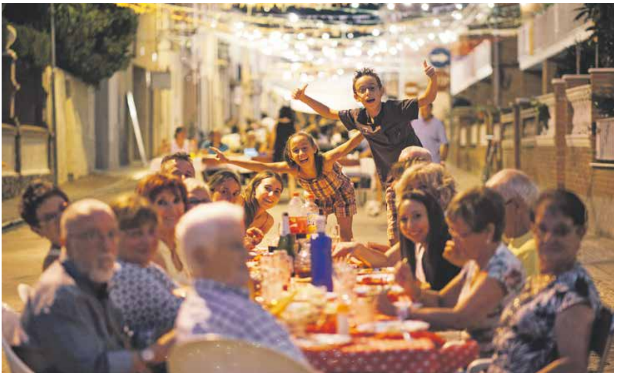
© Sopar a la fresca el cap de setmana passat, durant les festes del carrer Sant Jaume, una de les trobades més populars de les Nits d'Estiu de Castellar. || Q. PASCUAL