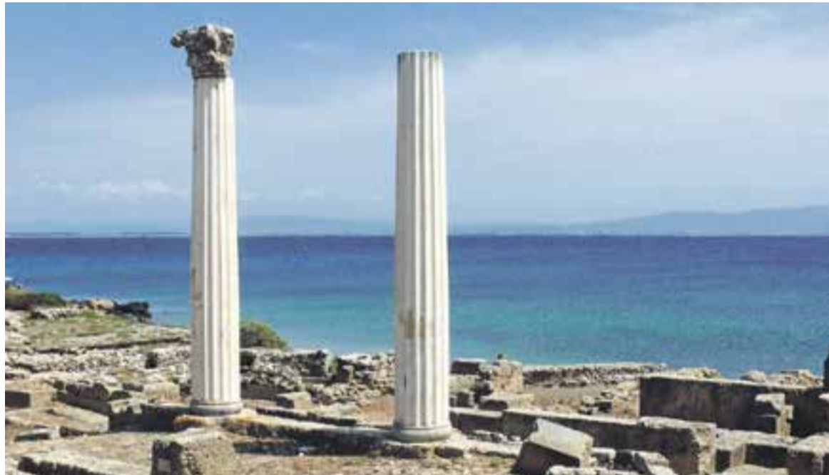
© Columnes romanes de Tharros (Sardenya), posta de sol a Menorca i panoràmica de la muralla de Peñíscola

Les illes Balears i Canàries són les destinacions preferides pels castellarencs. En concret, Menorca i Fuerteventura amb paquets de tot inclòs o de pensió completa, són les opcions que han acumulat més reserves a Masetur. Això es deu, segons apunten des de l'agència, que els hotels ofereixen grans ofertes i descomptes per a aquest tipus de modalitat, que compensa amb escreix la diferència de preu si s'opta només per l'estada a l'hotel sense cap àpat. D'altra banda, pels que volen sol i platja però més a prop de casa i sense haver d'agafar un avió, la costa peninsular és una opció econòmica i amb força acceptació. En aquest sentit, Tossa de Mar, Salou o Peñíscola rebran aquest estiu una comitiva castellarenca força àmplia, asseguren des de Masetur. Com en el cas de les illes, les ofertes que inclouen la