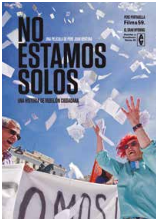
© Pere Joan Ventura dijous passat a la presentació del Festival. Cartell de la pel·lícula documental. || CEDIDA