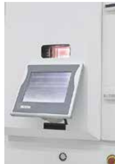
Detall del reactor de PVD.

Quant a les seves aplicacions en la biomedicina, de moment es fa servir sobretot per a la implantologia dental, i també per a les pròtesis de genoll i maluc, que estan sotmeses constantment a desgast i fregament. En aquest cas, Montalà posa l'accent en què "Flube-