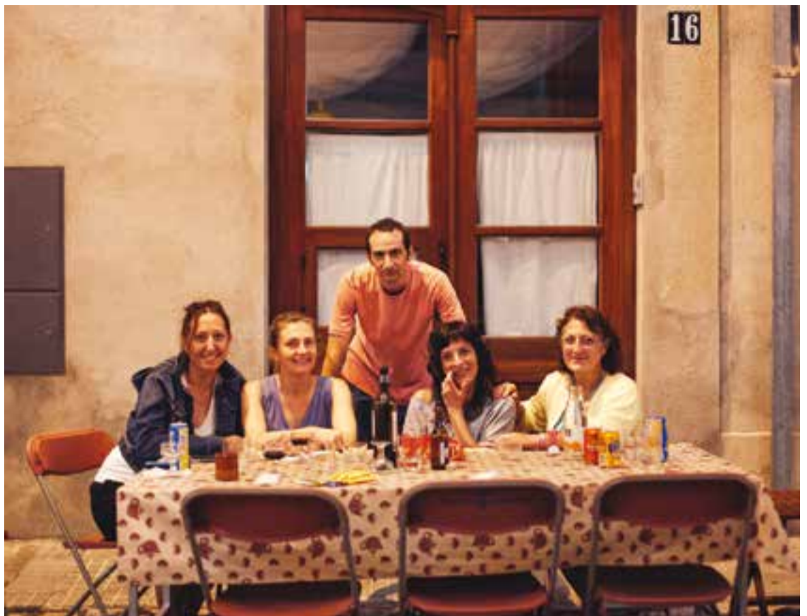
Cinc dels assistents al sopar a la fresca de les festes del Pla.

Diumenge al migdia, la celebració es va reprendre amb una actuació dels Castellars de Castellar amb dos pilars de quatre i amb la intervenció de dos balls populars típics a la vila, el Ball de Bastons amb les colles de petits i de grans i també el Ball de Plaça que amb un pupurri de balladors de diferents colles van dansar el xotis, la jota i la contradansa. Cap a la 1, un vermut popular va cloure l'activitat del migdia. A les 19.30 hores la Cobla Ciutat de Terrassa va oferir una audició de sardanes, que va aplegar un centenar de persones. Un tastet de coques, elaborades per les veïnes del carrer, i de cava van acompanyar la música, que va posar el punt final a la festa a quarts de 10 de la nit. ✦