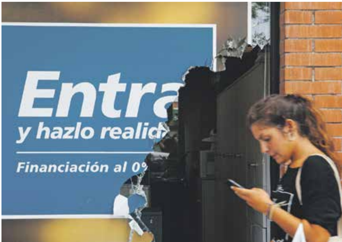
El lladre va fer un forat a un dels vidres per entrar a l'oficina.