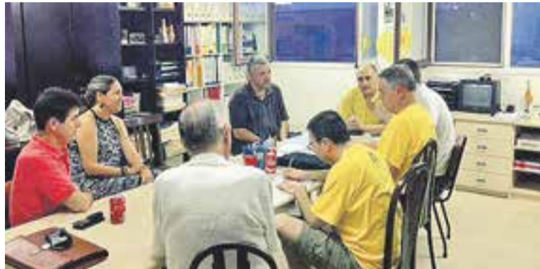
Primera reunió dels membres de la comissió de Junts pel Sí de Castellar.

La comissió a Castellar està formada per tres membres de CDC, ANC i ERC ja que no hi ha delegació d'Òmnium Cultural al municipi. Segons es destaca a la nota, Junts pel Sí "és la candidatura de la revolució del somriure i la il·lusió per a construir un país nou entre tots". Per a que el 27-S sigui un èxit històric, també a Castellar del Vallès,