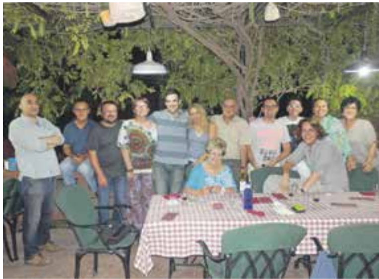
© El sopar d'estiu de l'agrupació local de CDC.