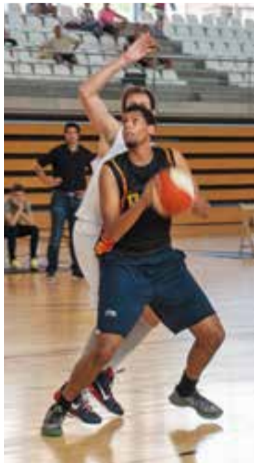
© Andreu Qwacema al Puigverd. || A.S.A.

“Una altra vegada vam ser capaços de competir dos quarts, però al tercer, un parcial en contra ens va fer baixar les mans. Va