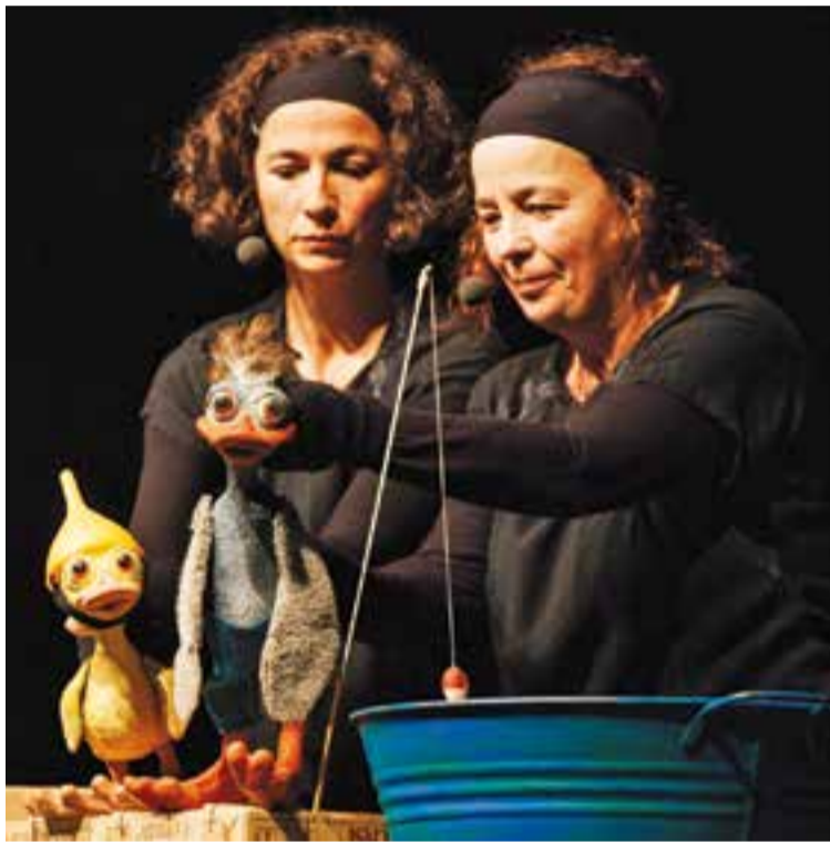
Una imatge de l'espectacle 'Cuac'.

Una obra infantil que va omplir de riures l'Auditori