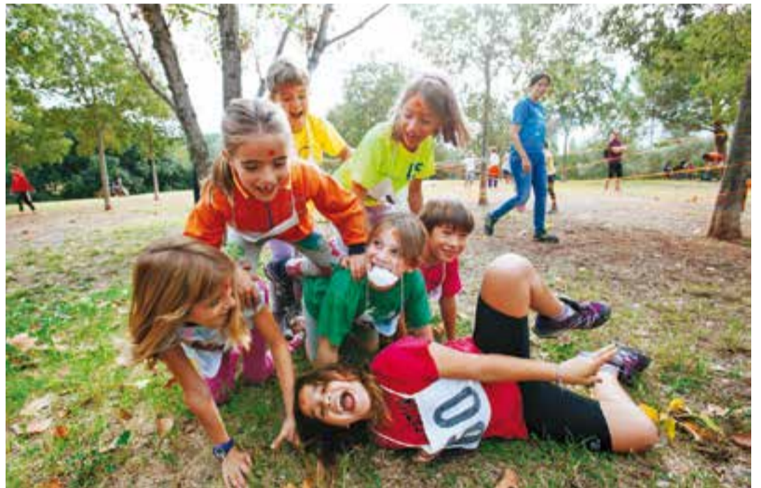
Dues imatges de les proves que van haver de passar els nens durant el transcurs de la 54a Marxa Infantil de regularitat d'aquest diumenge.