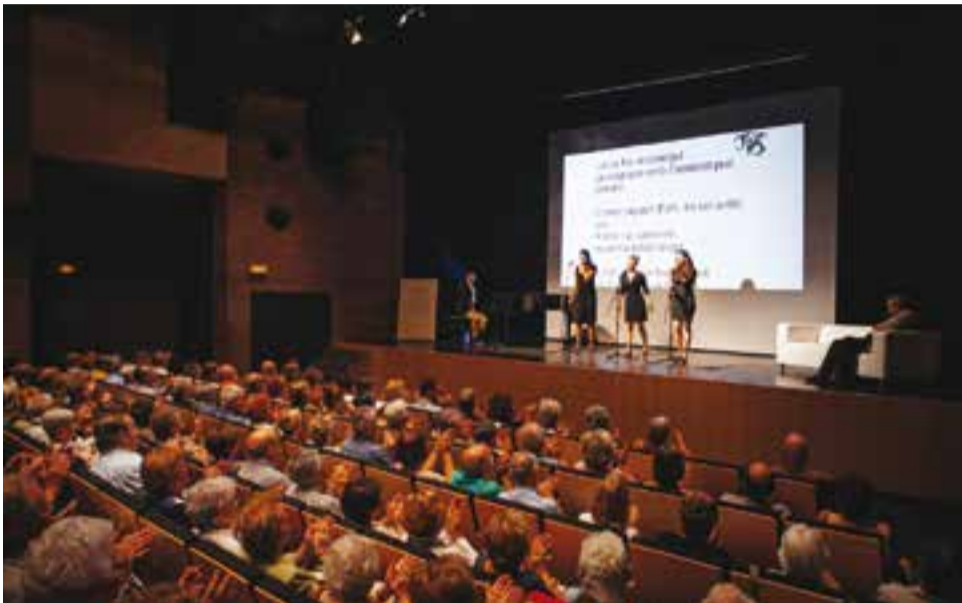
Actuació de the Feliuettes i Gerard Sesé a la inauguració del curs de l'Aula.

L'Aula d'extensió Universitària per a Gent Gran obre el nou curs