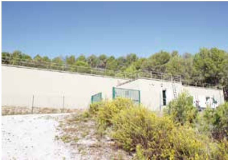
Dipòsit de 3.500 metres cúbics d'aigua situat a la zona de Puigverd.

La nova aportació d'aigua ha suposat la posada en marxa d'una estació de bombament, ubicada entre el riu Ripoll i el torrent de Ribatallada, que condueix les aigües d'ATLL fins a un dipòsit de 3.500 metres cúbics situat a la