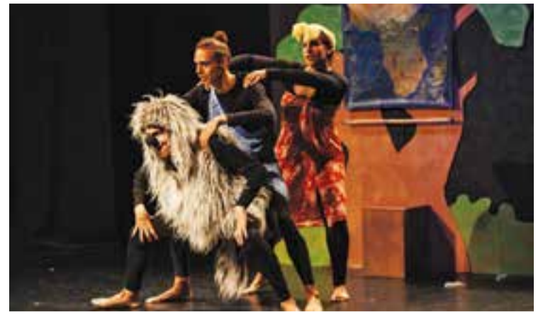
Els tres actors de l'obra durant un moment de la representació.

Cuac és una funció molt agraïda visualment, que es pot seguir fàcilment només amb les accions dels titelles de taula, les onomatopeies, alguns efectes de so i la intervenció guiada de les dues titellaires. +