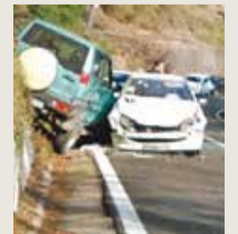
© L'accident.