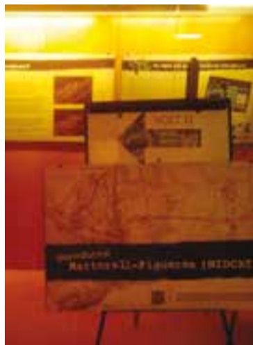
© Exposició a l'Ateneu. || CEDIDA

El tour Volt II farà parada dissabte a Castellar. El punt de trobada és a les 11:15 h del matí a la Fàbrica del Vidre per després anar a la zona del torrent de Colobriers, al lloc per on passa el gasoducte Martorell-Figueres. La visita servirà per compartir amb la setentena de persones que viatgen amb tour l'experiència que es va viure al Vallès amb la construcció del gasoducte i per valorar la restauració que havia de deixar el terreny en el seu estat original. Després es podrà visitar l'exposició sobre la construcció del gasoducte a la sala d'exposicions de l'Ateneu. A la plaça Major, es farà una Xerrada Fòrum amb Alfons Pérez, membre de la Xarxa per la Sobirania Energètica, Emma Hugues, de Platform London i Octavio Rosas, catedràtic d'Economia Política de la Facultat d'Economia de la Universidad Nacional Autónoma de Mèxic. Al final hi haurà un dinar popular obert a tothom a l'Espai Tolrà. L'organització de la jornada s'ha fet amb l'ADENC, la UES de Sabadell, el CEC i Cal Gorina de Castellar. + || REDACCIÓ