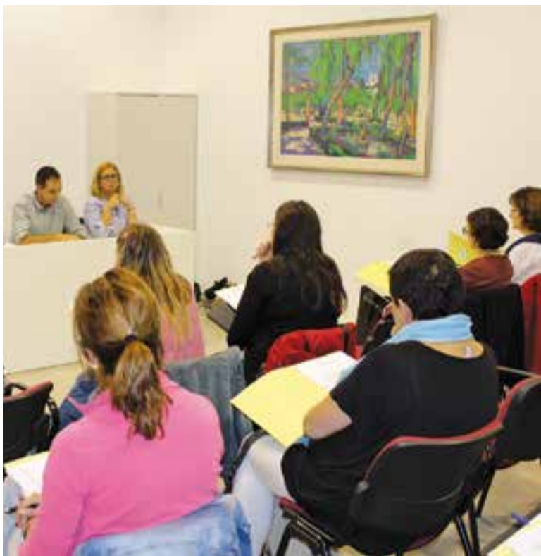
© El Consell de Cooperació es va celebrar el passat 30 de setembre. ||AJ. CASTELLAR