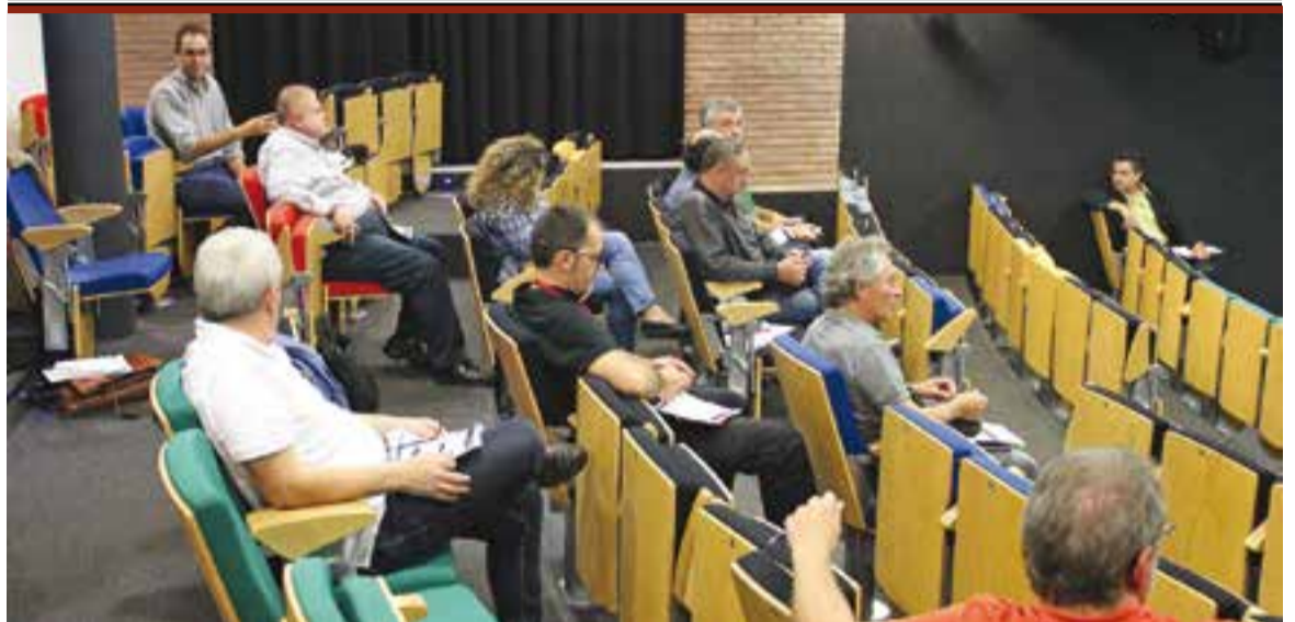
© Els membres de la Taula d'Ocupació es van reunir dilluns passat a la sala d'actes d'El Mirador. || CEDIDA

EMPRESA || Segons dades del Departament d'Empresa i Ocupació, el primer semestre de l'any Castellar comptava amb un total de 1.955 autònoms, 31 més respecte l'any 2014. D'aquests, un 69% pertany al sector serveis, un 15% a la construcció, un 14% a la indústria i prop d'1% a l'agricultura. D'aquesta manera continua la tendència a l'alça iniciada l'any 2013. D'altra banda, i segons la mateixa font, el municipi disposa en l'actualitat amb un total de 712 empreses, de les quals un 60% s'engloba al sector serveis, mentre que un 29,2% són indústries, un 10,5%, empreses de l'àmbit de la construcció i un 0,3%, empreses del sector primari. +