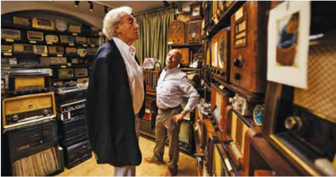
© Luis del Olmo amb Francesc Soto visitant la col·lecció de ràdios antigues allotjada a l'Arxiu d'Història. || Q. PASCUAL

El popular radiofonista visita la col·lecció de ràdios antigues de Francesc Soto