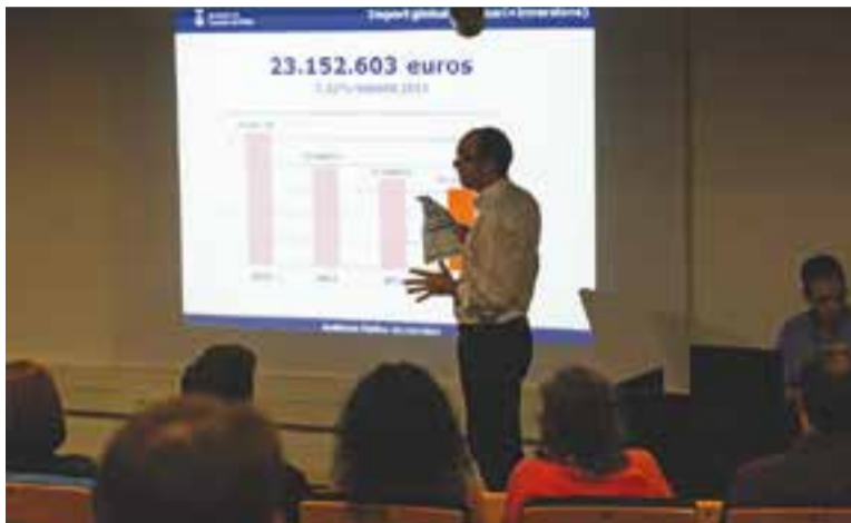
Un moment de la presentació l'any passat dels pressupostos de 2015.

L'Ajuntament realitzarà la sessió el 15 d'octubre a la Sala d'Actes d'El Mirador