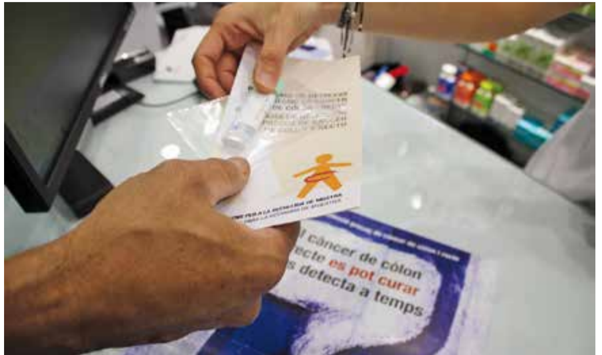
Els ciutadans poden adquirir la prova a les farmàcies de la vila.

Els ciutadans que ho vulguin hauran d'adreçar-se amb la carta a una de les farmàcies col·laboradores del programa, on se'ls entregarà la prova i se'ls explicarà com fer-la a casa. Un cop realitzat el test, s'haurà de portar a la farmàcia tan aviat com sigui possible i, al cap d'uns dies, el resultat final serà comunicat per correu o per telèfon. En cas que la prova sortís positiva (és a dir, si es detecta sang en la mostra de femta),