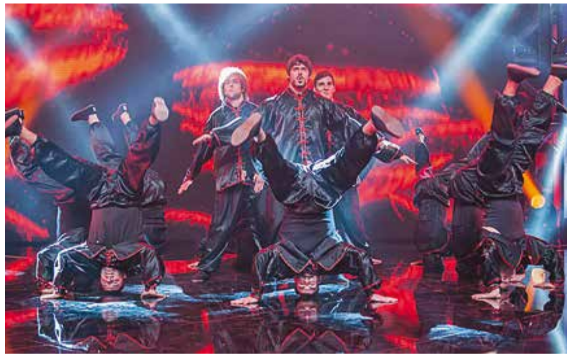
© Actuació de Street Squad al programa Insuperables de TVE.