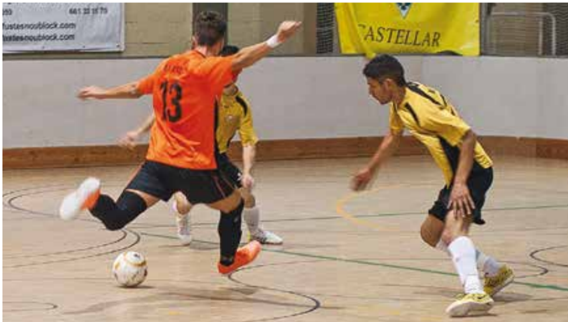
© Aleix Navarro, amb quatre gols, va ser un dels herois del seu equip, en el partit contra el Pineda. || A. SAN ANDRÉS

Però després de fer la sacada des de mig camp, el Racing es-