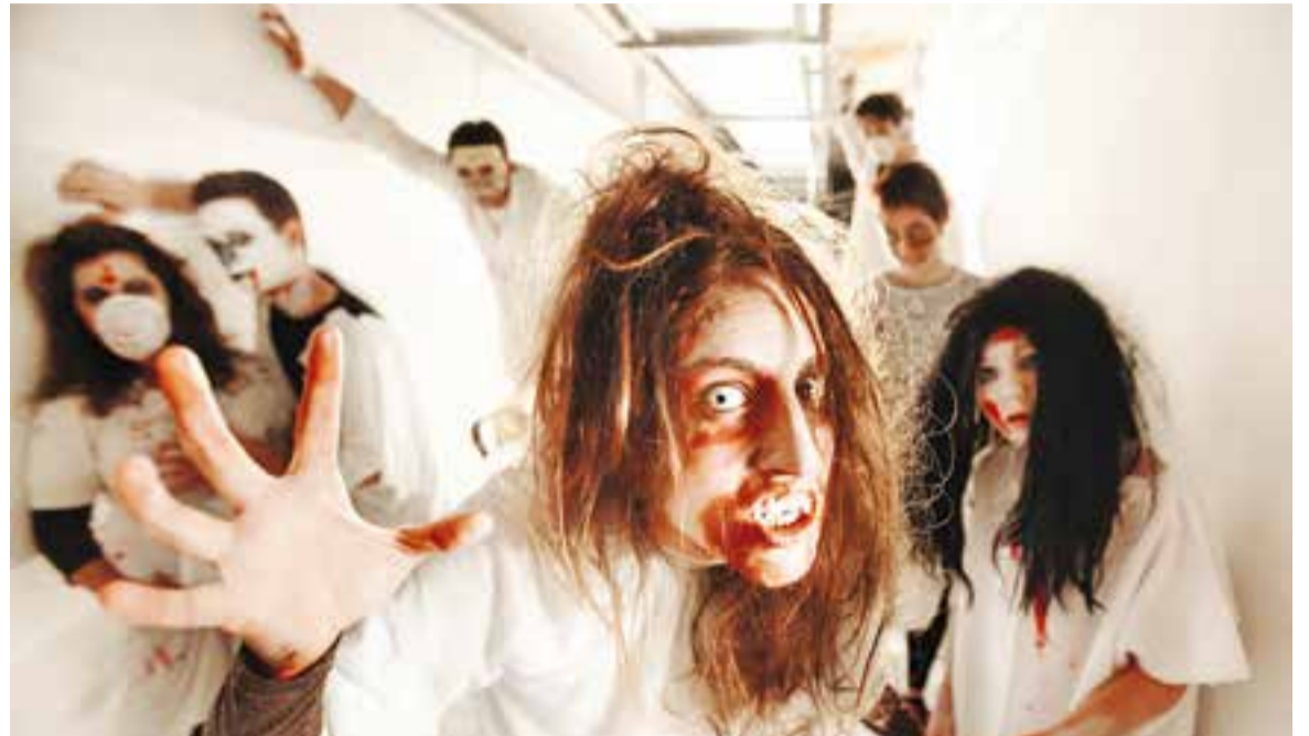
Una imatge del Túnel del Terror, en la passada edició del 2014.

La Setmana del Terror Jove inclourà dues projeccions i el Túnel de la por