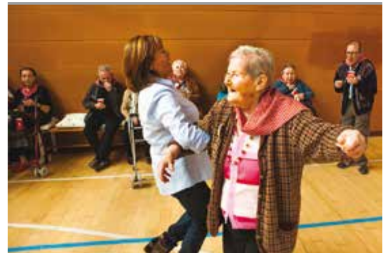
☉ Moment de les primeres Resiolimpíades celebrades l'any passat.

va estar molts anys com a treballadora social i els sis últims anys com a presidenta. “El meu objectiu en aquests anys ha estat fer-nos visibles. Conscienciar la població que s'ha de cuidar molt la salut mental i que les famílies perdessin la por, acabar amb l'estigma que parteixen aquests malalts” . L'expresidenta reconeix que aquest darrer any ha estat molt complicat pel tema de l'endarreriment en els pagaments per part de la Generalitat. “Ara estem millor. Rebem els diners, encara que amb dos mesos de retard” . +