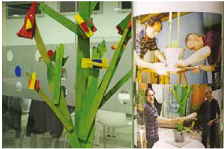
Una escultura de l'exposició "Art a 4 mans" i els seus autors.

Una construcció artística que passa per un procés de creació en parella on l'artista acompanya i ajuda a expressar i a desenvolupar mitjançant l'art totes les potencie-