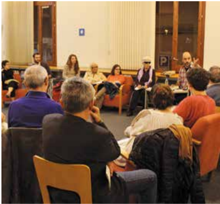
© Josep Lluís Badal durant la tertúlia poètica a la Biblioteca Antoni Tort. || A.PARERA

L'escriptor i professor va ser el convidat a la tertúlia poètica de la Biblioteca que va esdevenir una conversa íntima i sincera