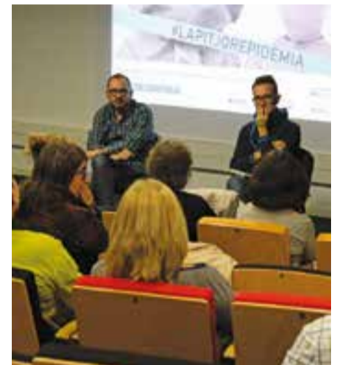
© Francesc Álvarez i Ivan Zahinos. || A.PARERA

Un film que tot i mostrar diferents punts de vista posa en qüestió un sistema sanitari i d'ajut internacional que no contribueix a millorar la situació a Moçambic i que, pel contrari, fa créixer les desigualtats. Cal una lluita continuada, tal com indica Medicus Mundi, per aconseguir un projecte sanitari que uneixi tots els agents cap a una mateixa direcció. + || A.PARERA