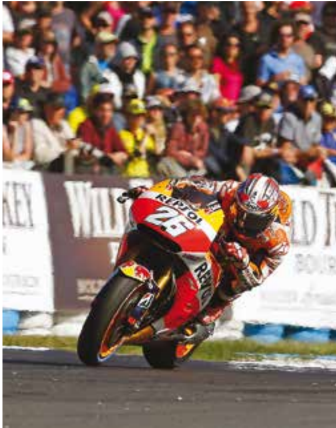
© Dani Pedrosa va patir problemes d'acceleració. || REPSOL-MEDIA

El '26' patia amb la Honda, ja que a la sortida de l'última corba, la