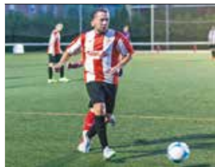
Carlos Silva va ser expulsat.

El CB Castellar és últim a la Copa Catalunya amb cinc derrotes i cap victòria. +