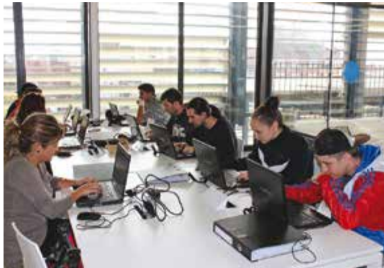
Els joves que fan un dels cursos en una imatge de la setmana passada.

D'altra banda, aquesta setmana ha començat el segon dels cursos, de 440 hores, que també es