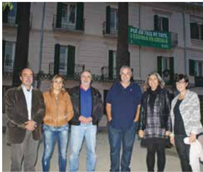
© Els integrants dels grups municipals d'ERC i CDC al Palau Tolrà. || J. R.