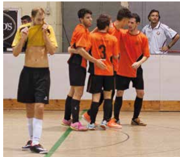
© El FS Farmàcia Yangüela Castellà segueix amb la bona ratxa en lliga. || A.S.A.