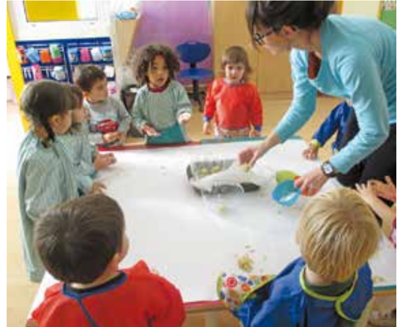
© A l'esquerra, alumnes de l'escola Joan Blanquer ens mostren la seva Castanyera. A la dreta, els alumnes de l'EBM El Coral preparen panellots per la festa de divendres | CARLES DÍAZ / CEDIDA