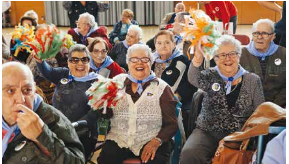
Participants a l'edició d'aquest any de les Resiolímpiades.

I, finalment, hi havia una prova musical, en què quatre participants es posaven uns auriculars i havien d'escollar 5 cançons que sonaven aleatòriament d'una llista de 25 i endevinar-ne l'autor, el títol o el cantant. En cada activitat els concursants anaven obtenint una puntuació, que una vegada comple-