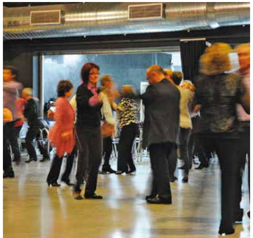
⊕ Una imatge d'arxiu d'un ball amb Pas de Ball. || ARXIU

Són les activitats pels castellarencs aquesta Castanyada i Halloween