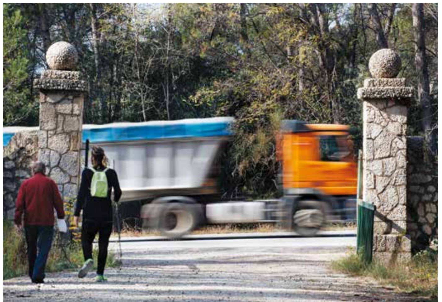
© Un camió procedent de les obres del metro de Sabadell per la B-124. || Q. PASCUAL