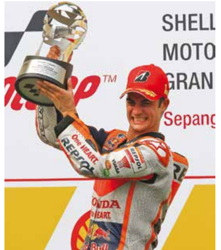
Dani Pedrosa celebrant la victòria al podi de Sepang.

En roda de premsa, davant de l'absència de Rossi, Pedrosa ha declarat sobre l'incident que "Valentino hauria de ser aquí per donar explicacions. Les curses són curses i deuriem pilotar amb més calma. Sempre he pensat això, però sembla que Rossi ha canviat ara d'opinió. Potser sigui per la tensió pel campionat". També va afegir que "aquest és un moment d'aprenentatge però pel campionat és bo que quan guanyes sigui perquè ets el pilot a batre". El mundial de MotoGP es decidirà al GP de la Comunitat Valenciana el proper 8 de novembre. +