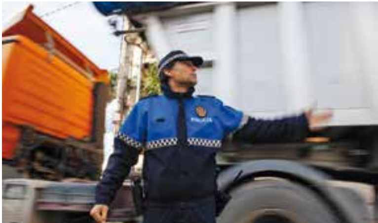
Un agent dirigeix el transit a l'hora de l'entrada a les escoles.

La Generalitat fa portar la runa de les obres del Metro de Sabadell per la B-124