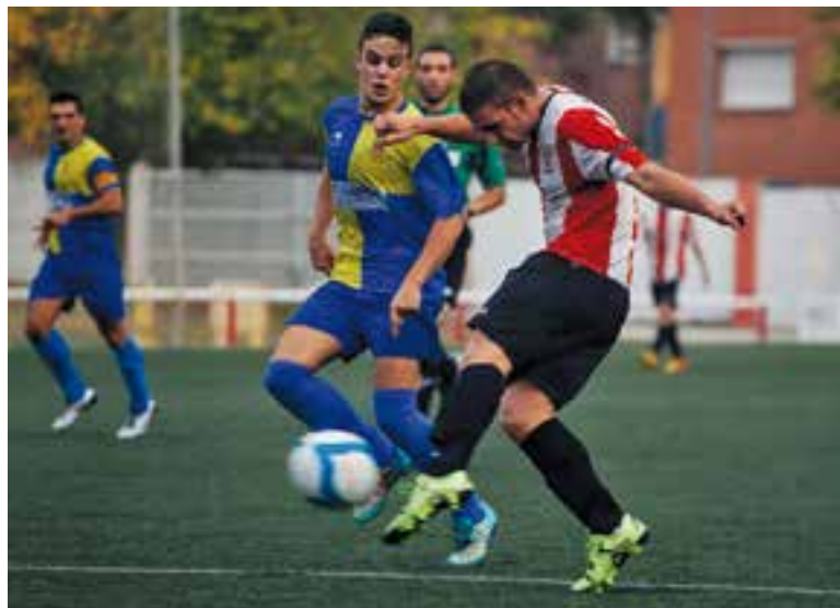
Dani Quesada amb dos gols, va ser un pilar important de l'equip.

Dos gols de l'extrem i un de Villaronga fan sumar els tres punts al derbi vallesà