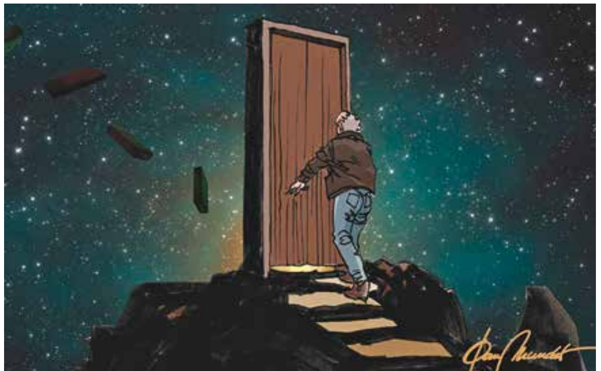
© El pas. || JOAN MUNDET

sentint-se home fet de fang, com les figuretes del pessebre, i induït per l'olor de la molsa humida del pessebre, va recordar «les benignes mans» de la seva mare, perfumades per l'ombrívola planta quan el feia. Aquests dies, tot fent memòria dels nostres morts -olors, gestos, carícies, paraules, mans benignes...-, ens podem fer preguntes: Som tan sols