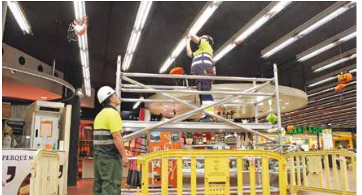
Operaris de la brigada municipal col·locant fluorescents tipus led a la zona central del mercat dimarts al matí.

Es renoven els panells informatius de les parades i també es modifica l'enllumenat de la zona central