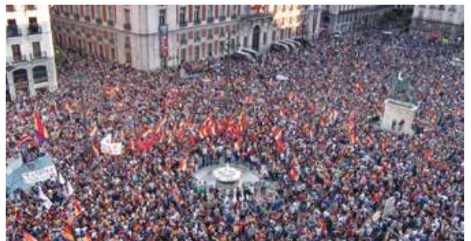
⊙ Tres fotogrames del documental 'No estamos solos' de Pere Joan Ventura.