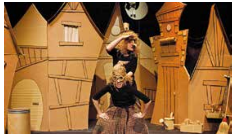
© Imatges d'una funció de 'El carreró de les Bruixes'. || CEDIDA