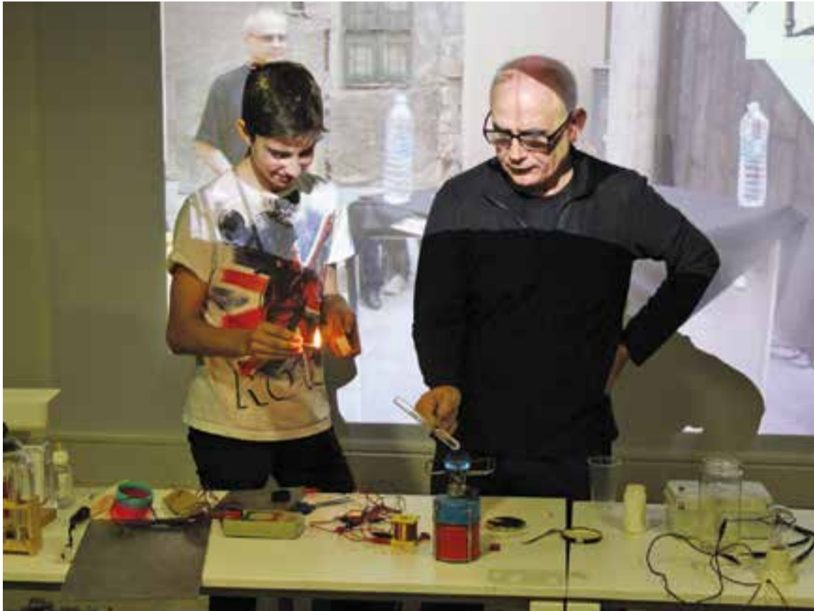
© Anicet Cosialls durant els experiments del taller 'Física Pop' de la Setmana de la Ciència || R. GÓMEZ