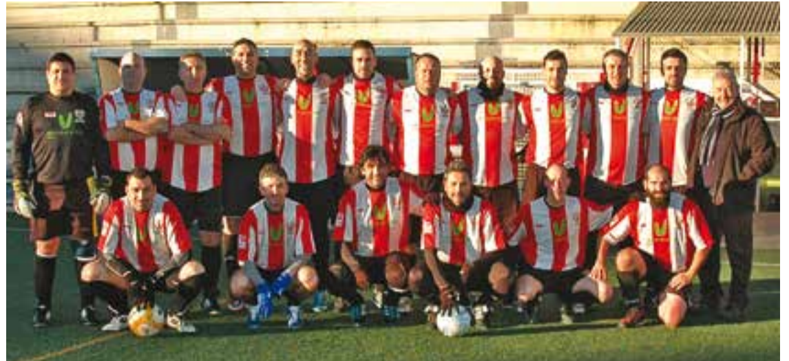
La plantilla dels veterans de la UE Castellar segueix amb un ritme molt alt a la competició.