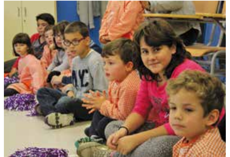
Els padrins de 4t de primària amb els fillols de P3 del Joan Blanquer.