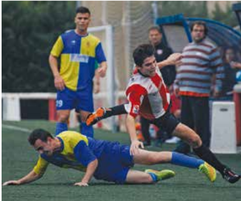
© La UE Castellar va caure contra el Sallent a domicili || Q. PASCUAL