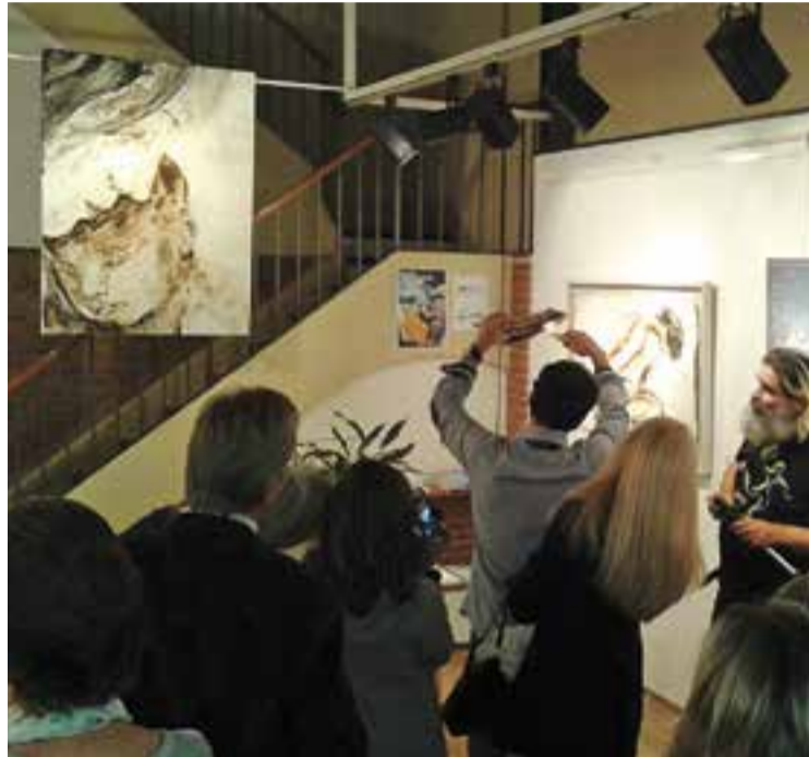
Aguilar pintant amb foc a la inauguració de l'exposició.

La mostra expositiva serà a l'Espai BM Galeria d'Art durant