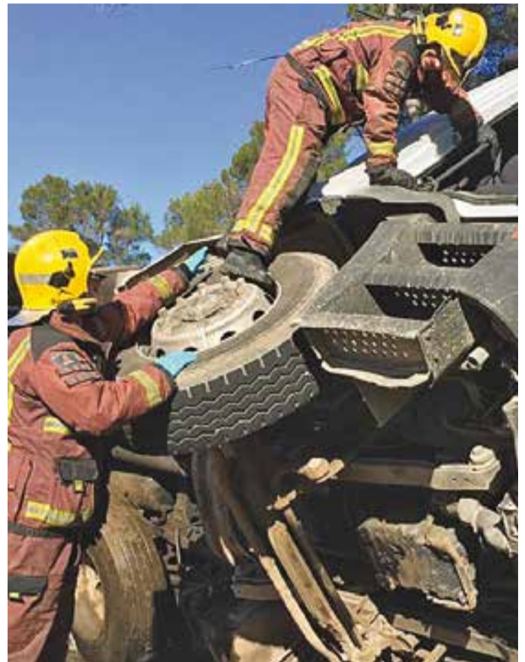
|| BOMBERS DE LA GENERALITAT