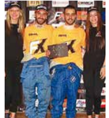
La parella a Vidreres.