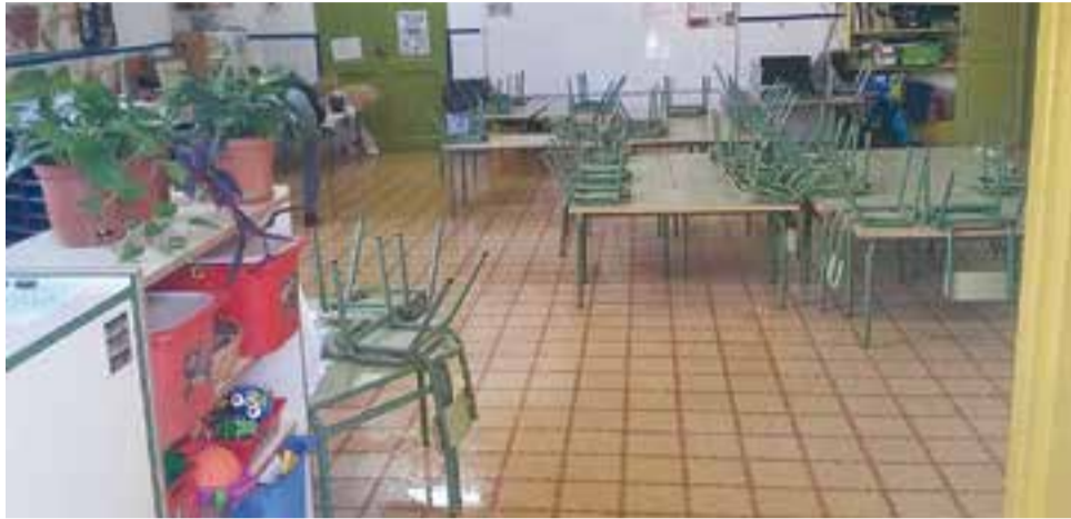
L'aula d'I3 de l'escola Emili Carles-Tolrà plena d'aigua.