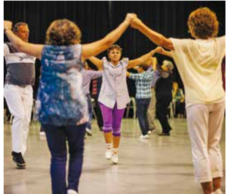
La Diada Sardanista del novembre de l'any passat.