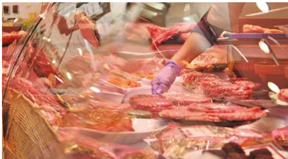
© A Cárnicas Merche no han copsat un descens en la venda de carn. || C. DÍAZ

L'expert matisa que la informació que s'ha donat s'ha de prendre com una classificació qualitativa, perquè "es diu que produeix càncer, però no matisa en quina quantitat". Des de l'Agència de Salut Pú-