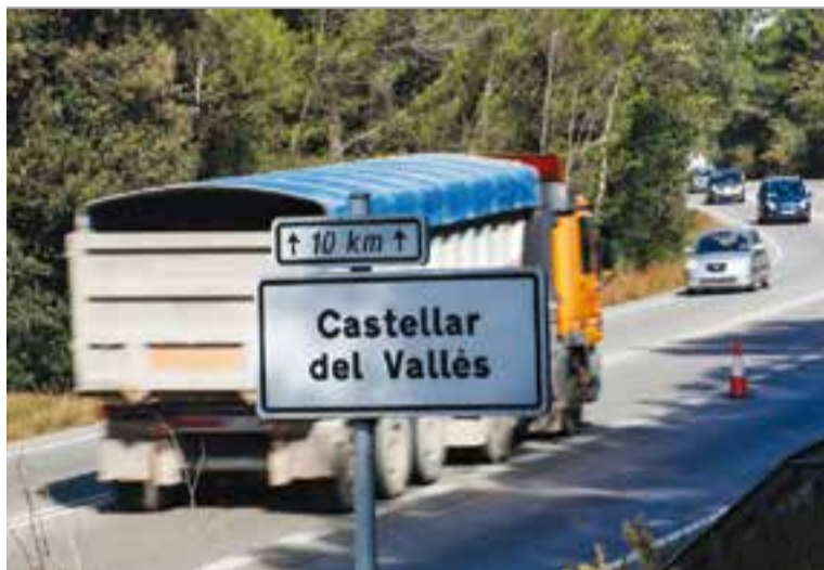
© Ara, els camions només passaran per la B-124 en direcció a Sabadell. || Q. P.

L'opció consensuada és un circuit circular. Els vehicles aniran cap a la pedrera, carregats de terra, per l'Avinguda Matadeperra de Sabadell, i tornaran, buits, per Castellar. D'aquesta manera, a