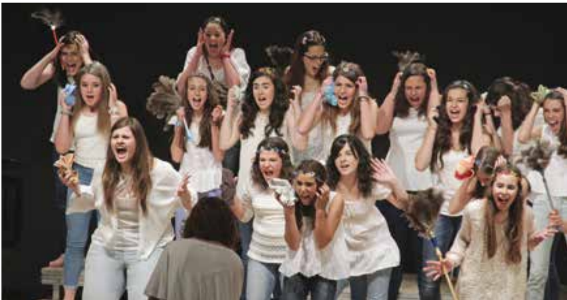
Una imatge d'una actuació anterior del concert 'Del somni a la veu'.

Del Somni a la Veu és un concert que les Corals Musicorum van estrenar per fer la clausura d'un cercle de corals que es fa a l'Hospitalet de Llobregat. Més endavant, l'octubre passat, van tornar-lo a fer a Esplugues i "ara ens venia molt de gust poder-lo presentar a Castellar", assegura la directora. Ho faran amb tres funcions, la primera aquest dissabte a les 21 hores i diumenge 8 a les 12.30 h i a les 17.30 h. +