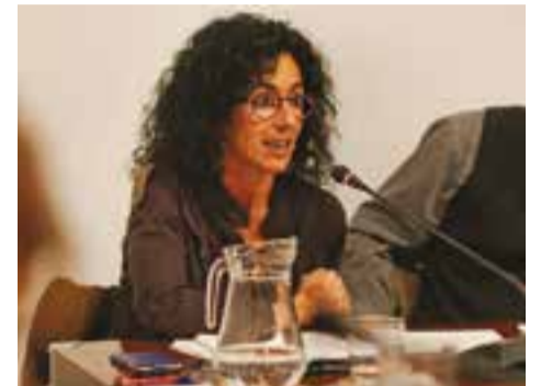
© Glòria Massagué al ple. || Q. P.

"Són moltes les famílies amb ingressos molt baixos que per manca d'assignació pressupostària es queden sense ajut pels seus fills" , va advertir la regidora de Serveis Socials. De fet, l'Ajuntament treballa per poder resoldre com més aviat millor aquests ajuts perquè els nens i nenes no s'estan quedant a dinar