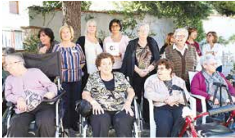
© Pepa Aymamí, M.ª José Casas i algunes residents de l'OSB mostren la placa. || C.D.

L'Obra Social i Benèfica (OSB), de la mà de Cuina Gestió, està identificada com a centre col·laborador.