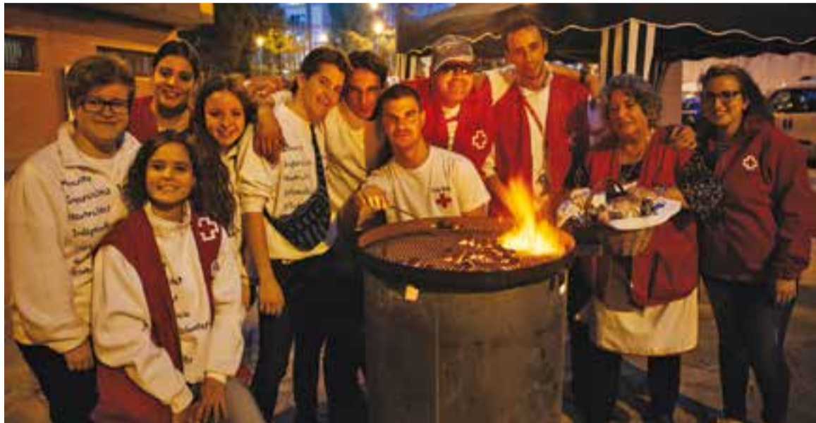
© Els voluntaris de Creu Roja a la seva parada de castanyes a la plaça de la Llibertat.