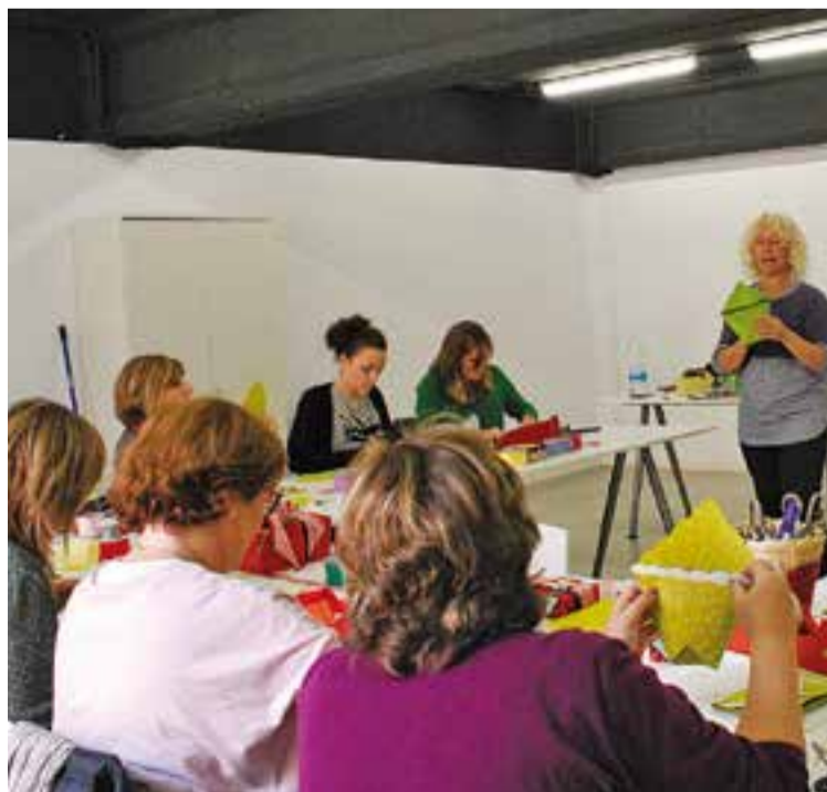
© Una imatge del curs de paqueteria. || COMERÇ CASTELLAR

A la primera sessió, la formadora els va donar consells i els va anar mostrant els passos per fer diferents tipus d'embalatges amb paper de regal, des d'embolcar un volum quadrat o rectangular de la