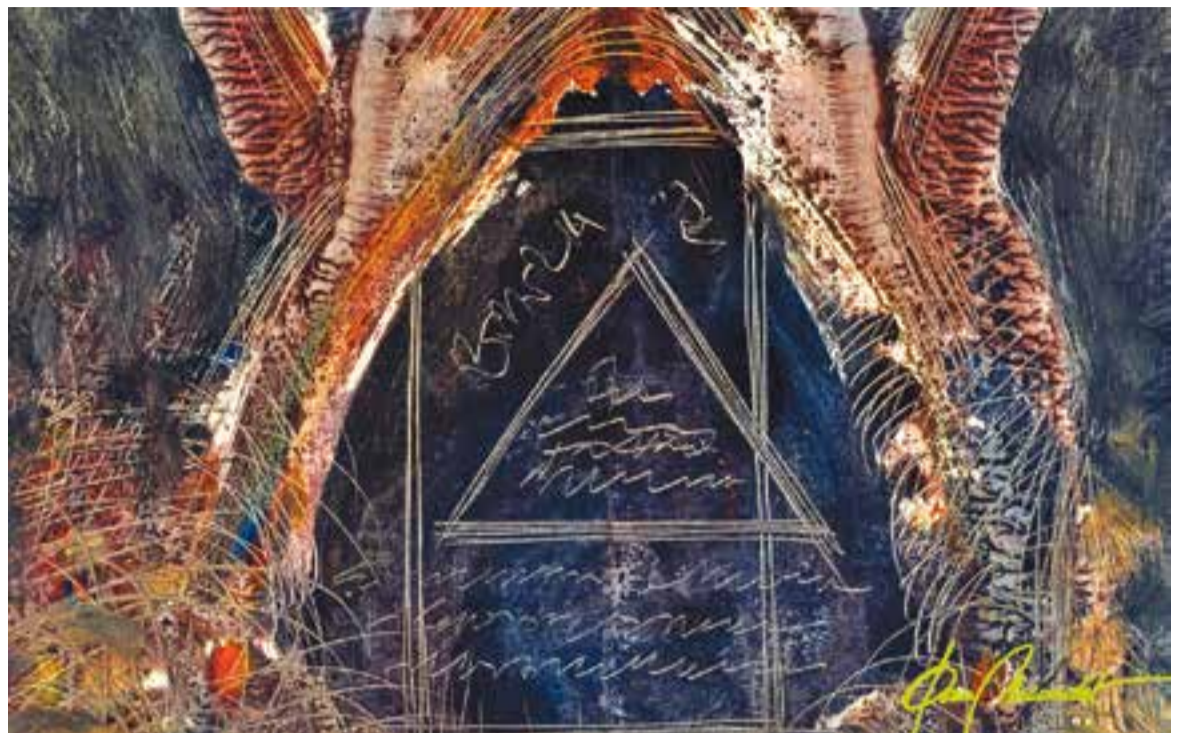
© 740 A. || JOAN MUNDET

Quina és la quantitat de carn recomanada? Es coneix que el risc augmenta