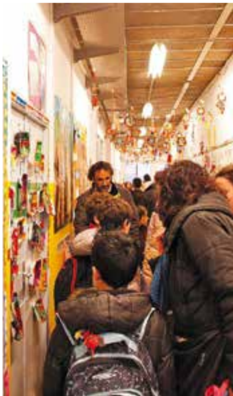
Portes obertes a l'escola Sant Esteve

Dijous 10 de març, a les 9.15 hores i a les 15 hores, l'Escola Bonavista farà xerrades informatives i visites a les instal·lacions. En aquest cas, cal trucar al telèfon 93 714 41 95. L'últim centre serà l'Escola Sant Esteve, que ha organitzat la xerrada i la visita dimecres 16 de març a les 17 hores. +