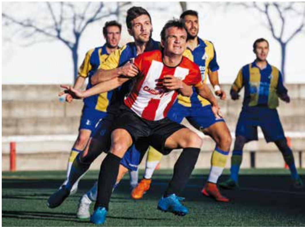
© Enric Raya lluita una pilota amb la defensa del Joanenc. Tot i el gran partit només es va sumar un punt. || Q. PASCUAL

La UE Castellar, condemnada a jugar amb 10 homes durant 68 minuts no pot amb el Joanenc, cuer de la categoria