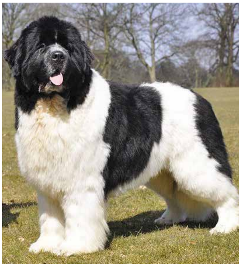
© Exemplar de Terranova. || AECAT