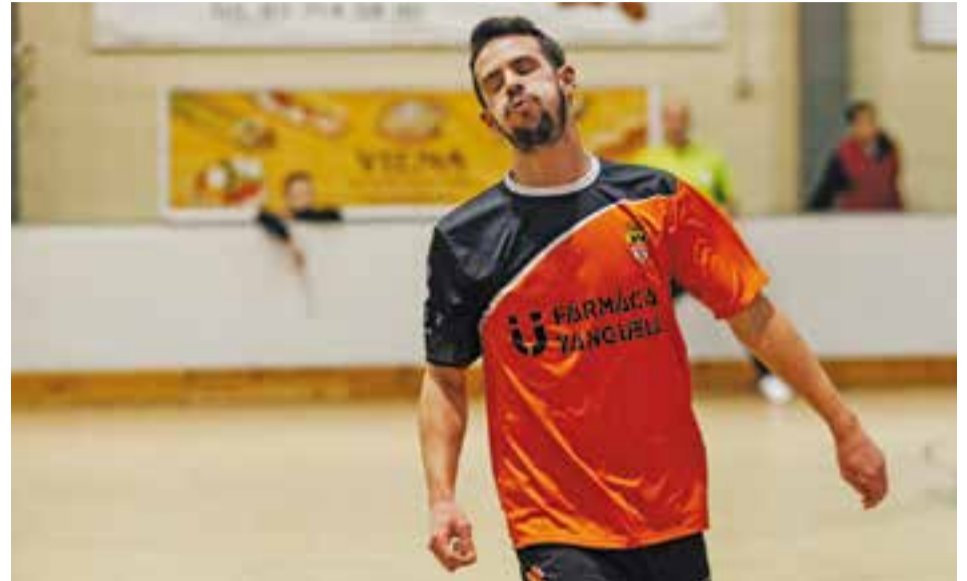
© Roger Carrera es lamenta d'una ocasió errada, en una imatge d'arxiu. || Q. PASCUAL