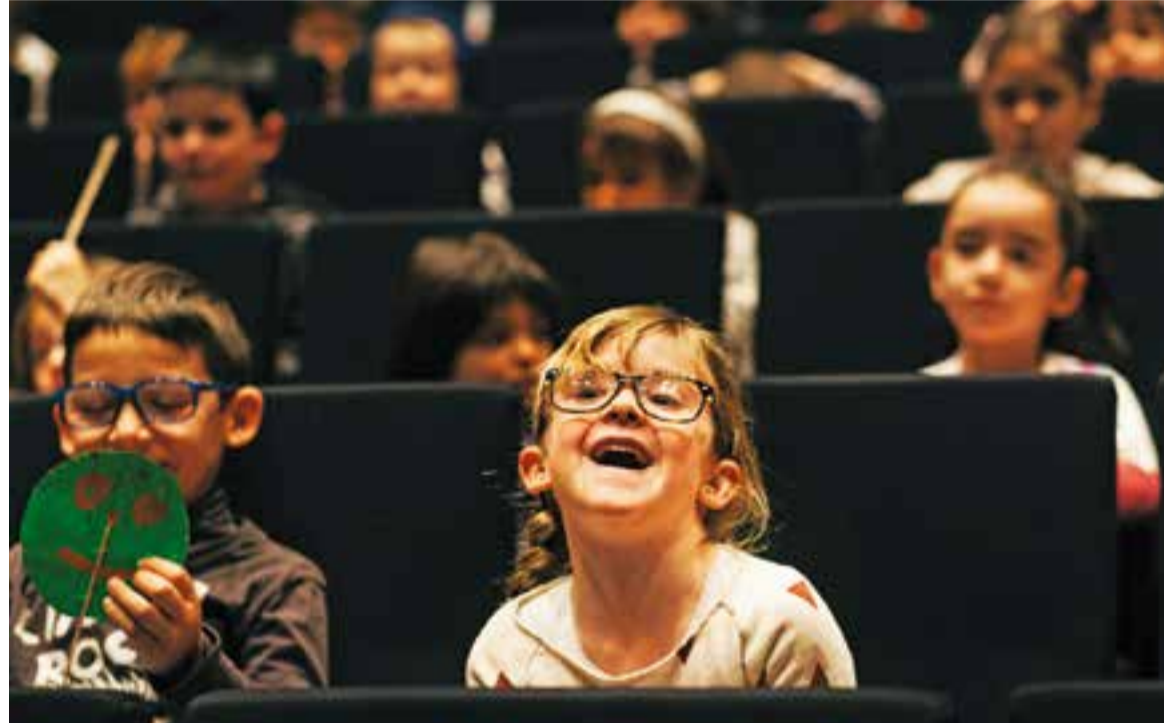
© Alumnes de Castellar que van participar divendres passat a la projecció d'El Meu Primer Festival. || Q. PASCUAL

El BRAM! Escolar tindrà lloc en sessions matinals a l'Auditori Municipal Miquel Pont. Les pel·lícules programades, set en total, s'han escollit, com ja es va fer a les edicions anteriors, d'entre una sèrie de títols que permeten un treball educatiu a l'aula, tant abans com després del visionat. Per fer-ho, els centres educatius han rebut recentment els dos-