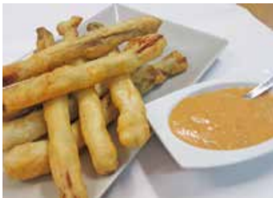
© Calçot arrebossat del restaurant Garbí. || CEDIDA

EL CALÇOT || El calçot és una ceba tendra, blanca i dolça. Per obtenir el calçot cal plantar la llavor d'un tipus de ceba. Un cop es tenen les cebes, es planten directament a terra. Quan apareixen els grills, es van calçant, i aquest és el secret, tapant-los amb terra fins que assoleixen la mida desitjada. El seu cultiu comença entre els mesos de setembre i novembre. Generalment s'estalvia el procés del primer any, de fer llavor la ceba, i s'adquireixen les cebes en un viver o sindicat agrícola. “Els hortolans que jo conec i jo mateix ja comprem la ceba de llavor” , conclou Fernández. +