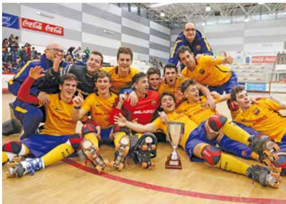
© Oriol Garcia, segon abaix per l'esquerra, celebra el títol de Copa aconseguit a Mieres. || LUISVELASCO.ES

El Girona anotava a la següent jugada amb gol de Borja Ramón. Àlex Martínez am-