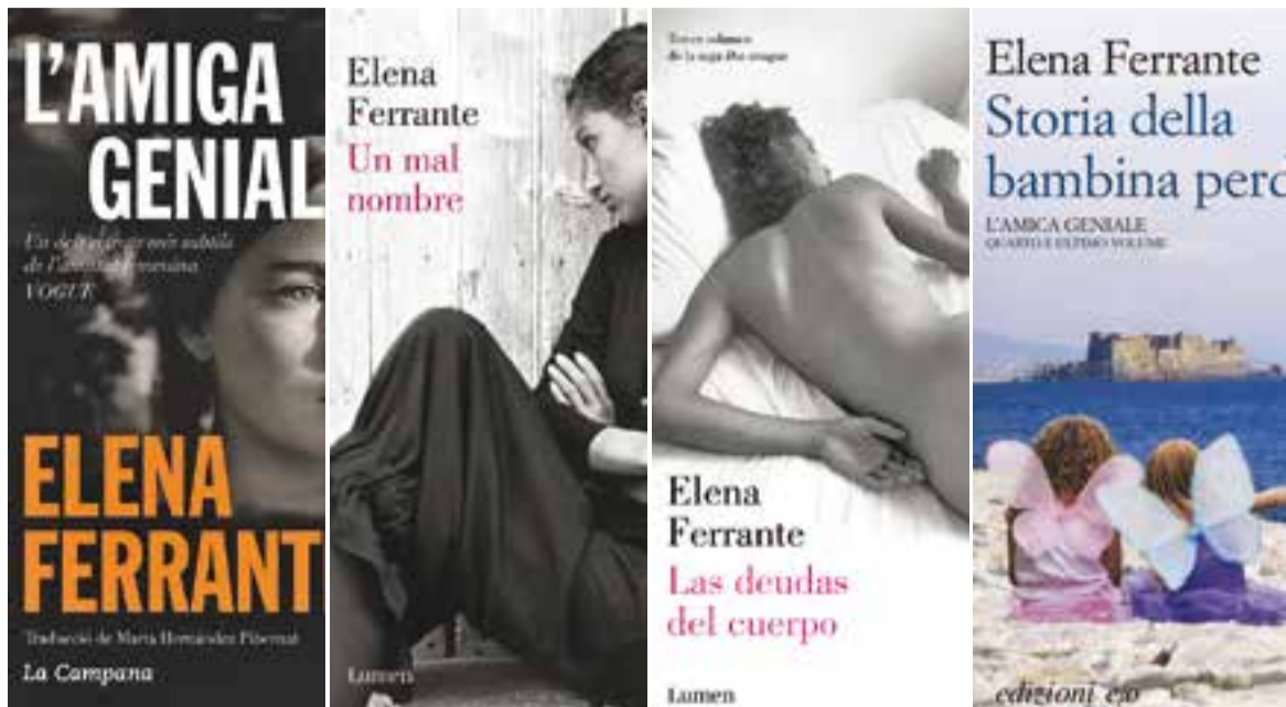
Diverses portades dels llibres d'Elena Ferrante