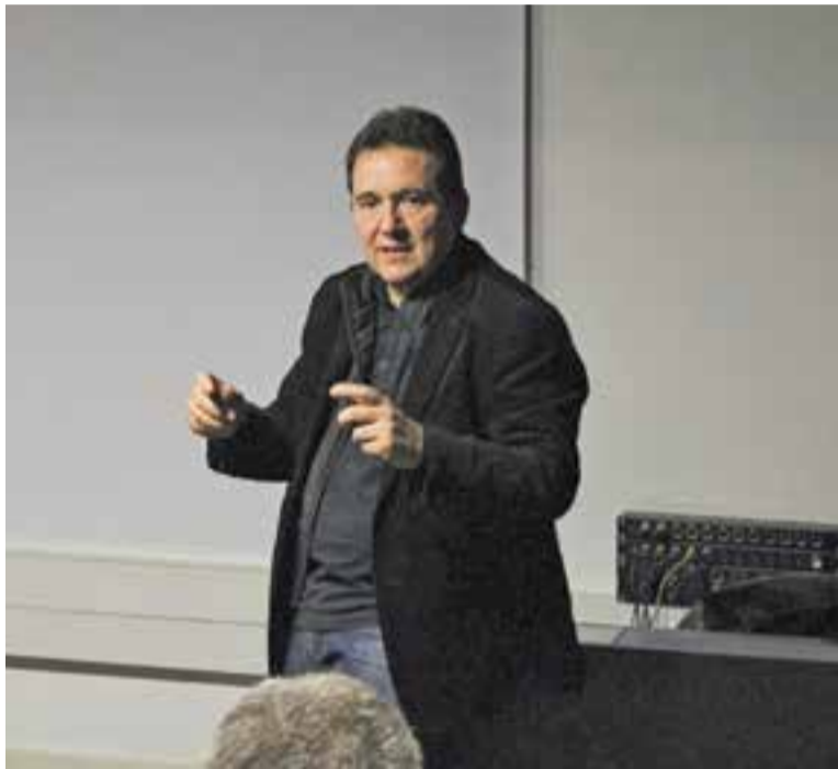
© Manel Cunill, després de la projecció del Documental del Mes. || A. PARERA