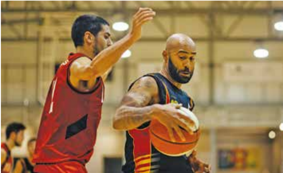
© Tot i començar bé, el CB Castellar no va poder amb el rival del Bages. || Q. PASCUAL