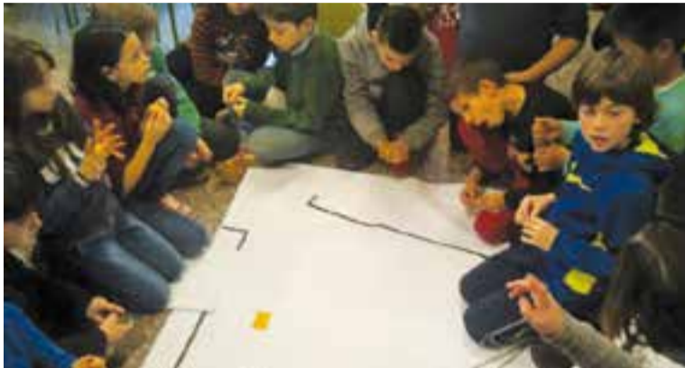
Alumnes de l'escola Sant Esteve en un taller de preparació

A aquestes aportacions se sumaran les contribucions que vagin sorgint dels tallers que s'han programat en els propers mesos. En total s'han organitzat vuit tallers: per a gent gran, joves, persones amb discapacitat i entitats de l'àmbit, ciutadania, representants municipals, entitats i emprenedoria. Per poder participar, cal fer una inscripció. De fet, cada persona només es pot inscriure a un sol taller, omplint el for-