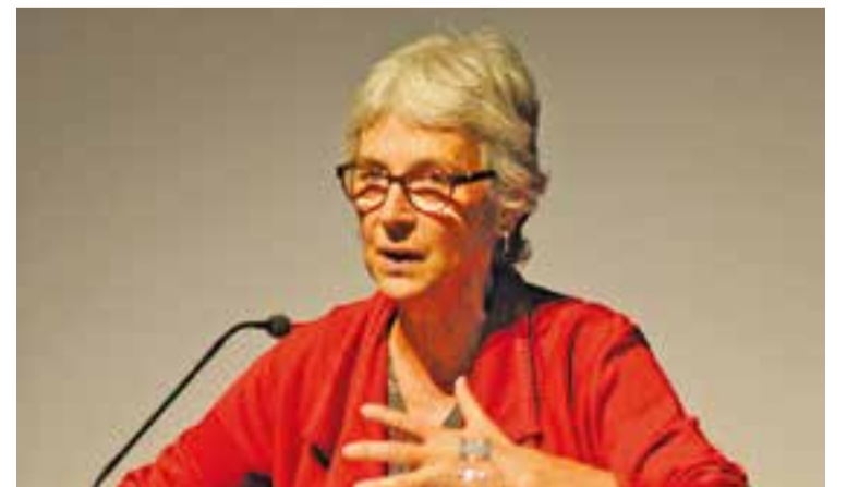
© M. Casals, durant la seva participació a l'Aula d'Extensió Universitària el 2011.

Casals, fortament lligada a Sabadell, tant per la seva família com per la seva vinculació amb diverses entitats, va ser homenatjada a la ciutat en una concentració convocada per l'Ajuntament a la plaça de Sant Roc. Muriel Casals també va ser homenatjada dijous passat al Parlament de Catalunya, que li ha concedit la Medalla d'Or de la Generalitat a títol pòstum. †