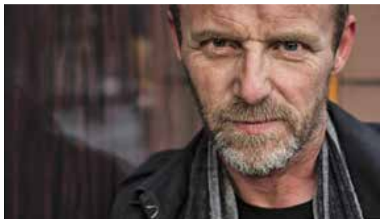
⊙ Jo Nesbo, un dels propers autors que passarà per les entrevistes virtuals.

Per participar-hi, només has de ser major de 14 anys i escriure la teva pregunta al formulari que es troba a l'enllaç de la Biblioteca Virtual. Les preguntes no han de sobrepassar les 100 paraules i el seu redactat ha de ser entenedor. Un cop es tanqui el termini fixat, es publicaran les respostes de l'autora a la mateixa web. + || REDACCIÓ