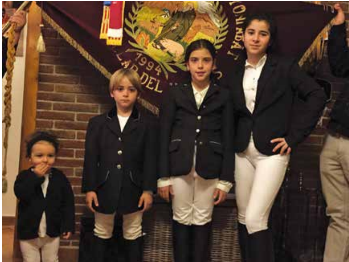
⊙ Els cordonistes que protagonitzen la passada d'aquest any.