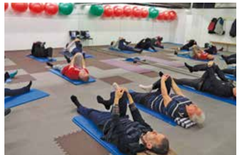
© Diferents moments d'una classe de ioga de l'entitat Tothicap. || CEDIDES