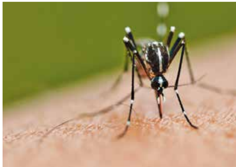
El virus Zika es transmet per la picada d'un insecte.

per la picada d'un tipus concret de mosquit, quan aquest prèviament ha picat a una persona infectada i després pica a una persona sana. No s'ha demostrat, a hores d'ara, altres vies de transmissió, o sigui que no es transmet de persona a persona. El període d'incubació és de 3-12 dies i en alguns casos pot produir febre, lesions a la pell, dolor a les articulacions, ulls vermells, cansament i mal de cap. S'acostuma a resoldre sense complicacions greus abans d'una setmana. El tractament és com en altres virus: paracetamol, repòs i la ingestió abundant de líquids. Per confirmar el diagnòstic necessitarem fer una anàlisi de sang i enviar-ho a un laboratori de microbiologia del Hospital Clínic, procés que està protocol·litzat als centres d'atenció primària.