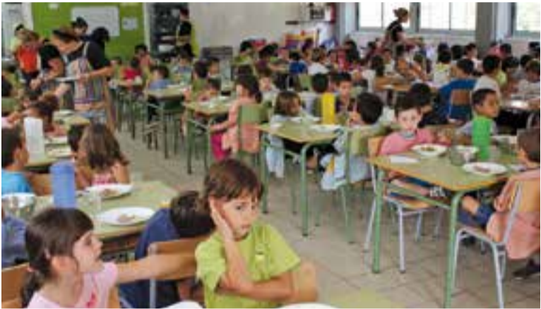
Una imatge d'arxiu del menjador de l'escola Sant Esteve.

El Consell Comarcal ha concedit 190 beques a famílies castellarenques a les quals s'afegeix un ajut municipal que becarà 40 famílies més