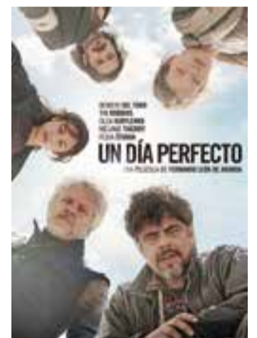
© Un día perfecto es projectarà aquest vespre a la Sala d'Actes || CEDIDA

El cap de setmana arriba farcit de cinema. Aquest vespre en el marc de la sessió de Cinefòrum del CCCV es projectarà a la Sala d'Actes d'El Mirador la pel·lícula Un día perfecto de Fernando León de Aranoa. El film, protagonitzat per Tim Robbins i Benicio del Toro, té com a teló de fons la guerra dels Balcans i la feina dels cascos blaus de Nacions Unides. Uns cooperants hauran de treure d'un pou, que es troba en zona de conflicte, un cadàver que s'ha corromput i contamina l'aigua de la zona. Per a un públic més familiar, diumenge al matí el projectarà la pel·lícula d'animació La casa màgica , a l'Auditori. Ja a la tarda, en una doble sessió a les 16h i a les 19h, es programarà a l'Auditori Palmeras en la Nieve , l'adaptació cinematogràfica de la novel·la homònima de Luz Gabás. ➤ || R.G.