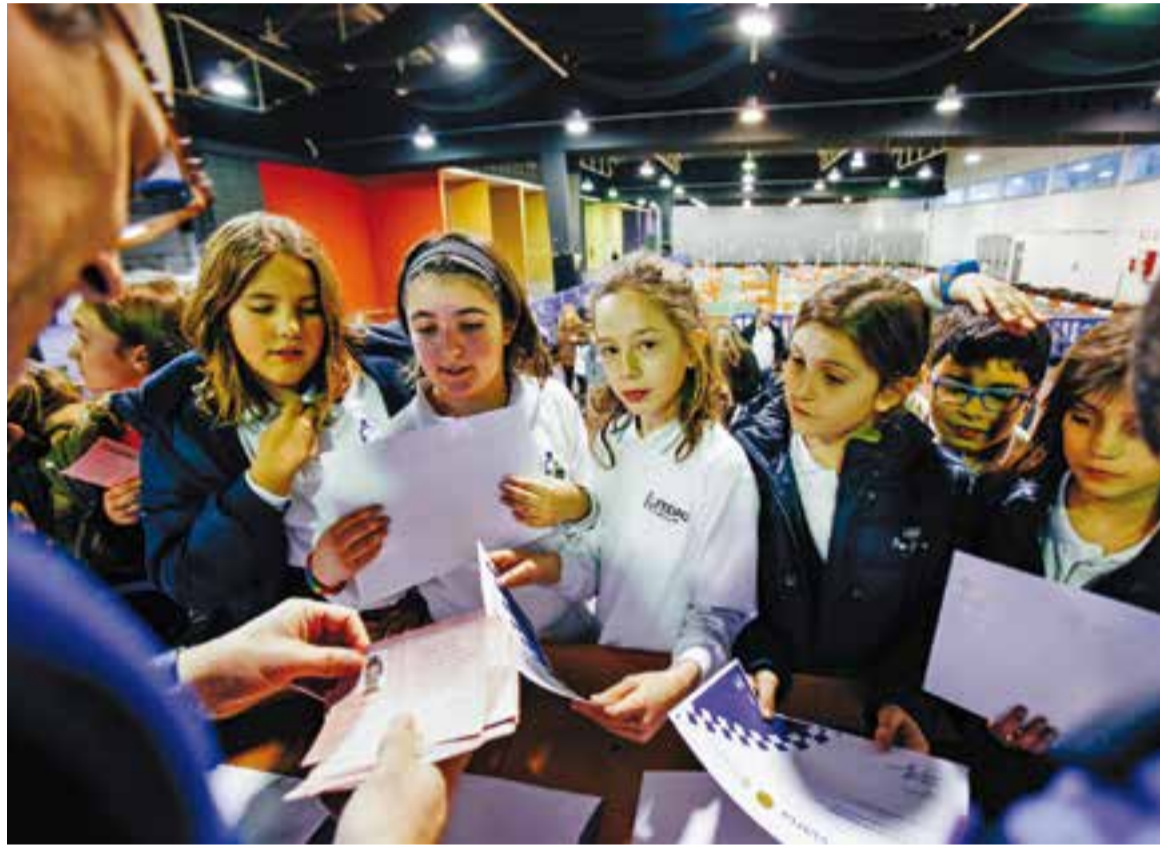
Lliurament de diplomes d'educació viària, divendres passat a l'Espai Tolrà.

Així, entre el 18 de gener i el 12 de febrer, els infants van participar al curs que consta d'una part teòrica de dues hores de durada i també una part pràctica d'una hora i mitja que es desenvolupa en un circuit de bicicletes instal·lat a l'Espai Tolrà on s'ha posat especial èmfasi en l'importància de portar el casc i de respectar els senyals. L'objectiu és ensenyar als nens i nenes les normes bàsiques de circulació i el comportament més segur a l'hora d'anar pel carrer. “ Intentem que el circuit sigui el més real possible. Hi ha policies, obstacles, pas de via-