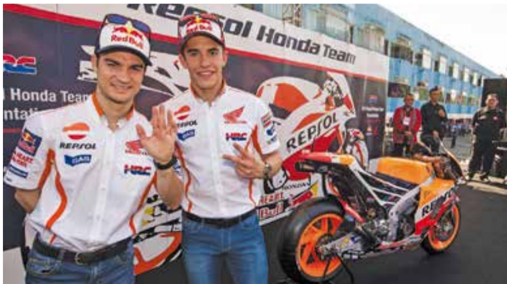
Dani Pedrosa i Marc Márquez amb la nova Honda de la temporada 2016 a Jakarta (Indonèsia).

Jakarta (Indonèsia) ha estat el lloc escollit per la presentació de la nova moto d'HRC