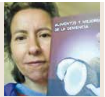
Torres amb el llibre.