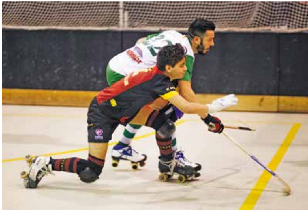
Guillem Plans lluita per una pilota al partit d'anada contra l'HC Piera al Dani Pedrosa de Castellar.

L'HC Castellar cau contra el Piera per golejada i necessita revertir la situació per aconseguir la permanència a Primera Catalana