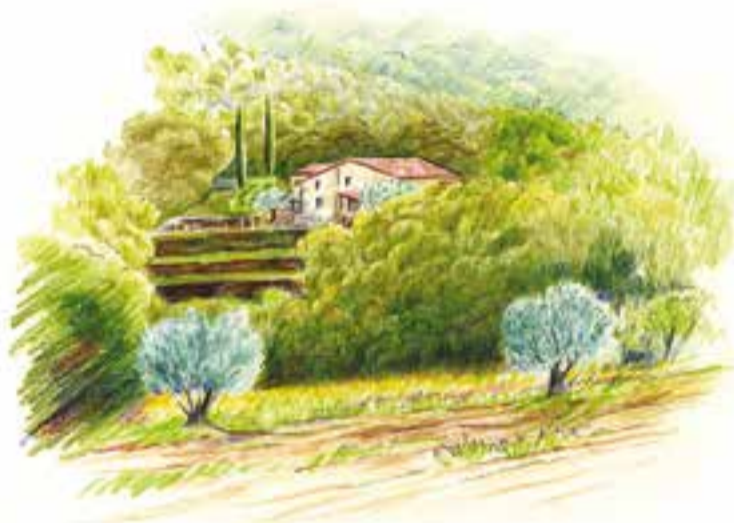
© Can Juliana i el Gorg del Fitó.