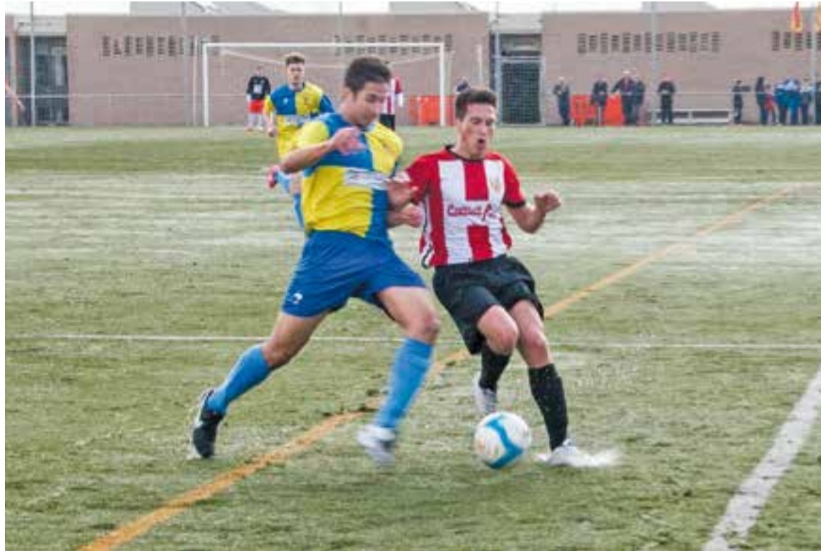
La UE Castellar ho va intentar sense massa èxit a Sabadell.