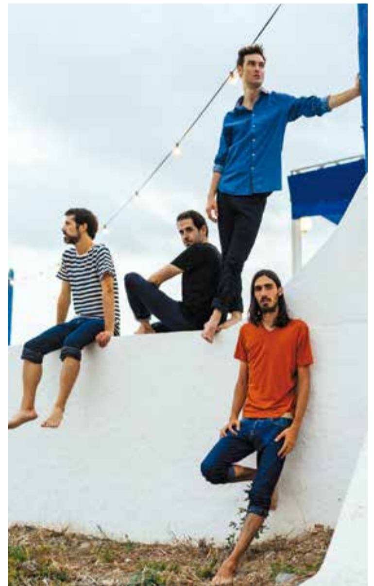
Una imatge promocional del quartet Tailor for Penguins

El gran poder evocador de Tailor for Penguins es posa ara al servei del gaudi de qualsevol moment del dia en qualsevol lloc del món. Per exemple, com ells mateixos evocuen, d'un instant d'estiu al mar. Amb aquest primer disc es posen al servei del públic sense desvetllar el seu secret que, segons la crítica, és el d'esquitxar amb una mica de màgia que porten a dins els instruments acústics tradicionals que toquen per transformar les cançons que interpreten per fer-les diferents i especials.