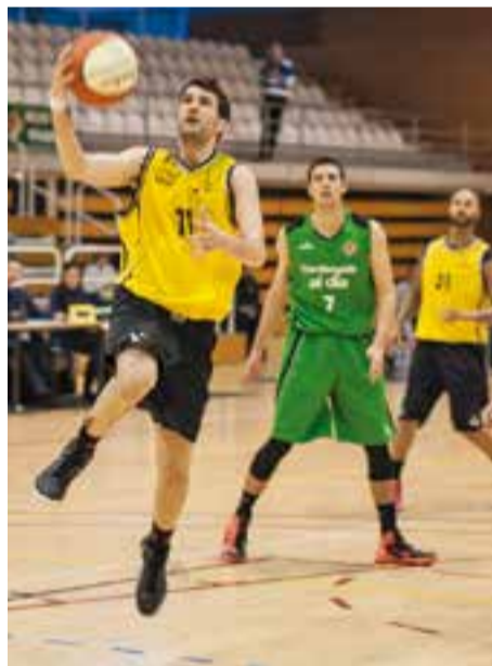
Nova derrota del CB Castellar. || A.S.A.

El CB Castellar queda en 12a posició amb un balanç de 8/16, amb triple empat amb Círcol (11è) i l'Alpicat (13è). + || A. SAN ANDRÉS