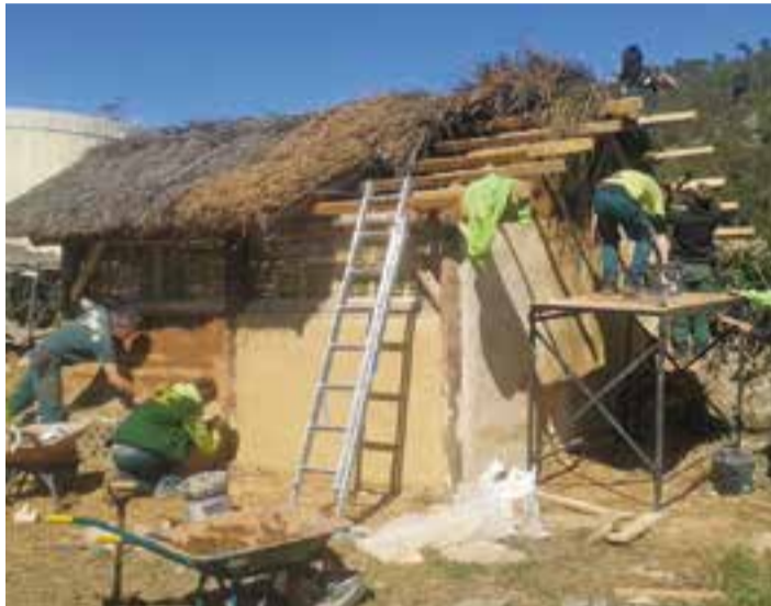
Els alumnes de l'INS Castellar en plena construcció de l'aula.