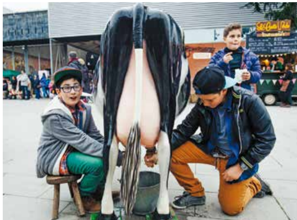
A l'esquerra, moment de l'actuació del Ball de Gitanes. A la dreta, el taller infantil "Vine a munyir la vaca", a càrrec de La Vaqueria.