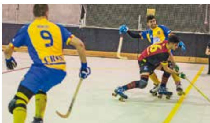
A l'HC Castellar li queden sis finals per salvar la categoria. || A. SAN ANDRÉS

L'HC Castellar va tornar a caure en lliga per quarta jornada consecutiva. Els de Fidel Truyols no van poder contra el Vila-seca a domicili caient de manera contundent per 9 a 3 contra el setè classificat. L'equip castellarenc segueix en caiguda lliure a la lliga i es complica la salvació cada vegada més, després de caure contra el Cerdanyola, el Bell-lloc, Molins i Vila-seca de manera consecutiva. L'última victòria va ser per golejada a casa enfront l'Amposta (7-0).