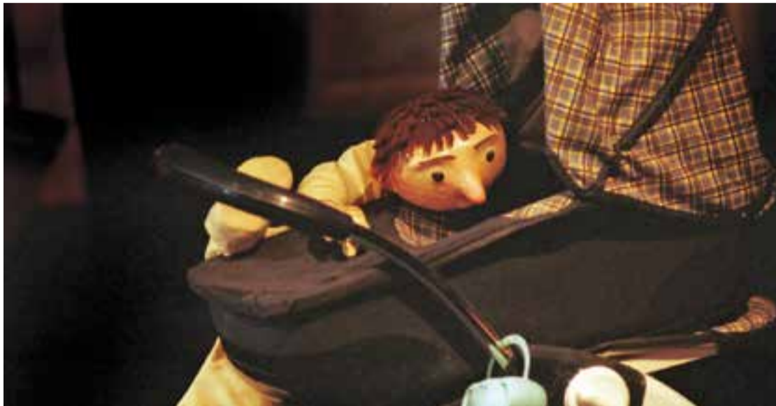
Moment de l'arribada d'un nou germanet a la família de l'espectacle de Farrés Brothers i Cia. 'El rei de la casa'.

'El rei de la casa', un espectacle multipremiat, arriba a l'Auditori