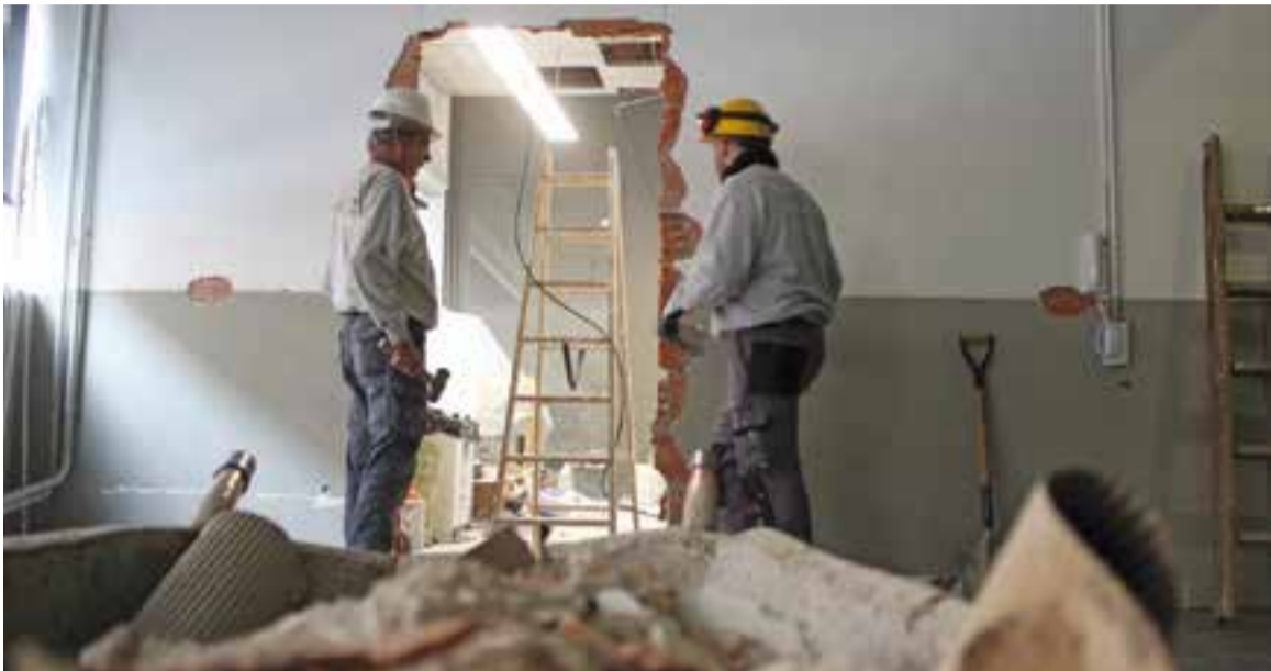
Imatge de les obres que s'estan fent en el primer pis de l'Espai Tolrà

Les reformes es fan per encabir els serveis d'ocupació de Cal Botafoc