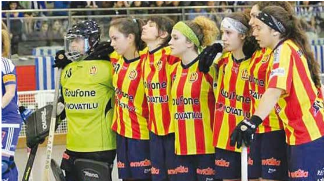
La portera, a l'esquerra, durant la tanda de penals de la final.

El Palau, últim campió de lliga, queia enfront de les quadribarrades per 5 a 3, en un partit on les manlleuenques remuntaven un marcador advers al descans (1-2), per fer quatre gols a la segona part i cap-