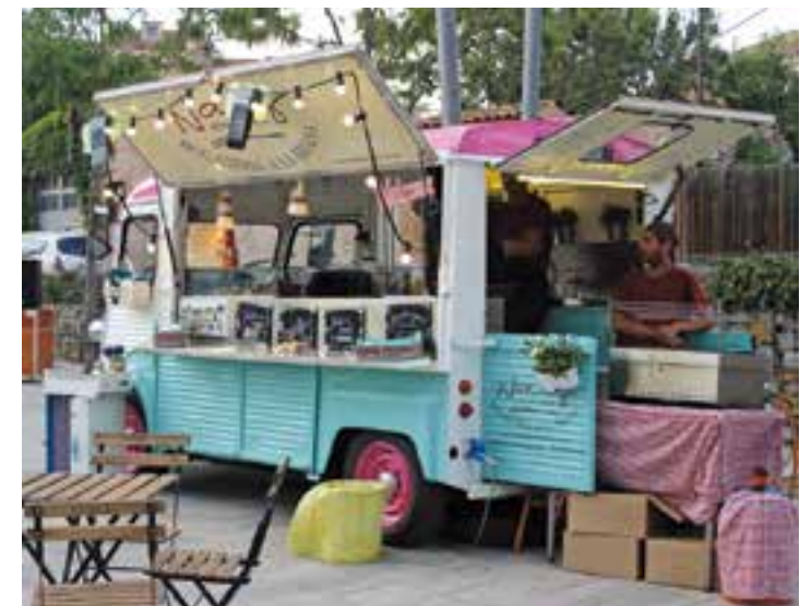
Food trucks a la Nit Jove a la plaça d'El Mirador || R.G.

Finalment, aquest vespre a partir de les 20h l'Open Lounge d'El Mirador viurà un nou divendres amb música per a tots els gustos. Així, els dj's UP i Eudi seran els encarregats de conduir la sessió dedicada aquest vespre al pop rock i l'indie. L'activitat, que és oberta a tota la ciutadania, l'organitza Dee Jays del Revés. + || ROCÍO GÓMEZ