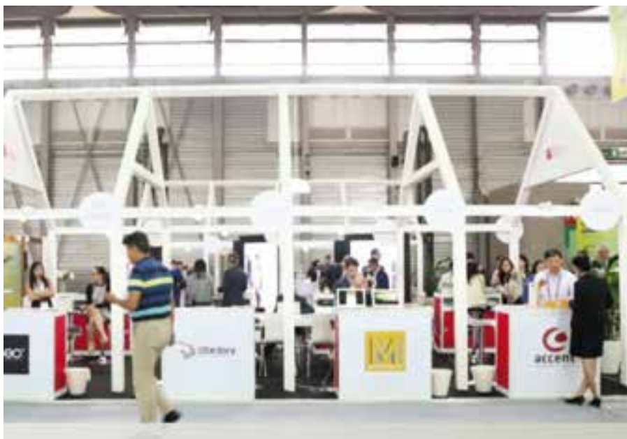
Stand d'Accent Systems al Mobile World Congress de Xangai. || MOBILE WORLD CAPITAL

El primer punt comercial serà als Estats Units i està buscant un soci per obrir-ne un altre a Àsia