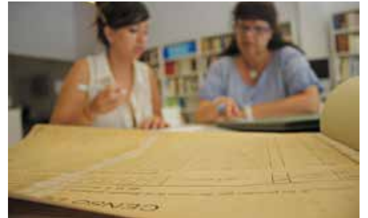
Els padrons restaurats es poden consultar a l'Arxiu Municipal.