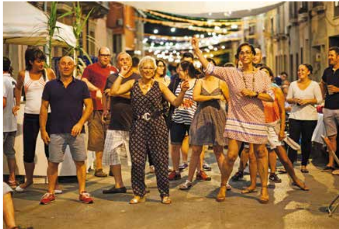
La Revetlla de Sant Jaume dels Veïns del Pla, l'any 2015.

El concert d'havaneres s'acompanyarà del tradicional rom cremat i també s'oferiran còctels de Joan Juni, batejats com MiCoctel, i que inclouen