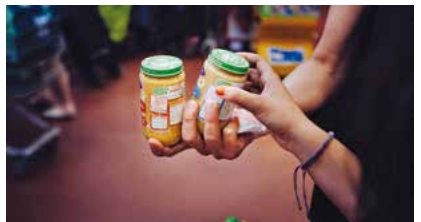
Recollida d'aliments de Solidaris amb Castellar. || Q. PASCUAL

Així, la proposta solidària que s'organitza a través de Càritas Castellar, Creu Roja i de la Comissió per a la Inclusió Social del Consell del Consell Sociosanitari, va establir punts de recollida a diversos equipaments municipals i centre educatius de la vila educatius de la vila. Com és habitual, alguns supermercats de Castellar van instal·lar punts de recollida a l'entrada dels centres. || R.GÓMEZ ➔