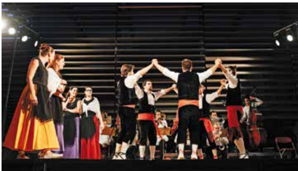
La colla Violetes del Bosc interpretant una sardana amb la cobla Marinada.