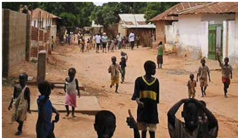
Escola de sords IMSHA al Camerun amb membres de Codes Cam. || CEDIDA Poblat de Tuba Kolong, a Gàmbia. || CEDIDA

gua, Masaya, Estelí, Nueva Segovia, Matagalpa, León, Chinandega, RAAS, RAAN i Chontales) en defensa dels drets de les dones que porta per títol "Ejerciendo ciudadanía, defendiendo los derechos de las mujeres". El projecte rebrà un total de 10.992 euros.