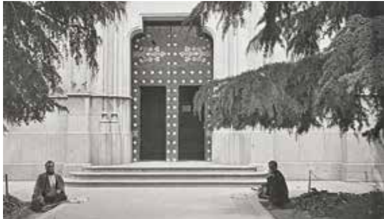
L'església de Castellar va ser salvada de cremar pel Comitè Antifeixista local.

Poc s'imaginaven aleshores els membres del Comitè Antifeixista de Castellar que el cop militar del general Franco seria una llarga i penosa guerra de conseqüències funestes per a l'esdevenidor català i espanyol. En el seu escrit publicat a La Farga, apunten que es tracta d'una "sublevació dels cretins que en un moments de follia han cregut que podien implantar el règim de caserna a un poble martiritzat per llargues èpoques, sofrent de persecució i d'imposicions arbitràries". I és que, el cop d'estat del 18 de juliol no havia quallat a Catalunya i, a Barcelona, el president Lluís Companys tres dies després creava el Comitè Central de Milícies Antifeixistes de Catalunya per organitzar mili-