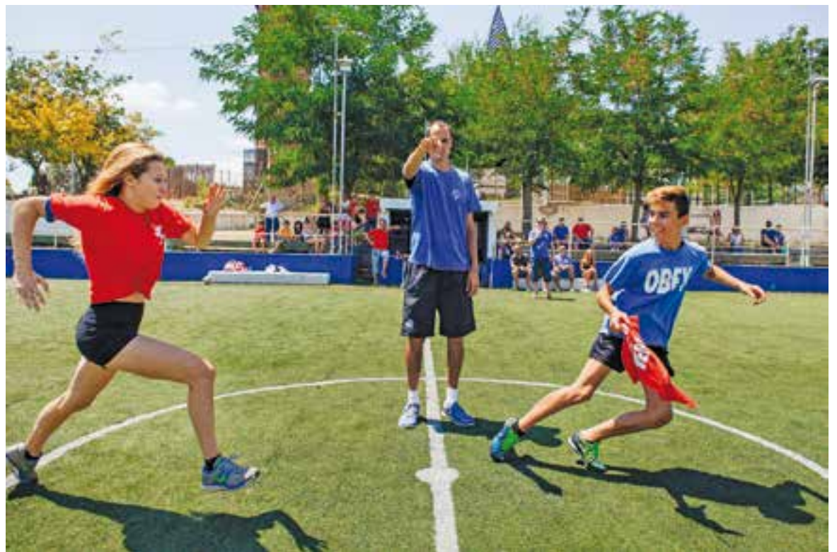
La prova del mocador de les Olimpíades de blaus contra vermells.

Diumenge les activitats per a totes les edats van seguir matí i tarda fins a encendre la traca fi de festes. Així acabava una Festa Major "molt participativa, va haver-hi molta gent i moltes famílies", va opinar García. +