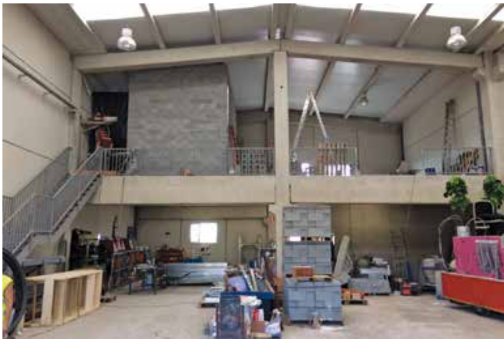
Aquest és l'aspecte de la nau amb les obres d'ampliació que s'hi estan fent. || AJ.CASTELLAR

L'edifici del carrer Anòia tindrà cinc classes més i també es fan obres a l'escola Bonavista