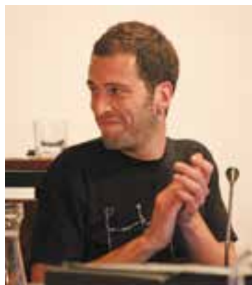
Moyà, en el moment del comiat.

activitat social. Fa molts anys que estic lligat a la política (en minúscules) a molts espais, i ara m'agafo una petita pausa per poder acabar coses que sento que sinó no podria encarar”. Tot i això, va admetre que segurament no podrà desconnectar. “Amb gestos com els d'avui veig més clar que mai que Decidim Castellar és indispensable. Calen laboratoris de democràcia com aquest, assemblees obertes on entre totes puguem decidir què volem que sigui el nostre poble, sense cap més afany”, va afirmar el ja exregidor defensant la manera de treballar de