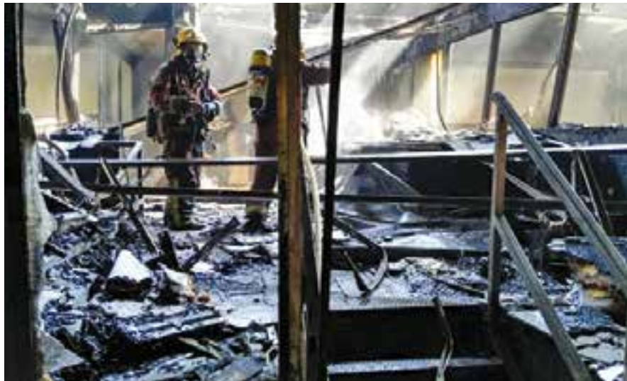
Els bombers remullant l'interior després de controlar l'incendi.

Es van veure afectades les oficines tècniques, una part de maquinària i l'altell