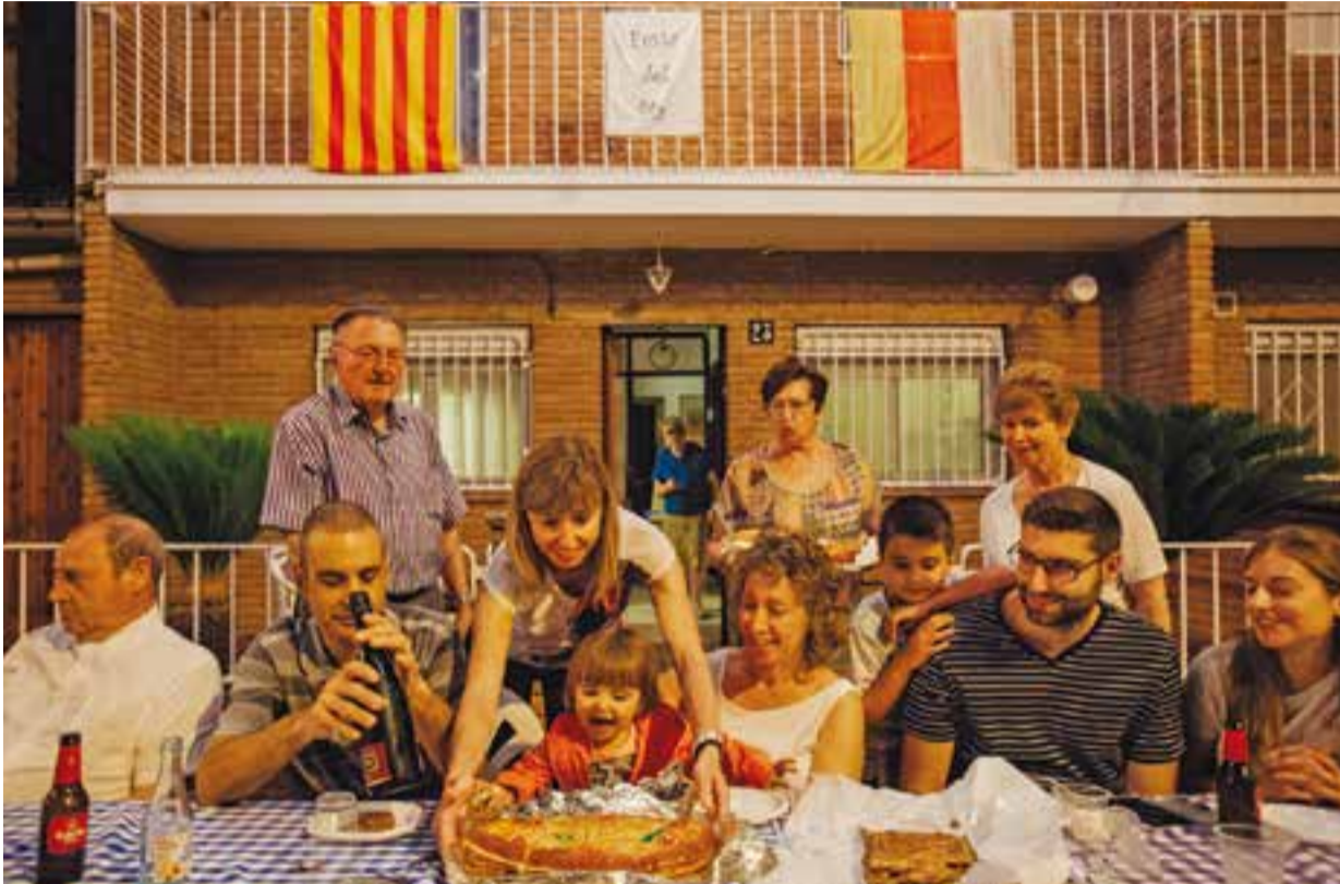
Un grup de veïns amb una coca de st. Jaume dissabte passat durant la festa.