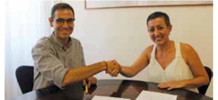
L'alcalde i la presidenta de l'ETC després de firmar el conveni. || CEDIDA

L'acord també regula detalladament les condicions en què l'entitat podrà fer ús de l'Ateneu, i també estableix que l'Ajuntament es farà càrrec dels pagaments dels costos de subministrament d'aigua, electricitat i calefacció de l'edifici. + || REDACCIÓ