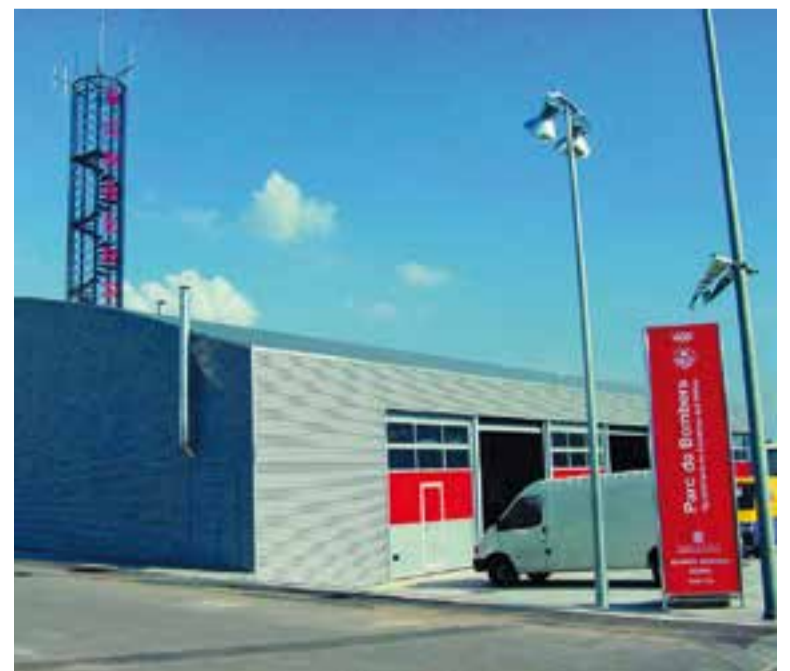
El Parc de Bombers de Castellar, situat al Pla de la Bruguera.

En la mateixa línia, Interior ha creat una adreça curta, interior.gencat.cat/bombersvoluntaris, a on s'aniran publicant i actualitzant els continguts d'interès per a les persones participants en la convocatòria, és a dir dates de presentació de sol·licituds, dates i llocs de realització de les diferents proves, llistes de persones admeses i excloses, resultats de les diferents proves, etcètera. ➔