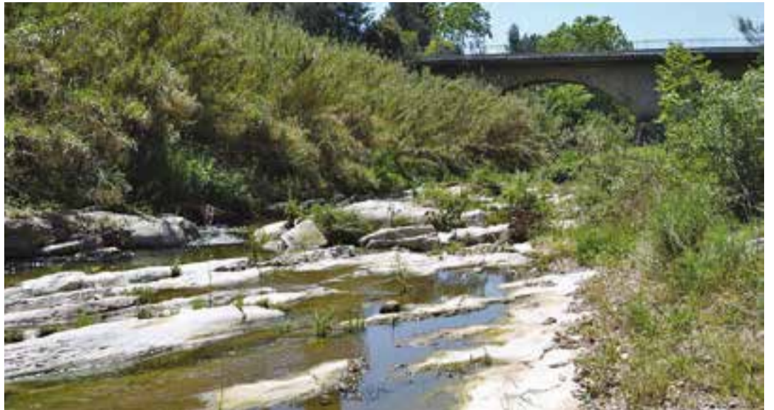
Un dels trams analitzats pels experts de la Universitat de Barcelona.

La UB diu que cal depurar les aigües residuals i que no hi ha cap espècie de peix als trams més contaminats