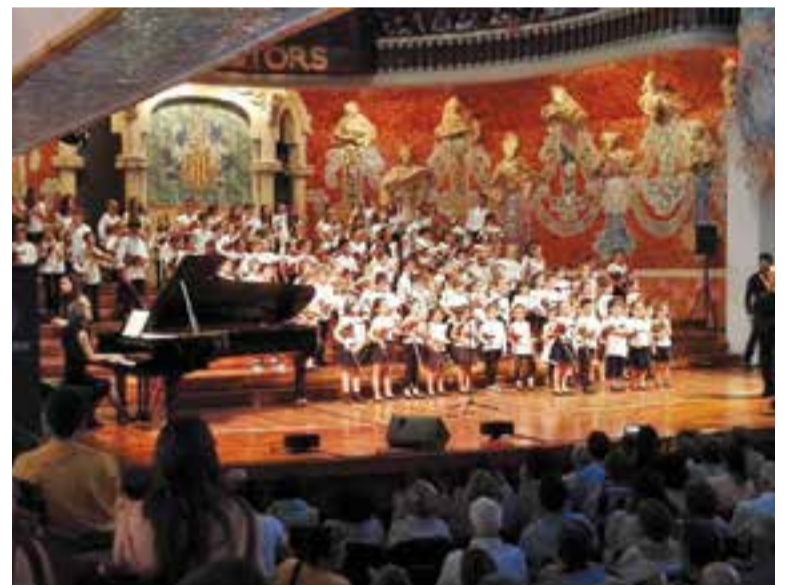
L'alumnat d'Artcàdia durant l'actuació al Palau de la Música.

cament el seu entorn més proper. Els mitjans i els grans han viscut experiències molt diferents, des de fer viure quadres de Kandinski i Miró a fer transformacions artístiques. "També hem anat enrere en el temps fins als anys 20 i 50 per conèixer l'estètica, els balls i la seva música" . S'han endinsat en el món de les «selfies» "i com les traduïm des del vessant artístic i hem parlat de l'art com a forma de denúncia" . +