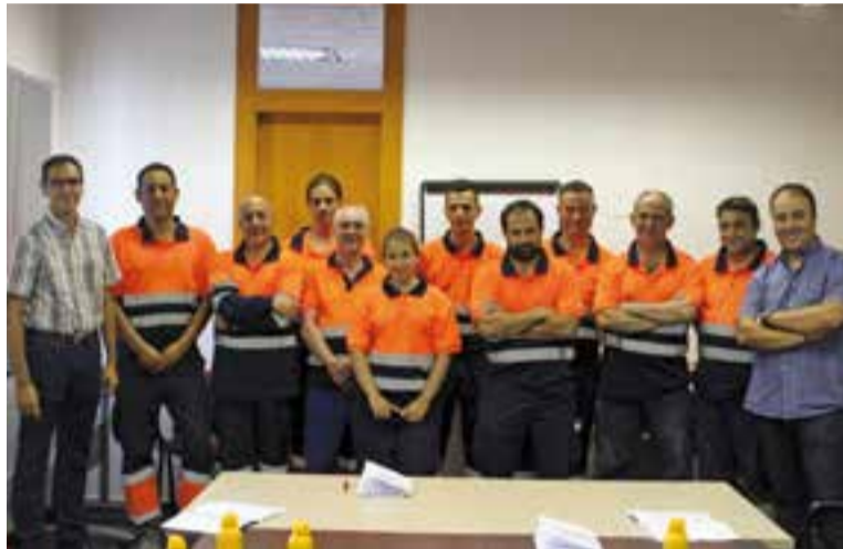
L'alcalde i el regidor de Manteniment amb els treballadors contractats.

Dins aquesta mateixa convocatòria, l'Ajuntament ja va incorporar el passat 11 de juliol quatre perso-