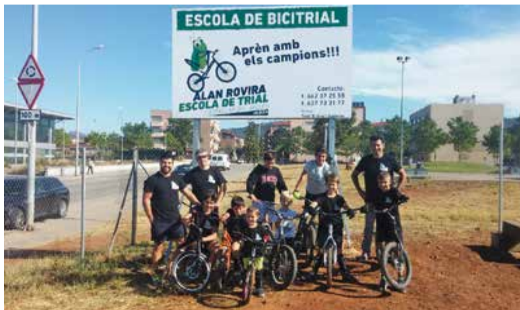
A dalt, Rovira en una de les zones de Llorca. Abaix, alguns dels alumnes de l'escola de bike-trial a Castellar.

ra, com a mínim repetir el subcampionat aconseguit la passada temporada.