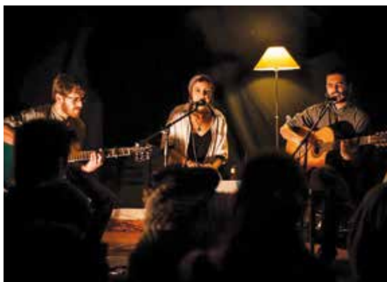
La Púrria actuarà dijous 8 a la Festa Major Popular de Cal Gorina.

L'entitat ha programat actes propis del 8 al 10 de setembre amb la intenció d'ampliar l'oferta festiva i arribar a tothom