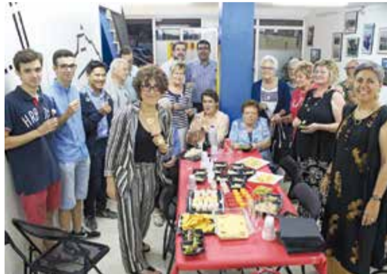
Presentació del PDC a Castellar, a la seu local del CDC

Les primàries a les agrupacions locals arrencaran el mes de setembre