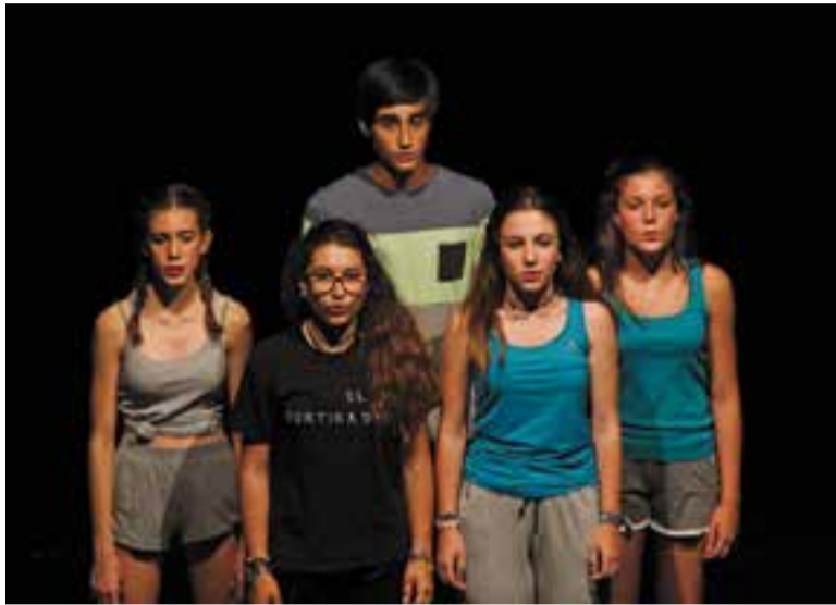
'El partit' tanca el 7è Stage de Teatre Musical.

L'obra que es va poder veure dissabte va servir per cloure el 7è Stage de Teatre Musical organitzat per Espaiart