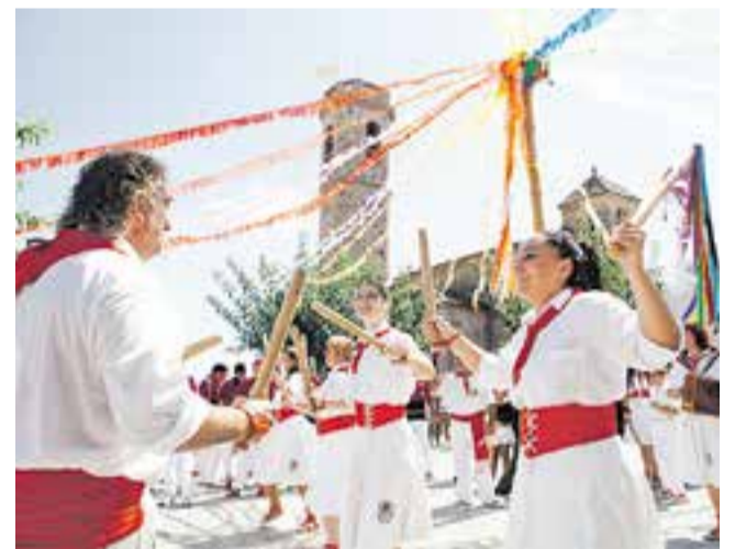
Actuació dels bastoners a Sant Feliu l'any passat.

Dilluns 12, a les 10.30 h, s'oferirà una xocolatada popular al pati de les escoles. A les 12.30 h, s'encetarà la popular Festa de l'escuma a càrrec dels Bombers Voluntaris de Castellar. Allí mateix tothom qui ho vulgui tindrà la possibilitat de donar aliments per a col·laborar amb Via Solidària - Càrites. A les 18h hi haurà partit de futbol; a les 19.30 h, espectacle infantil i, a les 21.30 h, correfoc de cloenda amb els Diables de l'Esbart Teatral de Castellar. + || MARINA ANTÚNEZ