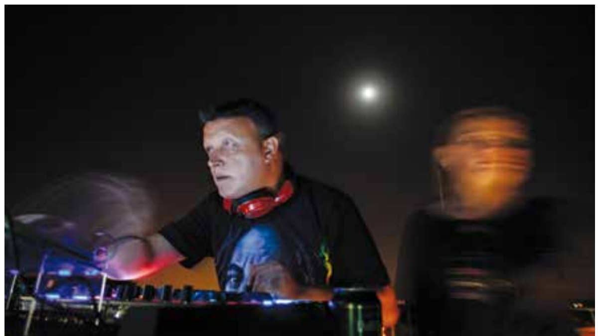
Sessió reggae de Dee Jays del Revés a l'Open Lounge de Nits d'Estiu.

L'agenda de Nits d'Estiu s'ha completat amb altres activitats impulsades per les entitats i associacions veïnals del poble. +