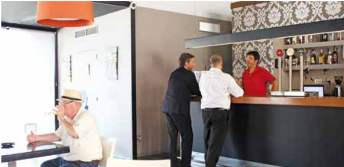
L'establiment el dia de la reobertura.

El 19 d'agost va ser el primer dia de funcionament del nou concessionari