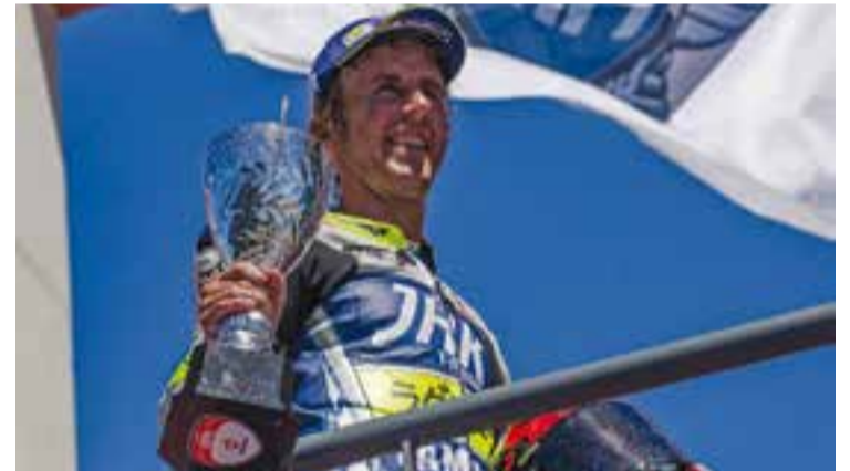
A dalt, Morales cremant roda. A baix, al podi de Portimao.

resten per acabar el campionat d'Europa de Superbikes