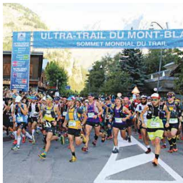
Sortida de la Trail del Montblanc.