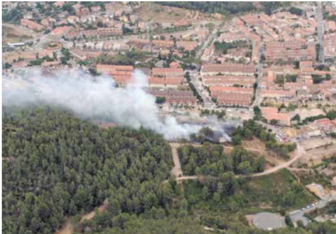
Imatge aèria de la zona afectada pel foc, molt a prop de les cases a la zona de l'Era d'en Petasques.

El cos policial ha començat a prendre declaració als testimonis oculars dels fets, per tal d'extreure'n indicis o proves que puguin ajudar en la investigació. D'altra banda, l'Ajuntament farà arribar un requeriment al propietari de les parcel·les on es podria haver iniciat el foc i que té construccions inacabades per tal que proce-