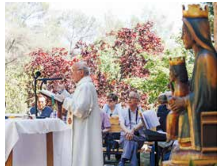
Missa a l'Ermita de les Arenes amb la figura de la Mare de Déu.

A Catalunya, també hi trobem Montserrat, el Miracle, Meritxell, Montgarri, Falgars, Queralt, Núria, La Gleva, El Roure, La Cinta, El Pi, etc. Els prodigis de les marededéus trobades són molt diversos. ✦