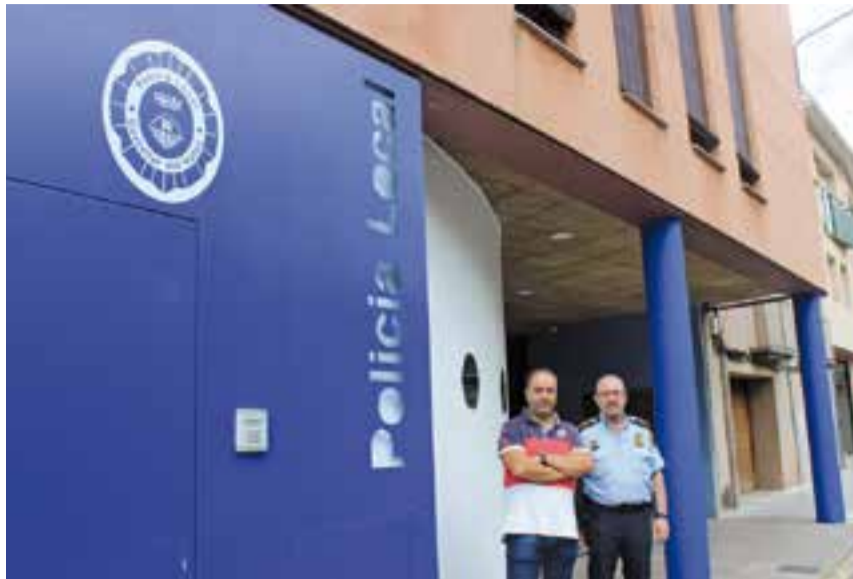
El regidor de Seguretat Ciutadana i el cap de la policia local davant la nova seu.

Els agents locals disposen ara d'una prefectura més funcional que duplica la superfície respecte a la del carrer General Boadella