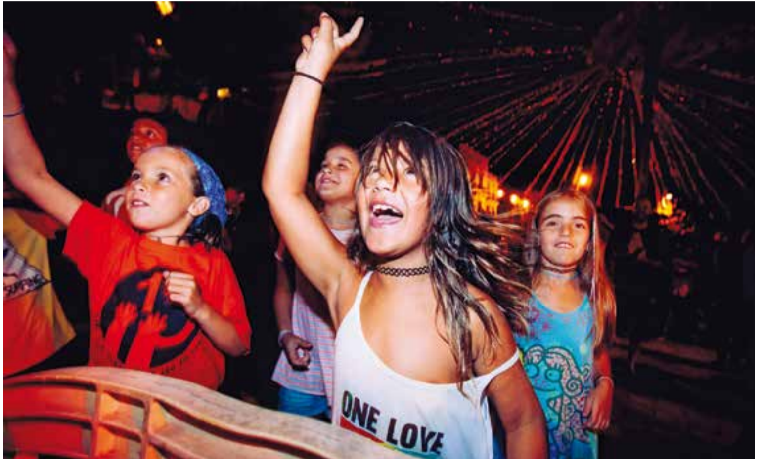
A dalt, joves assistents al concert de Festa Major de Sant Feliu i, a sota, festa de l'escuma dilluns passat.

Corre-tapes, campionats infantils de futbol, les tradicionals cantades de Sant Feliu, el correfoc o el repic de campanes, van conviure amb activitats de caire solidari com la recollida anual de fons per a la lluita contra el càncer que organitza l'Agrupació contra el càncer de Sant Feliu del Racó, o el recapte d'aliments a benefici de Càritas Castellar que es va organitzar a través l'scalextric solidari d'Ara Slots. “És el quart any que organitzem l'scalextric solidari amb Ara Slots, que és una entitat sense afany de lucre que col·labora amb hospitals, presons, amb persones sense recursos... Qui volia participar al circuit de l'scalextric havia de portar un quilò de menjar. Se