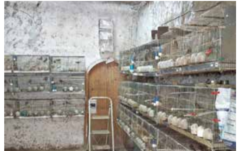
Els ocells trobats a una casa de Castellar del Vallès. || AGENTS RURALS

De les investigacions realitzades es desprèn que la procedència d'aquests animals és Andalusia, a través de diferents proveïdors que els capturen il·legalment del medi natural i per diferents mitjans els trans-