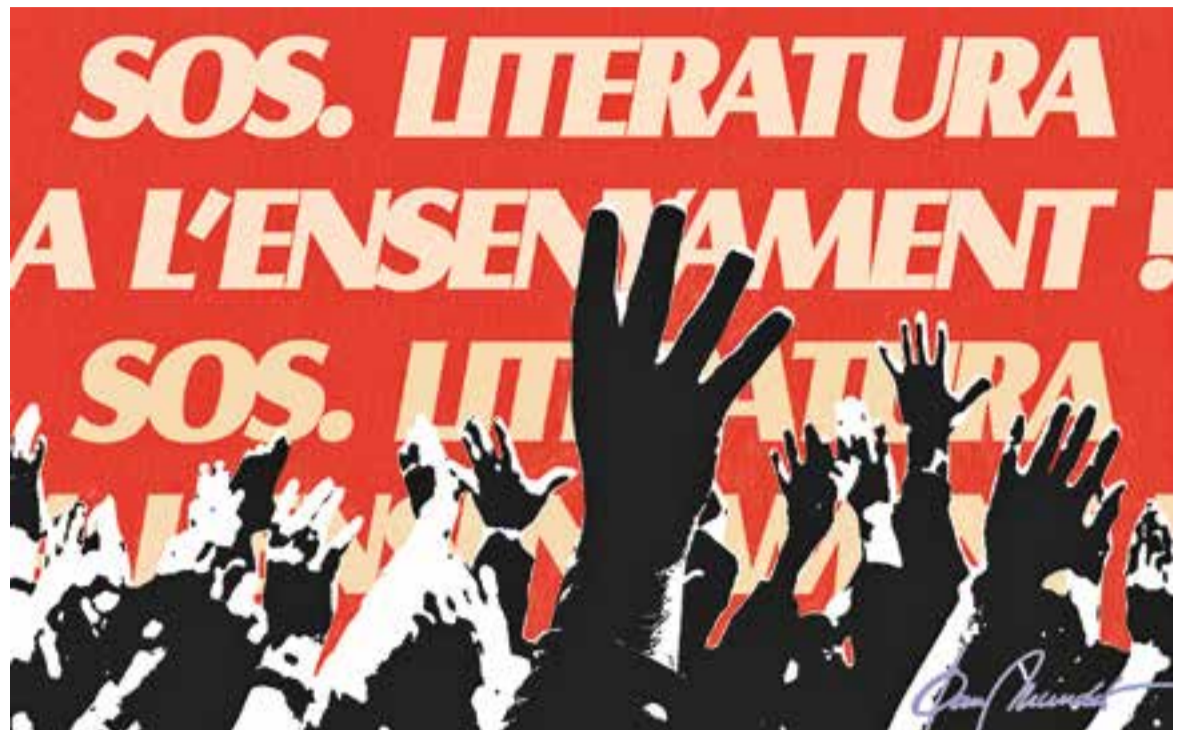
© SOS literatura. || JOAN MUNDET

El panorama descrit pot acabar provocant que un alumne del batxillerat actual arribi als estudis superiors sense conèixer la literatura del seu país. És possible que molts pro-