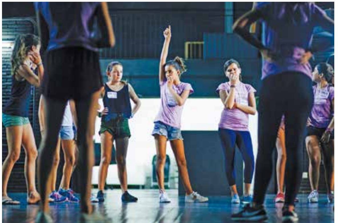
Les aspirants al càsting de dilluns a la tarda dalt de l'escenari de l'Auditori Municipal Miquel Pont

És el nombre de participants al càsting que fa Macedònia