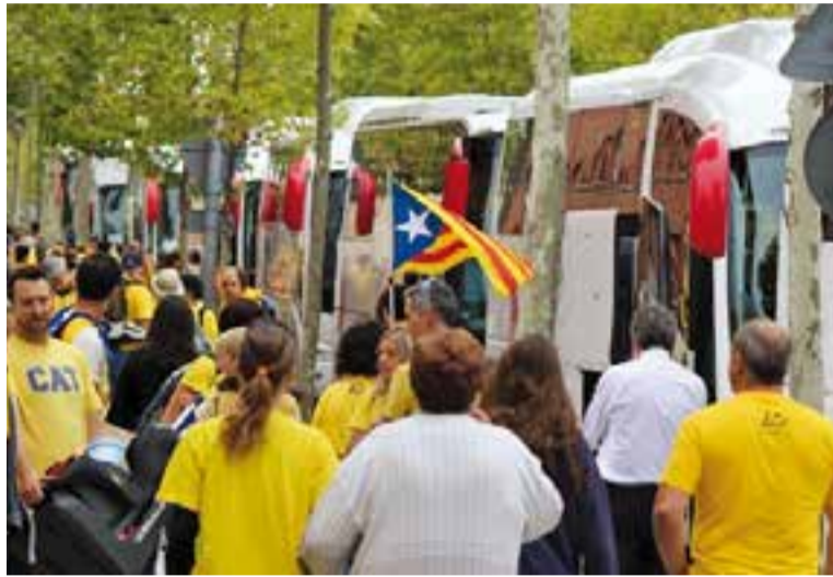
Autocars sortint de Castellar durant la diada del 2014.

Per acabar de culminar l'acció, un coet a cada ciutat anunciarà