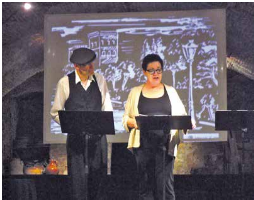
Imatge de la lectura escenificada de 'La fam' de TIC Escènic a l'Espai Foc de Sabadell.

L'espectacle inclou moments poètics, còmics, reflexions filosòfiques, és una lectura coral amb sorpreses que compta amb una escenografia acurada: "un telèfon, una màquina d'escriure antiga, una ràdio, un sofà, unes diapositives amb text que situa les escenes" ... a més, la música de la Billie Holiday, "amb temes del 1936 que ens transporten als ideals que aleshores s'anelaven aquí i que arribaven dels EEUU" . La funció tindrà lloc a la Sala de Petit Format, diumenge 2, a les 18.30 h i es podrà tornar a veure els dies 29 i 30 d'octubre. +