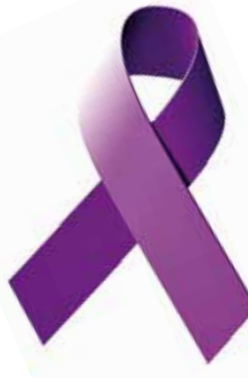
El llaç lila és el símbol que vol reclamar l'atenció sobre la malaltia d'Alzheimer.

Els tractaments actuals endarrerixen una mica l'evolució de la malaltia però segueixen sent poc efectius i a vegades presenten efectes secundaris que obliguen a retirar-los. En aquest sentit hi ha hagut poques novetats fins ara. Fa 14 anys que es va aprovar el darrer medicament pel tractament de l'Alzheimer i des d'aleshores res de res. A partir d'ara podem ser una mica més optimistes. Els experts valoren la descoberta com una de les més prometedores dels últims anys. Les noves línies d'investigació aniran cap a intentar evitar la formació d'aquests grumolls de proteïna amiloide en el cervell i que ara sabem que poden ser els responsables de la malaltia. Faltarà veure si aquest medicament és segur o dona problemes quan es facin els posteriors estudis de seguretat i tolerància. No sabem si aquest serà el fàrmac que acabi curant l'Alzheimer però està clar que per si sol suposa un canvi de direcció en la recerca de nous tractaments.