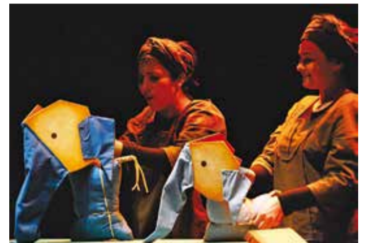
Moment de l'espectacle 'El petit elefant' del Centre de Titelles de Lleida.