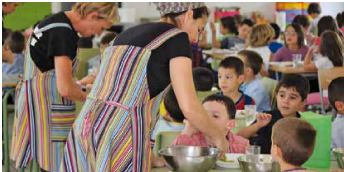
Menjador de l'escola Sant Esteve.

Són les que ha rebut el Consell Comarcal per a famílies castellarenques