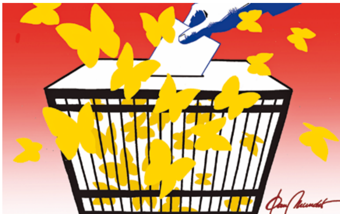
© Mariposas amarillas. || JOAN MUNDET