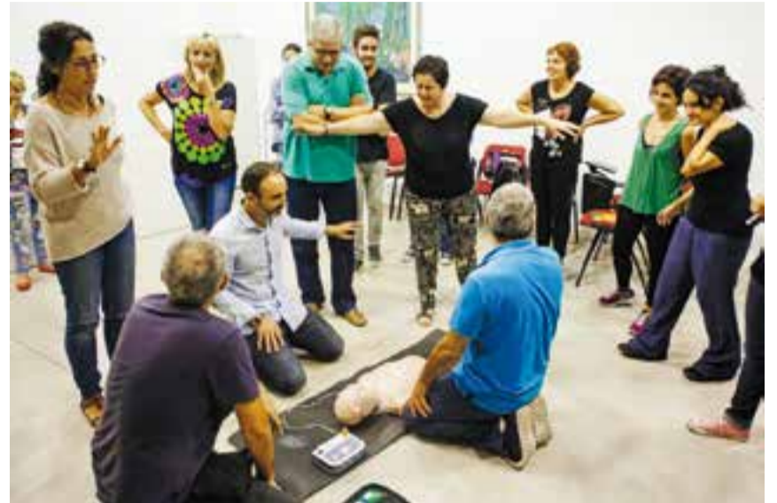
Assistents al taller d'autoprotecció, celebrat dissabte passat.

L'objectiu de la formació impartida dissabte era "saber com actuar davant d'una emergència, perquè de vegades