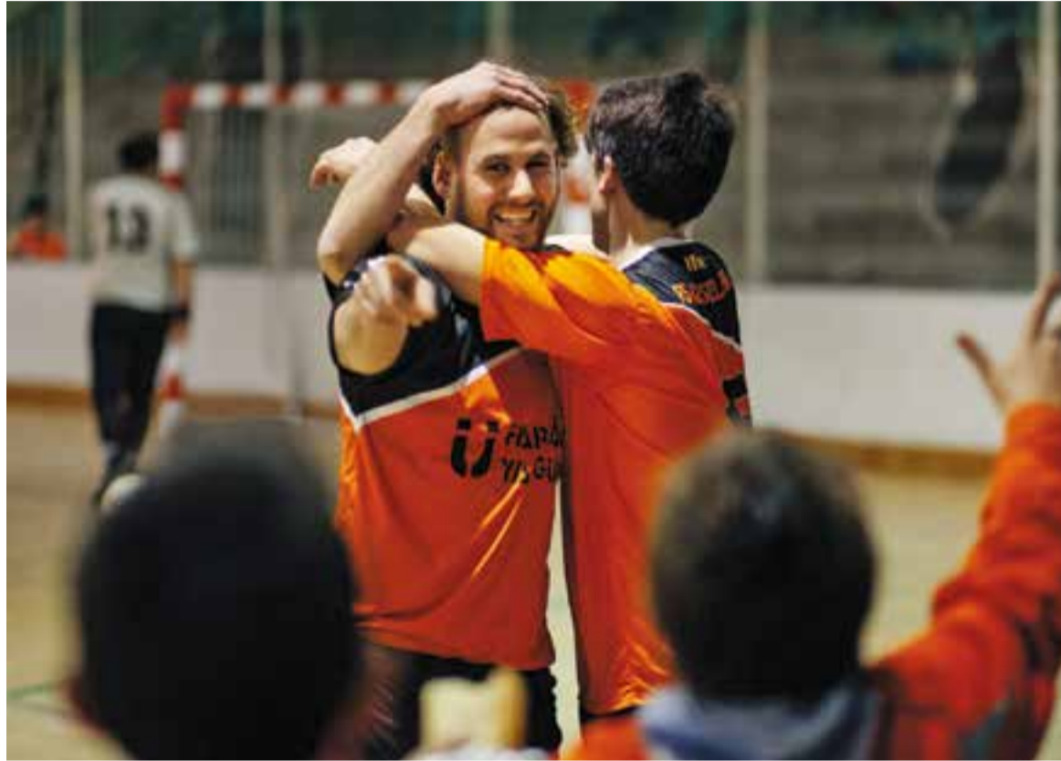
Contra l'Escola Pia va començar tot a la Copa Catalunya, on l'equip va eliminar cinc rivals de categoria superior.