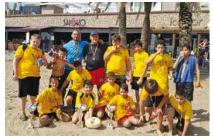
Els petits del club castellanca van debutar en Rugby-platja.

Per aquest motiu, el club castellanca, que entrena els dimarts i dijous a les pistes d'atletisme, ha decidit no cobrar quota mensual als menors que vulguin apropar-se a aquest esport durant aquesta nova temporada i ja ha obert el termini d'inscripció pel seu equip (per demanar informació els interessats ho poden fer a l'email infogossosrugby@gmail.com o per WhatsApp al numero de telèfon 640 203 713). +