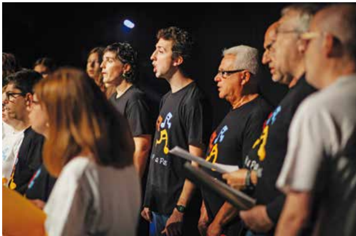
Membres de la coral Pas a Pas durant la seva actuació a l'Auditori.