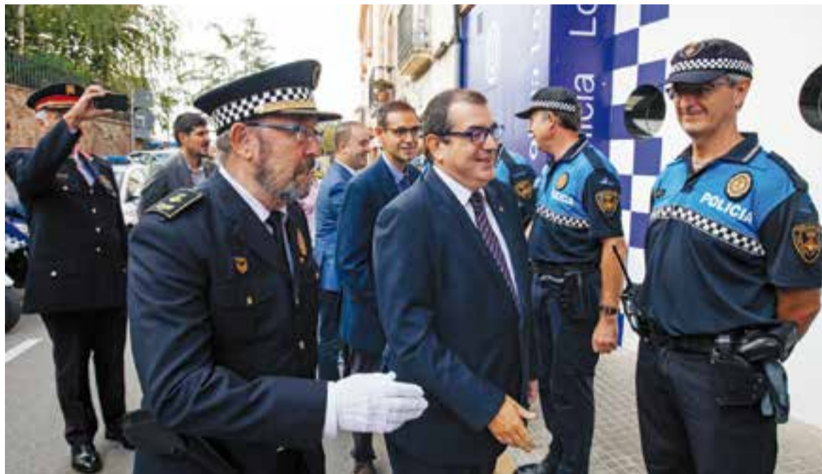
El conseller d'Interior, al centre, acompanyat del cap de la policia local, accedeix a les noves instal·lacions policials.

En el seu parlament, al pati de Cal Botafoc, el conseller Jané ha destacat la baixa taxa de delictes que registra Castellar del Vallès. "Si mireu el nombre de fets delinqüencials per cada 1.000 habitants, Castellar registra un dels més baixos