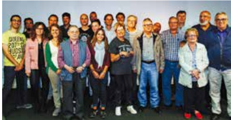
Professionals i col·laboradors de la ràdio en una imatge de la temporada passada.

L'equip de col·laboradors de la ràdio continua en plena forma omplint al franja dels vespres i els caps de setmana al matí. Programes històrics com Estils , Renaixença , La Carpeta de l'Avi o Ones de Crom compartiren graella amb propostes més joves com el programa de motor Peu al Ferro o el magazín jove Sense Escrípols . Com a principal novetat, la graella incorpora L'Iceberg , un nou espai cultural i de tendències la nit dels divendres. A més, tal com ja s'ha fet públic, l'emissora municipal ha establert una col·laboració amb el grup TEB, grup cooperatiu per a la inclusió laboral de persones amb discapacitats mentals, que farà un taller i un programa de la mà dels seus usuaris. +