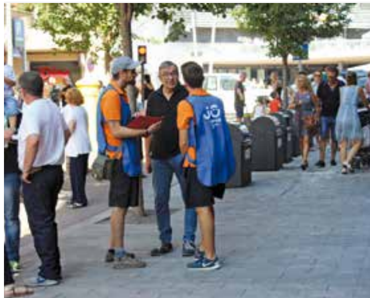
Dos enquestadors entrevisten un veí durant la Festa Major passada.

La neteja viària als trams dels carrers Sala Boadella i Montcada a obtingut una puntuació mitjana de 6,55. En concret, el 60,4% de les persones enquestades l'han puntuat amb notes d'entre 7 i 10, el 26% ha donat notes de 5 i 6 i el 13% restant ha valorat la neteja dels dos trams de vianants