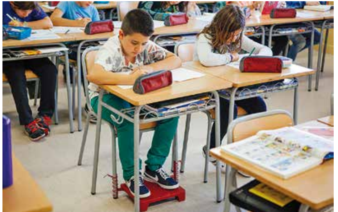
Un alumne de l'escola Joan Blanquer, en una imatge d'ahir dijous, amb l'alça 'Sit Up'.

En paral·lel, es va iniciar una investigació per a la creació d'un prototipus d'alça que solucionés el problema. El giny va ser patentat i cedit a Sala Puigverd fa tres anys, i a partir de llavors, amb la implicació d'una comissió del Consell Municipal Sociosanitari, amb representants de l'Ajuntament, l'ambulatori, les escoles i el Departament d'Ensenyament, entre d'altres, es va engegar una prova pilot a Castellar amb 86 aules escolars per avaluar-ne la utilitat. Tot i la valoració satisfactòria de la prova pilot "a nivell ètic i ergonòmic", es va seguir investigant per millorar el giny i fer-lo més lleuger.