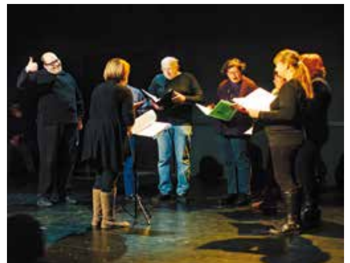
Un dels concerts de la coral Pas a Pas || Q. PASCUAL

En aquest sentit, s'ha programat una passejada en el bé que ens aporta l'Art (exposició de manualitats al Mirador), la cultura (lectura de poemes al Correllengua i al cinefòrum amb 'Corazón Gigante'), la música i la dansa (Festival SoM), l'esport (matinal esportiva amb karate i bàsquet i classe oberta de ioga al Pavelló Puigverd), i l'educació dels infants (l'Hora del Conte amb 'Fuig bèstia'). +|| M.A.