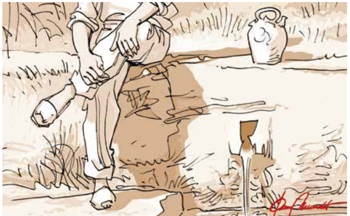
© El càntir d'en Companys. || JOAN MUNDET

i documentals i es realitzaren actes per tota la geografia catalana. Des de l'Arxiu d'Història de Castellar també ens vam voler sumar a aquestes activitats impulsant una recerca que culminà amb una exposició sobre la relació del president i la seva família amb Castellar del Vallès.