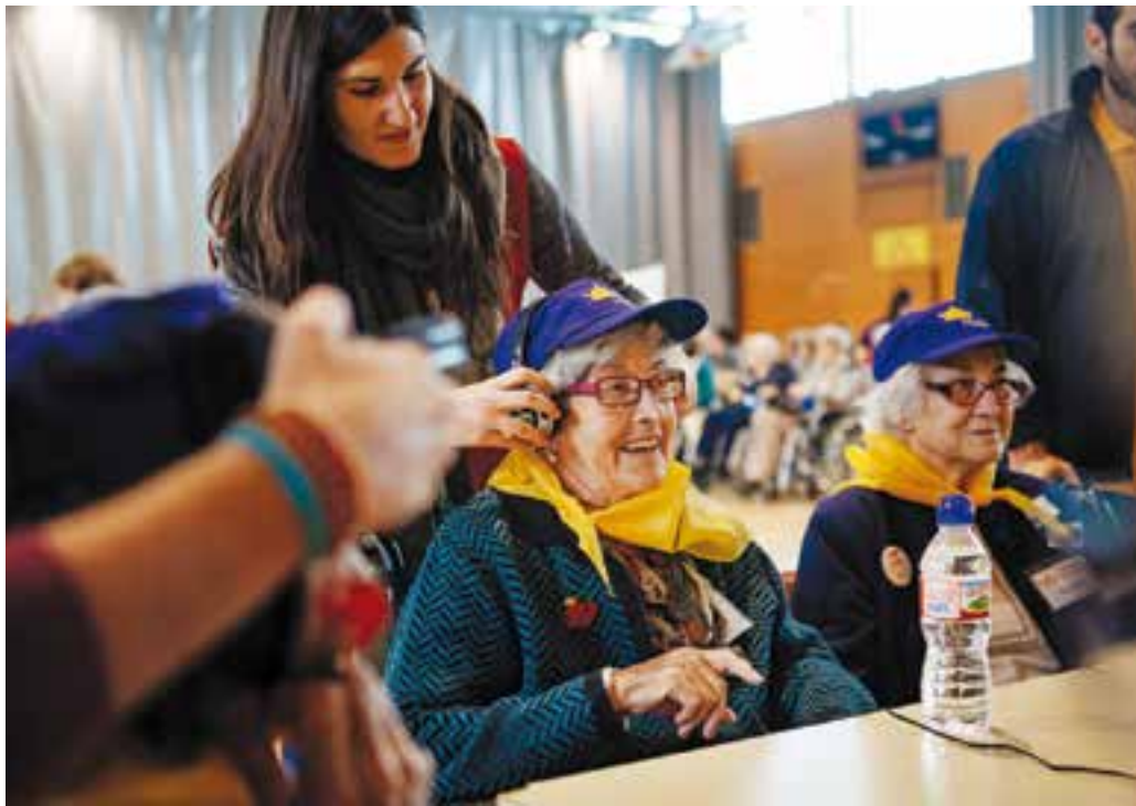
Unes de les participants a la prova d'audició de cançons.

La tercera edició de les Resiolimpíades es va celebrar diumenge passat al Pavelló Puigverd amb les cinc residències de la vila