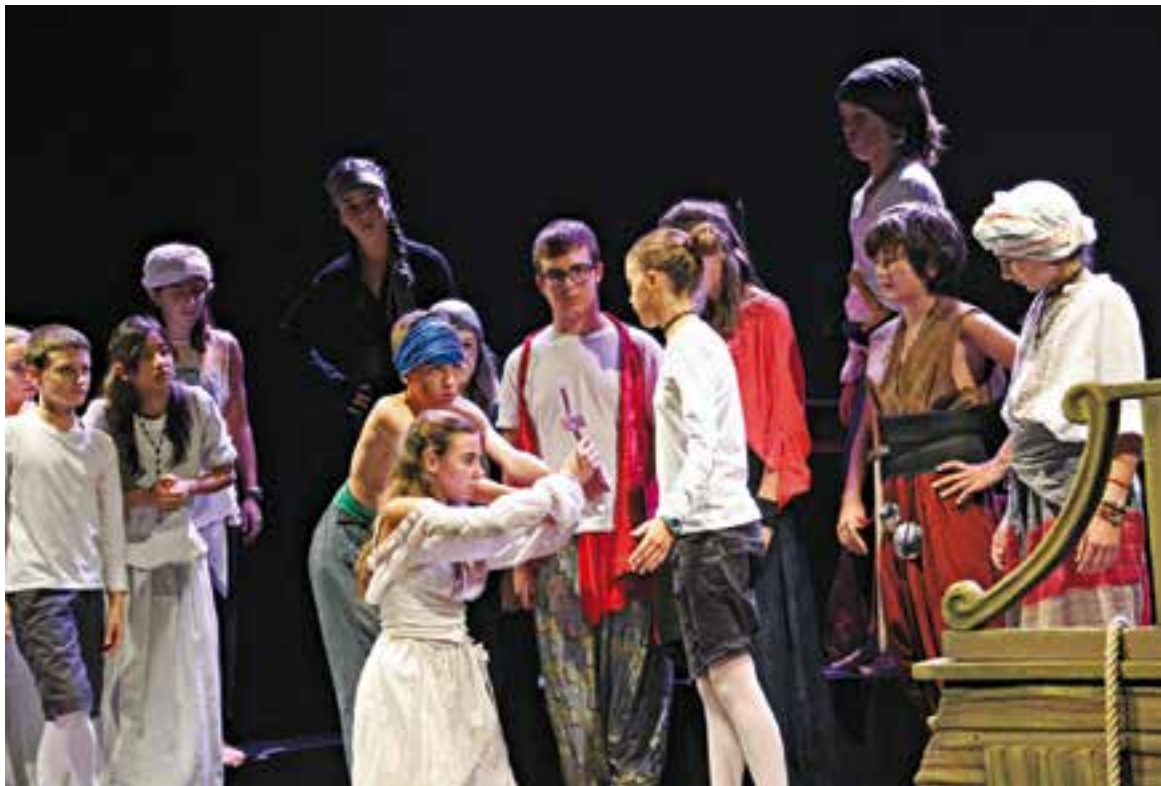
Moment de l'espectacle 'Mar i Cel' d'Espaiart. || M. MORILLO

El muntatge, una producció d'Espaiart, va ser molt aplaudit