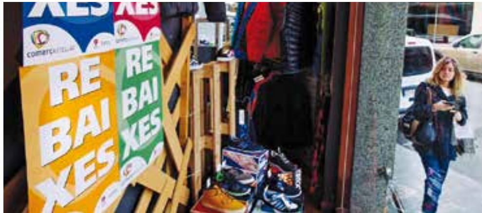
Imatge d'un aparador d'una botiga d'esports de Castellar del Vallès.

Es tracta d'una proposta que s'està impulsant des d'una comissió vinculada a l'associació i que, des d'abans de l'estiu, ha anat treballant per buscar el sistema que més s'avinqui a les necessitats de Castellar. Ara, ja té clar la plataforma que utilitzarà per poder fer la instal·lació d'aquest sistema i, per aquest motiu, posarà en marxa la contractació d'un comercial que visiti tots els establiments de la vila, perquè coneguin el projecte de prop i puguin descobrir els avantatges i funcionalitats que pot aportar als comerços que s'hi adhereixin, així com les gratificacions als clients que s'hi registrin.