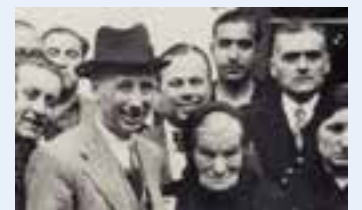
Companys a Castellar.

Aquest dissabte, Castellar es suma als municipis que homenatgen la figura de Lluís Companys, afussellat el 15 d'octubre al castell de Montjuïc. En concret, i com ja és tradició, es farà una Marxa de Torxes i una ofrena floral: des de les 19.30 a la plaça del Mercat es farà la venda i repartiment de torxes i clavells per iniciar la marxa a les 20 hores fins arribar a la plaça Lluís Companys. A les 20.30 hores s'ha programat una actuació de Lluís Tarruell, una lectura de textos i una ofrena floral. La Comissió organitzadora de l'homenatge està formada per CAL, ERC, Decidim, Som de Castellar, En Comú Podem i PDECat. + || REDACCIÓ