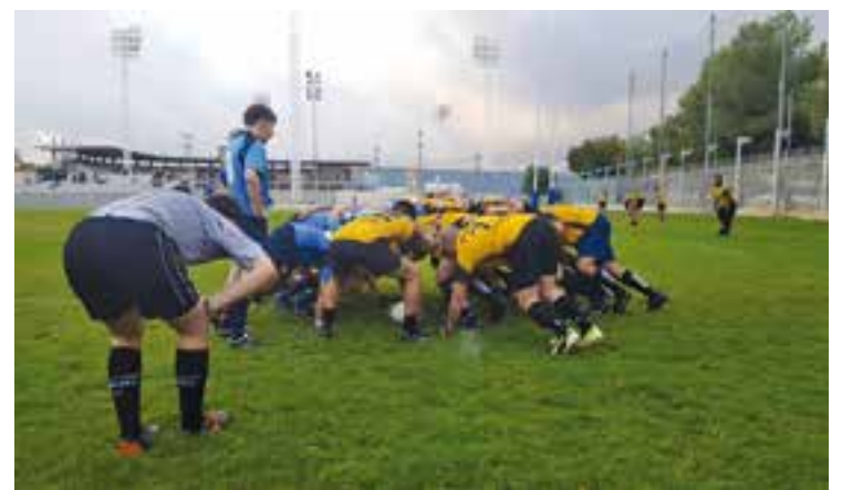
Imatge del partit a L'Hospitalet del combinat Anoia-Castellar.

Recentment, el Rugby Club Castellar va arribar a un acord amb l'Anoia RC per jugar els partits conjuntament i reforçar-se de maneta mútua. Fruit d'aquesta unió els castellarencs deixen el 'Rugby League' de tretze jugadors per tornar a la versió 'Union' de 15, a causa de la falta d'efectius i per problemes amb els desplaçaments de la lliga de 13, on eren l'únic equip de tota Catalunya inscrit en competició. Gràcies a aquesta unió, els de Castellar van debutar a la lliga de Primera Divisió absoluta aquest dissabte a les 18.00 h, caient de manera contundent per 63-0 contra el RC L'Hospitalet, un dels clàssics de la categoria i que no va donar cap opció.