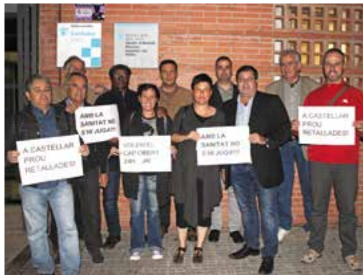
Membres d'En Comú Podem i de CSQP manifestant el seu rebuig a l'esmena.