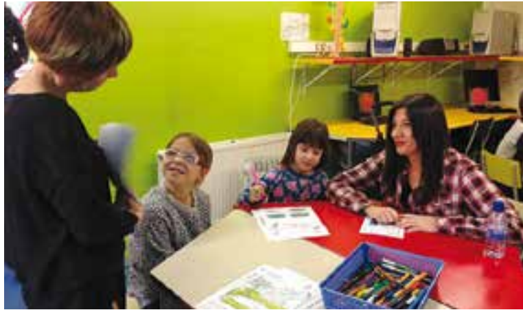
Imatge d'arxiu d'una activitat d'anglès a la ludoteca municipal.

Una altra de les novetats del pla d'actuació per millorar l'ús de l'anglès