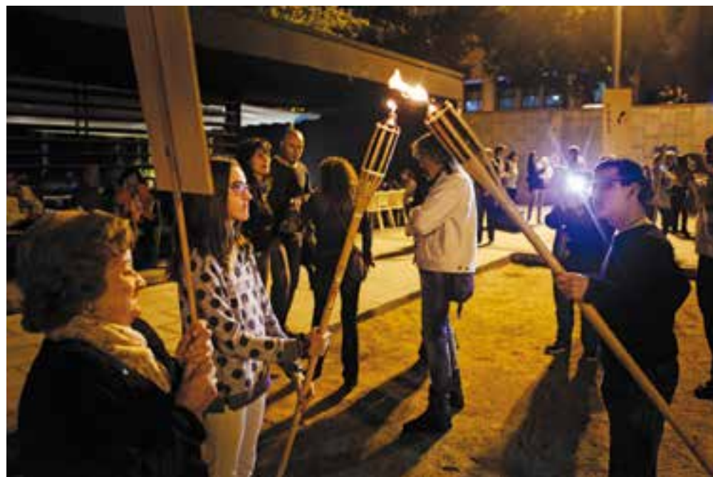
Moment de l'encesa dels quatre punts cardinals de la flama del Correllengua.