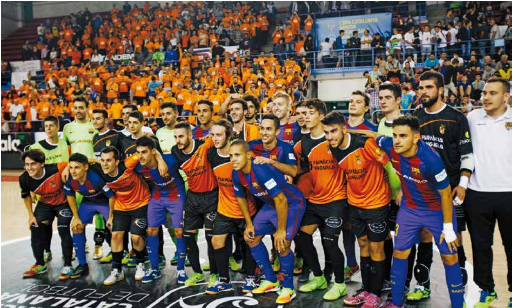
Foto final dels jugadors de FS Farmàcia Yangüela Castellàr amb els del FC Barcelona després del partit al pavelló Nou Congost de Manresa.

El FS Castellar va cobrar-se el premi de jugar semifinals de la Copa Catalunya 2016 contra el Barça tot i perdre (0-11)