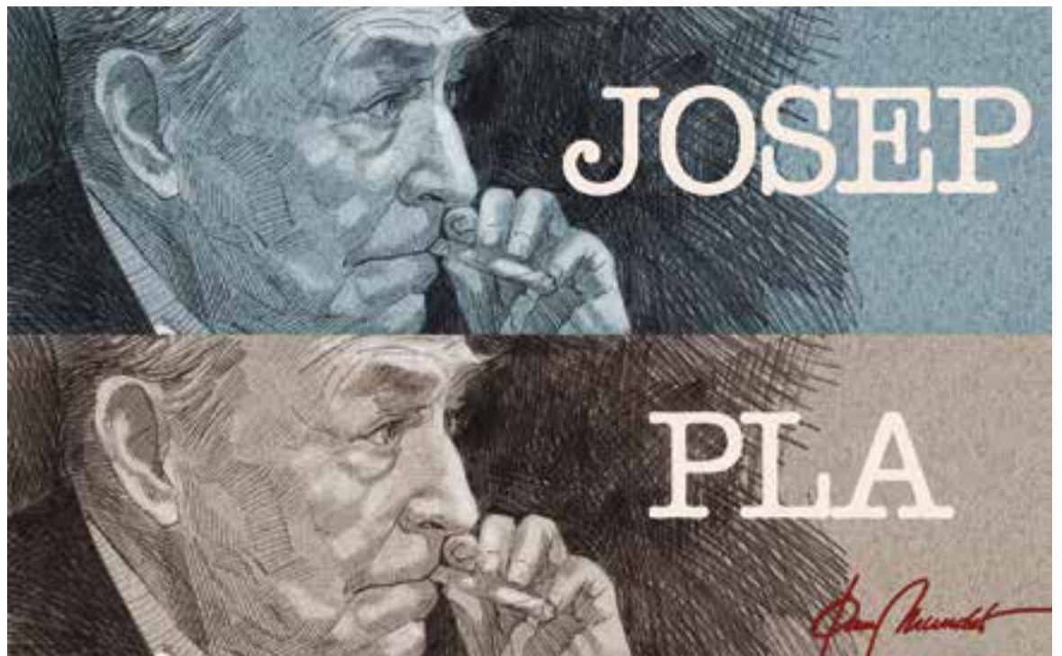
© Josep Pla. || JOAN MUNDET

lectura d'aquesta obra. I res més lluny de la realitat. Comprí l'edició a càrrec de Narcís Garolera, que sense les errades de transcripció de les edicions prèvies és la més fidel al text que va escriure el de Palafrugell. Pla s'ha de llegir; de tant en tant torno a ell. L'obro per qualsevol de les seves més de set-centes pàgines i tot torna a ser a lloc. Un vàlium literari que et guarda de la marejada del teu dia a dia per transportar-te a la sorra d'una platja empordanesa i deixar-te assegut allà, absort