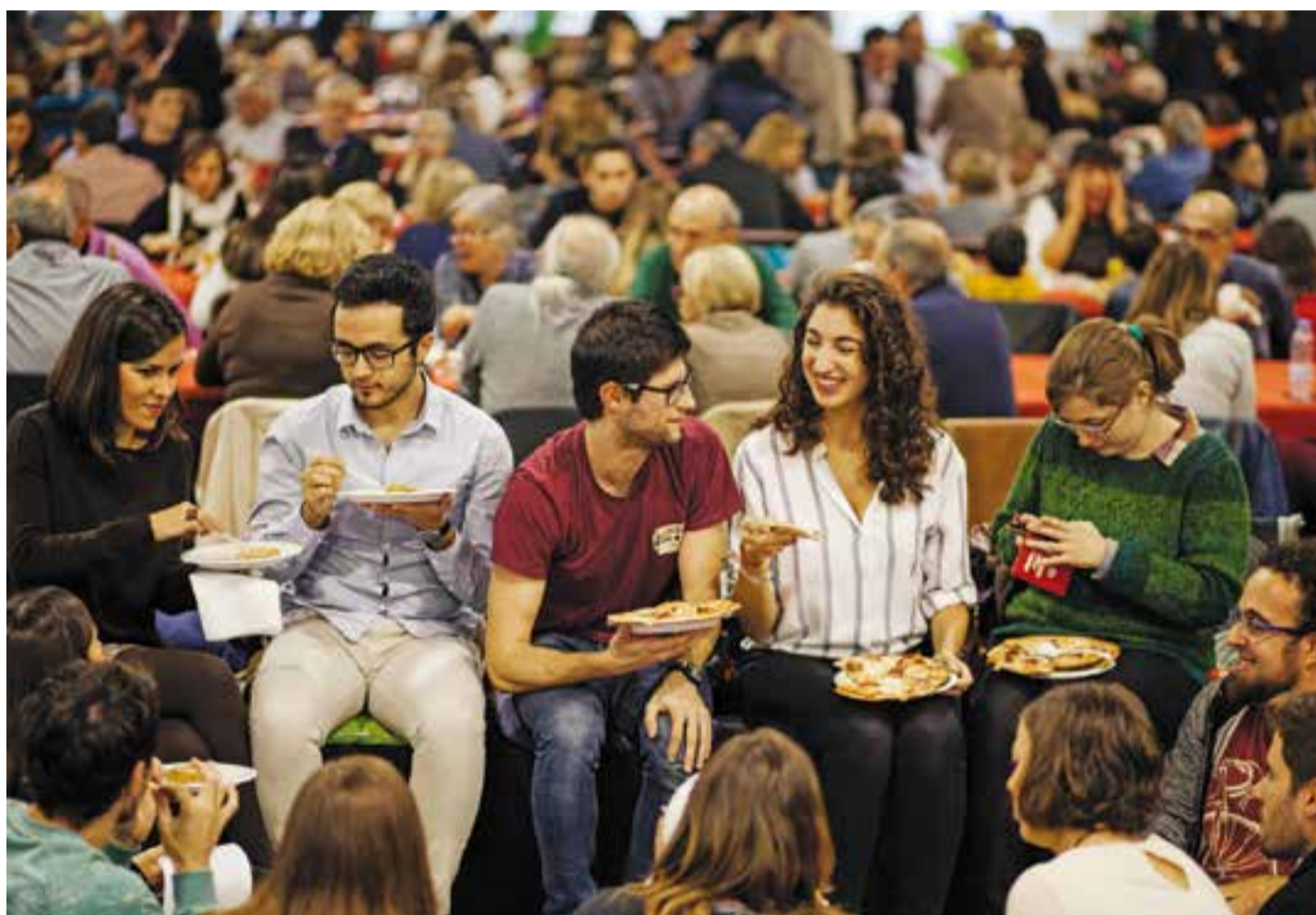
Aquest era l'ambient que hi havia dissabte passat a l'espai de degustació de la Mostra Gastronòmica, a l'Espai Tolrà.

Nora Navas porta 'Dansa d'Agost' aquest dissabte a l'Auditori Municipal de Castellar