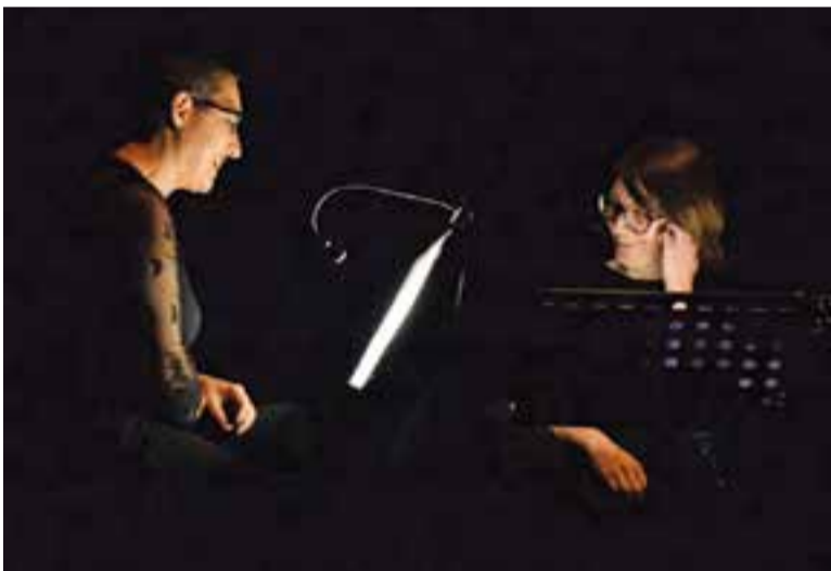
Moment de la reproducció de l'entrevista entre Roig i Capmany.

Els textos es van combinar també amb la reproducció de les dues actrius d'una entrevista real entre Montserrat Roig i Capmany al programa Personatges a Televisió Espanyola. D'aquesta manera, el muntatge va unir i acostar les dues facetes d'aquestes dones, la d'escriptores i la d'amigues. La poca il·luminació a escena i l'ús d'un faristol i un llum de lectura per a cadascuna d'elles, que s'anava engegant o apagant segons quan llegia cada una, feia més intens el moment i les paraules que se'n desprenien. Fins i tot, es van utilitzar fragments de so, imatge i vídeo reals de Roig i Capmany. Un recurs per apropar encara més les dues artistes i que va ajudar, d'alguna manera, a identificar-les més dalt l'escenari i de reconèixer-les mitjançant les veus de les dues actrius. †