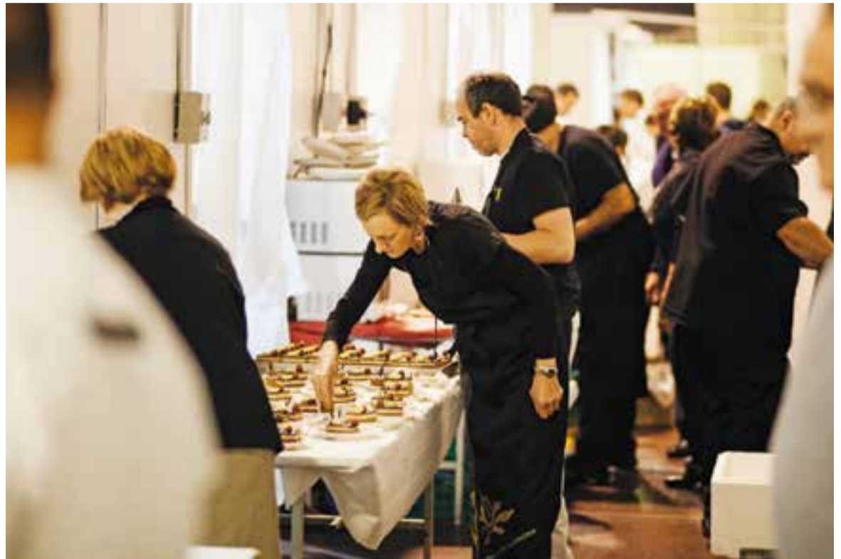
Els diferents restauradors ultimant els seus plats abans de servir-los als seus estands.

Són les que van servir els 7 restaurants, 3 pastisseries i els 4 establiments de la Mostra