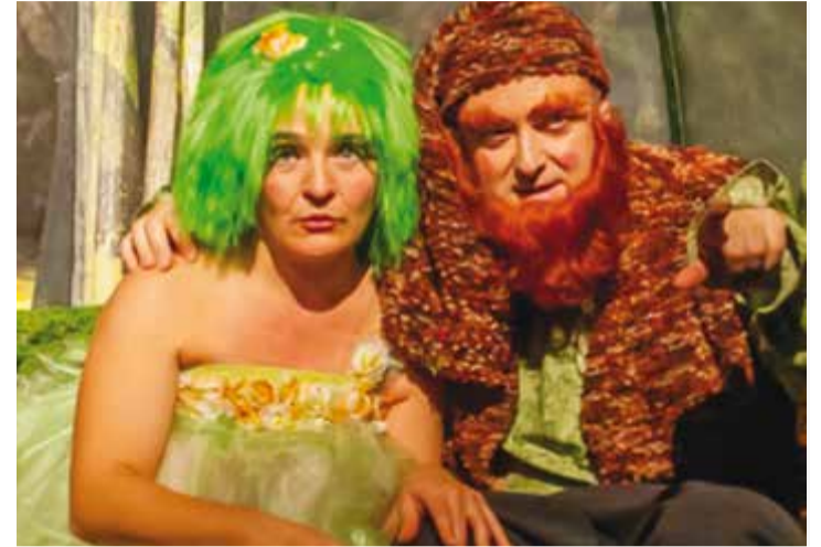
'Fades i follets', de la Cia. Patawa.