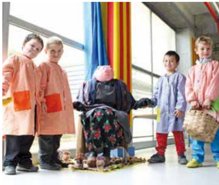
A l'esquerra, el túnel del terror per Halloween. A la dreta, la celebració de la Castanyada a l'escola Joan Blanquer, l'any 2015.