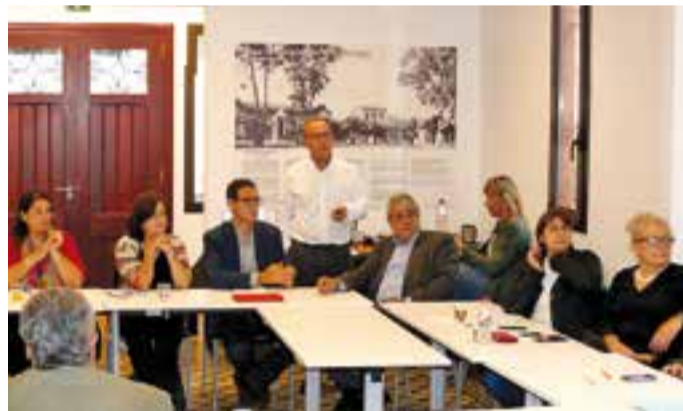
Un moment de la reunió amb alcaldes i regidors.

La direcció del Parc Taulí i els alcaldes i regidors assistents van debatre al voltant de les qüestions tractades i es van emplaçar a una propera reunió per conèixer la situació actual en els àmbits de salut mental i inversions, que van quedar pendents d'abordar. + || REDACCIÓ