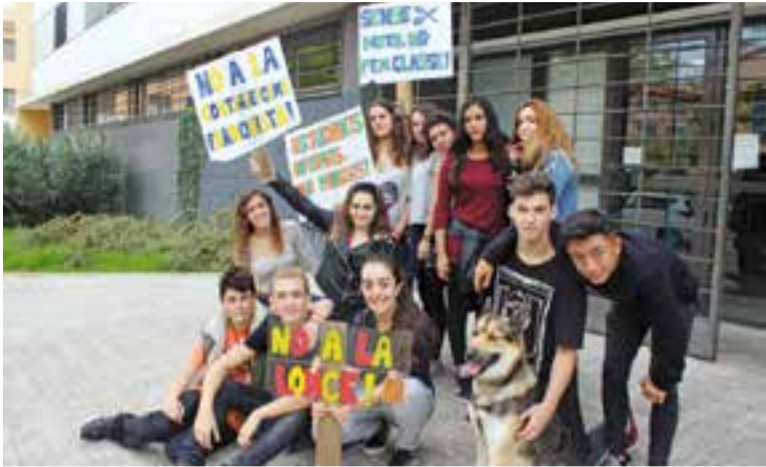
Els alumnes davant de l'Institut Puig de la Creu amb les pancartes.