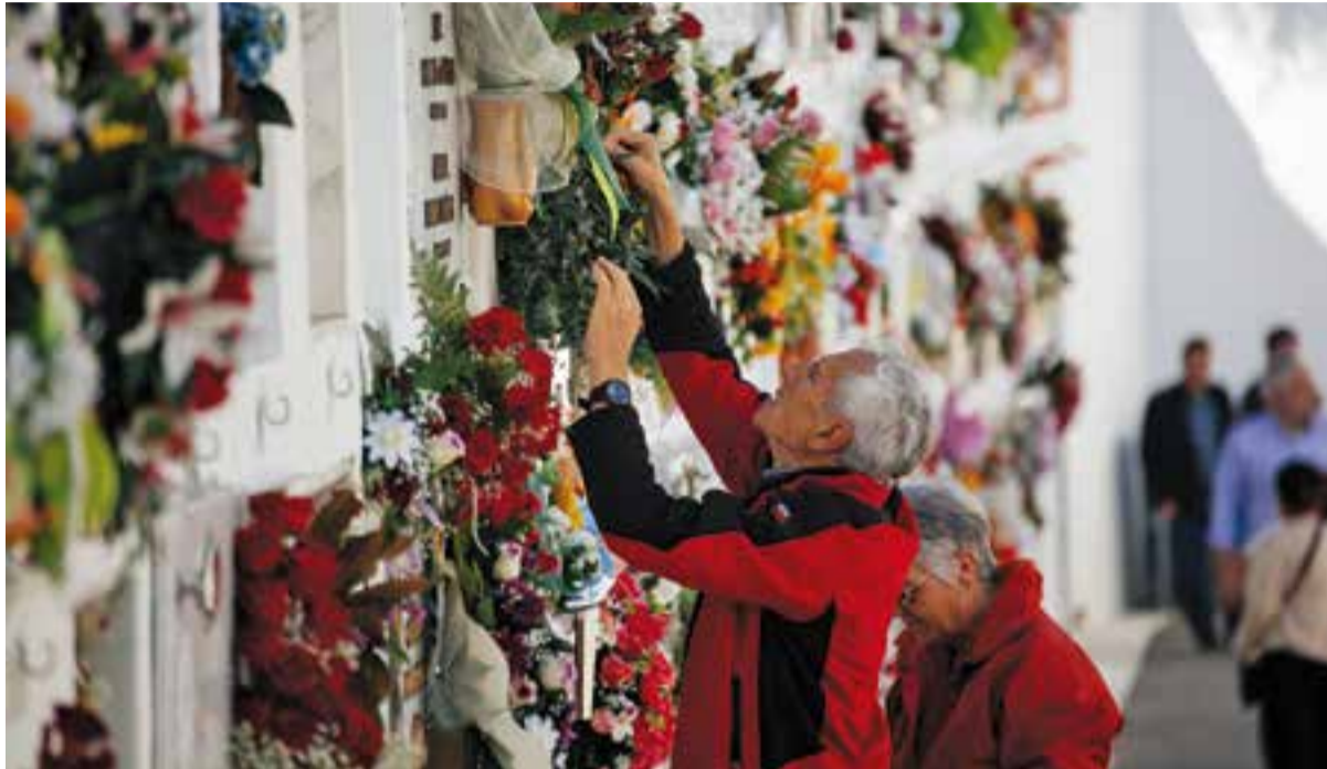
Una parella visitant un difunt al cementiri de Castellà durant la festivitat de Tots Sants de l'any passat.