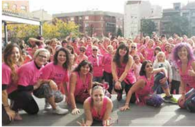
Unes 200 persones es van trobar a la plaça d'El Mirador per practicar zumba.

Per la recaptació, també estan molt contents. "Amb la venda de samarretes, ulleres i les dona-