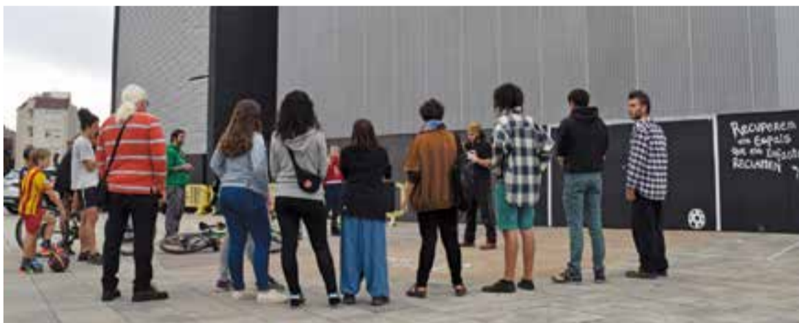
L'acte de l'Assemblea Llibertària de Castellar per reivindicar la porteria a la plaça Major es va fer el diumenge passat. || A. PARERA