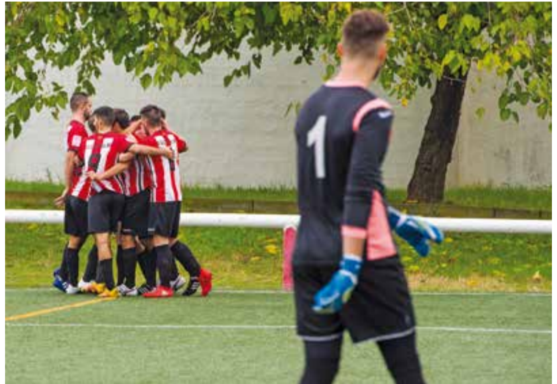
Els jugadors de la UE Castellar celebren el segon gol, sota l'atenta mirada del porter de Les Franqueses.

L'equip mostrava una cara diferent de la primera part, ensenyant que pot ser letal en atac, però que sap patir en