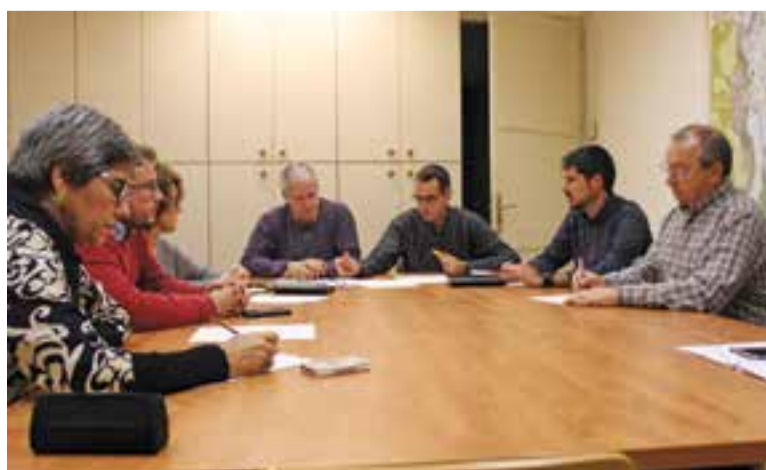
L'alcalde amb regidors del govern, de l'oposició i tècnics municipals.

Al gener es crearà una comissió de caire temporal que estudiarà la viabilitat