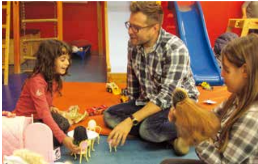
'Let's play', activitat de la Ludoteca en què nens i nenes poden aprendre anglès. || LUDOTECA

La Ludoteca va iniciar dijous passat la proposta 'Let's play', una activitat en què els nens i nenes poden aprendre la llengua anglesa de forma divertida, principalment a través del joc, per tal de potenciar l'expressió oral en un ambient distès. Les sessions es duen a terme tres cops al mes: d'una banda,