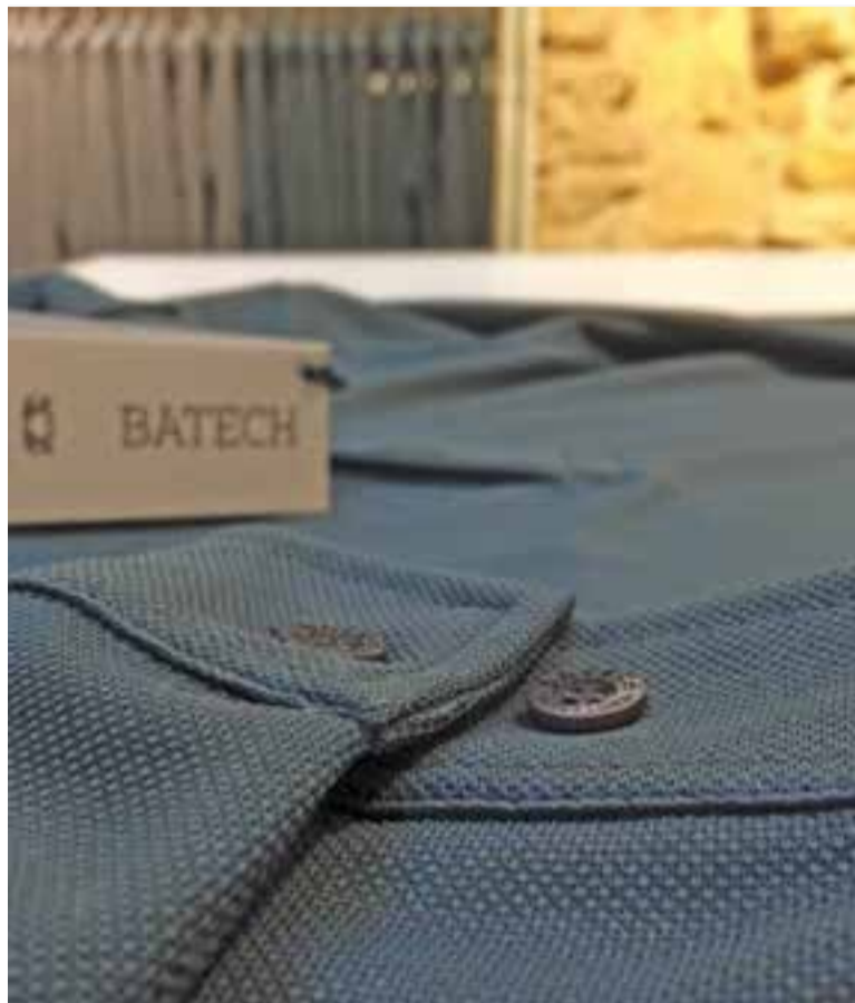
Un polo Batech de màniga llarga a la botiga de Tarragona.

La marca castellarenca Batech va inaugurar el 18 de març la seva primera botiga física a Catalunya, en concret al carrer Major de Tarragona. Gairebé vuit mesos després, l'experiència es pot dir que ha estat totalment positiva. "En aquest temps, ens han entrat més de 40 nacionalitats diferents a l'establiment però també ve a comprar molta gent catalana que ve a passar un dia a Tarragona", expliquen. +