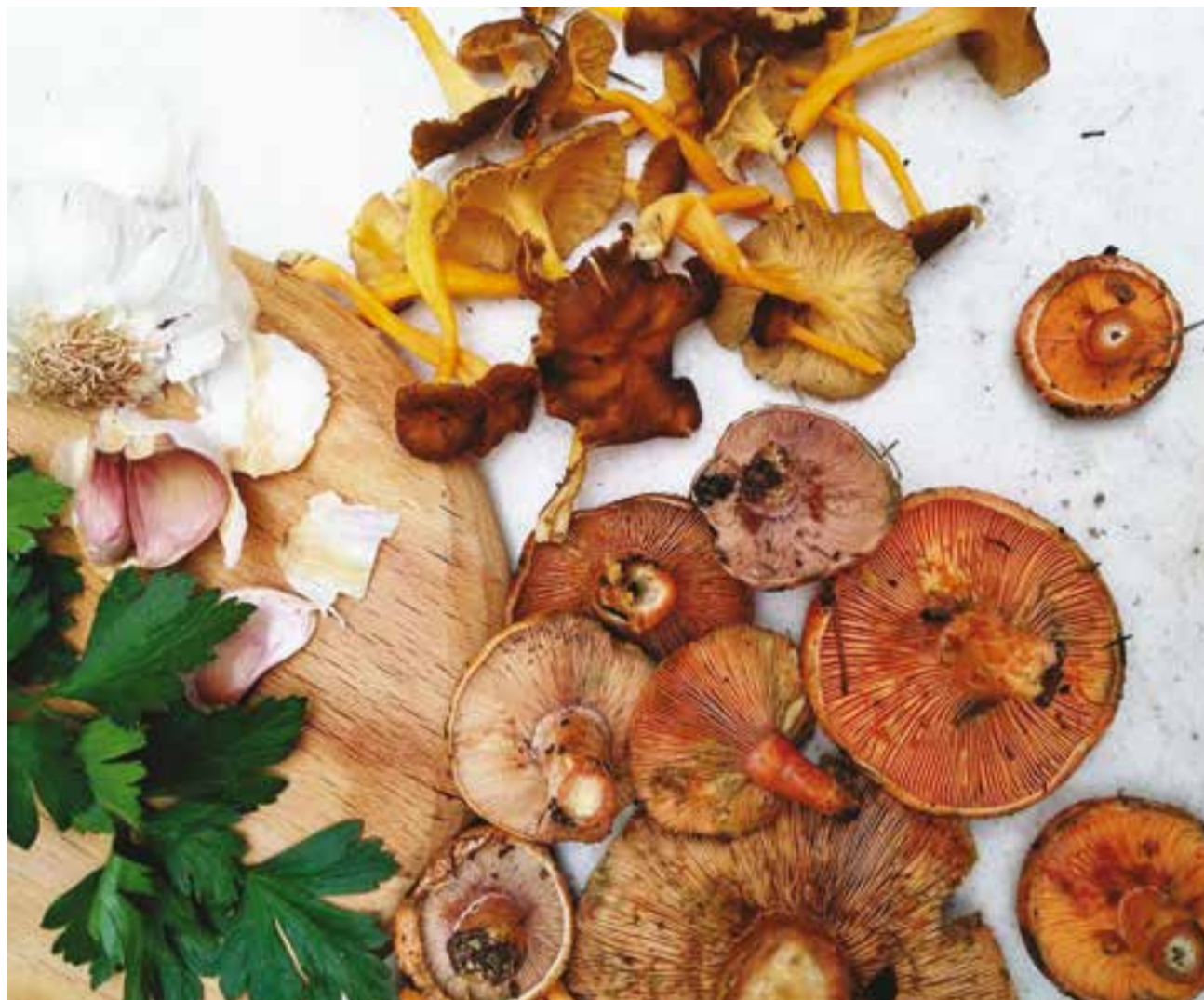
Una mostra dels bolets que es van trobar el cap de setmana passat pels volts de Sant Feliu del Racó. || HELENA DEU

Quan parlem d'espècies de bolets, els més trobats als voltants de Castellar del Vallès són els fredolics, la llenega negra i la blanca, els carlets, els rovellons i els camagroc. "A la nostra zona s'ha perdut, per exemple, la mota de moixerons, un bolet boníssim que sortia dels primers i d'aspecte semblant a una coliflor. Es feia als camins on hi havien passat tractors o màquines excavadores, era un bolet molt apreciat" , diu Guasch. "Fa 20 anys, quan els boscos estaven bé i el clima era bo, podíem trobar també peu de rata, que és molt apreciat, i l'ou de reig, excel-