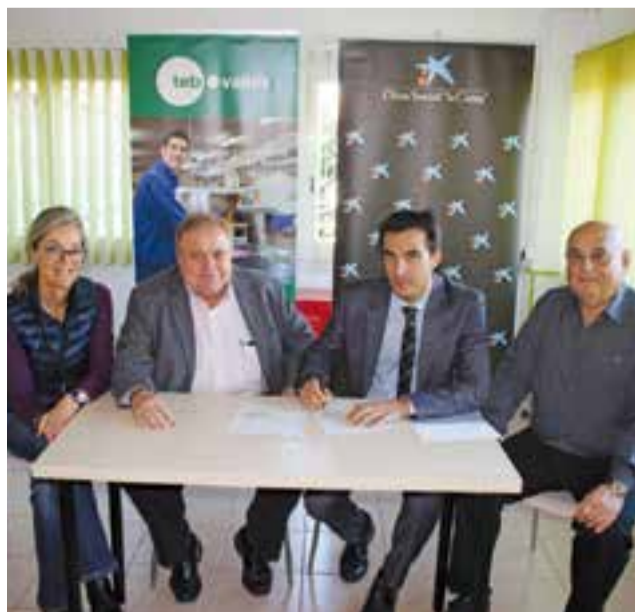
Signatura del conveni a la seu del TEB Vallès.

En Fidel recorda que abans hi havia molta competència entre els "caçadors" de bolets. "Et parlo de 30 anys enrere, quan el meu pare em va ensenyar els llocs secrets. No els desvetllaré, però sí que puc dir que els bolets es fan on al matí hi toca el sol, que és com una calefacció pel terra. Per tant, el Puig de la Creu és un bon lloc, sobretot per la banda de Sentmenat. Pels voltants de Sant Feliu del Racó, també solen haver molts bolets" . +