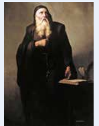
Ramon Llull.