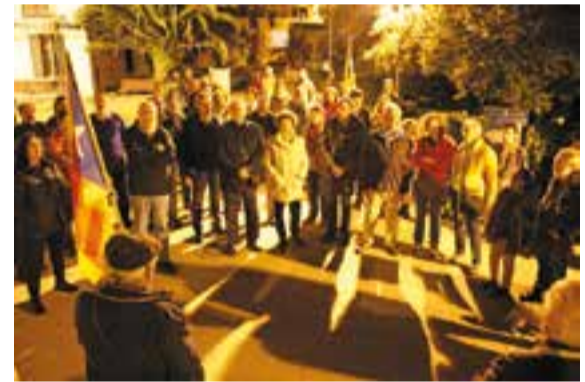
Concentració de suport a l'alcalde de Berga, divendres passat. || R.GÓMEZ

D'altra banda, divendres passat va desaparèixer la bandera espanyola dels jardins del Palau Tolrà, que va ser reemplaçada per una estelada. L'endemà, la bandera espanyola va ser restituïda. Segons ha pogut saber L'Actual, es tractava d'una iniciativa duta a terme per un veí de la vila, a títol personal, sense el consentiment del consistori. + || R.G.