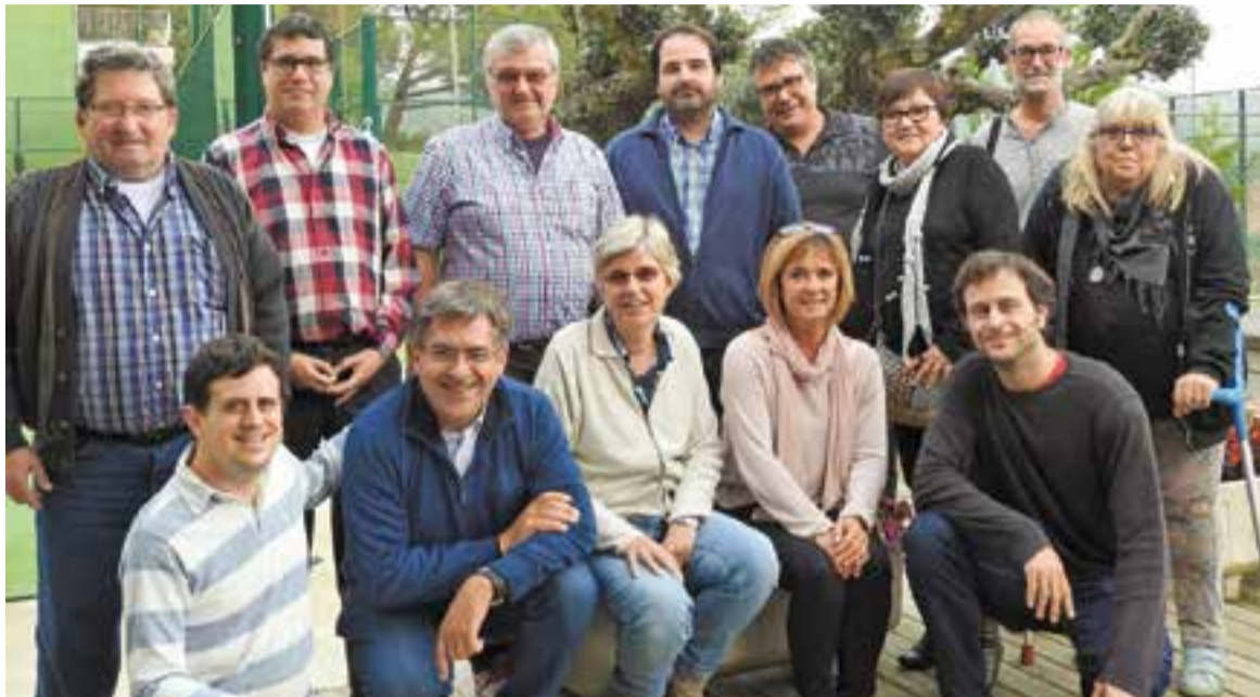
Membres de la Coordinadora de Pessebres de Catalunya.