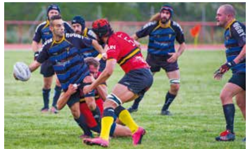
Instantània del partit entre els Gossos i els Carboners de Terrassa. || A. SAN ANDRÉS

La novetat del combinat va notar la falta de ritme i de compenetració entre els jugadors, a banda d'enfrontar-se a un dels equips cridats a jugar aquesta temporada a la primera divisió. Els terrassencs no van donar opció des de bon començament anotant cinc assaigs a la primera part del partit i marcant tres conversions (28-0). A la segona part, amb el local Arturo Cuesta substituït per lesió,