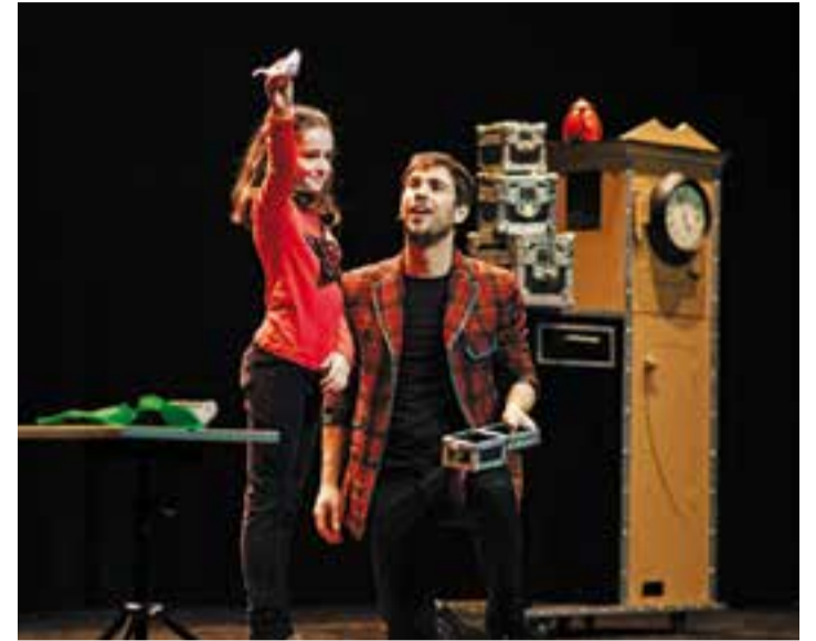
Un moment de l'actuació del mag dalt de l'escenari de l'Auditori.