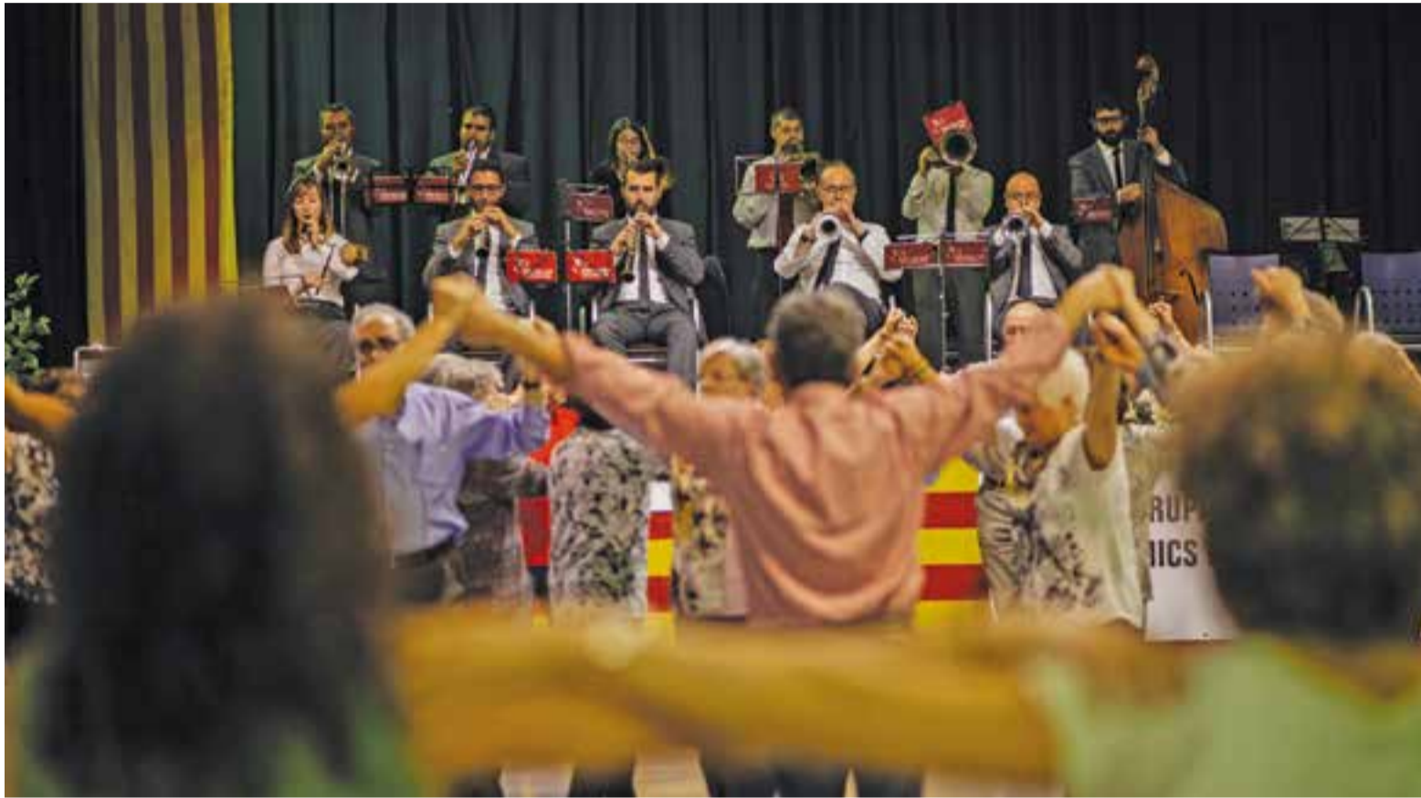
40a Diada Sardanista de l'ASAC a la Sala Blava de l'Espai Tolrà, dissabte 5 de novembre.

L'Agrupació Sardanista castellarenca valora positivament l'assistència, amb 250 balladors