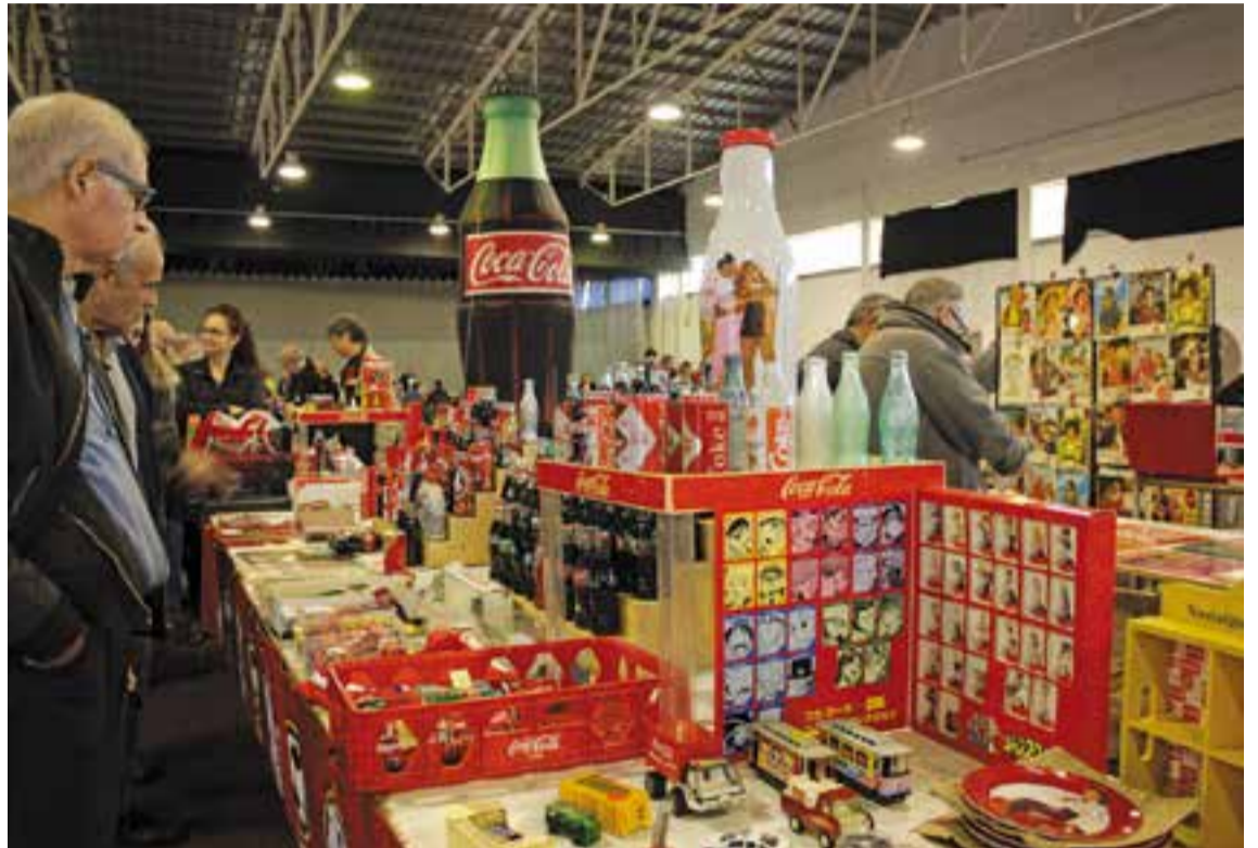
Trobada de col·leccionistes de la Coca-Cola a Castellar, any 2015.

A més, la Coca-Cola ha preparat obsequis i regals per als visitants que participin a la trobada a Castellar. D'altra banda, "la marca posa a la nostra disposició un equip de persones que són de publicitat, munten uns arcs inflables i ens cedeixen una ampolla i una llau-na gegants", diu Martínez, que afegeix que d'aquesta manera s'anima la trobada.