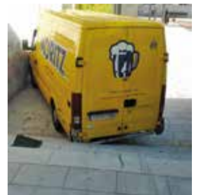
La furgoneta encastada.

Ensurat a la plaça Calissó. Divendres passat, sobre les tres de la tarda, una furgoneta es va precipitar per les escales situades a la part alta de la plaça just al costat del bar Calissó. Per raons que es desconeixen, el vehicle va caure per les escales i es va encastar contra el mur. Algunes fonts apunten que el conductor no era dins del vehicle. Sortosament ningú va prendre mal ja que es tracta d'una zona de pas molt concorreguda. + || REDACCIÓ