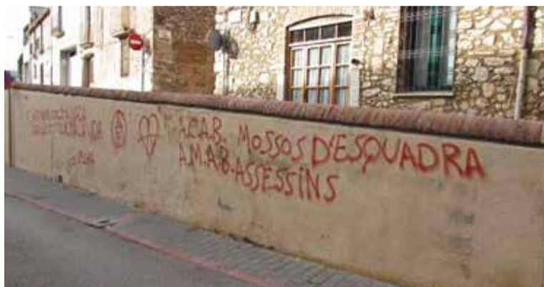
Pintades aparegudes a la parròquia de Sant Esteve i al carrer Sant Miquel.

Els treballs d'eliminació de pintades es faran de forma compartida entre la Brigada Municipal (que assumirà les tasques de repintat) i l'empresa concessionària del servei de neteja viària i recollida d'escombraries (que utilitzarà el vehicle hidronetejador quan sigui necessari). En aquesta campanya, s'actuarà especialment de forma intensiva "en els punts de major concentració de grafitis, com són les places de Catalunya, del Calissó i Major" , ha detallat Leiva.