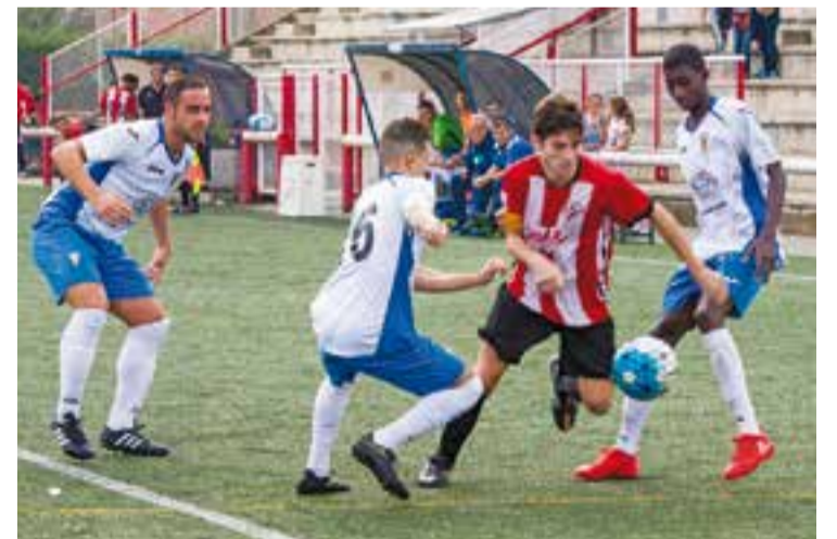
La UE Castellar no va poder sumar els tres punts al camp del Molletense.