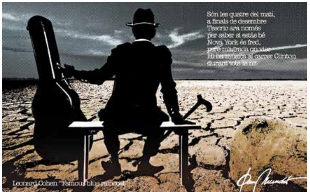
© Bon viatge. || JOAN MUNDET

de veritat al límit entre la dignitat i la bellesa. Som la distància que ha posat entre cada moment que porta a vostè. Senyor L. Cohen la seva veu cavernosa ens ha calat fins als ossos i ni tan sols esperàvem que plugués. Sembla que faci molt de temps , però segueix atrapat en les notes desordenades de l'harmonica d'aquell home sense màscara que conservo dins d'alguna caixa. Forma part del paisatge de tots els meus viatges i de la veu adolescent de la meua inexperiència. Sis acords secrets i senzills en els llocs on acostumava a jugar , que ara omplen el dia a dia dels companys de feina i els records de familiars i amics. A casa, amb més sentiment que veu, seguim ballant a Viena com si fos la primera vegada i la seva veu daurada continua allunyant les ombres d'aquelles nits de bressol de la meua filla. Senyor L. Cohen no podré oblidar, encara que algun dia no ho recordi , la seva