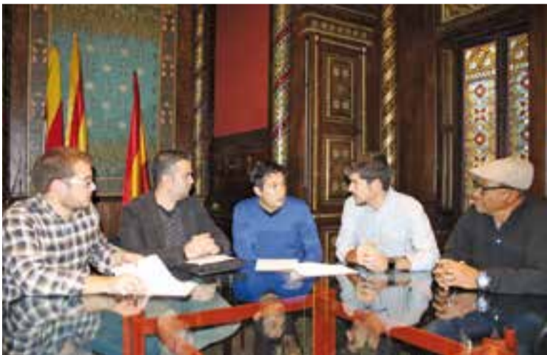
Els regidors de Som de Castellar-PSC amb representants d'En Comú Podem.