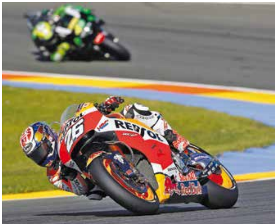
Dani Pedrosa al circuit Ricardo Tormo de Xest, moments abans de la caiguda.