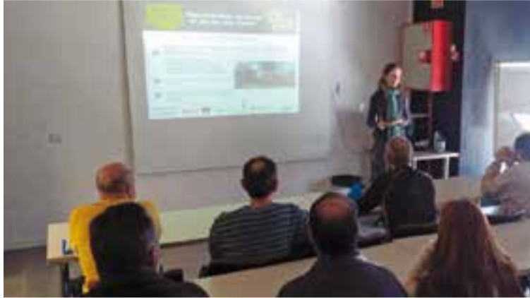
A la sessió informativa hi va assistir una vintena de persones.

Una vintena de persones van assistir, divendres al matí, a una sessió informativa sobre el projecte MetallVallès que es va dur a terme al Servei Local d'Ocupació, ubicat a l'Espai Tolrà. La sessió, organitzada per l'Ajuntament, és una de les propostes adreçades a la població amb l'objectiu de donar a conèixer les possibilitats laborals que ofereix el sector del metall.