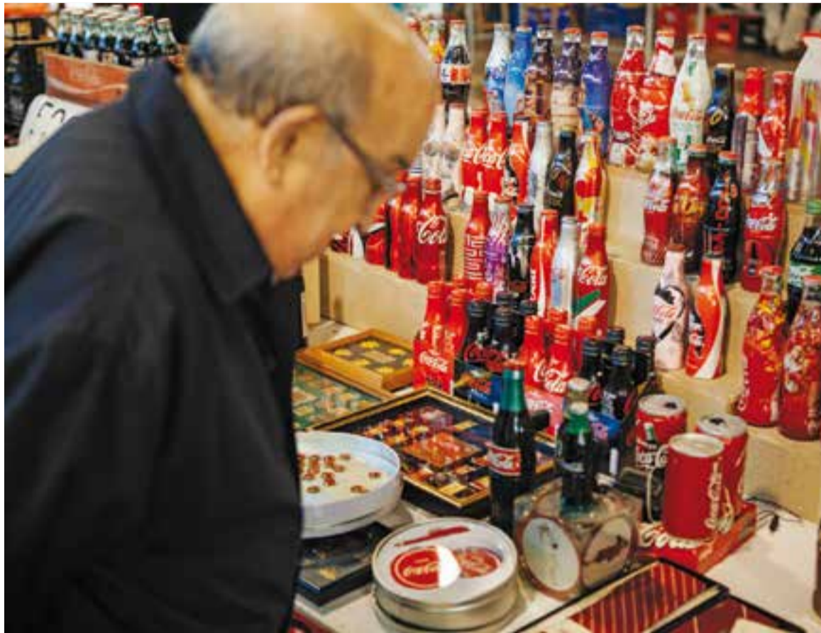
Un dels assistents a la trobada mirant els objectes de col·lecció.

La reunió de col·leccionistes va començar al Recinte Firal de l'Espai Tolrà a les 9 del matí i va acabar passades les 14 hores. Va comptar amb participants vinguts pràcticament de tota Espanya, per exemple de La Corunya, Santander, Madrid, Andalusia, Girona o Barcelona. "On hi ha més gent que fa col·lecció és aquí a Catalunya" , va detallar Antonio Martínez. De fet, quatre dels assistents catalans, inclòs el caste-