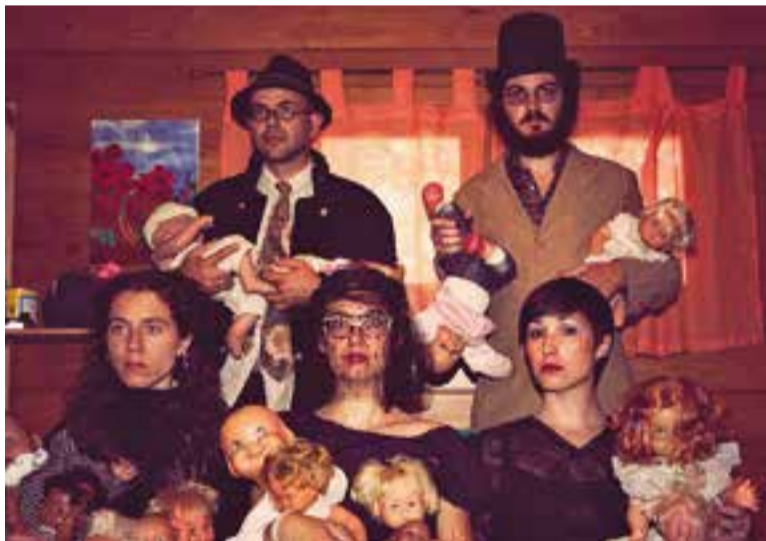
Imatge promocional de La Rateta que Escombrava l'Escaleta