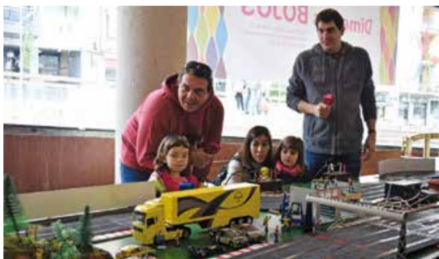
Uns participants a les curses Scalextric.

Prop de 80 persones van participar dissabte d'aquest joc que agrada a nens i adults