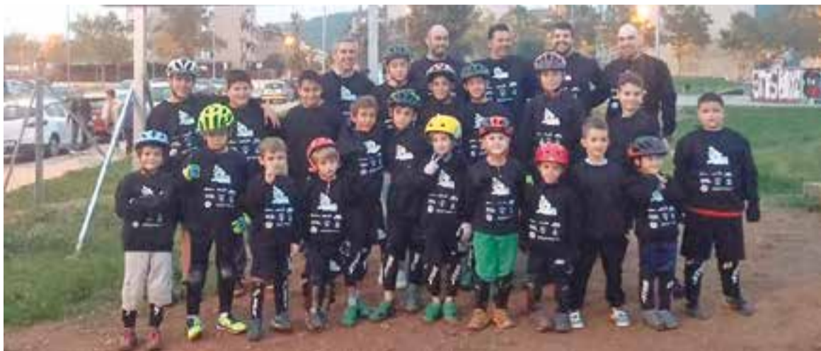
L'Escola de Trial "El Bixu" dona l'oportunitat d'aprendre un esport diferent. || A.S.A.

L'Ajuntament de Castellar i l'entitat Trial 'El Bixu' Castellar; escola de bike-trial del campió del món Alan Rovira, van signar un conveni que té l'objectiu de la col·laboració d'ambdues parts per promoció de la pràctica de la modalitat al municipi.