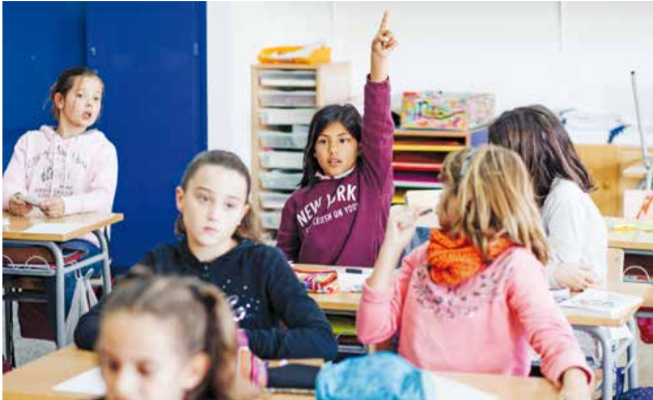
Un moment de la lectura del manifest pels drets dels infants, que es va fer dilluns a l'escola Bonavista.

Dilluns, els representants del Consell d'Infants van llegir el document a l'escola Bonavista