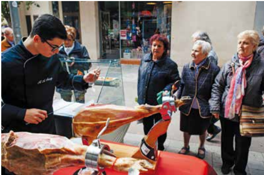
Diverses castellarenques observant el tall de pernil a la parada de Cárnicas Merche.

Es tractava del primer any que els sis comerços d'aquesta zona sortien al