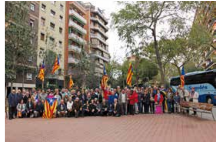
Una imatge dels castellarencs abans d'anar a les Fonts de Montjuïc