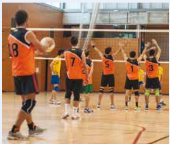
El sènior masculí, en una imatge d'arxiu. || A.S.A.

Pel que fa al sènior femení, la derrota contra el líder, el CN Sabadell 'B' (3-0) no suposa cap contratemps en la lluita per l'ascens, ja que encara amb cinc jornades pel davant, encara és en disposició de lluitar-li la segona plaça a l'Escola Pia, amb qui empaten a 19 punts. D'altra banda, el juvenil segueix intractable amb nou victòries en nou jornades i aquesta vegada va ser botxí a domicili del CV Sant Quirze (0-3), per aconseguir una renda de sis punts respecte al segon. + || A.S.A.