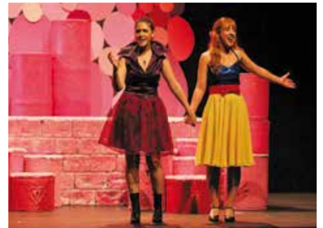
Aquest diumenge, 'Les princeses també es tiren pets'.