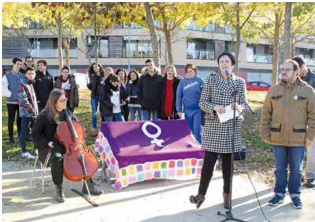
Catorze alumnes de l'Escola d'Adults van llegir el manifest institucional.