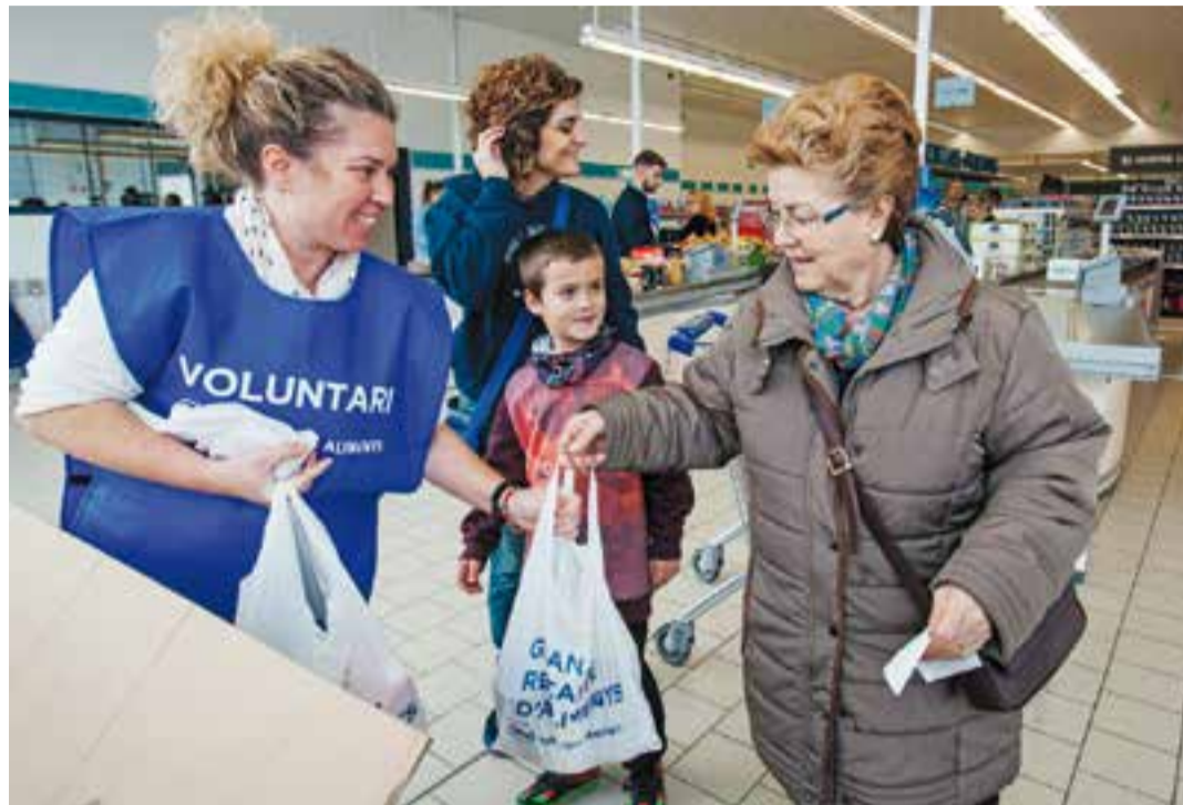
Una voluntària recull aliments donats per una veïna al supermercat Aldi de Castellar.

Pels voluntaris, la millor sensació és veure com les caixes es van omplint d'aliments. "És un plaer poder dedicar aquest