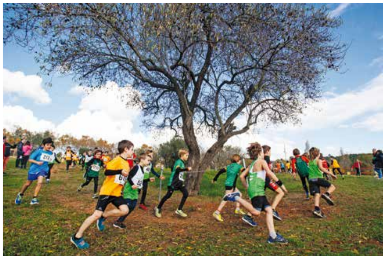
Diferents participants joves a la 29a edició del Cros Vila de Castellar.

es va quedar a només un pas d'aconseguir el podi en veterans