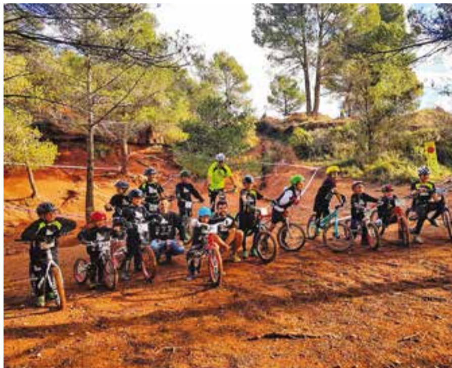
Els 'bikers' de l'Escola de Trial presents a la competició de Sant Llorenç Savall.