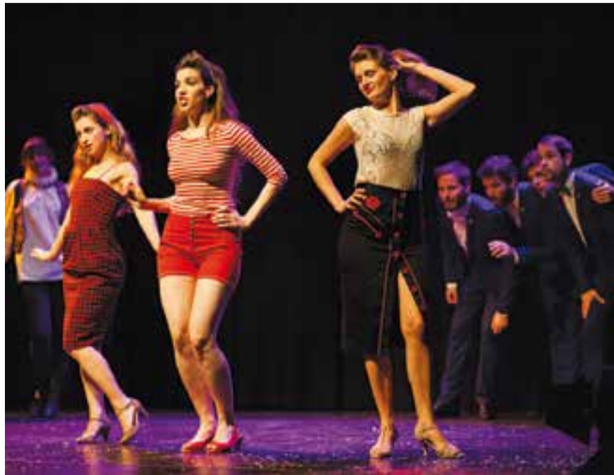
La part 'pin up' de l'espectacle musical 'Shaking Shakespeare'.

W illiam Shakespeare va convidar dissabte els 120 assistents a l'Auditori Municipal a fer un recorregut musical entre els seus pensaments i la seva inspiració artística.