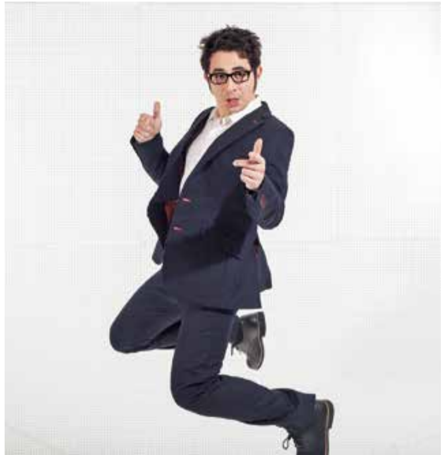
Una imatge promocional de l'humorista que serà aquest divendres a l'Auditori.