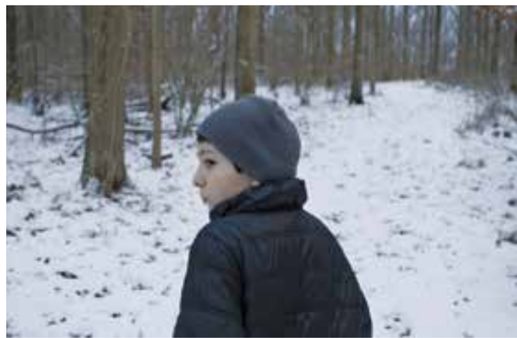
Moment del documental danès 'Una llar al món'.