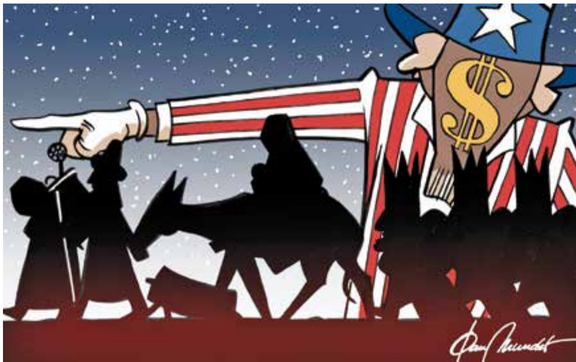
© Pum purru bum pum pum. || JOAN MUNDET

l'atenció per consumir; fins i tot, tindrem la Fira de l'Arbre de Nadal, quan en el nostre País són el Pessebre i els Reis els protagonistes de les Festes Nadalenques.