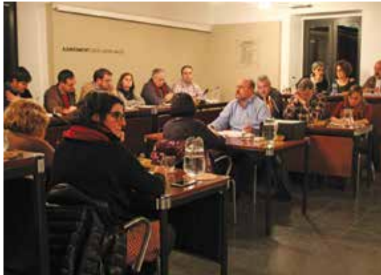
Imatge del ple ordinari de novembre, celebrat dimarts passat.