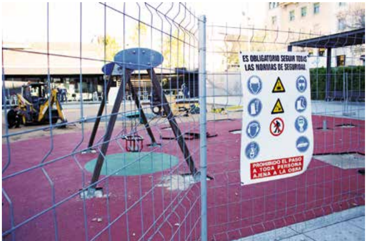
Aquest era l'aspecte de la plaça Calissó dijous passat, amb les obres que es perllongaran fins a finals de desembre.

Precisament, i per afavorir la connexió entre els dos nivells de la plaça, s'eliminarà parcialment la jardineria existent i es col·locaran diversos elements com uns sorrals, unes rampes de fusta, tobogans i un mini-