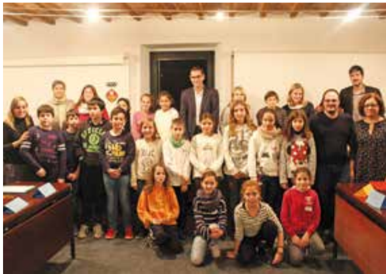
Els representants del Consell d'Infants amb representants municipals.

En aquest sentit, el Consell d'Infants es reunirà 10 vegades al llarg d'aquest curs per anar treballant, entre d'altres, una proposta de pressupostos participatius per a l'any 2017, seguir col·laborant amb el Consell Nacional de la Infància i l'Adolescència de Catalunya (CNIAC) i per organitzar i col·laborar en diverses activitats, com ara la Festa del Dia Mundial del Medi Ambient (FDMMA). La sessió