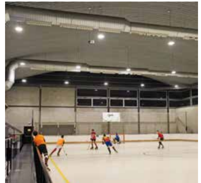
Nou enllumenat del pavelló Dani Pedrosa.

Als pavellons Dani Pedrosa i Joaquim Blume s'està instal·lant un nou tipus de làmpada amb una vida de 20 anys