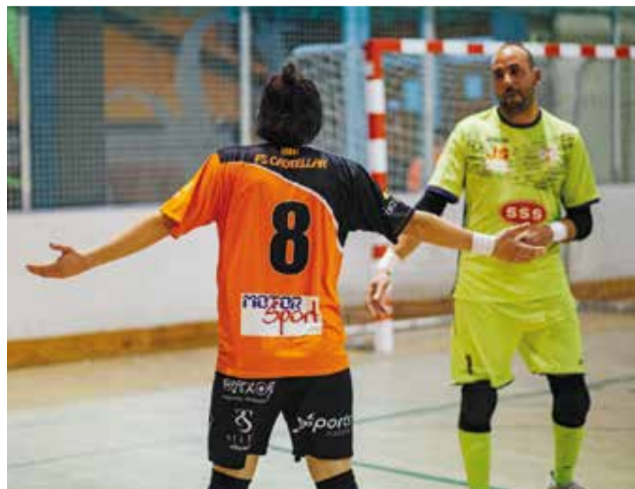
El FS Farmàcia Yangüela Castellar no va poder amb l'Arenys de Munt al Blume. || Q. PASCUAL

El calendari és poc propici pels de Burgos, que amb dos partits seguits lluny de casa, aquesta setmana visiten la pista de la FE Grama (5è classificat) i la següent la del líder, l'Aliança de Mataró. Tot i això, encara queden 10 jornades de lliga per assegurar la salvació. + || A.S.A.