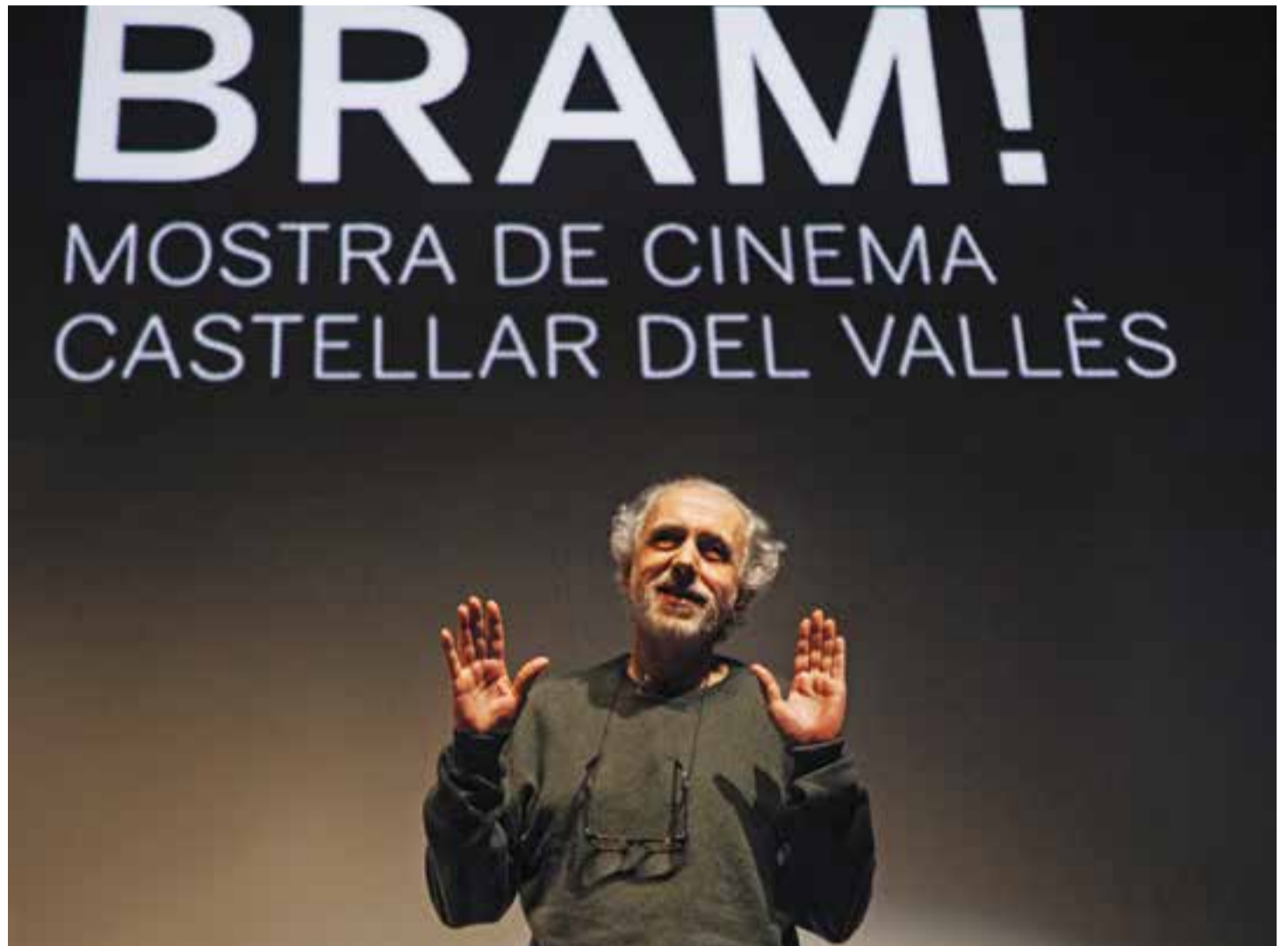
Fernando Trueba rep l'aplaudiment de l'auditori en la inauguració del BRAM!, divendres passat.

El BRAM! va arribar al seu equador el vespre de dimarts passat amb la projecció de la pel·lícula