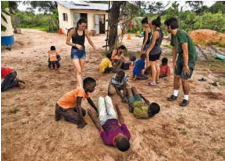
Sessions d'expressió corporal a Amdalai, Gàmbia