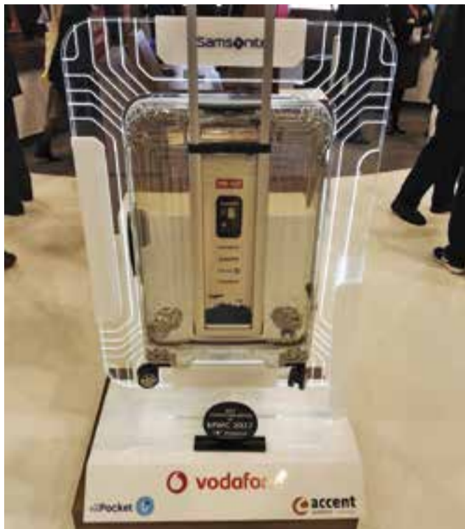
El prototip de la maleta Samsonite premiada al MWC.

L'empresa castellarenca treballa en el sector d'Internet de les coses (Internet of Things, IoT) i està especialitzada en crear dispositius d'ús quotidià connectats a la xarxa a través de Wifi o Bluetooth. La maleta és un projecte conjunt amb Vodafone, Samsonite i l'agència de comunicació In the pocket. Accent Systems no descarta fabricar únicament el dispositiu i que es pugui aplicar a qualsevol maleta. “Com que la tecnologia que fem servir no és GPRS, sinó la NarrowBand IoT -una xarxa de baixa potència per connectar objectes-, el preu és molt reduït”, explica l'executiu en cap d'Accent Systems, Jordi Casamada. “Ja fa temps que es fan dispositius, trackers que en diem al sector, de traçabilitat, però la novetat és que la tecnologia ara és de molt més baix cost”, apunta Casamada. Fins ara els costos d'aquesta tecnologia eren “prohibitius” tant pel que fa al dispositiu com de manteniment “en el que vindria a ser la quota de subscripció mensual” . Ara el preu és més “asequible” i això farà que “tothom tingui un dispositiu a les seves maletes” .