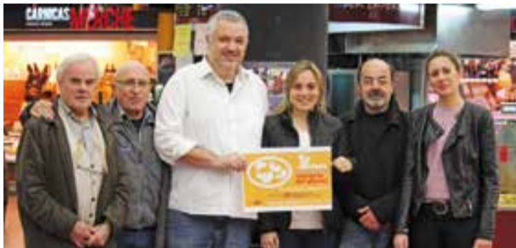
Presentació d'ERC del I concurs de la mongeta del ganxet.