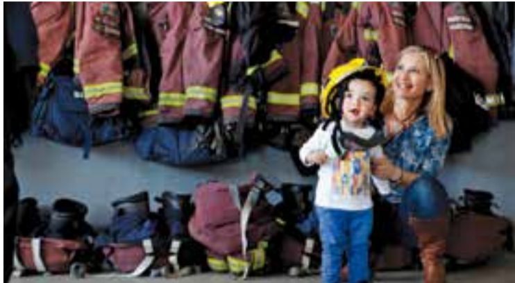
Els castellers podran visitar les instal·lacions del parc de bombers.