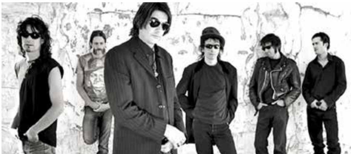
Membres de La Frontera

Es compten entre 5.000 i 7.000 persones mobilitzades per acudir a l'esdeveniment, “a part de tots els castellarencs que vinguin” . També hi serà present una televisió per retransmetre els esdeveniments de tarda. ➔