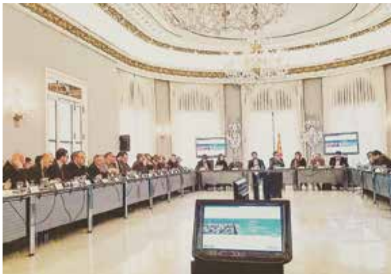
L'alcalde de Castellar, tercer per l'esquerra, va participar a la cimera de dilluns.

Castellar, com a municipi, no es veurà afectat pels acords presos a la trobada de Barcelona, però sí els vehicles castellarencs de més de 20 anys