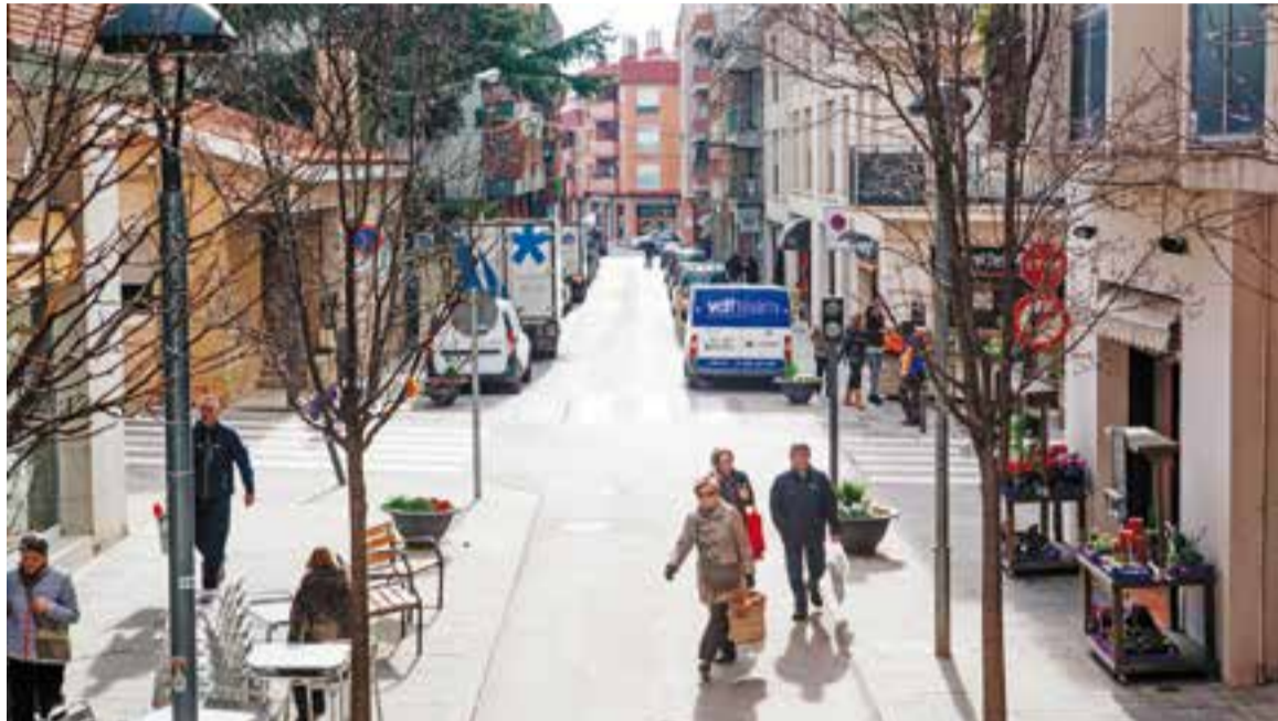
Aspecte general del tram per a vianants del carrer Montcada a la cruïlla amb el carrer Hospital.

Segons un comunicat de l'Ajuntament que repassa les principals conclusions obtingudes de l'esmentada enquesta, "pràcticament una de cada dues persones entrevistades (un 48%) no viu al centre però hi va habitualment a peu" . A aquest percentatge cal sumar-hi un 32% dels enquestats que sí que viuen al centre urbà i que, per tant, també es mouen dins d'aquesta illa sense utilitzar el vehicle. "De la resta d'enquestats, un 17% hi accedeix en cotxe o moto, un 2%, en transport públic i 1%, en bicicleta o altres mitjans" , informen des de l'Ajuntament.