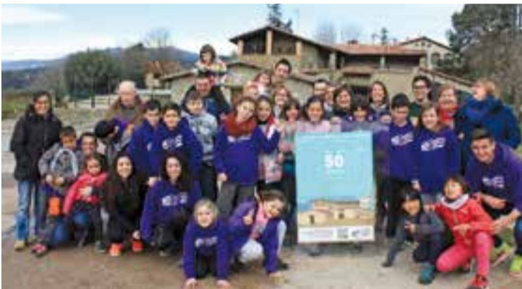
La trentena de persones que es van trobar a la Bertrana. || CEDIDA

A la trobada matinal els participants van esmorzar; van visitar la casa i les fotografies exposades dels 4 anys que s'hi han fet les colònies d'estiu (1996-1998 i 2007). També van dedicar un temps a compartir records, anècdotes i experiències per tal que els més joves coneguin la història que hi ha al darrere. Els infants de l'esplai amb els monitors i monitores van passar el cap de setmana a la casa. Van fer una excursió pels entorns cercant "esquirols", l'activitat "si les parets parlessin" i van buscar i realitzar un mural amb les siluetes de tots els monitors que han fet estades a la casa. + || REDACCIÓ