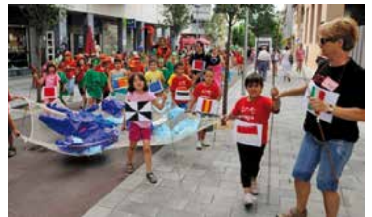
Desfilada dels Casals d'Estiu de Castellar