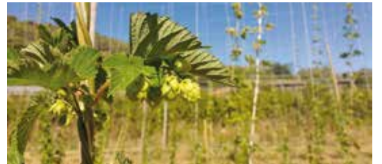
Planta de llúpol al Viver Tres Turons, a Sant Feliu del Racó.

El Viver Tres Turons és a Sant Feliu del Racó, es dedica a la producció de plantes autòctones per a actuacions de rehabilitació ecològica de riberes, depuració d'aigües residuals, piscines naturals i bioenginyeria. També produeixen plantes per a paisatgisme i revegetació de zones degradades, per a jardineria de baix manteniment i plantes per atraure insectes útils en agricultura ecològica. † || M. A.