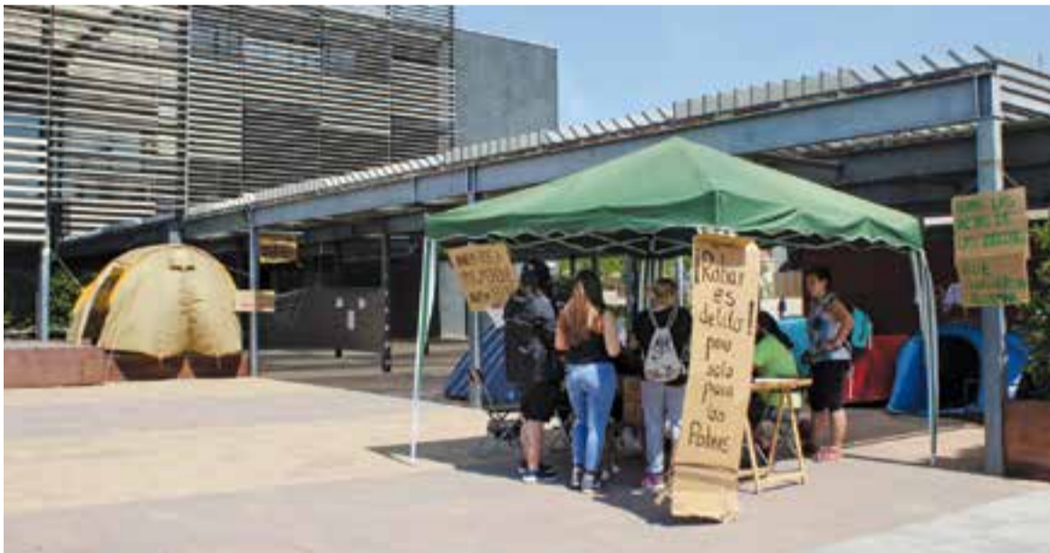
Acampada de l'Assemblea Llibertària a la plaça d'El Mirador en una imatge de dimarts passat.

El 3 de juny de 2011, després d'uns dies d'assemblees i cassolades, alguns indignats de Castellar iniciaven una acampada indefinida a la plaça d'El Mirador. Durant els dies d'acampada van fer actes reivindicatius. Fins i tot es va organitzar una xerrada comarcal, amb representants del col·lectiu d'indignats de Sentmenat, Santa Perpetua, Sant Cugat, Badia, Barberà, La Floresta, Sant Quirze i Sabadell. Unes tres setmanes després, el 20 de juny, els participants van decidir aixecar l'acampada seguint així la resolució de les altres acampades d'arreu del territori, com la de Plaça de Catalunya o la Puerta del Sol. +