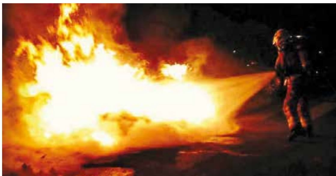
Treballs d'extinció del foc provocat pels cinc contenidors. || BOMBERS DE CASTELLAR