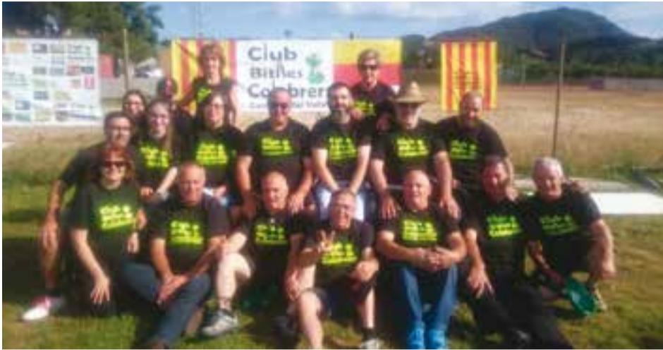
L'equip del CB Colobrers campió de lliga 2016-17 a les pistes de bitlles de Castellar.