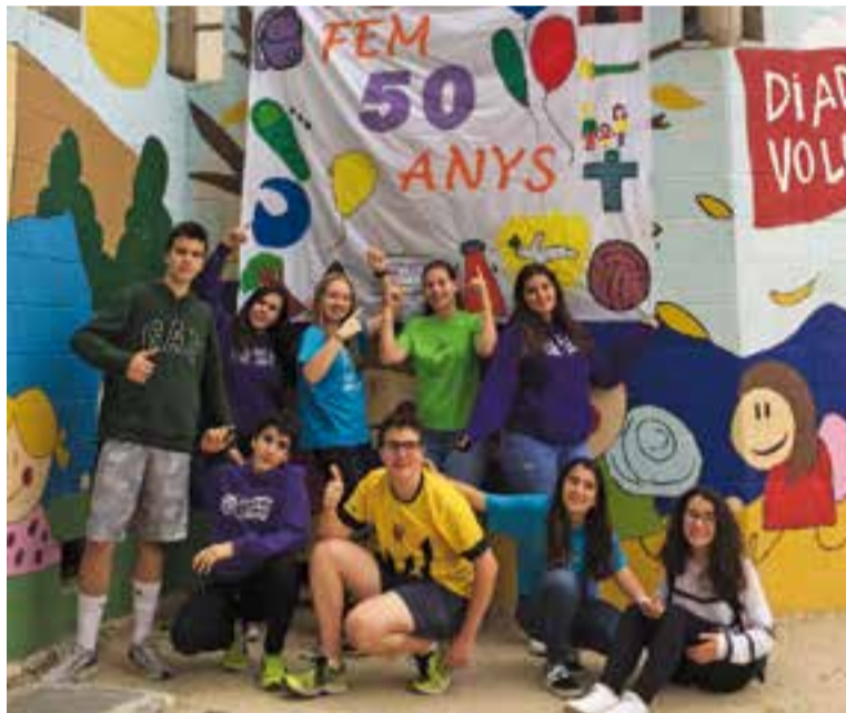
Alguns dels nois i noies de l'entitat que han preparat la festa dels 50 anys.

tius, es van adonar que les Espurnes volien celebrar el 5è aniversari a la mateixa ubicació. Una coincidència que ha portat a les dues entitats a afavorir que es celebrés una festa conjunta que permetés encabir les activitats previstes per ambdós col·lectius. L'inici de la festa tindrà lloc a les 16.30 hores amb una primera part de dinàmiques que seguiran la temàtica proposada. A les 18 hores hi haurà el berenar i a quarts de 7 començarà un concert amb Landry El Rumbero. A partir de les 20h s'oferirà un sopar popular amb una botifarrada, a les 21h hi haurà el correfoc infantil, organitzat per les Espurnes, i a les 22h començarà una ambientació musical a càrrec dels Dee Jays del Revés. En cas de pluja, la previsió