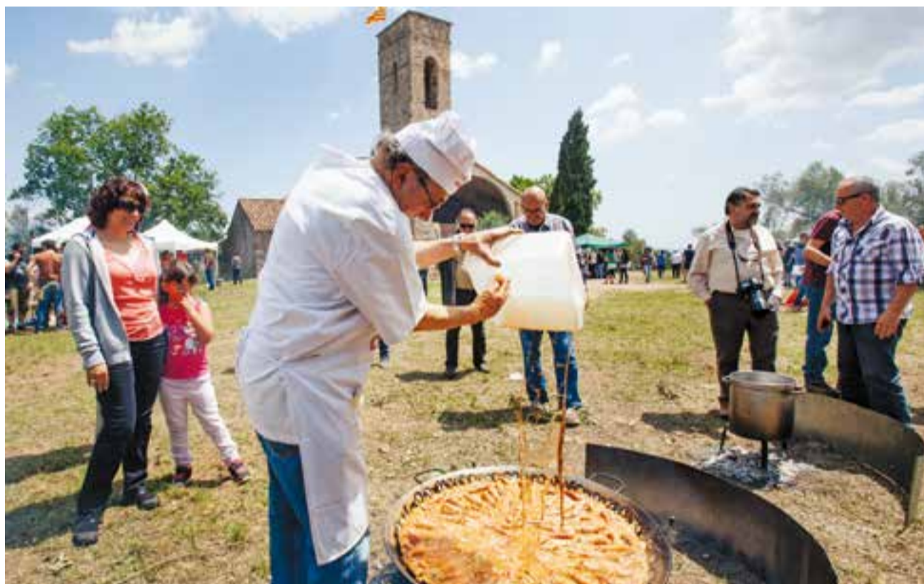
Elaboració d'un arròs durant l'Aplec de Castellar Vell, l'any 2016.

Al concurs de flors boscanes els participants es classifiquen en dues categories: adults i infants/Joves. Les inscripcions es faran fins a les 11 h al punt d'informació de l'Aplec. A les 11 hores s'iniciaran jocs de cucanya a càrrec de l'entitat Colònies i Esplai Xiribec. De 12 a 13 h hi haurà diver-