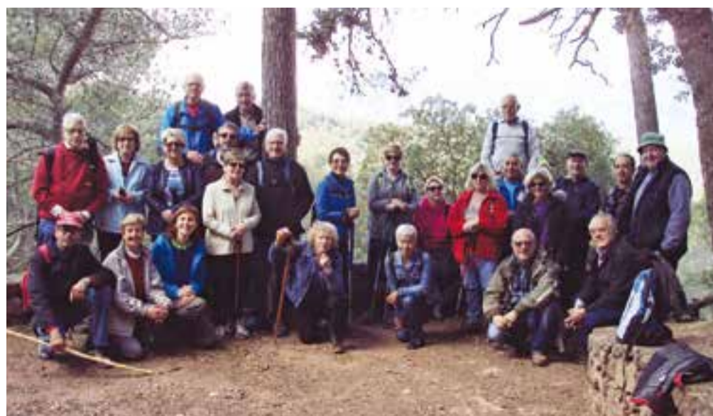
Una de les sortides del cicle Vine i Camina + 60 a Sant Jaume de Vallverd.