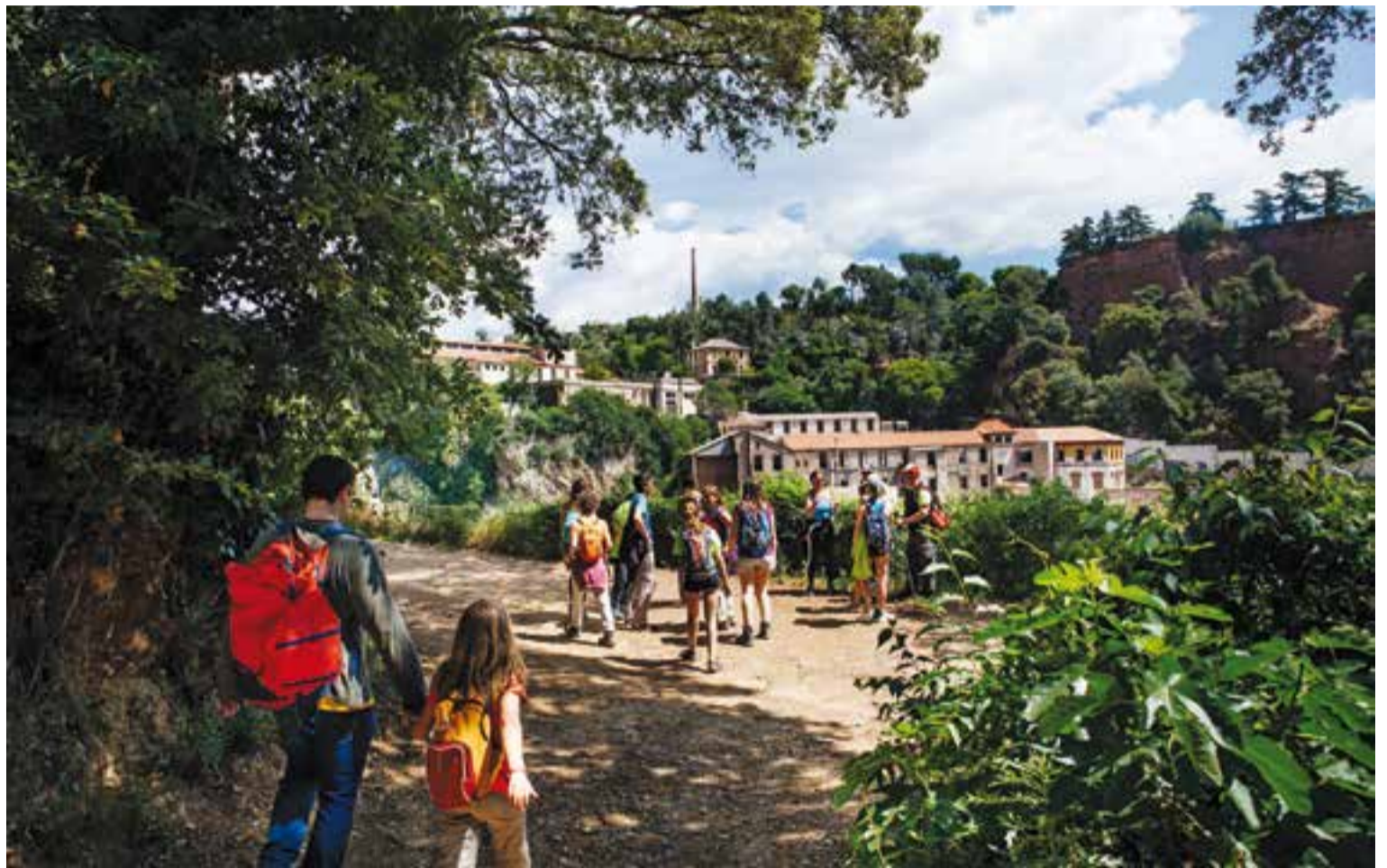
Participants de totes les edats a la trentena edició de la Caminada Popular, diumenge passat.

El recorregut va resseguir indrets naturals de les rodalies de la vila, molt especials, desconeguts per molts dels castellarencs que van participar en la caminada, alguns fidels cada any a la cita i altres que van apuntar-s'hi per