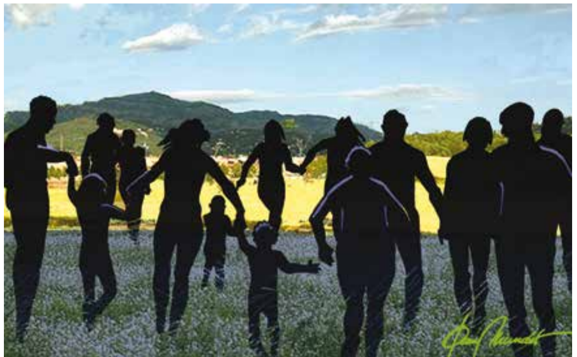
© Collage 4. || JOAN MUNDET

MANIFEST Comissió de 17 de maig Dia Internacional Contra la LGTBIfòbia