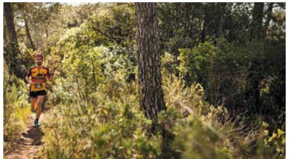
Un participant de la Salamandra Trail pels corriols de la prova. || S.COLOMÉ / TAIMORY

Segons l'organització "el bon regust de boca deixat en aquest pas de les X-trail sèries per Castellar fa que ens plantejem repetir-la l'any vinent". + || A.S.A.