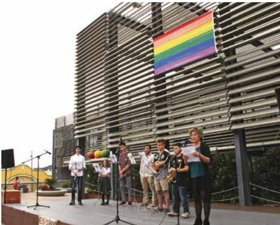
La lectura del manifest a la plaça d'El Mirador amb el grup de vent de l'EMM Torre Balada a l'escenari.

També es destaca que a Catalunya fa gairebé tres anys que, fruit de la lluita de les entitats LGTBI es va aprovar la llei 11/2014