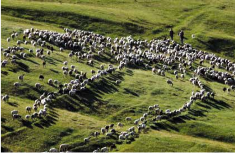
Una de les imatges del treball audiovisual 'El camí de Cerdanya'.