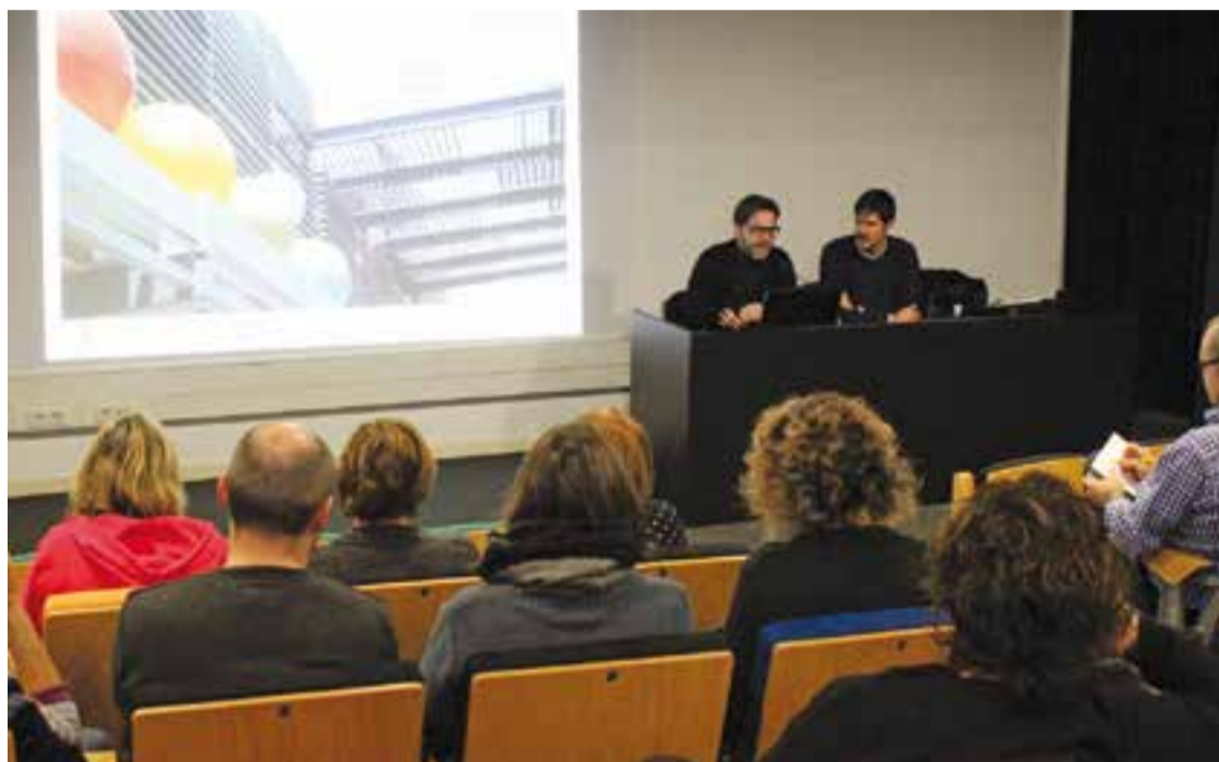
Presentació del projecte del Pla Estratègic als treballadors i treballadores municipals.

Aquests debats donaran lloc a una síntesi de la diagnòsi en forma de matriu DAFO (debilitats, ame-