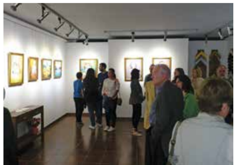
Inauguració de l'obra d'Imma Solà a la galeria Santi Art.