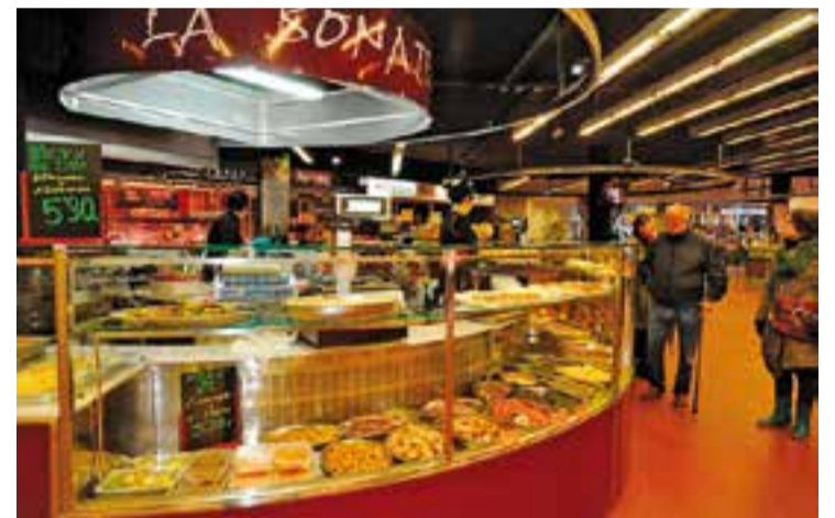
Una imatge d'arxiu del Mercat Municipal.

Des de dilluns d'aquesta setmana i fins al 31 de maig, els diferents mercats de l'àrea de la demarcació de Barcelona celebren la Setmana Internacional dels Mercats amb diferents accions que tenen com a objectiu la promoció de l'alimentació responsable. "Markets for a new generation" (Mercats per a una nova generació) és la idea central a partir de la qual els mercats s'obren al públic jove a través d'actes gastronòmics, conferències, demostracions de cuina i activitats infantils. I tot això en el context d'un comerç de proximitat i un estil de vida saludable. El Mercat Municipal de Castellar se suma a la iniciativa amb un curs de cuina per a infants de 3 a 8 anys que es farà el dia 26 de maig al mateix recinte entre les 17.15 i les 19.15 hores. Per participar-hi, cal inscripció prèvia al telèfon 93 714 40 40 o adreçant-se al Servei d'Atenció Ciutadana els dilluns i divendres de 8.30 a 14.30 h i de dimarts a dijous de 8.30 a 19 h. † || REDACCIÓ