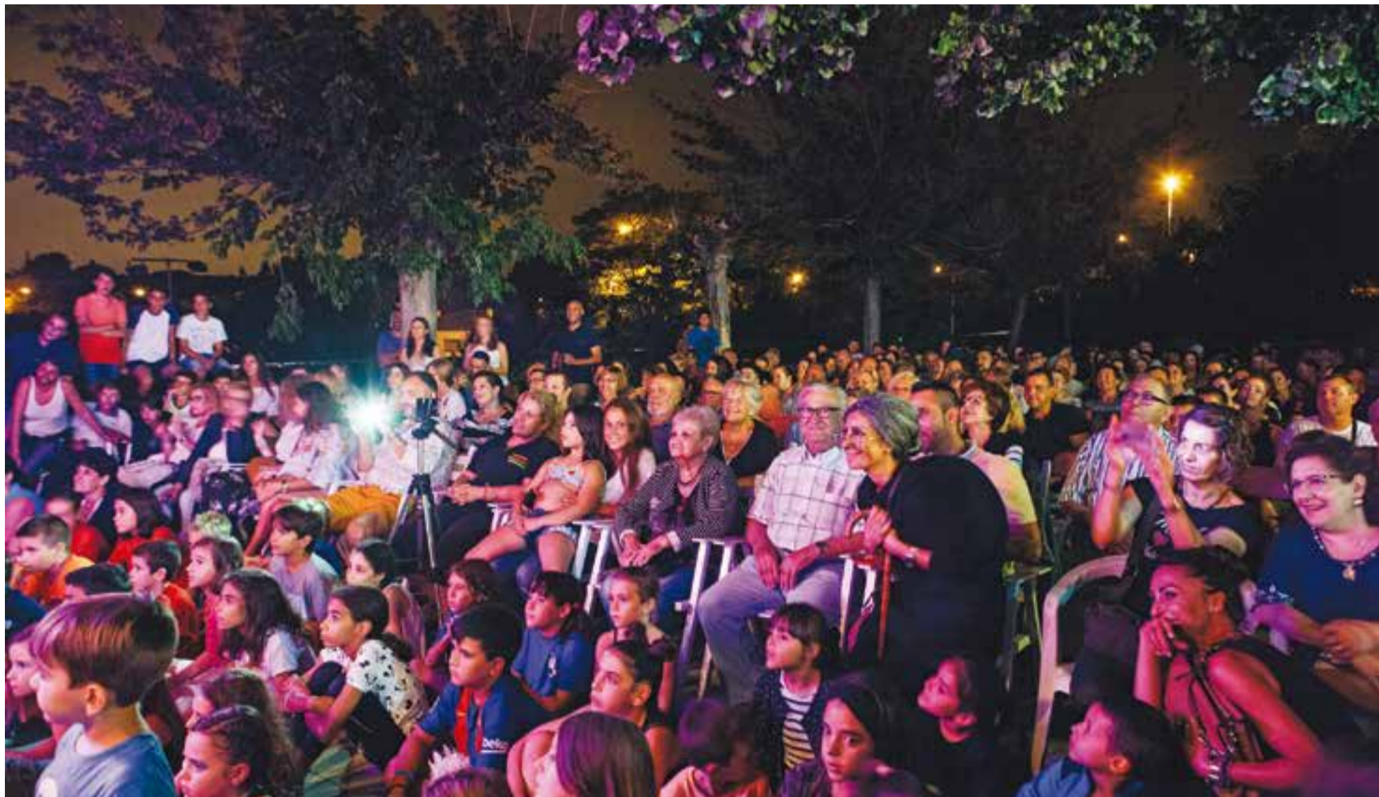
El públic assistent al concurs 'Tu vecino me suena' no es volia perdre cap detall de l'actuació del veïnat.