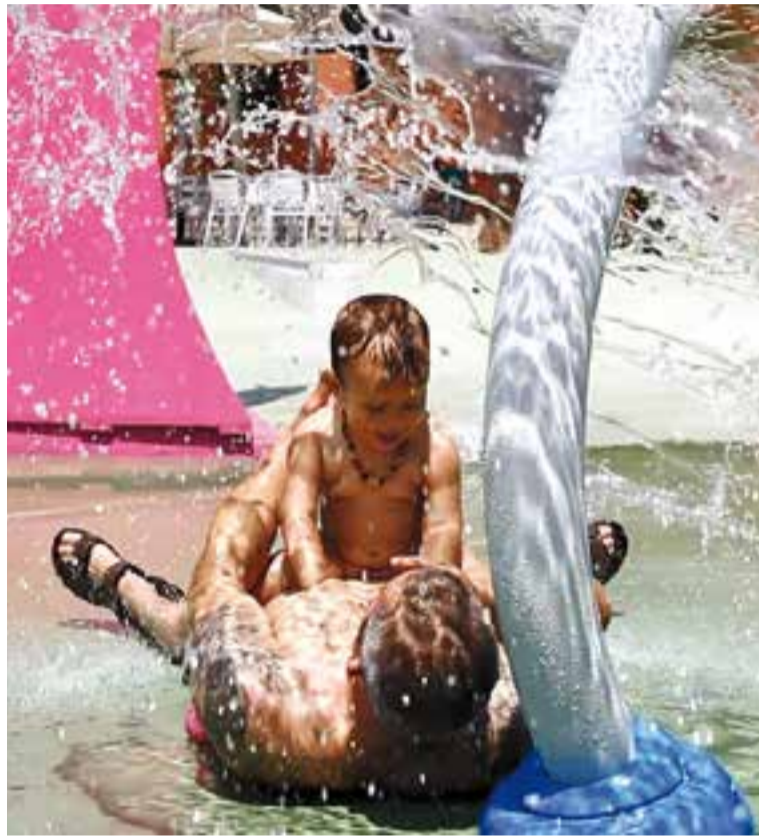
Un pare amb la seva filla en un dels jocs per als més menuts.

En total, la zona recreativa compta amb 43 jocs d'aigua, distribuïts en dues zones diferenciades. D'una banda, un espai familiar amb 25 jocs per a totes les edats, com ara els canons, la torre