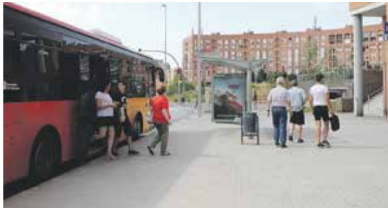
Castellarencs baixen de La Vallesana a la plaça Espanya, al costat de l'estació.

A la inauguració, el conseller de Territori, Josep Rull, ha destacat que la connexió entre Renfe i Ferrocarrils de la Generalitat (FGC) que ha entrat en funcionament a la plaça Espanya, a l'estació Sabadell Nord, “transformarà la mobilitat a Castellar del Vallès” . Rull ha posat com a exemple les noves possibilitats de millora de transport públic per connectar-se amb la Universitat Autònoma (UAB) o amb l'altra capital de la comarca, Terrassa. Per la seva part, també durant la inauguració, el president de la Generalitat, Carles Puigdemont, s'ha referit a Castellar del Vallès tot recordant que al mateix temps que es posava en marxa les cinc estacions dels FGC a Saba-