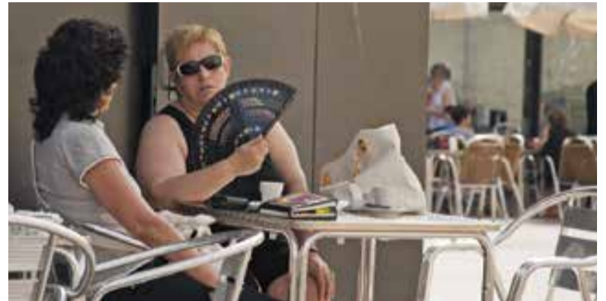
Dues castellanques es refresquen en una terrassa

Va ser la temperatura màxima del mes de maig passat