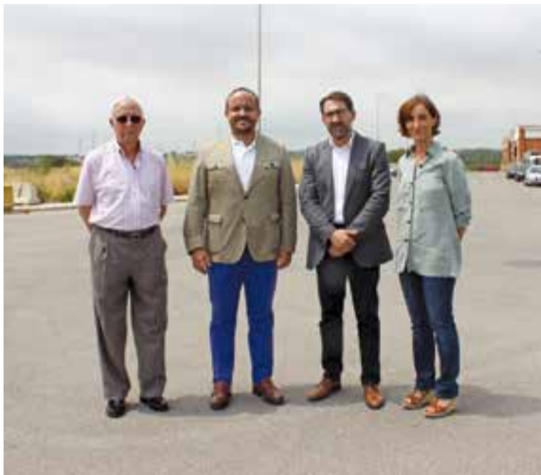
La comitiva a la carretera que divideix els Polígons de Can Pagès i Can Carner