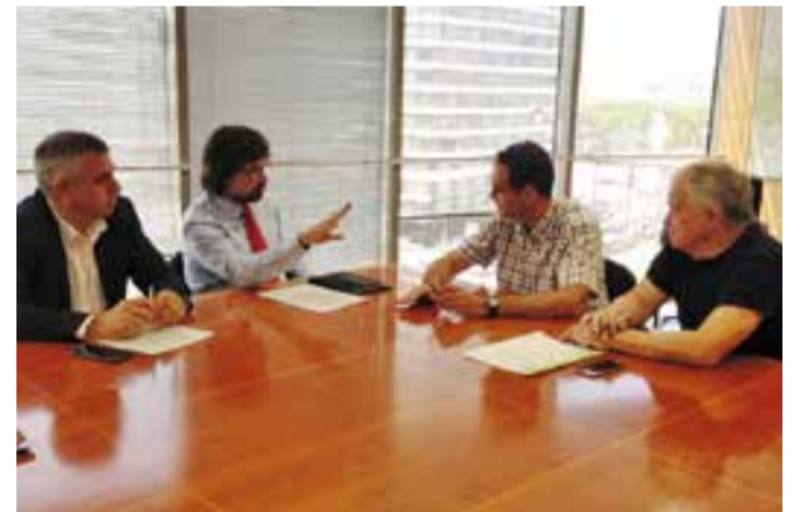
Reunió entre representants de Territori i l'Ajuntament a Barcelona.

L'Ajuntament també reclama que es faciliti la millora de les parades a les urbanitzacions Airesol A-B i C, de manera que siguin més segures i que els vehicles puguin recollir els usuaris en els dos sentits. A més, des de Castellar es considera important crear un servei de park&ride que pugui ser utilitzat gratuïtament pels usuaris de l'intercanviador de la plaça d'Espanya de Sabadell. D'altra banda, es demana que es consideri la creació de serveis directes a la UAB i a Terrassa, pensant en els estudiants, i que es potenciï la línia directa a Barcelona. || REDACCIÓ