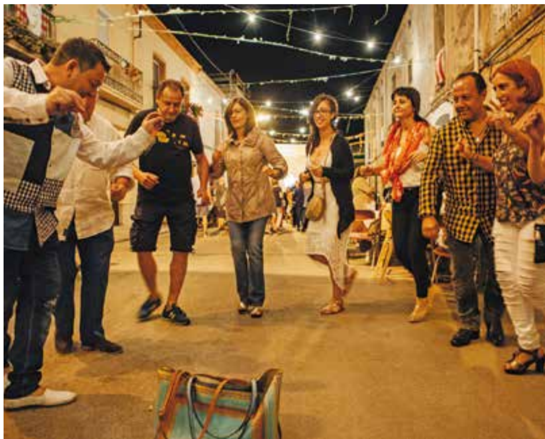
Ball de la Revetlla de Sant Jaume de l'any passat.

El grup La Petita Havana és de Vilanova i la Geltrú, amb la presència castellarenca de Roca, i deu el seu nom al passat colonial de la ciutat tarragonina i a la tradició marinera, ja que Vilanova era coneguda amb aquest sobrenom, "la petita havana", i encara s'aprecia part de l'arquitectura de l'època colonial. "És una de les coses que més ens agrada, poder explicar el nom i el passat colonial de la nostra ciutat i de tradició marinera" .