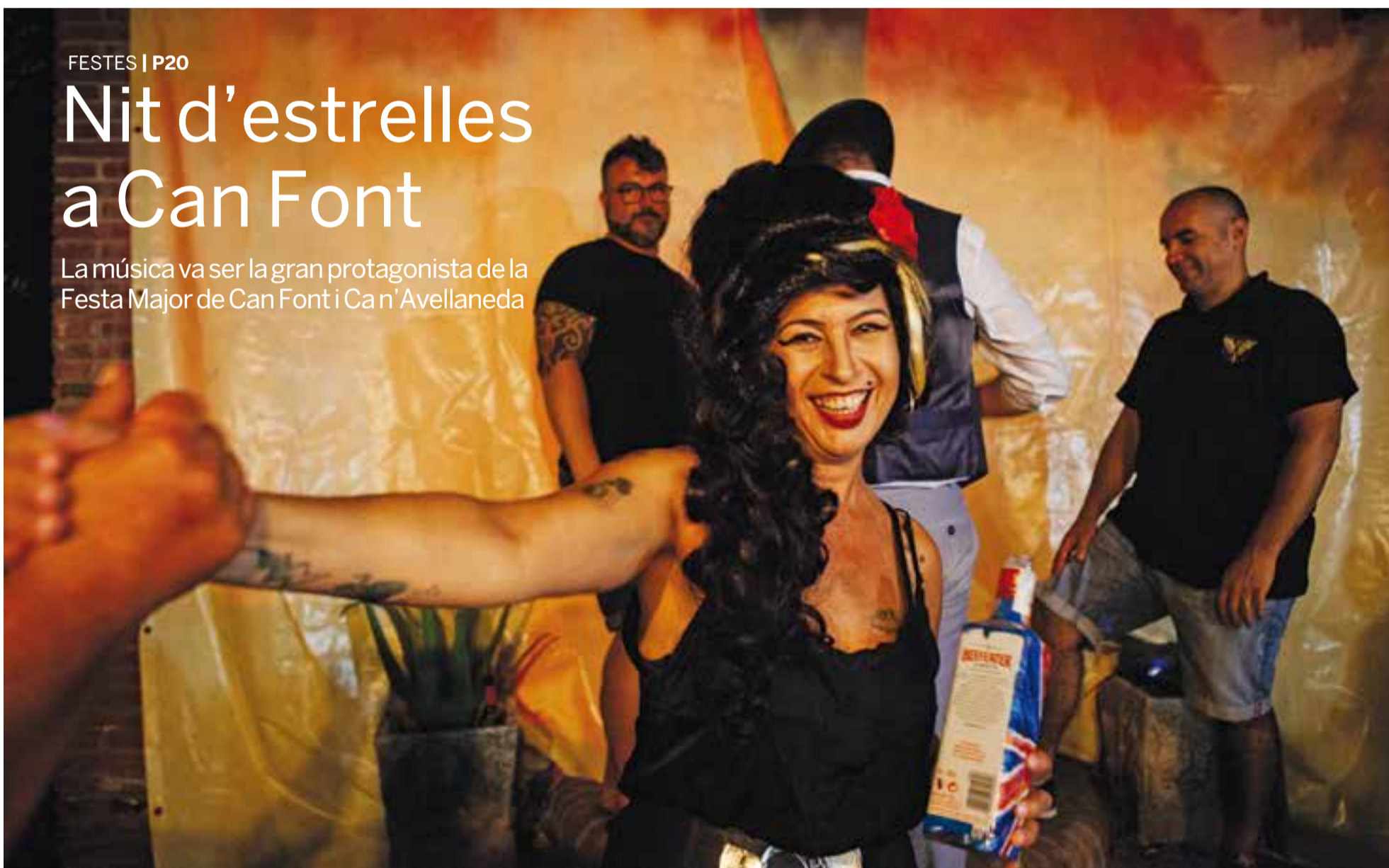
El concurs d'imitació de famosos 'Tu vecino me suena' va tenir grans moments, com l'aparició d'una ressuscitada Amy Winehouse.

La música va ser la gran protagonista de la Festa Major de Can Font i Can'Avellaneda