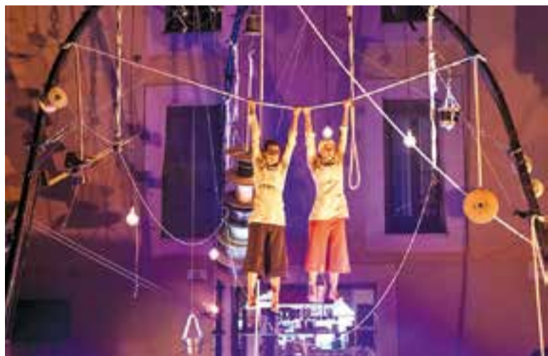
Moment de l'espectacle de circ, clown i teatre de la companyia Estampades.

El Liceu és el primer teatre del món que treballa el territori mitjançant el projecte 'Liceu al Territori', un programa que potencia l'assistència de nous públics al teatre i que inclou xerrades amenes i accessibles a tothom. +