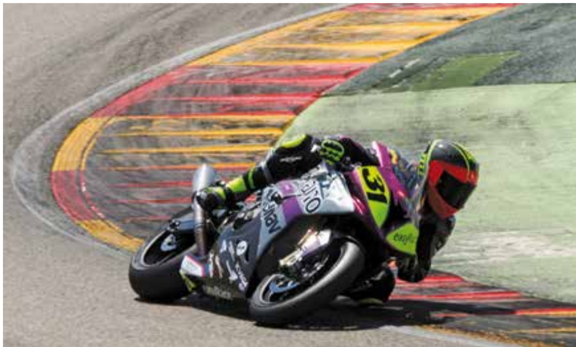
Carmelo Morales a Motorland Aragó amb la BMW de l'Easyrace, amb la qual aconsegueix per fi la victòria.