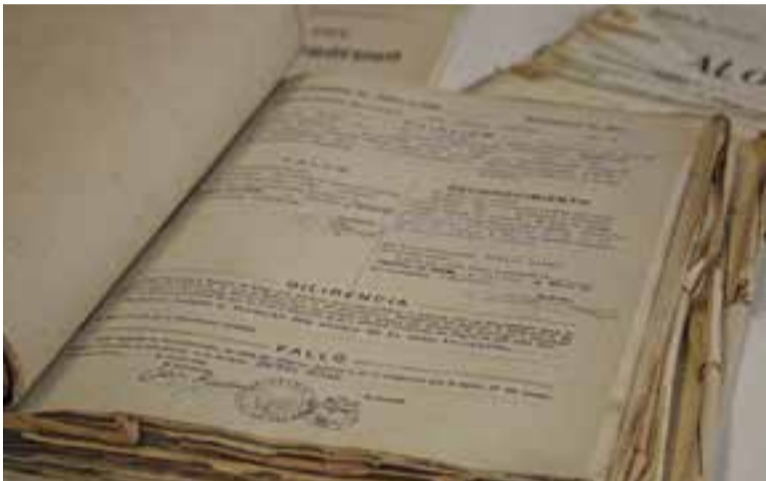
Un document d'exempció d'un quinto de 1940 després de fer-li un reconeixement.