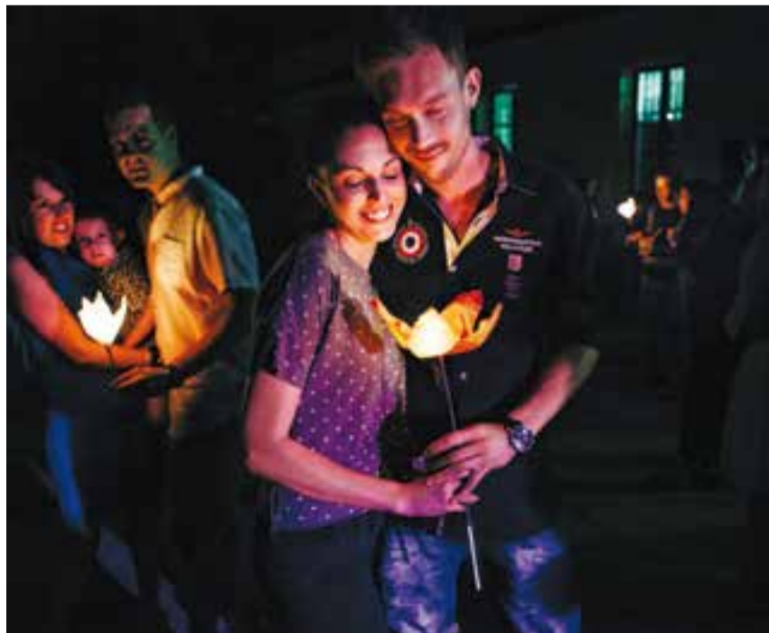
Una parella ballant dissabte el ball del fanalet.

Van pujar a l'escenari de la Penya Arlequinada per participar a 'Tu vecino me suena'