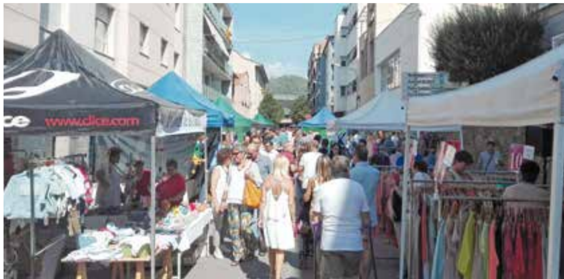
Una imatge de l'Street Market de l'any passat al carrer Sala Boadella.

L'activitat s'ubicarà, per una banda, als carrers Sala Boadella, Hospital i Montcada i, per l'altra, al carrer Major. L'objectiu és combinar les parades dels diferents comerços amb activitats lúdiques i culturals que dinamitzin i permetin fer ambient a la fira, alhora que s'afegirà una part his-