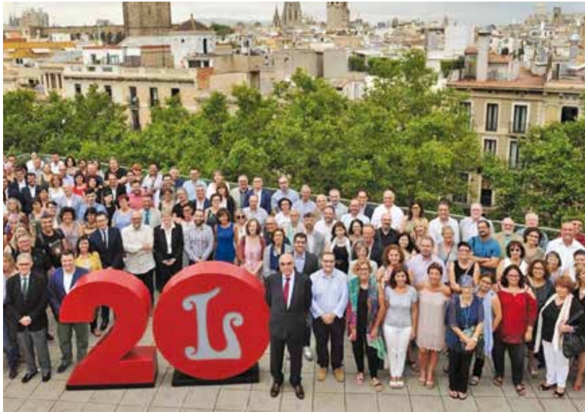
Els representants del Liceu amb personalitats polítiques dels ajuntaments participants al projecte 'Liceu a la fresca'.

En total, 166 municipis de tot l'Estat retransmetran en directe la nova producció del Liceu gràcies al suport d'Endesa i la participació activa de l'Obra Social 'La Caixa'. Així, el Liceu expandeix el seu projecte a tot el territori espanyol, incrementant en un 37,1% la participació de municipis respecte l'any anterior; quan s'hi van adherir 122 municipis. Hi haurà escenaris de projecció tan emblemàtics com l'arc de Triomf, la Plaza Mayor de Madrid, l'esplanada del museu Guggen-