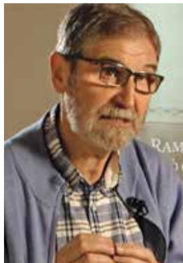
Lemaitre i Solsona tenen novetats literàries en clau de novel·la negra.