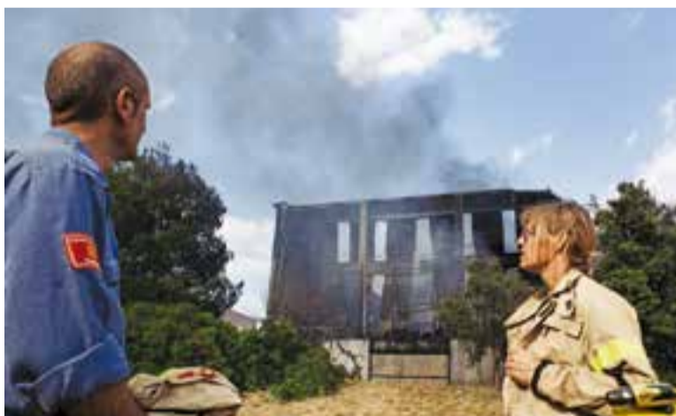
Dues setmanes després de l'incendi, la nau encara fumeja.

Ja fa dues setmanes des que es va incendiar l'empresa Dispopack del Pla de la Bruguera i en aquests 14 dies, la nau no ha deixat de fumejar. De fet, el pla bàsic d'emergència que es va activar, continua actiu fins que comencin els treballs d'enderroc, previsiblement en els propers dies. Durant aquesta setmana, l'asseguradora Ca-