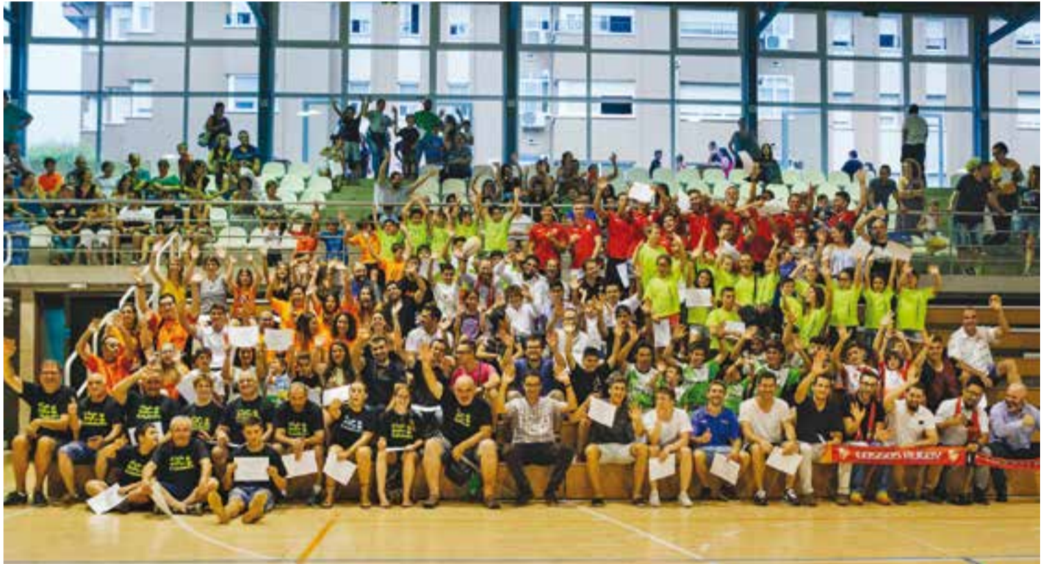
Foto de família de tots els esportistes després de la Festa de l'Esport castellarenç al pavelló Puigverd.