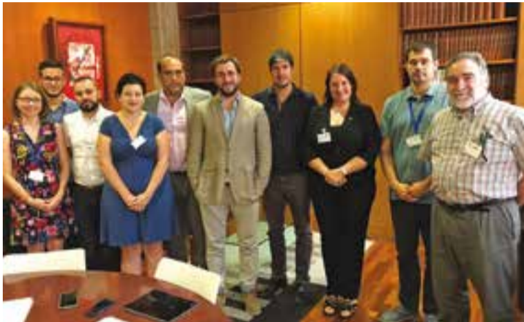
El conseller de Salut amb representants dels municipis de l'àrea del Taulí.

La mesa tractarà aspectes d'interès relacionats amb l'Hospital Taulí, com ara el seguiment del seu funcionament, l'actualització de necessitats i demandes, i al mateix temps, aspec-