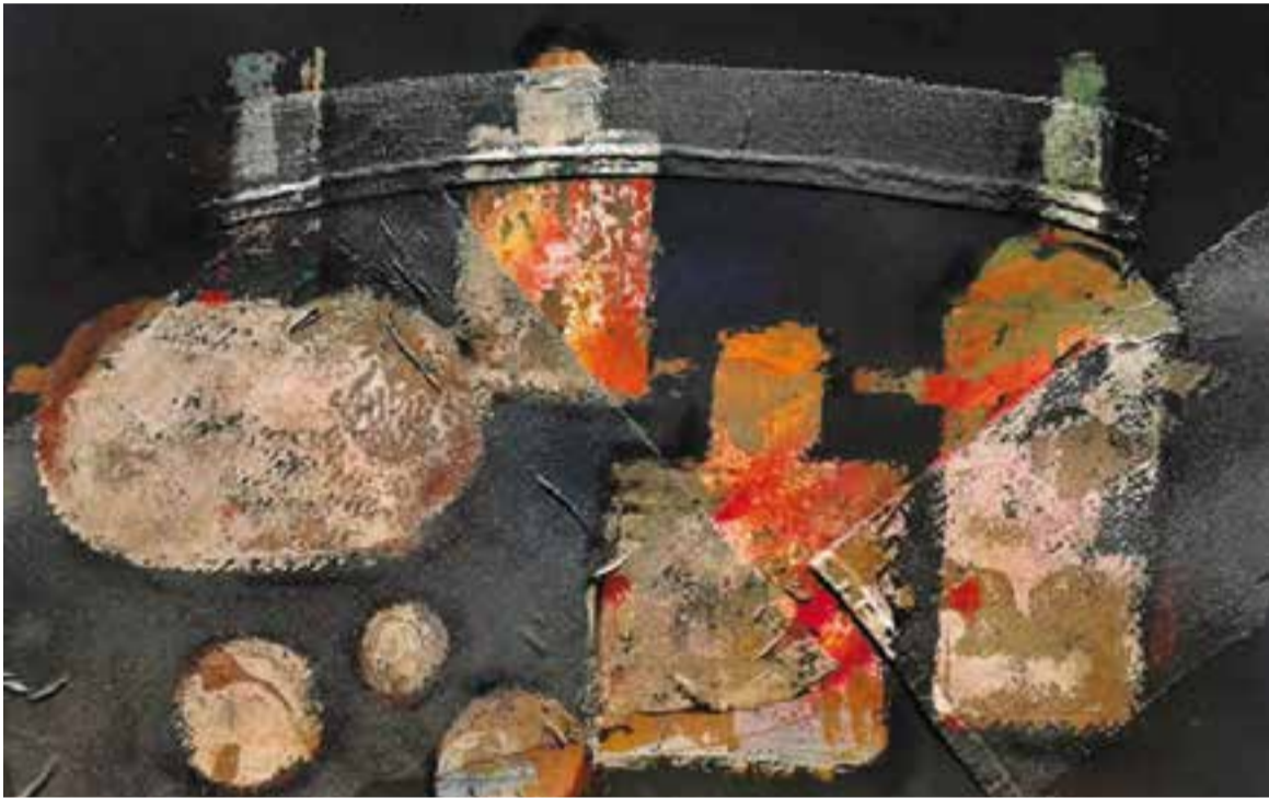
Un dels quadres que Esteve Prat exposa a la galeria Abartium, a Calldetenes. || E. PRAT

Dissabte, l'artista obre una mostra amb tècnica mixta