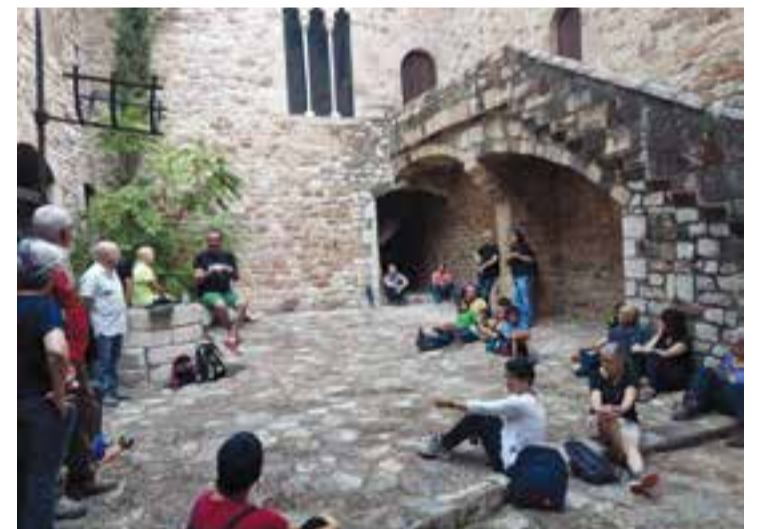
Aturada al 'Joan Oliver a Castellar del Vallès' de l'Arxiu d'Història.