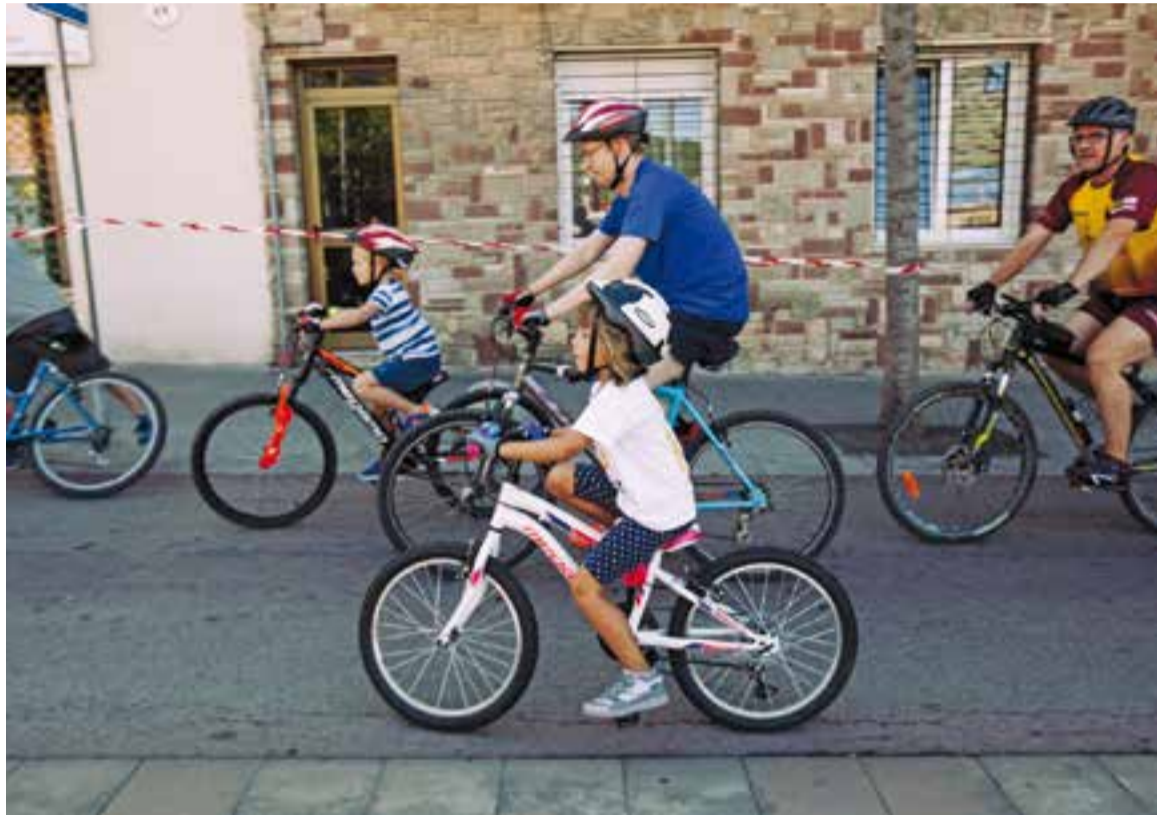
La Bicicletada de la Festa Major va ser l'aperitiu de la Setmana de la Mobilitat.

emmarcades en aquesta iniciativa van començar a Castellar diumenge passat amb la Bicicletada de Festa Major, una activitat que enguany arribava a la novena edició, amb sortida i arribada a la plaça de la Fàbrica Nova. La participació a aquesta proposta està limitada a 400 participants. Tampoc faltaran enguany els tallers d'educació viària i ambiental als centres d'educació primària de la vila, que els alumnes de quart de primària realitzaran entre el 19 i el 22 de setembre amb la col·laboració dels agents de policia. Aquest 2017 seran uns 280 els nens i nenes que aprendran nocions diverses sobre les normes de circulació, seguretat, protecció del medi ambient i mobilitat sostenible.