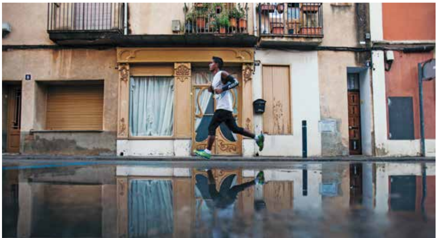
Un participant de la cursa al costat d'un toll dissabte a la tarda.