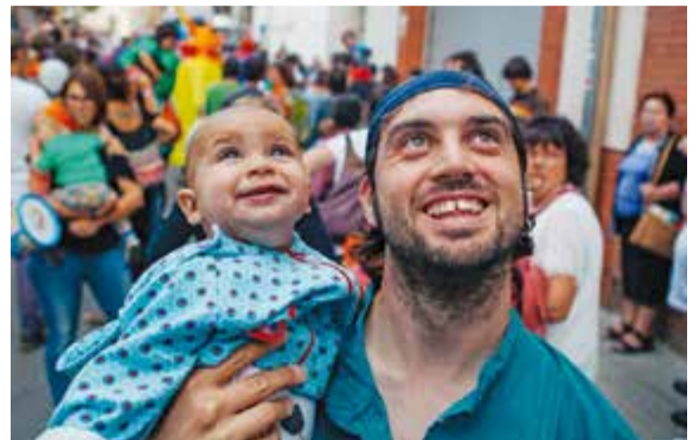
A dalt, a l'esquerra, la cercavila gegantera a la plaça del Mercat. A sota l'espectacle itinerant 'Rats'. A dalt, a la dreta, un dels integrants del grup Doctor Prats. A sota, un jove al correfoc de dissabte i a baix, a la dreta, ambient a la cercavila de gegants. || Q. PASCUAL