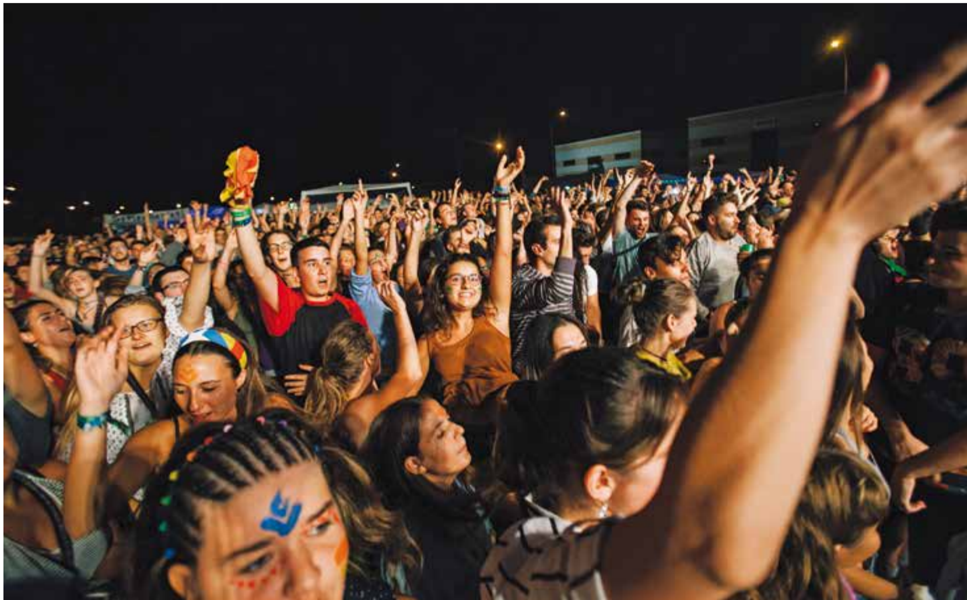
El públic omplia l'espai de Vilabarrakes dilluns passat per escoltar les cançons del grup Doctor Prats.

La Festa Major d'enguany, amb més de 120 activitats, ha comptat amb noves propostes i ubicacions