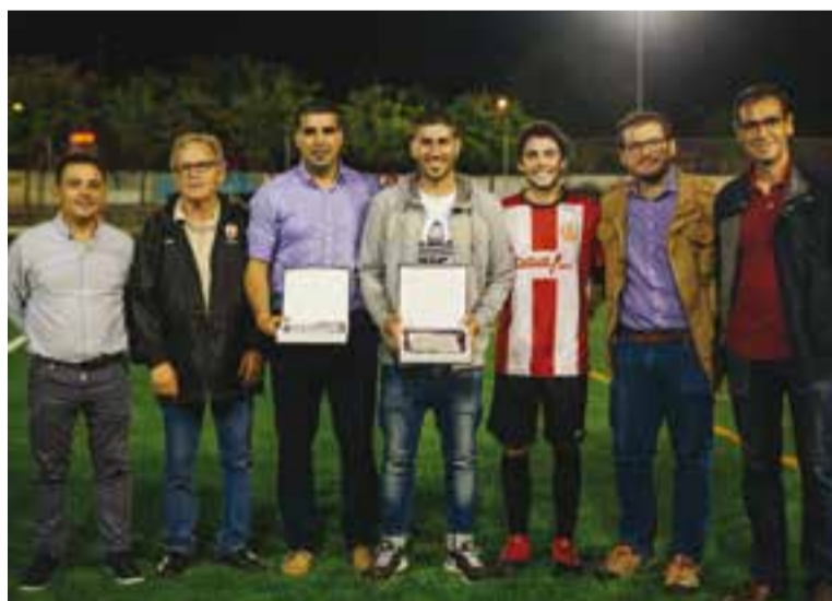
Autoritats i directius de l'equip en l'homenatge a M. Argemí i C. Sabaleta.

Durant la mitja part, el club va atorgar una placa commemorativa a la