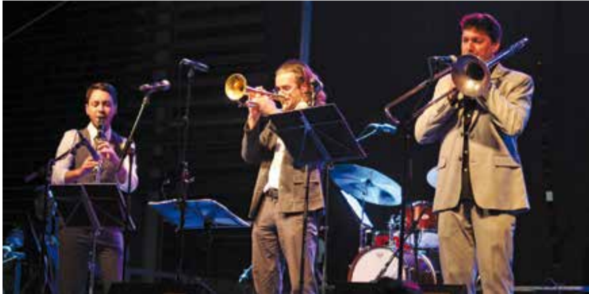
La Bumpy Roof Band va cloure la TriSonaSwing de Festa Major a la plaça d'El Mirador.