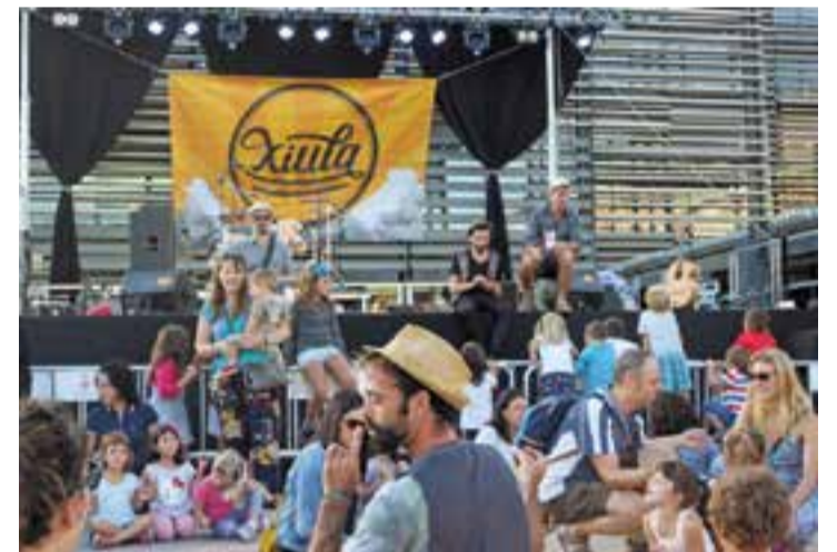
Part final del concert amb Xiula, que va actuar dilluns a la tarda.