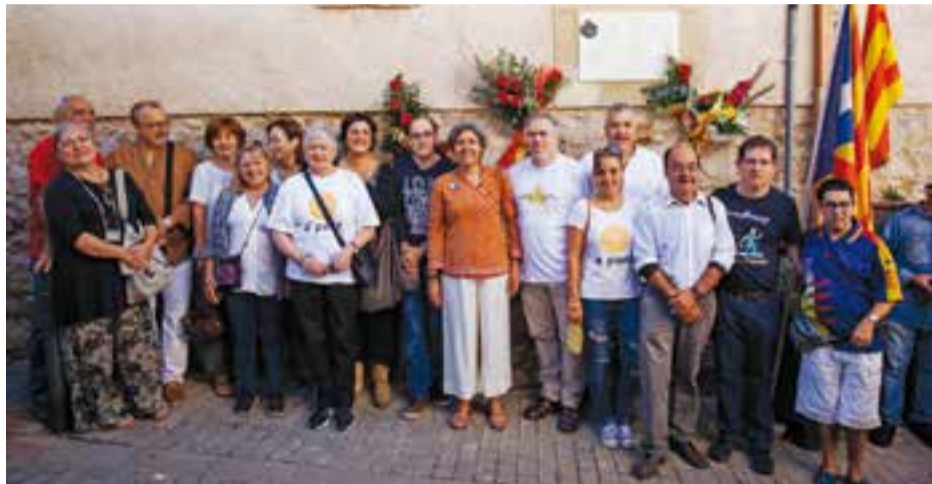
Representants dels convocants a l'acte independentista de Cal Targa. || Q. PASCUAL

A part de recordar els catalans que han lluitat per Catalunya, "avui el repte és mirar cap al futur. Un futur il·lusonant, amb vista al referèndum de l'1 d'octubre" . Es tracta, de nou, "una d'aquelles oportunitats en què el poble català ha de resistir els atacs arribin des d'on arribin i ha de tenir clar quin és l'objectiu final de tot aquest procés" . En el manifest es posa de manifest que l'1 d'octubre cal que hi hagi