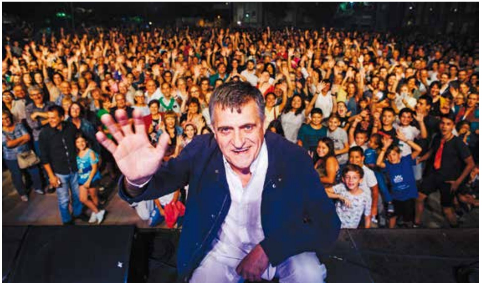
El Gran Wyoming saluda la càmera amb els assistents al pregó al seu darrere.

Potser, la grandíssima expectació generada va fer que els assistents trobessin a faltar referències a Castellar del Vallès -de fet, el Gran Wyoming ha visitat la vila en diverses ocasions- o, fins i tot, a l'actualitat política més candent. Però, en aquesta ocasió, el mordaç i àcid presentador va optar per l'ortodòxia i es va concentrar en