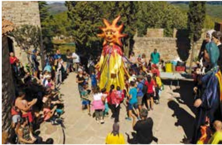
Trobada de Tardor al Puig de la Creu de l'any 2016. || M. ANTÚNEZ

Les activitats arrenquen dissabte 16 amb la caminada del capvespre al Puig de la Creu, a les 20 h, des de l'Era d'En Petasques. A les 21 hores es podrà gaudir de la panoràmica nocturna del Vallès i del sopar, que es pot reservar al telèfon 676246820. A les 22.30 hores es farà la Vetlla de Santa Maria de la Creu i, a les 23.30 hores, hi haurà una audició de sardanes i ressope.