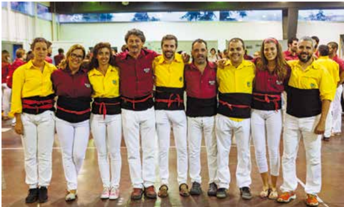
Castellers de la Colla castellera de Santpedor (de groc) i dels Castellers de Castellar - Capgirats - (de bordeus).

Els de Santpedor i els de Castellar van oferir l'exhibició dissabte a la tarda