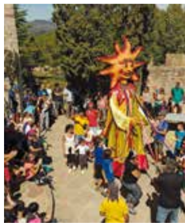
Amics del Puig de la Creu