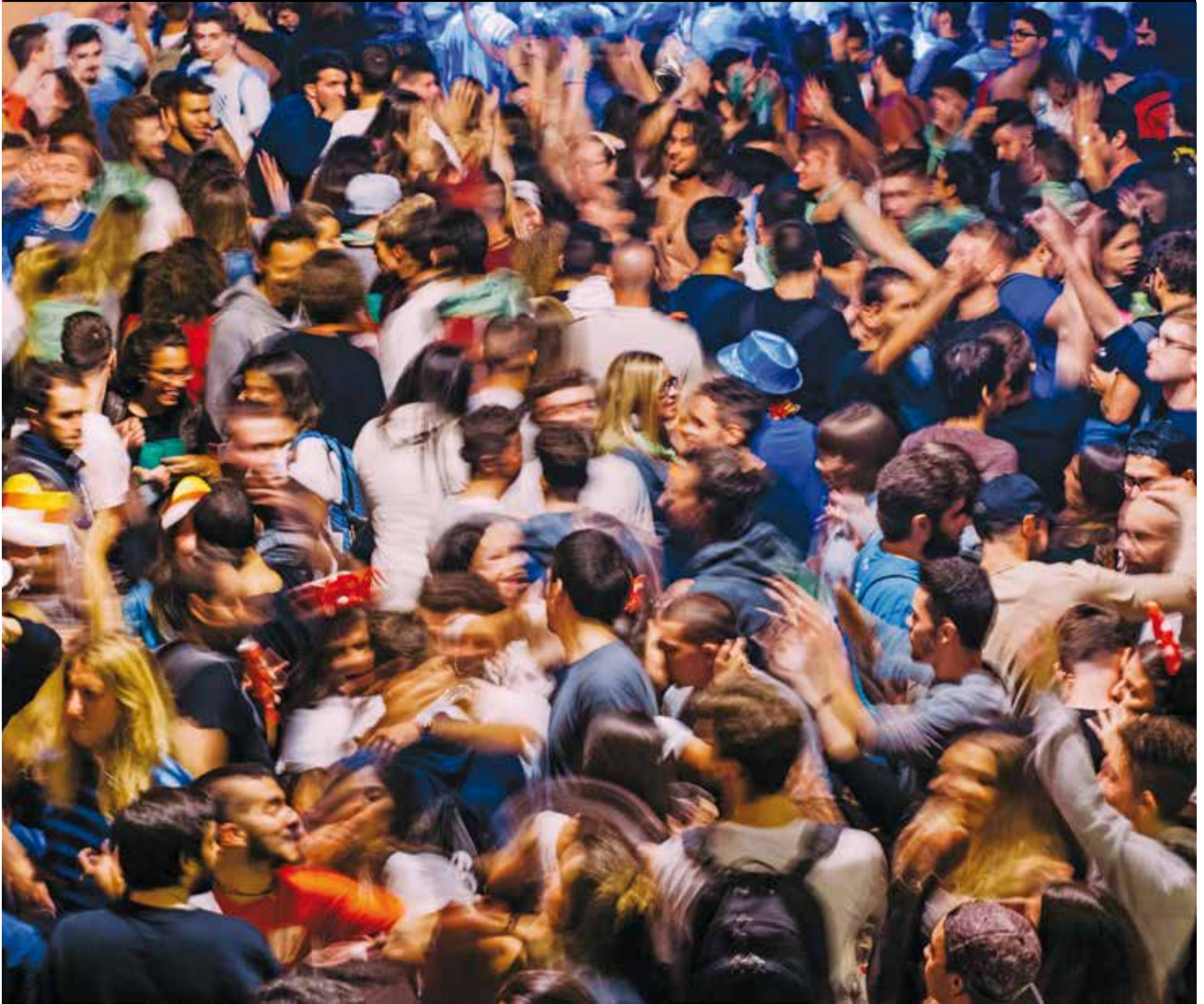
FESTA MAJOR | ESPECIAL DE 16 PÀGINES Castellar del Vallès ha viscut enguany una festa molt participativa. En la imatge, un moment del Correlokals al carrer Colom.