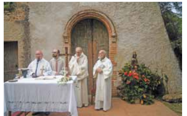
Litúrgia a la Festa de les Marededéus trobades, a l'ermita de les Arenes.

Els Amics de les Arenes van repartir, com ja és costum, un recordatori amb els Goig perquè tothom pogués seguir les estrofes. Cap a quarts d'una es va iniciar una cantada d'havaneres amb el grup Port Vell, que va finalitzar a les 14 hores. + || M. A.