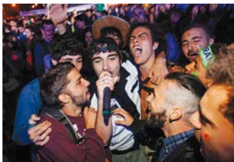
El cantant de 'Me fritos and the gimme cheetos' enmig del públic.

Paral·lelament a la qüestió musical, les Vilabarrakes castellarenques es caracteritzen per l'ambientació que fa cada col·lectiu participant. Aquest any, els de l'ETC anaven de Harry Potter en el seu "Esbartum Leviosa", Zona Rate de presoners amb la seva barraca "Orange is the new Rate", La Kantera s'havien inspirat el l'Oktoberfest per fer el seu "Septemberfest", Sense Nom anaven fluorescents, les Waikiki de bombers i la Colla Castellera tenia una ambientació medieval. La nit de dilluns es van repartir ja els tradicionals premis a la millor ambientació i a la millor disfressa, que van ser per La Kantera i l'Esbart, respectivament. +