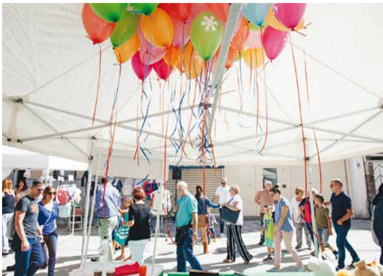
Els visitants de l'Street Market & Gothic Tolrà passant davant de la parada de Kids & Us.

Són les que van presents a la fira Street Market & Gothic Tolrà