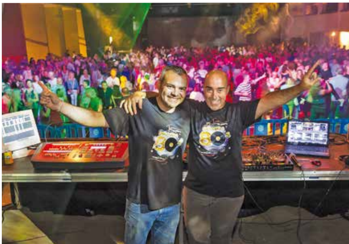
La festa dels Amics dels 80's i 90's va aplegar gent vinguda de fora de Castellar.

L'esperit general de la festa és que "hi va haver molt bon ambient i hi ha ganes de repetir un altre any" . Els assistents a la festa dels 80's i 90's no es circumscriuen a Castellar i enguany ha vingut