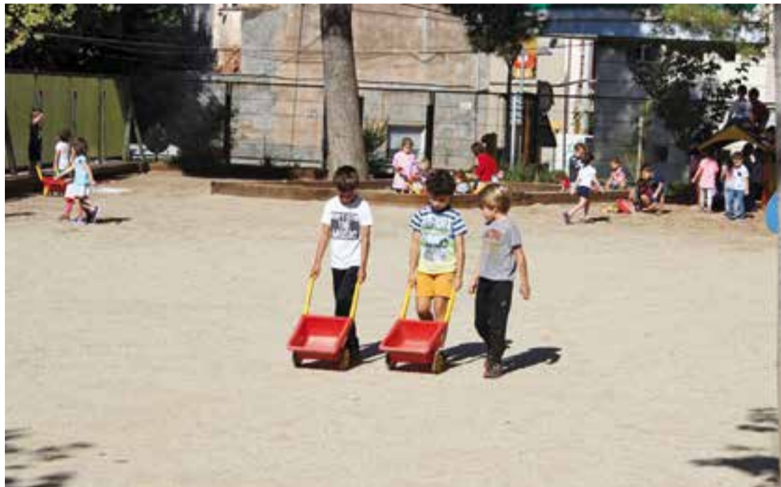
Alumnes de l'escola Emili Carles-Tolrà a l'hora del pati.

En aquest sentit, les escoles bressol municipals, gestionades per l'empresa Suara Cooperativa, van iniciar dilluns de la setmana passada el nou