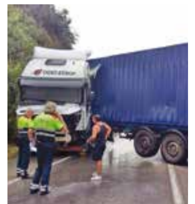
El darrer accident greu a la B-124 es va produir el passat mes d'agost.

En aquest sentit, Castellar en Comú apunta que, "de tot el reguitzell d'inversions, a data d'avui només s'ha dut a terme una petita actuació en un tram