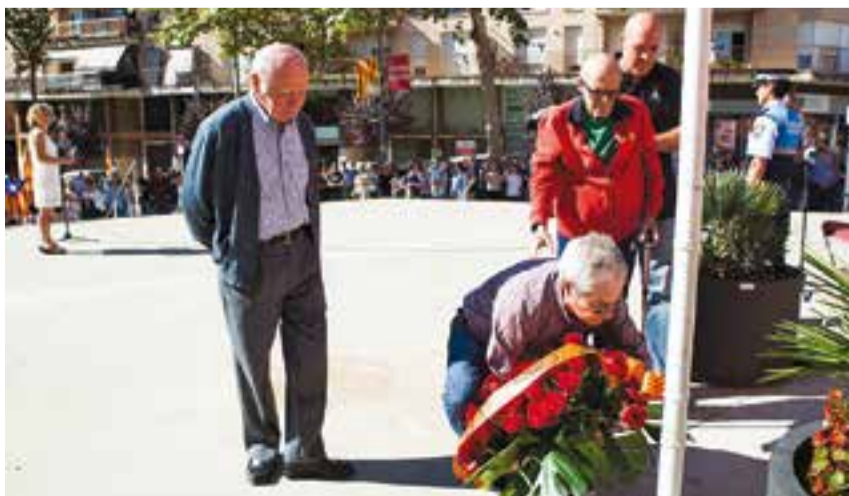
Els membres de la Societat Castellarenca fent l'ofrena floral.