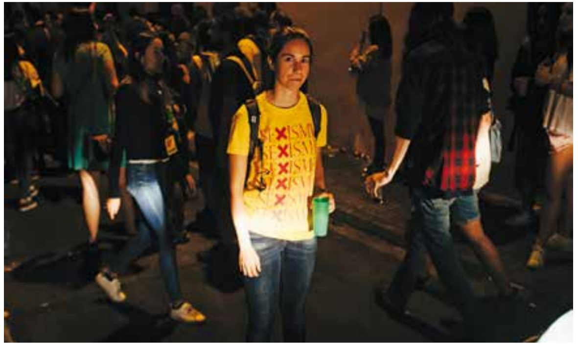
Cal Gorina ha fet campanya per Festa Major contra el sexisme. En la imatge una jove llueix una samarreta de la campanya.

Finalment, Cal Gorina i l'Assemblea Llibertària van elaborar per Festa Major la ruta autoguiada Dones i espai públic. Agressions masclistes als nostres carrers . El recorregut repassava diversos punts sensibles de la vila on els participants van trobar un codi QR que els va enllaçar amb un àudio en què s'explicava i es convidava l'oient a reflexionar sobre algunes situacions d'abús i agressió sexista.