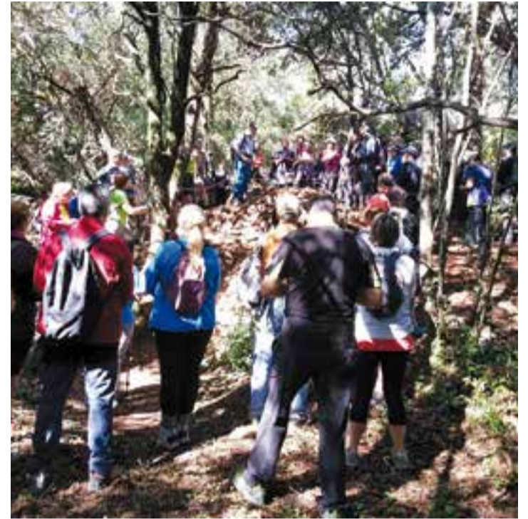
La sortida va servir també per conèixer elements de patrimoni rural.