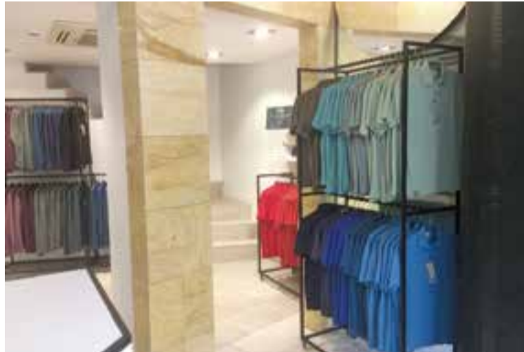
Interior de la nova botiga de Batech al carrer Provença 203 de Barcelona.