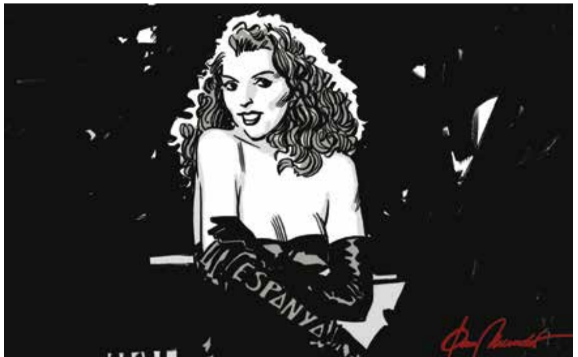
© Put the blame on mame. || JOAN MUNDET

"Aquest estiu han augmentat els desitjos i els plans per sortir d'Espanya. Són coses de les vacances... O no."