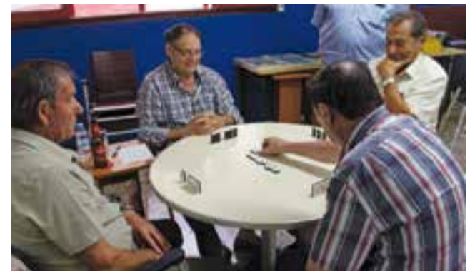
Diverses imatges de les activitats esportives que s'han dut a terme durant la passada Festa Major. || L'ACTUAL

20 d'octubre: Festa i sopar de celebració