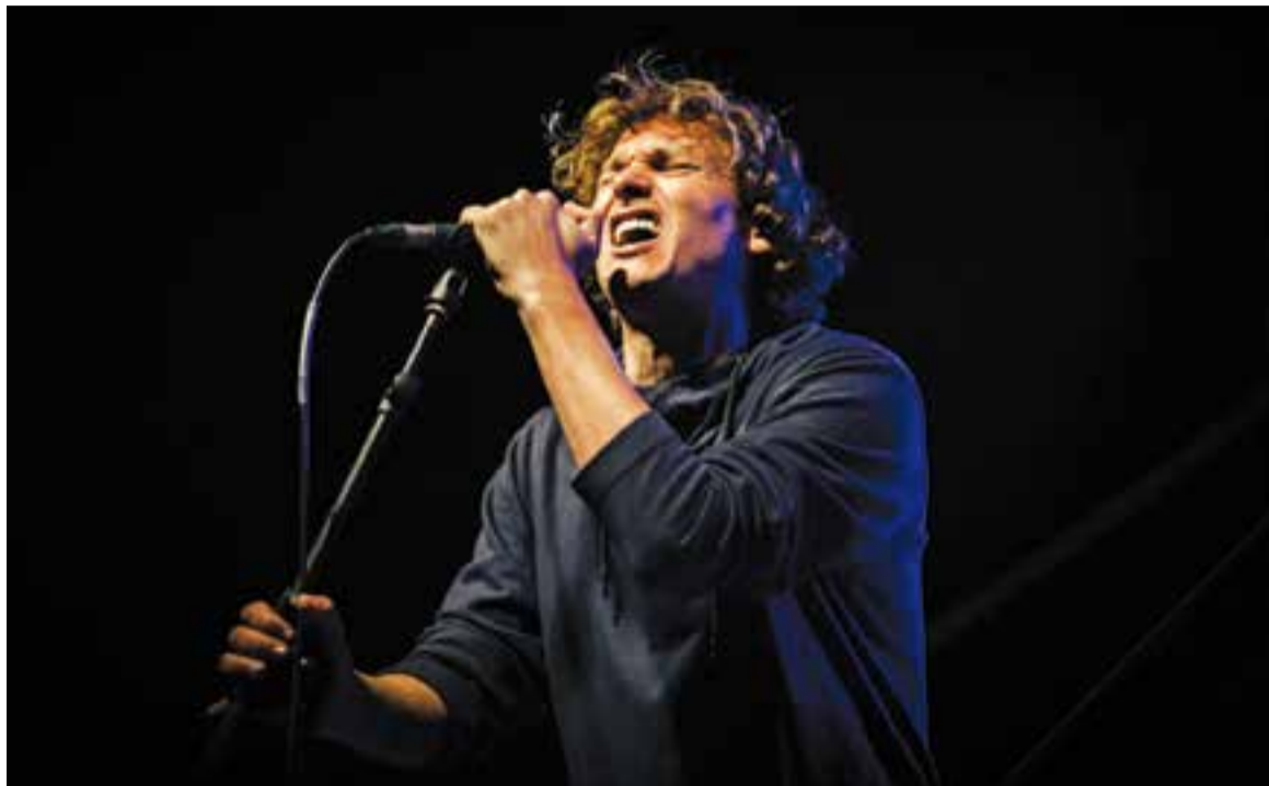
L'estil intimista del cantautor va captivar el públic de la plaça d'El Mirador.

Mirabet arrenca amb veu trencada, sembla que fregui l'afonia i ell s'excusa "perquè ahir vam tocar a Olot i vam passar molt fred", i que