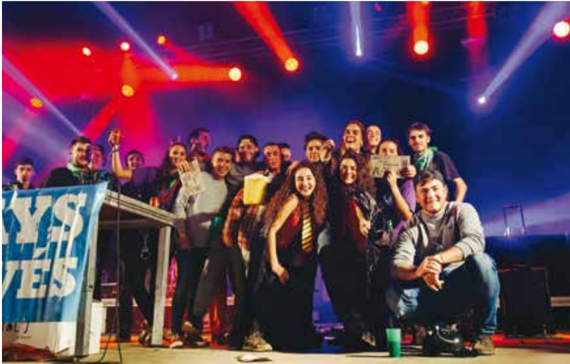
La Kantera i l'ETC recollint els premis a la millor ambientació i disfressa, respectivament. || Q. PASCUAL

L'entitat juvenil ha estrenat un escenari cobert de grans dimensions i un equip de so més potent