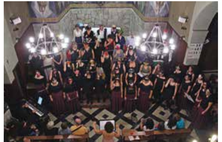
Les corals Musicorum a l'església de Sant Feliu, dissabte passat.