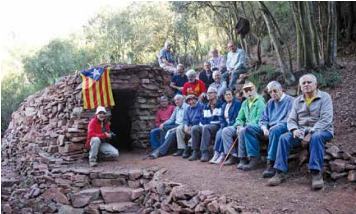
Foto de família del Grup de Recerca de la Pedra Seca del CEC i altres col·laboradors que recuperen les barraques.

El Grup de Recerca de la Pedra Seca del CEC va inaugurar, dimarts 17, la construcció de pedra