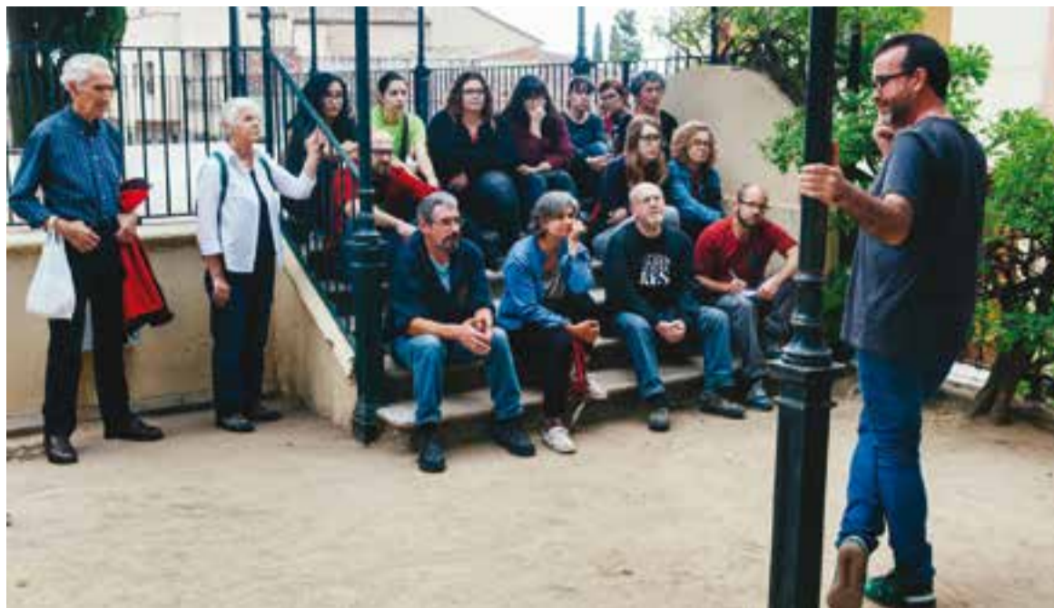
Un moment de la visita als jardins del Palau Tolrà.

La ruta va continuar fins al passeig i es va dirigir cap a la Biblioteca, que porta el nom de qui fou alcalde des del 1931 fins al 1939, el republicà Antoni Tort. A Castellar es va constituir un Comitè Català de Milícies Antifeixistes que, juntament amb grups anarcosindicalistes que no eren de la vila,