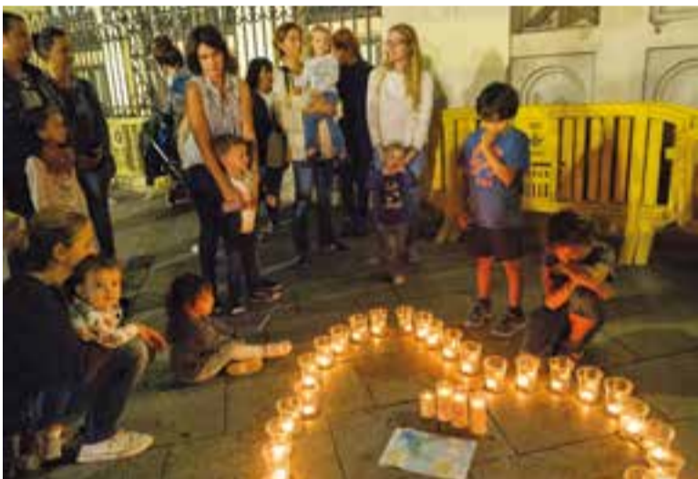
Encesa d'espelmes el 15 d'octubre a Sabadell, el primer acte d'ANHEL.

La nova entitat vol difondre el dol a partir de testimonis de mares i pares que han patit una pèrdua, no aconsegueixen un embaràs o tenen un fill/a prematur. Pretén organitzar xerrades, conferències i formacions, tant per a famílies com per a professionals, contactar amb altres professionals i persones creant una xarxa de suport interdisciplinari i proporcionar pautes útils per a l'entorn de les famílies. Les famílies es poden associar de forma gratuïta i col·laborar amb l'entitat. Per això, ha d'accedir a la fitxa que pot trobar a www.anhelvalles.org , omplir-la i enviar-la al correu anhel.valles@gmail.com ✦