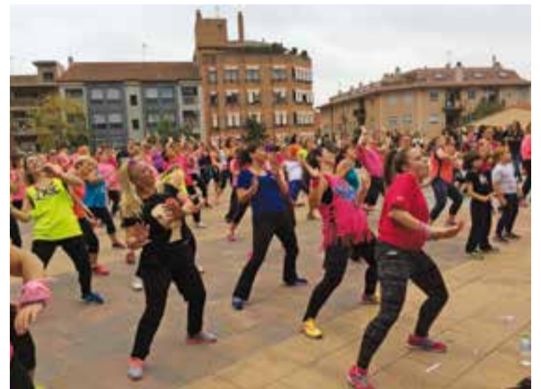
Diferents assistents al master class de fa dos anys.

Es vendran ulleres i polseres solidàries