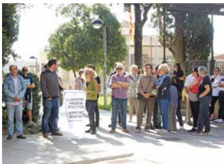
Concentració del dimarts al migdia, davant de l'Ajuntament.

municipals repartits per la vila. També el propi consistori de Castellar del Vallès va fer públic aquest dimarts una declaració institucional per expressar "el seu rebuig frontal a les detencions de Jordi Cuixart i Jordi Sánchez". A continuació, es reproduïx la declaració: "És absolutament injustificable que els presidents d'Òmnium Cultural i de l'Assemblea Nacional Catalana estiguin en presó preventiva per haver convocat una concentració pacífica el passat 20 de setembre. Creiem que és un despropòsit que s'acusi d'un delictes de sedició els responsables de mobilitzacions cíviques i sense