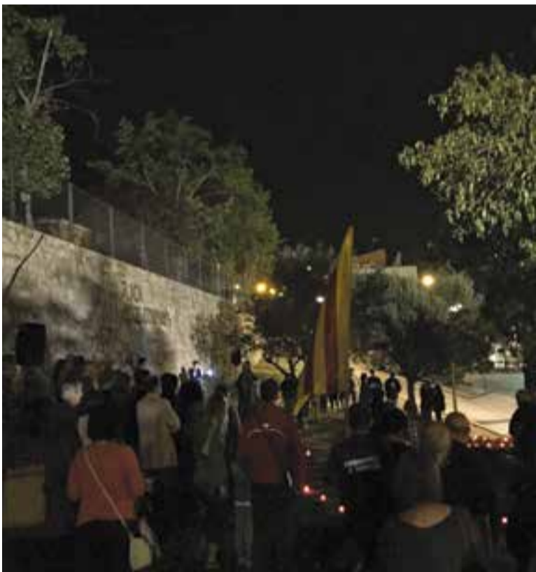
L'homenatge a Lluís Companys va concentrar unes 100 persones.