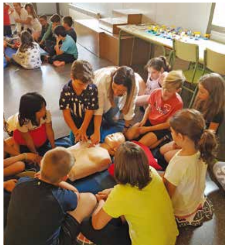
Alumnes del Mestre Pla practicant una reanimació.

La jornada va comptar amb la col·laboració de l'empresa Sistema d'Emergències Mèdiques de Catalunya i l'empresa d'ambulàncies Falck SL. Els participants que col·laboraran a l'acte seran assistencials sanitaris del SEM, de l'empresa Falck i de la Corporació Sanitària Parc Taulí. ✦