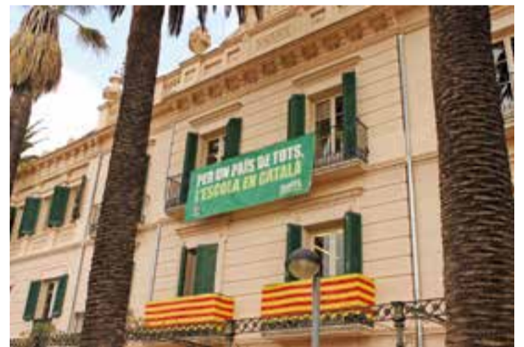
La pancarta de Somescola.cat es va penjar dilluns.

En l'àmbit català, la Junta central de directors de centres públics de Catalunya va publicar un comunicat en què condemnaven les declaracions d'Alfonso Guerra i José Bono, que havien acusat el sistema educatiu de Catalunya d'adoctrinar els nens contra Espanya. Des del sindicat US-TEC-STE consideren que les acusacions d'adoctrinament són un mecanisme de propaganda per a intervenir l'educació amb el 155. +