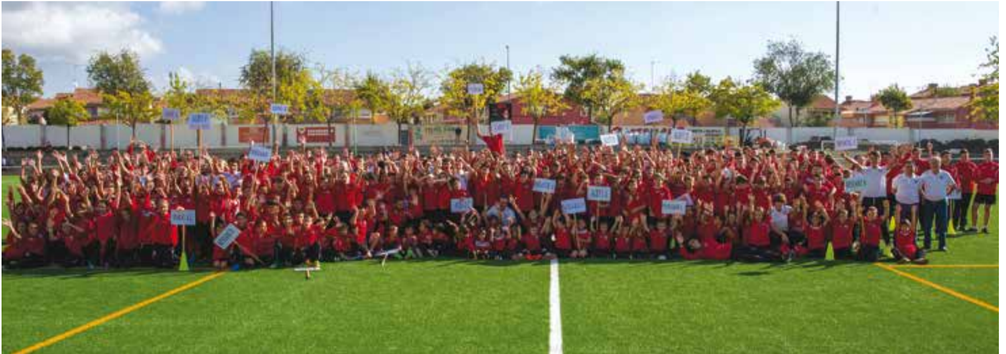
Totes les categories de la UE Castellar van posar per L'Actual en el dia de la presentació oficial de la temporada 2017-18.

El club va presentar els equips de la base, abans de l'empat sense gols de l'amateur enfront del CE Sabadell B