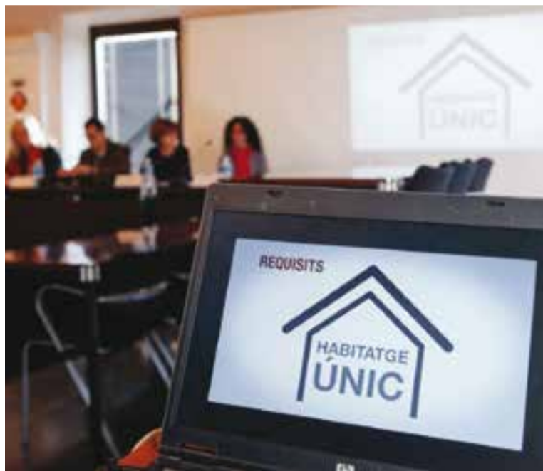
Presentació del SIDH a Castellar el setembre passat.

posar en marxa aquest servei a Castellar del Vallès el setembre de 2016, amb la col·laboració de l'Ajuntament, l'Agència de l'Habitatge de Catalunya i el Col·legi d'Advocats de Sabadell. A la vila, es presta a la Regidoria de Salut, Serveis Socials i Habitatge (c. Portugal, 2), de dilluns a divendres