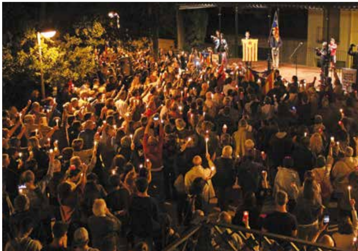
A dalt, concentració silenciosa amb espelmes en contra de l'empresonament dels 'Jordis' als Jardins del Palau Tolrà. A baix, assemblea del grup en defensa de la República dilluns passat al Calissó.

D'altra banda, Castellar en Comú va fer públic el mateix dilluns a la nit un comunicat per expressar la seva indignació i rebuig per l'entrada a presó de Sánchez i Cuixart. Des dels "comuns" volen fer arribar la seva solidaritat a les dues entitats sobiranistes, "una mostra de la força de la societat civil que lluita i resisteix per defensar la llibertat pacíficament" , apunten. Segons diu Castellar en Comú, aquesta acció judicial "ofèn la consciència democràtica de tot Catalunya, independentista o no" . +