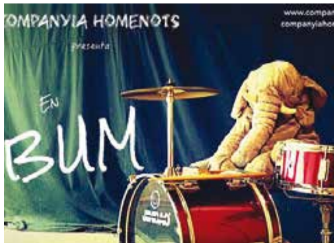
'Bum i el tresor pirat' de la companyia Homenots.

En BUM és el personatge que protagonitza l'Hora del Conte Infantil de dissabte, a les 11.30 hores, a la Biblioteca Antoni Tort. La companyia Homenots presentarà el conte "En Bum i el tresor pirata".