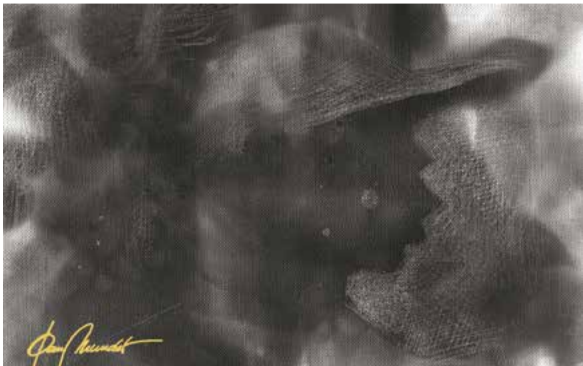
© Dibuix realitzat amb fum sobre cartro tela i retocs de punxó. || JOAN MUNDET

enginyosos dissenys i variacions que van aparèixer, no va aconseguir arrelar i, a més, els fumadors passius mantenien impotents el seu estatus negatiu.