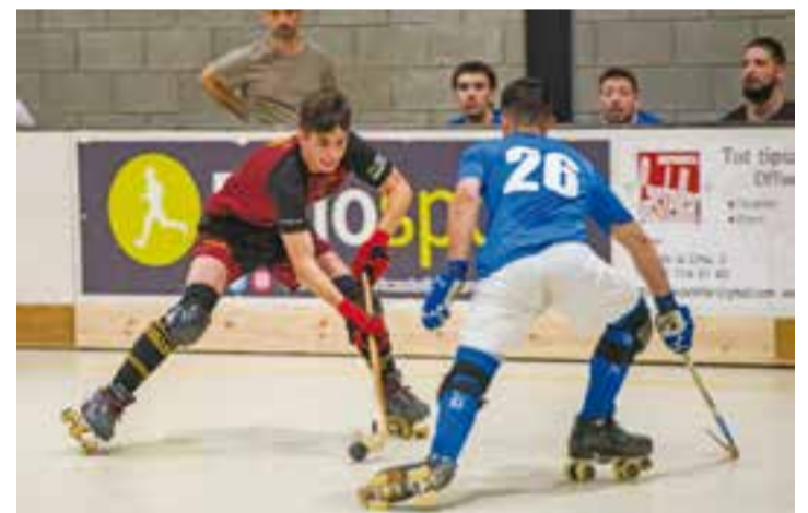
Imatge d'arxiu d'un partit al Dani Pedrosa de Castellà.

A la porteria, Sergio Ruiz tornava a ser decisiu, traient mans i peus per evitar l'empat dels locals i per poder arribar al descans amb un marcador favorable (0-1).