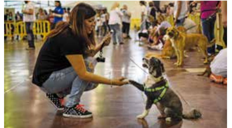
Una participant al concurs de mascotes obedients.