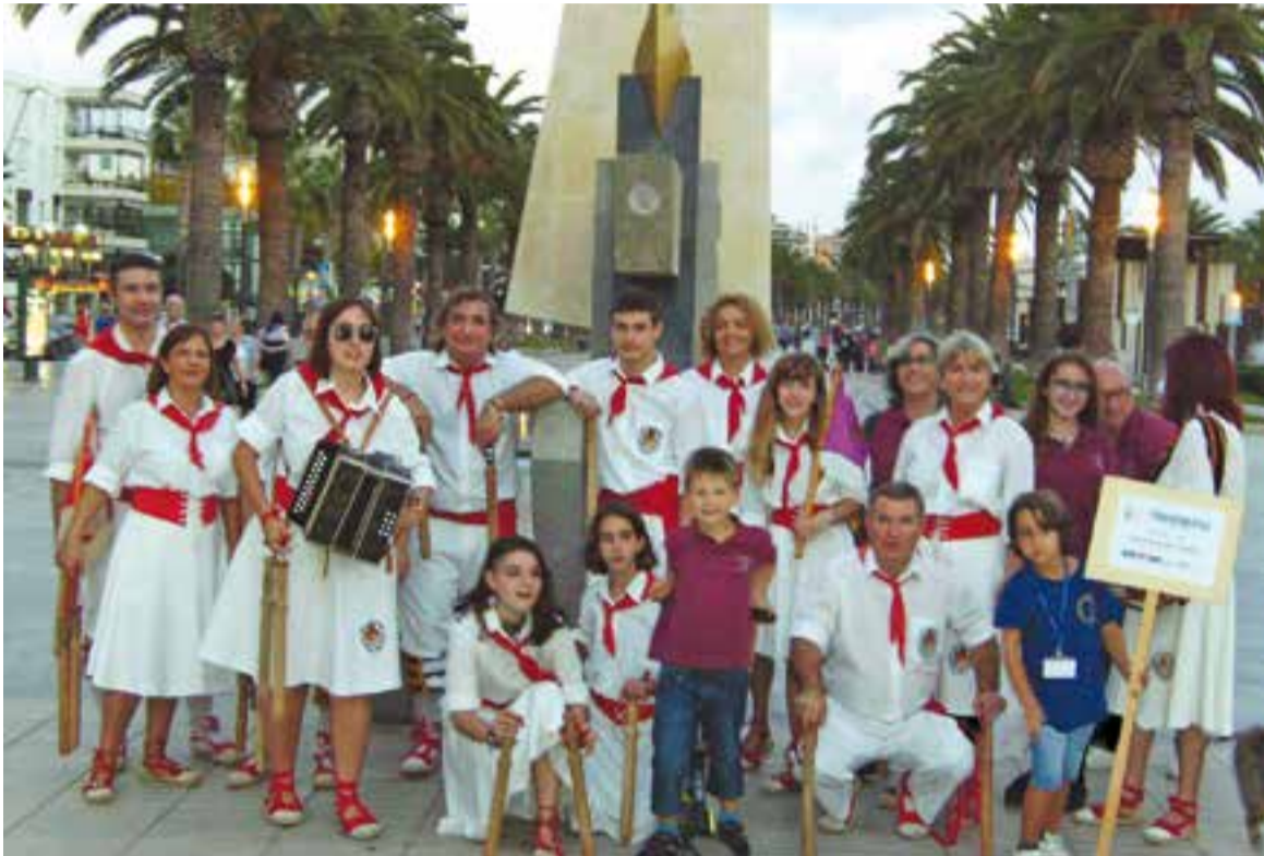
Foto de grup de la colla bastonera de Castellar del Vallès, a Salou, dissabte passat.

El Ball de Bastons de Castellar va participar a la V Trobada Bastonera de Salou, on van coincidir més de 200 balladors de tot Catalunya