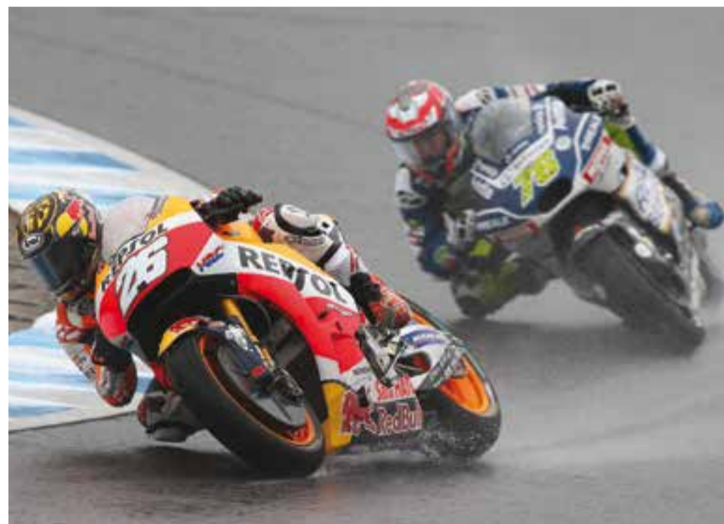
Dani Pedrosa pel davant de Loris Baz, en un moment de la cursa al Twin Ring de Motegi.

De nou sorgien els problemes de temperatura en el pneumàtic posterior de l'Honda i el