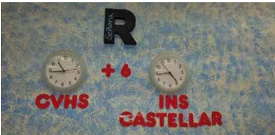
La primera cosa que aprenem és calcular la distància horària

Aquest projecte permet a l'alumnat prendre consciència de les dificultats de l'aprenentatge d'una llengua estrangera i esdevé tolerant amb els errors, propis i aliens, veient-los com un pas natural dins del procés de l'adquisició de la llengua.