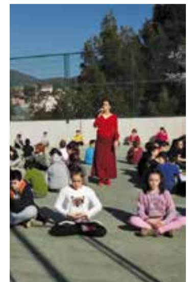
Cloenda de l'eix al pati de l'escola