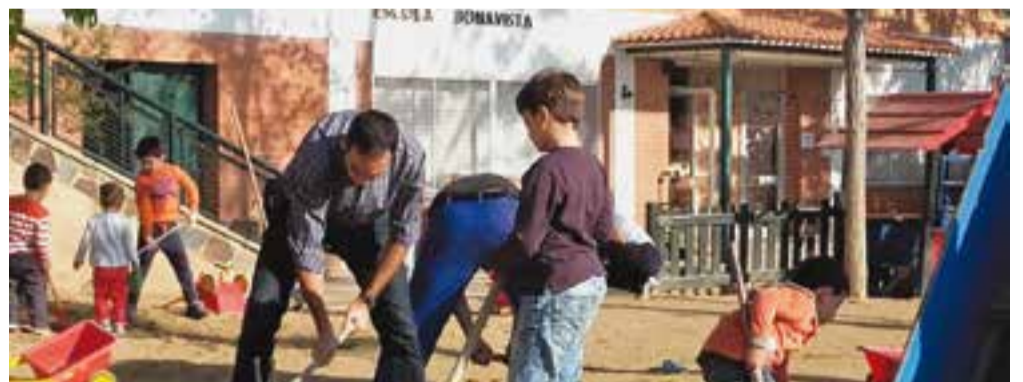
© Famílies i infants picant el terra del pati d'infantil.