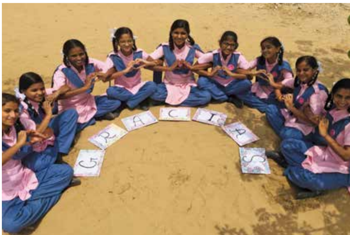
© Les alumnes de l'escola Fior di Loto ens donen les gràcies després de la Fira de Nadal.