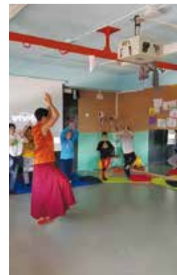
La Cristina imparteix una sessió de meditació amb nens i nenes de 3r