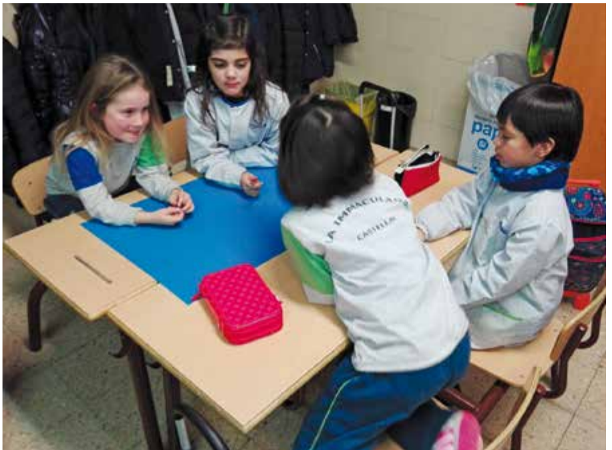
Els alumnes de primer i segon treballant cooperativament.

El treball cooperatiu ens permet aprendre a realitzar activitats conjuntes amb altres persones i ens ajuda a desenvolupar valors com l'empatia, el respecte, la convivència... Com a escola, creiem fermament en aquesta metodologia i podem comprovar que els alumnes gaudeixen molt més treballant en equip, d'una manera molt més activa, vivencial i significativa. Per tal de tancar aquest projecte, les idees i les creacions dels alumnes de Cicle Inicial, juntament amb les de la resta dels cursos, van ser exposades al gimnàs davant de tots els alumnes de l'escola el dia de la celebració. Finalment, els nens i les nenes de Cicle Inicial van penjar els seus treballs al passadís de l'escola per tal que tothom els pogués veure.