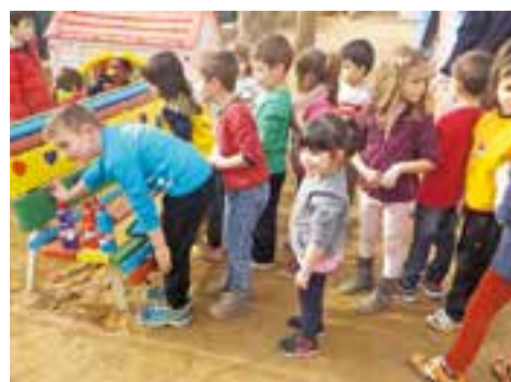
© Decorem el banc de l'amistat.