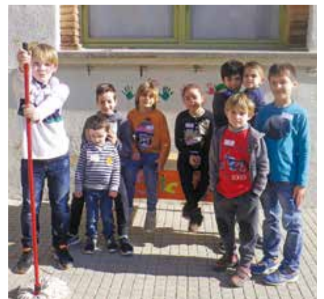
© Alumnat en una activitat de la cloenda