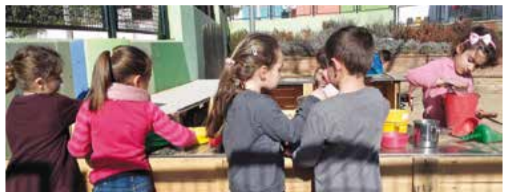
© Nenes i nens d'infantil fent ús de la cuineta.