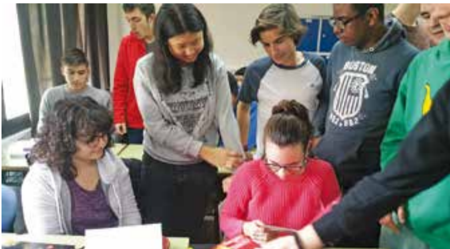
Hem rebut postals i caramels pel dia de St. Valentí