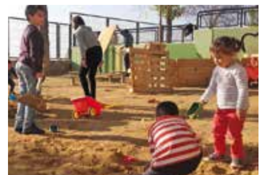
Infants tapant els forats.