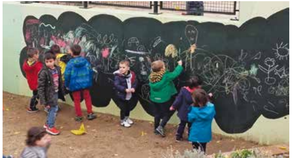
© Inauguració de l'espai de pissarra.

En aquest procés el paper dels docents pren rellevància com a observadors de noves possibilitats de joc al pati, que, tenint en compte les necessitats dels infants, anirem modificant. És per això que es tracta d'un projecte viu, canviant i dinàmic, a través del qual volem aconseguir un objectiu clau: satisfer la diversitat dels infants en els moments lúdics i d'aprenentatge de què gaudeixen en el pati.