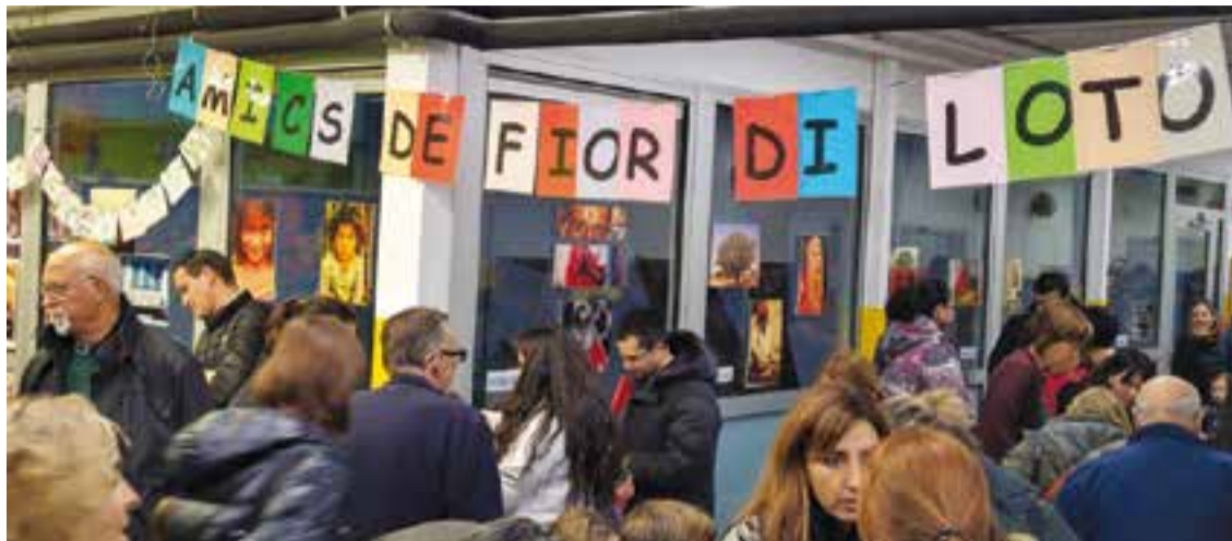
© Festa d'aquest any al vestibul de l'escola.

Si voleu més informació, podeu visitar el blog de Fior di Loto: http://santestevefiordiloto.blogspot.com.es/