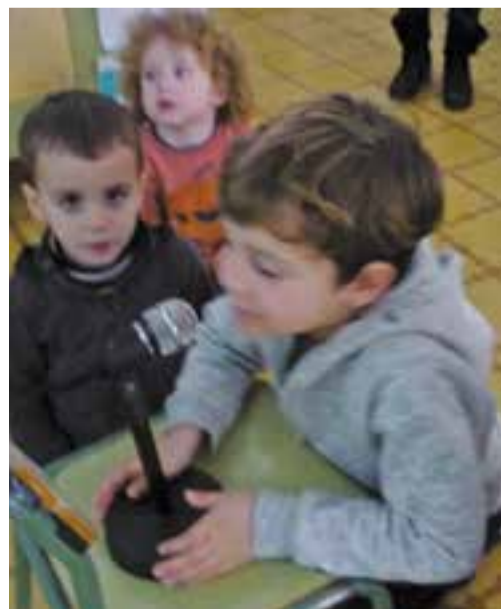
© Escalfem les veus per fer doblatge