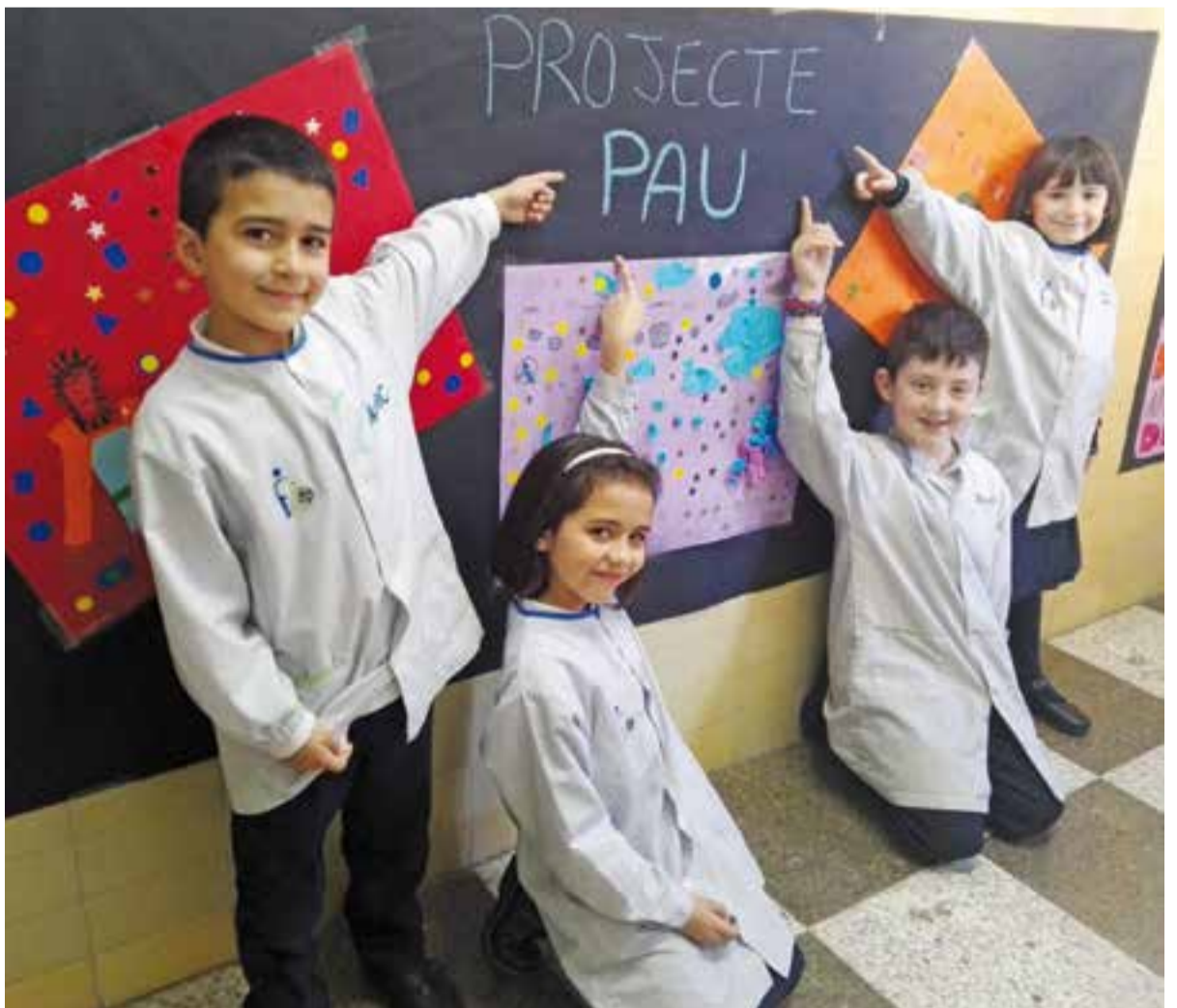
Els treballs exposats al passadís de l'escola.