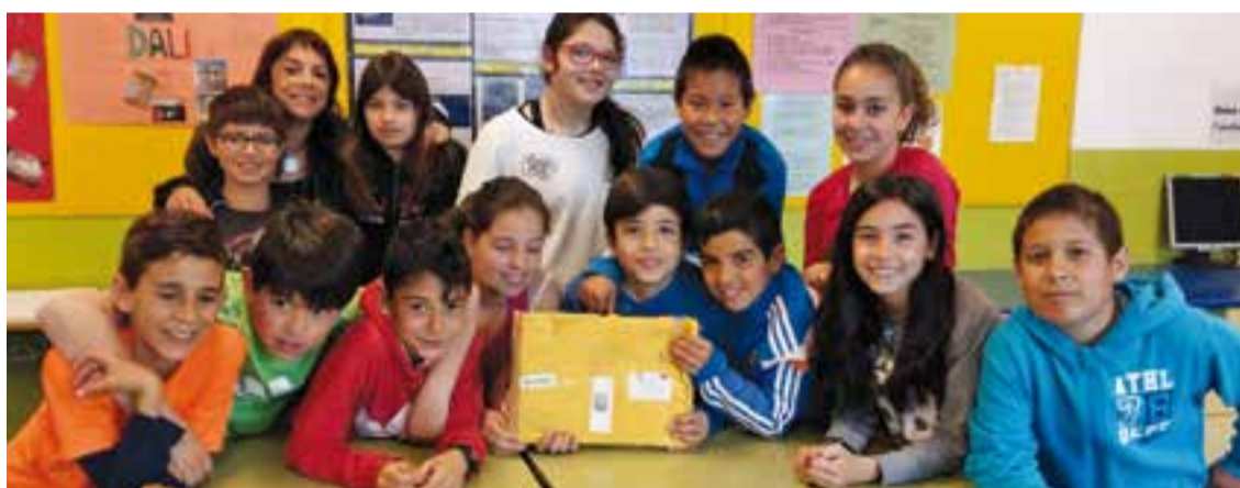
© Els alumnes de cinquè del curs passat reben les cartes de resposta de les nenes de l'Índia