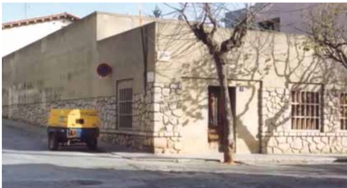
© L'escola al local del carrer Sala Boadella, 7

Els objectius inicials de l'escola eren els relacionats amb els valors i coneixements que es treballen a l'etapa escolar. Més endavant, se'n van establir d'altres com la felicitat. En definitiva, l'objectiu global era formar persones. Actualment, un dels projectes més importants de l'escola és el projecte iPads que, des de fa uns anys, ha implementat les tauletes a l'aula per a una educació més eficient i dinàmica. Altres projectes més recents són el Delivering Happiness o el projecte dels «Espais». Aquest últim, referit només a la primària, tracta de fer les classes actives; per exemple, si vols aprendre a sumar, pots fer-ho amb fruites o joguines, en lloc de fer-ho a classe. Així és més divertit per als alumnes. Finalment, l'escola considera que la seva gent és el seu potencial. El que diu com és un lloc és la gent que hi ha, i aquesta escola es considera una gran família que ara fa cinquanta anys.