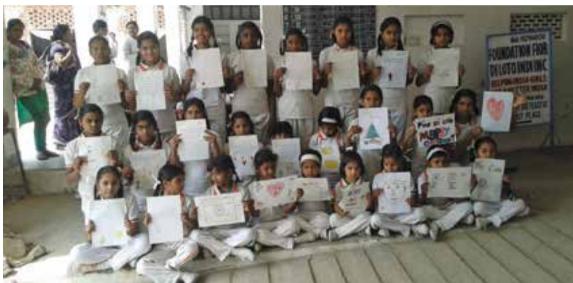
© Les nenes de l'escola Fior di Loto reben les nostres cartes en anglès el curs passat.