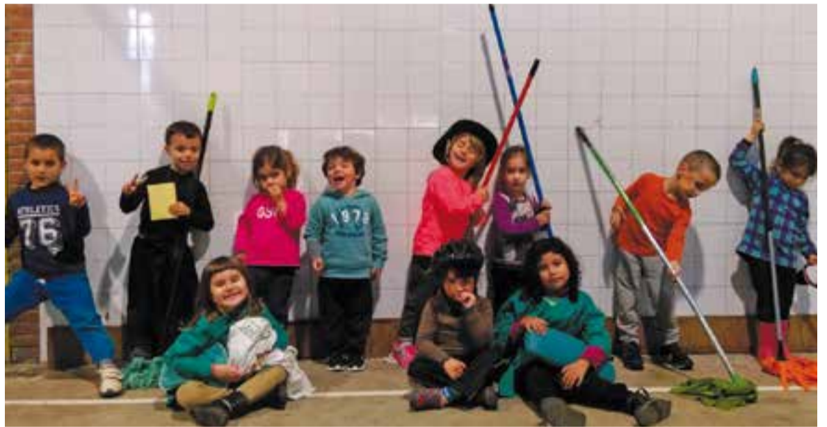
© Actor i actrius preparats per al rodatge