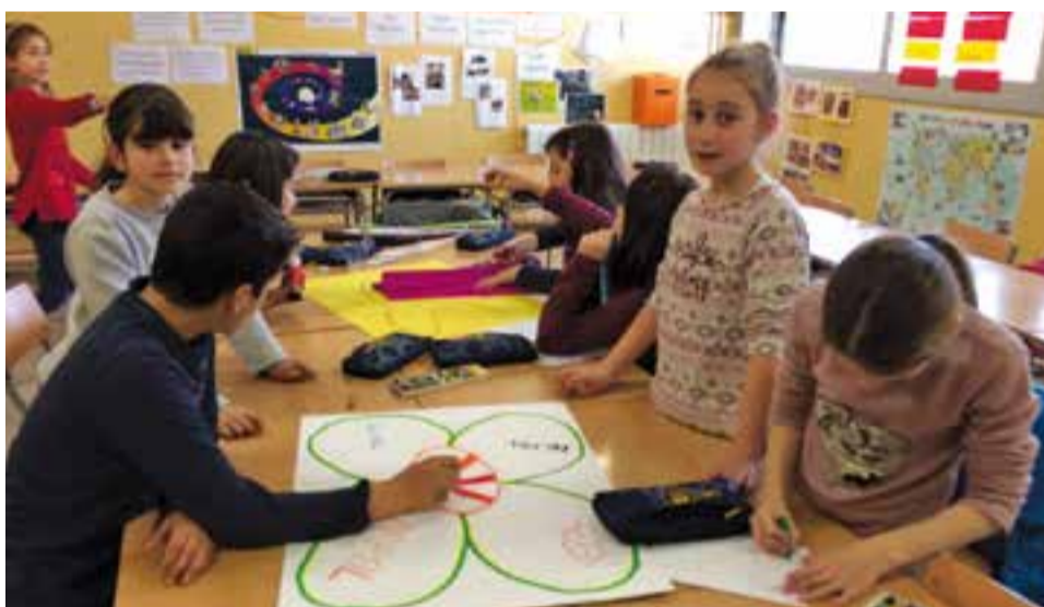
© Rangoli. Mandales decorades amb diferents materials