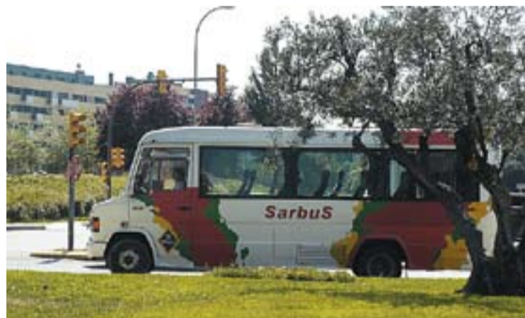
Un dels autobusos que realitza la línia C6.