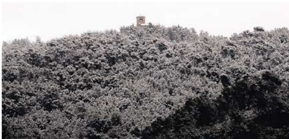
Una imatge de dimecres al matí amb el Puig de la Creu enfarinat.

El bombers van actuar a les urbanitzacions de l'Airesol i Sant Feliu