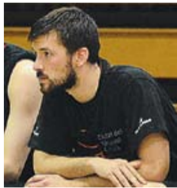
⊙ Woodward deixa el bàsquet. || J.M.

del sènior 'A' per afrontar els propers compromisos de lliga a Copa Catalunya. El primer serà aquest diumenge a la tarda contra el Salt al Pavelló Puigverd. El tècnic està treballant a marxes forçades per poder incorporar algun jugador en les pròximes setmanes. +