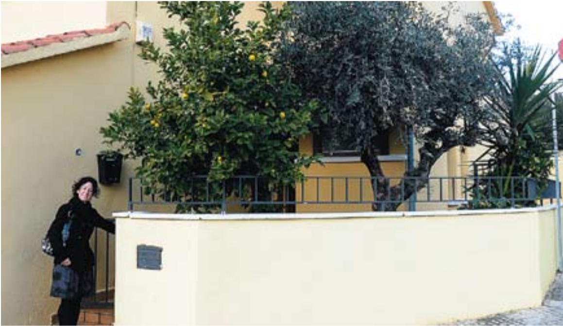
La gerent de la immobiliària QLM, Laura Varela, davant de la casa que se subhastarà.

L'habitatge sortirà a un preu de 279.500 euros, 120.000 menys que fa vuit mesos