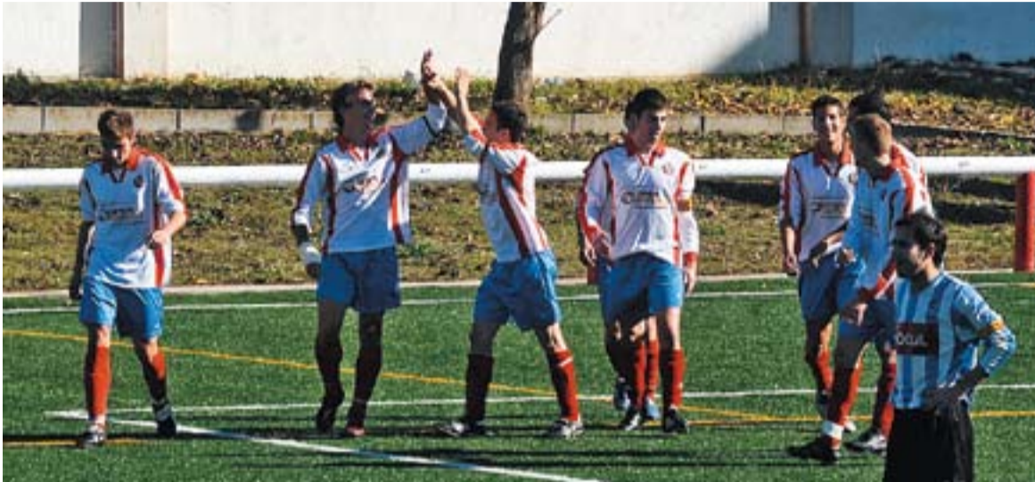
© Els jugadors castellarencs celebrant un dels gols que han marcat al Pepín Valls. || JOSEP GRAELLS