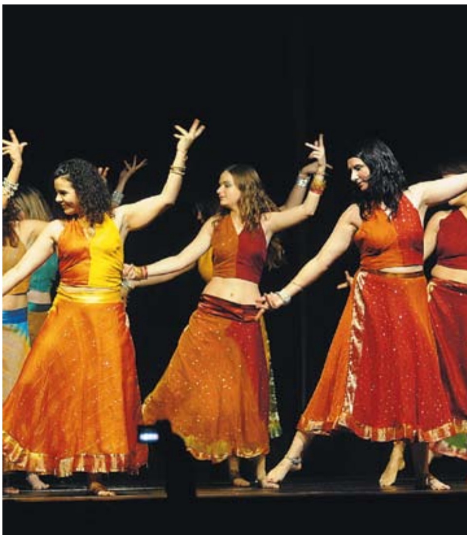
© Espectacle realitzat per l'Associació Catalana de Bollywood el passat dia 4. || JOSEP GRAELLS

A més de dansa, l'espectacularitat recau, també, en els vestits que es treuen a cada ball, portats expressament des de l'Índia. +