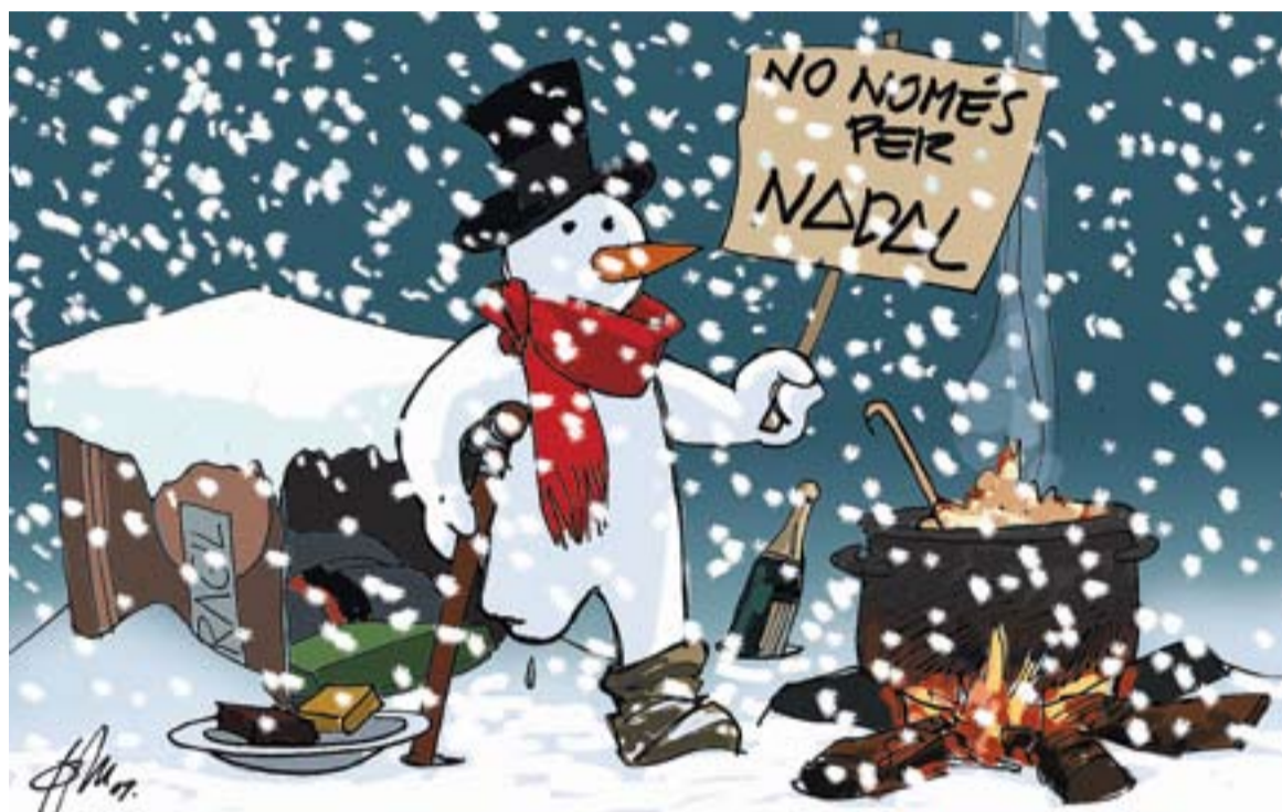
© Sempre es desfà. || JOAN MUNDET

Ser solidari no significa participar lleugerament en un esdeveniment mediàtic organitzat per una macroentitat pública que a més de tenir una finalitat lloable serveix indirectament perquè