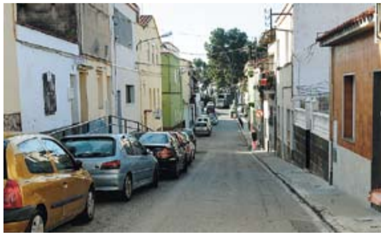
El carrer Sant Sebastià serà un dels carrers remodelats amb aquest fons

L'import total d'aquests 18 projectes, aprovat pel ministeri, ascendeix a 3,36 milions d'euros i inclou bàsicament actuacions a l'espai públic. Concretament, d'aquests 18 projectes aprovats, quatre estan destinats a la remodelació de voreres per un valor de 858.000 euros. La reforma del Mercat Vell perquè sigui un centre cívic ha obtingut una subvenció de 659.720 euros. Quatre projectes vinculats a la millora i conservació de les instal·lacions escolars del municipi han obtingut 505.000 euros, pel trasllat de les dependències de l'Àrea Social a l'Espai Tolrà s'ha rebut 401.880 euros, tres projectes relacionats amb la reposició de calçades compten amb un pressupost de 538.000 euros i tres projectes més per renovar places s'ha aconseguit 280.000 euros. L'últim d'aquests projectes, dedicat a l'urbanització de vials, ha obtingut una partida