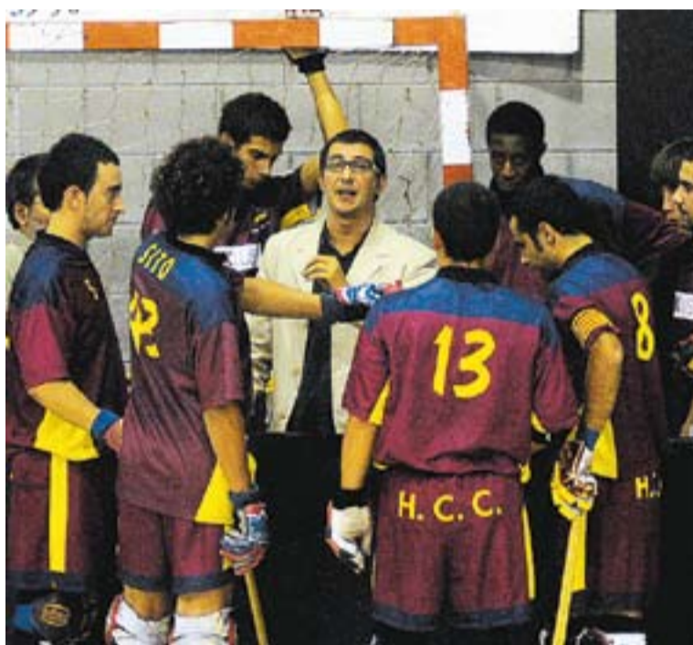
⊙ Els castellarencs es juguen seguir entre els primers en els propers partits. || J.G.

La visita del líder serà només el primer plat. Després d'un petit descans a la pista del Barberà -catorzè classificat- i una setmana de descans, arribarà el final d'etapa i de primera volta amb dos partits de categoria