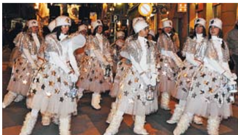
© Les alumnes de l'escola Dansa Parc. || JOSEP GRAELLS

regal a un dels bombers accidentats el passat juliol. Aquest fet i el canvi de recorregut va provocar desconcert entre el públic, que no entenien perquè les carrosses baixaven pel carrer Major, un dels llocs amb més assistents, sense els Reis. A més, va haver-hi un altre contratemps. L'embragament del tractor que traslladava la carrossa del rei Melcior es va cremar. De seguida, però, els bombers van remolcar la carrossa i la cavalcada va finalitzar a les portes de l'Espai Tolrà. +