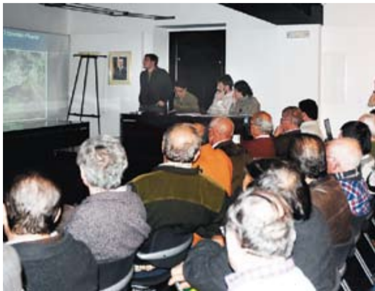
© La trobada va comptar amb l'assistència de nombrosos hortolans. || J.G.

Per tant, aprofitant la suspensió durant mig any de les auto-