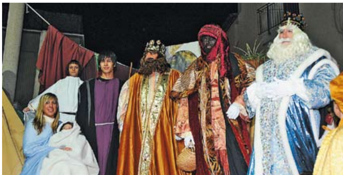
© Reis adorant el nen Jesús. || JOSEP GRAELLS

Els Reis Mags d'Orient van arribar a Castellar amb molt de fred i amb una novetat, el canvi d'itinerari de la cavalcada. Enguany, les carrosses de Melcior, Gaspar i Baltasar, decorades pel grup Il·lusió, van sortir de l'Espai Tolrà acompanyades de dues carrosses més, una de l'escola Dansa Parc i una altra de l'Ambaixador, que portava les cartes dels nens i nenes. La comitiva la completaven la banda de Majorettes que van amenitzar tot el recorregut amb els seus balls, els Amics de Sant Antoni Abat, l'Hípica Castellar i els camions d'empreses. Tot i les baixes temperatures, va ser molta la canalla que, acompanyada pels seus pares, van gaudir de la visita dels Reis Mags a la vila i dels 1.000 quilos de caramels que es van repartir. Com cada any, a la plaça Francesc Macià, els Reis van baixar de les seves carrosses per adorar el Nen Jesús del Pessebre Vivent representat pel Moviment de Colònies i Esplai. Després de rebre la clau de les cases de Castellar als jardins de l'Espai Tolrà, els Reis van continuar a peu fins al carrer Major, on van lliurar un