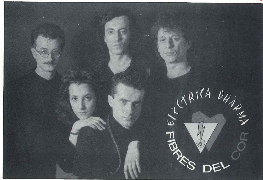
El conjunt Elèctrica Dharma oferirà un concert, dissabte 17 de març, a les 11 de la nit, a la Nau (de la plaça Major), amb motiu de la Setmana de la Joventut '90

Els grups que intervenen en la preparació d'aquesta setmana són: Grup Juvenil del Centre Excursionista de Castellar,