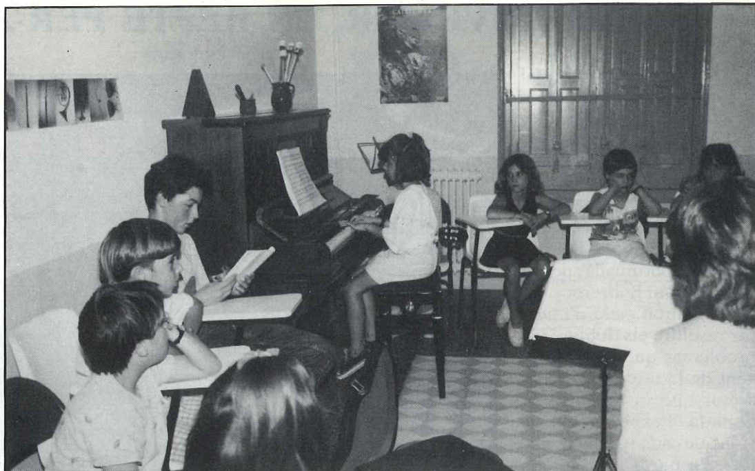
A l'Escola de Música s'intenta que els joves alumnes es prenguin la música amb seriositat i responsabilitat

«L'Escola admet alumnes a partir dels 6 anys d'edat. Es comença per un curs d'iniciació en què els alumnes es familiaritzen amb el món de la música a base d'audicions musicals, fent coneixença dels ritmes i dels instruments de percussió, aprenent a entonar i a cantar. A l'aprenentatge d'un instrument musical. Els alumnes que hi assisteixen tenen dues hores combinades de solfeig a la set-